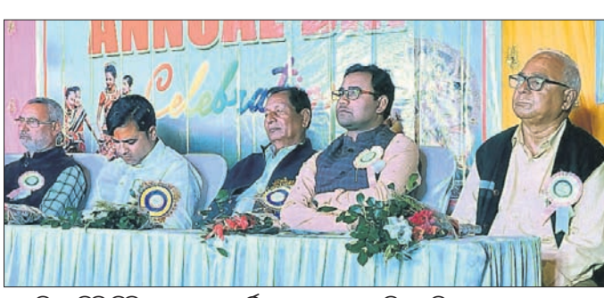
ଜାନକୀ ଇଂଲିଶ ମିଡିୟମ ସ୍କୁଲର ବାର୍ଷିକ ଉତ୍ସବରେ ଉପସ୍ଥିତ ଅତିଥି ।

ସୁବର୍ଣ୍ଣପୁର ଓ ଭଦ୍ରକରେ ୩୫.୨ ଡିଗ୍ରୀ ସେଲସିୟସ୍ ତାପମାତ୍ରା ରେକର୍ଡ କରାଯାଇଛି । ଅନ୍ୟପକ୍ଷେ ସର୍ବନିମ୍ନ ତାପମାତ୍ରା ରାଉରକେଲାରେ ୧୩.୨ ଡିଗ୍ରୀ ସେଲସିୟସ୍ ରେକର୍ଡ କରାଯାଇଛି । ଆସନ୍ତା ୨ଦିନ ପର୍ଯ୍ୟନ୍ତ ରାତି ତାପମାତ୍ରାରେ ବିଶେଷ ପରିବର୍ତ୍ତନ ହେବନାହିଁ । ତେବେ ପ୍ରାୟତଃ ୩ଦିନରେ ରାତି ତାପମାତ୍ରା ୨୫ ଓ ୩୫ ଡିଗ୍ରୀ ସେଲସିୟସ୍ ପର୍ଯ୍ୟନ୍ତ ହ୍ରାସ ଓ ଅନୁଗୋଳରେ ୩୫.୬, ସମ୍ବଲପୁରରେ ୩୫.୩, ଭବାନୀପାଟଣାରେ ୩୫.୨,