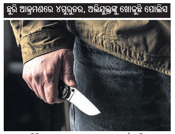
ଛୁରି ଆକ୍ରମଣରେ ଝଗୁରୁତର, ଅଭିଯୁକ୍ତଙ୍କୁ ଖୋଜୁଛି ପୋଲିସ୍

ବେଙ୍ଗାଳୁରୁ, ୧୧/୨ ଜେଲ ଫେରନ୍ତା ଜଣେ ବୁଦ୍ଧିଜୀବୀ ଅପରାଧୀ ଛୁରିରେ ମରଣାନ୍ତକ ଆକ୍ରମଣ କରି ଏକାଧିକ ବ୍ୟକ୍ତିଙ୍କୁ ହତ୍ୟା କରିଥିବା ଅପରାଧୀଙ୍କୁ ଜେଲରେ ରଖିବାକୁ ନିର୍ଦ୍ଦେଶ ଦିଆଯାଇଛି।