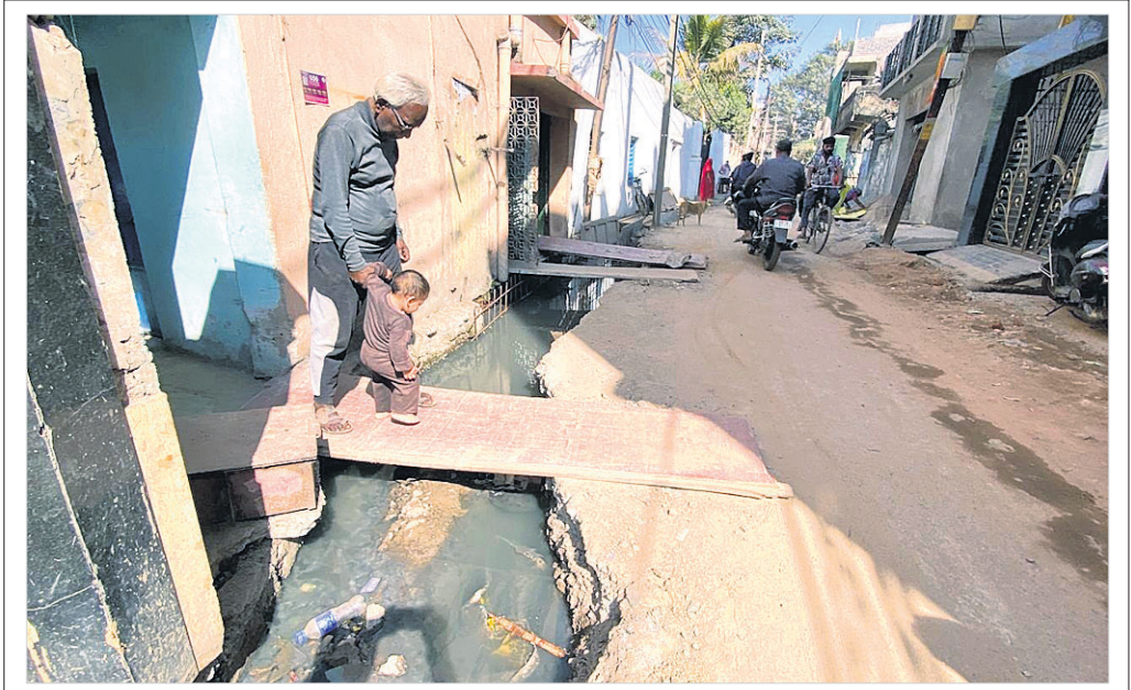
ରାଉରକେଲା ଆରବ୍ ସିଏମ୍ ଆଧୀନ ବିଶ୍ୱାତାହାର ଗଳିରେ ଗତ ୩ ମାସ ହେଲା ଡ୍ରବ୍ ଖୋଳାଯାଇଥିବା ଯୋଗୁ ଗଳି ନିର୍ମାଣ କମିଟି ପକ୍ଷରୁ ପାଇଁ ସମସ୍ୟା ଭୋଗୁଛନ୍ତି।