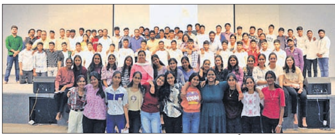
ଦଶମ ଶ୍ରେଣୀ ଛାତ୍ରାଛାତ୍ରୀଙ୍କ ସହ ବିକାଶ କର୍ତ୍ତୃପକ୍ଷ ।

କଳାହାଣ୍ଡି ଜିଲାର ଭବାନୀପାଟଣା ବିକାଶ ଆବିଷ୍କାର ବିଦ୍ୟାଳୟର ଉଚ୍ଚମଧ୍ୟମ ଶିକ୍ଷା ବିଭାଗରେ ଦଶମ ଶ୍ରେଣୀ ଛାତ୍ରାଛାତ୍ରୀଙ୍କ ଆଶୀର୍ବଚନ ସମାରୋହ ମଙ୍ଗଳବାର ଅନୁଷ୍ଠିତ ହୋଇଥିଲା ।