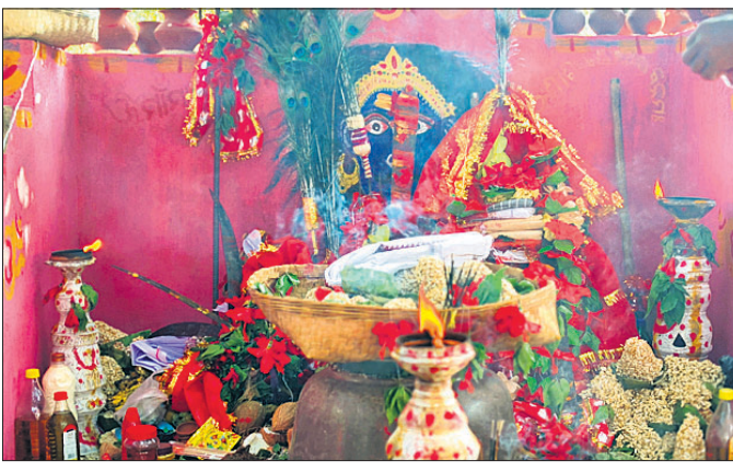
ଦେବୀଙ୍କୁ ଭୋଗ ଅର୍ପଣ କରାଯାଇଛି ।

ବଙ୍ଗଳାପଡ଼ା ଜିଲାର ଥୁଆମୂଳ ରାମପୁର ବ୍ଲକ୍‌ର ଶୁଣ୍ଠିଗ୍ରାମ ପଞ୍ଚାୟତରାଜର ଅନ୍ତର୍ଗତ ଗୋବିନ୍ଦପୁରା ବଙ୍ଗଳା ପଡ଼ାଠାରେ ମାଘ ଝାମୁଆତ୍ରା ସମ୍ପନ୍ନ ହୋଇଥିଲା ।