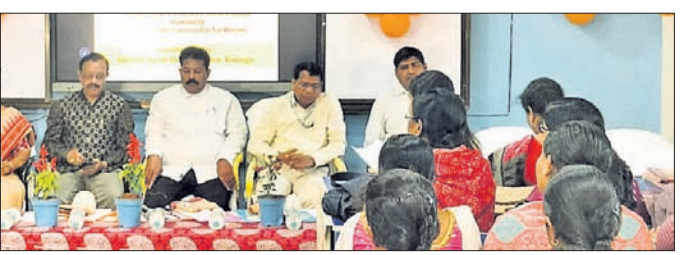
ଶିବିରରେ ଯୋଗ ଦେଇଥିବା ଅତିଥି ।

ଏକ ବୈଠକ ଅନୁଷ୍ଠିତ ହୋଇଥିଲା । କିପରି ନିଜର ଭିତ୍ତିମାନଙ୍କୁ ରକ୍ଷାକରିବେ ସେନେ ଏହି ବୈଠକରେ ଆଲୋଚନା ହୋଇଥିଲା । ସରକାର ଏ ଦିଗରେ କୌଣସି ପଦକ୍ଷେପ ନ ନେଲେ ଆଗାମୀ ଦିନରେ ଲୋକସିଂହା ଆନ୍ଦୋଳନ କରିବାକୁ ଚେତାବନୀ ଦେଇଛନ୍ତି । ବୈଠକରେ ଅର୍ଜୁନ ନେଇ ଉଚ୍ଚକ୍ଷମ ଅତିରିକ୍ତ ଚଳାମାଳ ଗାଁର ପ୍ରତିପତି ନିକଟ ଏକ ଆୟତ୍ତବିଳାସରେ