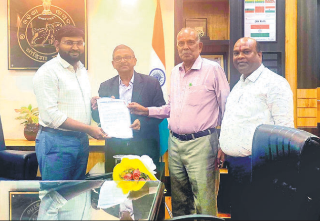
ପ୍ରତିନିଧି ମଞ୍ଜୁରୀ ସହଯୋଗରେ ଜିଲ୍ଲାପାଳଙ୍କୁ ଦାବିପତ୍ର ପ୍ରଦାନ କରୁଛନ୍ତି।

ଜିଲ୍ଲାପାଳଙ୍କ ପକ୍ଷରୁ ପାଣି ଆବଣ୍ଟନ କରିବା କରୁଛି ବୋଲି ଏହି ଦାବିପତ୍ରରେ ଅନୁରୋଧ କରାଯାଇଛି। ସୁନ୍ଦରଗଡ଼ ଜିଲ୍ଲାରେ ପରିସରରେ ବହୁତ ପ୍ରକଳ୍ପ ଗୁଡ଼ିକ ଚଳୁଛି।