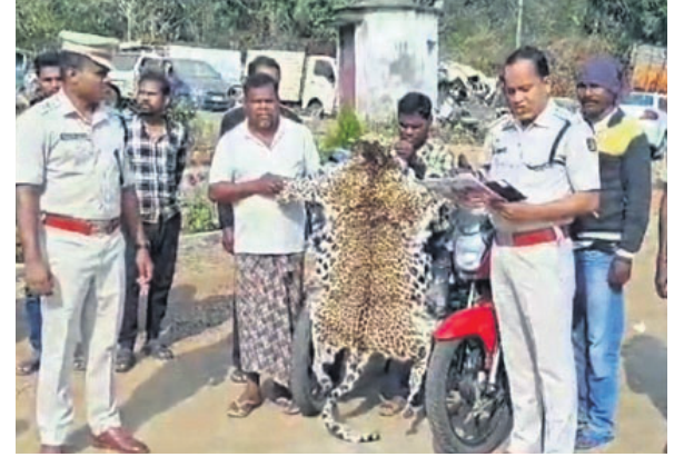
ଗିରଫ ଅଭିଯୁକ୍ତଙ୍କ ସହ ଜବତ କଲରାପତରିଆ ବାସନ୍ତୀ

ଭିଲ୍ ରେଲେ ଧରିଲା ପୋଲିସ୍ ବେବରଡ଼, ୧୧/୨ (ଶଶାଙ୍କ ଶେଖର ଝାଙ୍କର)