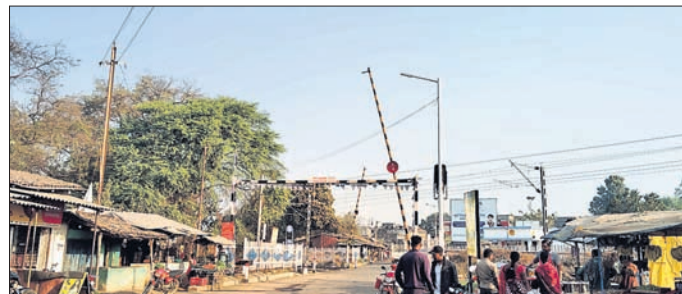
ହରିଶଙ୍କର ରୋଡ଼ ରେଳ ଫାଟକ ଠାରେ ଥିବା ଅଟଳ ଷ୍ଟିକ୍ ଲାଇଟ । ଲାଠୋର, ୧୧/୨ (ଭୁବନେଶ୍ୱର ବାରିକ)

ବଲାଙ୍ଗୀର ଜିଲ୍ଲା ହରିଶଙ୍କର ରୋଡ଼ ରେଳ ଫାଟକରେ ଲାଗିଥିବା ଷ୍ଟିକ୍ ଲାଇଟ ଖରାପ ହୋଇ ଜଳୁନାହିଁ । ଅଞ୍ଚଳବାସୀ ଏହାର ମରାମତି ପାଇଁ ଦାବି କରି ଆସୁଥିଲେ ମଧ୍ୟ କୌଣସି ସୁଫଳ ମିଳିନାହିଁ । ଫଳରେ ଜନସାଧାରଣ ନା ନା ସମସ୍ୟାର ସମ୍ମୁଖୀନ ହେଉଥିବା ଅଭିଯୋଗ ହେଉଛି । ରେଳ ଫାଟକର ଭଲ ଭାବରେ ଷ୍ଟିକ୍ ଲାଇଟ ଲାଗିଛି । ପ୍ରାୟ ୬ ମାସରୁ ନେବାକୁ ସାଧାରଣରେ ଦାବି ହେଉଛି ।