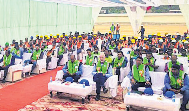
କାର୍ଯ୍ୟକ୍ରମରେ ସାମିଲ ହୋଇଥିବା କର୍ମଚାରୀ ଏବଂ ବ୍ୟବସାୟିକ ଅଂଶୀଦାର।

ଖଣି ପାଇଁ ଏକ ଉଚ୍ଚ ମାନଦଣ୍ଡ ସ୍ଥିରକରେ। ବେଦାନ୍ତ ଆଲୁମିନିୟମର ସୁରକ୍ଷା-ପ୍ରଥମ ସଂସ୍କୃତି ଉପରେ ଆଲୋଚନା କରାଯାଇଛି।