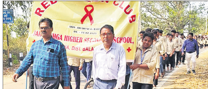
ଏଡ୍‌ସ୍ ସଚେତନତା କାର୍ଯ୍ୟକ୍ରମ ।

ବଲାଙ୍ଗୀର ଜିଲ୍ଲା ଦେଓଗାଁ କୁଳ ଜବାହିର ପଞ୍ଚାୟତ କରାଦିହା ଉଚ୍ଚ ମାଧ୍ୟମିକ ବିଦ୍ୟାଳୟରେ ରେଡ୍ ରିବନ୍ କୁଳ ଦ୍ୱାରା ଏକ ସଚେତନତା ରାଲି ଅନୁଷ୍ଠିତ ହୋଇଯାଇଛି । ପୁଖ୍ୟ ଅତିଥି ଭାବେ ଯୋଗ ଦେଇଥିଲେ । ଅତିଥିମାନେ ଉତ୍ତମ ବିଦ୍ୟାର ଲକ୍ଷଣ ଓ ଆଗାମୀ ବାର୍ଷିକ ପରୀକ୍ଷାରେ କିପରି କୃତକାର୍ଯ୍ୟ ହେବେ ସେଥିପାଇଁ ପରାମର୍ଶ ଦେବା ସହିତ ସମୟର ସବୁପଯୋଗ କରିବା ପାଇଁ ପରାମର୍ଶ ଦେଇଥିଲେ । ଦଶମ ଶ୍ରେଣୀ ବିଦାୟ ଛାତ୍ରାଛାତ୍ରୀଙ୍କୁ ଅନୁଷ୍ଠିତ ପ୍ରକାଶ କରିଥିଲେ ।