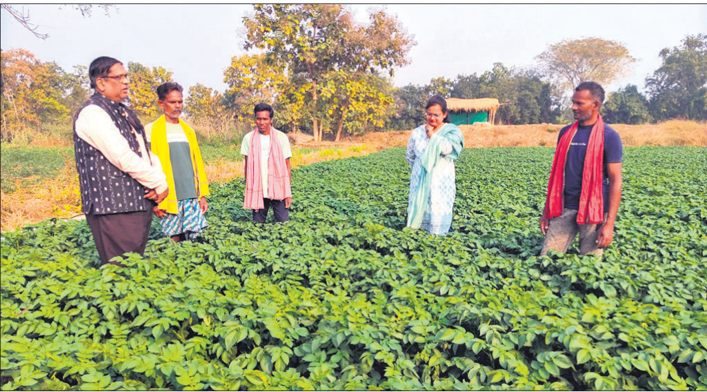
ଗୃତଭୋଜା କୁଳ ରେହେମାଳ ଗାଁର ଏକ ଆଳୁ କିଆରିରେ ଆଳୁଚାଷୀଙ୍କ ସହ ଉତ୍ପାଦନ କୃଷି ଅଧିକାରୀ ।

କିଛି ମାସ ପୂର୍ବରୁ ରାଜ୍ୟରେ ଆଳୁ ସଙ୍କଟ ପ୍ରସଙ୍ଗ ପ୍ରମୁଖ ବନ୍ଧନ ବିଷୟ ହୋଇଥିଲା । ଆଳୁ କେଳି ପ୍ରତି ଦର ୫୦ ଟଙ୍କାକୁ ଚାପି ଯାଇଥିଲା । ଆଳୁ ମହଙ୍ଗା ମାତ୍ରରେ ପ୍ରତି ଘର ରୋଷେଇ ପ୍ରଭାବିତ ହୋଇଥିଲା । ଏବେ ଆଳୁ ଦର ସାମାନ୍ୟ କମିଛି । କେଳି ପ୍ରତି ଦର ପାଖାପାଖି ୩୦ ଟଙ୍କା ରହିଛି । ଆଳୁ ସଙ୍କଟ ସମୟରେ ସ୍ୱାବଲମ୍ବ ହେବାକୁ ଗୁରୁତ୍ୱ ଦିଆଯାଇଥିଲା । ଏହି ପରିପ୍ରେକ୍ଷାରେ ବଲାଙ୍ଗୀର ଜିଲ୍ଲା ଏବେ ଆଳୁ ସ୍ୱାବଲମ୍ବନର ଏକ ପରୀକ୍ଷାଗାର ପାଲଟିଥିବା ଦେଖାଯାଉଛି । ବଲାଙ୍ଗୀର ଜିଲ୍ଲା ଉତ୍ପାଦନ ବିଭାଗ ପକ୍ଷରୁ ମିଳିଥିବା ଯୁବନା ପୂର୍ତ୍ତବଳ ଜିଲ୍ଲାରେ ଚଳିତବର୍ଷ ୬୯୫ ହେକ୍ଟରକୁ ଆଧିକ କମିରେ ଆଳୁଚାଷ କରାଯାଇଛି । ଜିଲ୍ଲାର କୁଳ ପତ୍ତା ୫୦ ହେକ୍ଟର କମିରେ ଆଳୁ ଚାଷ ଲକ୍ଷ୍ୟ ରଖାଯାଇ ଚାଷୀଙ୍କୁ ଉତ୍ସାହିତ କରାଯାଇଛି । ଏବେ ଜିଲ୍ଲାରେ ଆଳୁ ଅମଳ ହେବା ଆରମ୍ଭ ହୋଇଯାଇଛି । ବଲାଙ୍ଗୀର ଜିଲ୍ଲାର ଉତ୍ପାଦନକାରୀ ଆଳୁ ଚାଷ ଆଗାମୀ ଦିନରେ ରାଜ୍ୟକୁ ଭିତ୍ତ ବର୍ତ୍ତା ଦେବ ବୋଲି ଆଶା କରାଯାଉଛି । ବଲାଙ୍ଗୀର ଜିଲ୍ଲା ଗୃତଭୋଜା କୁଳ କାମୁଡ଼ ଗ୍ରାମପଞ୍ଚାୟତ ଅନ୍ତର୍ଗତ ରେହେମାଳ ଗାଁର ଚାଷୀ ଚାପି ଚାଷ କରାଯାଇଛି । ଗତବର୍ଷ (୨୦୨୩-୨୪) ପ୍ରଥମ ଥର ପାଇଁ ସେ ଆଳୁ ଚାଷ କରିଥିଲେ । ମାତ୍ର ଯେତେକ ଲାଭ କରିଥିଲେ । ଠିକଣା ସମୟରେ ଆଳୁ ଅମଳ ହୋଇପାରିଲେ ସେ ବେଶ ଲାଭଦାନ ହେବେ ବୋଲି ଆଶା କରିଛନ୍ତି । ଉତ୍ପାଦନ ବିଭାଗ ପକ୍ଷରୁ ଉଚିତ ପରାମର୍ଶ ମିଳିଛି । ଚଳିତବର୍ଷ ସମ୍ପୂର୍ଣ୍ଣ ପ୍ରାଣୀକାରେ ଆଳୁ ଚାଷ କରାଯାଇଛି । ଗାଁର ଚଳଣ ଚାଷୀ ମିଳିତ ଭାବେ ଆଳୁ ଚାଷ କରିଛନ୍ତି । ୨୦ ପ୍ୟାକେଟ ଆଳୁ ଚାଷ କରାଯାଇଛି । ଗତବର୍ଷ (୨୦୨୩-