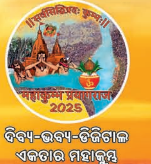
ଦିବ୍ୟ-ଭବ୍ୟ-ତିର୍ତିକାଳ ଏକତାର ମହାକୁମ୍ଭ