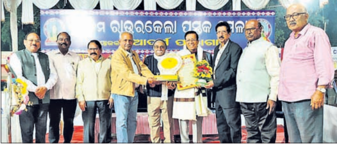
ଉତ୍ସବରେ ଜଣେ ପ୍ରତିଭାଧାରୀଙ୍କୁ ସମ୍ମାନିତ କରାଯାଇଛି।

ଆଦର୍ଶ ପାଠାଗାର ଆୟୋଜିତ ୩୦ତମ ରାଉରକେଲା ପୁସ୍ତକମେଳା ସୋମବାର ରାତିରେ ଉଦ୍‌ଯାପିତ ହୋଇଯାଇଛି।