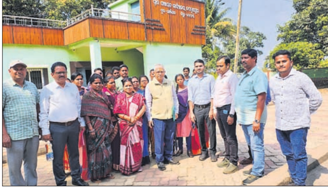
ଜରନାଥପୁର ପଞ୍ଚାୟତରାଜ କାର୍ଯ୍ୟାଳୟ ପରିସରରେ ଅର୍ଥ କମିଶନ ସଦସ୍ୟ ଓ ଅନ୍ୟମାନେ ।