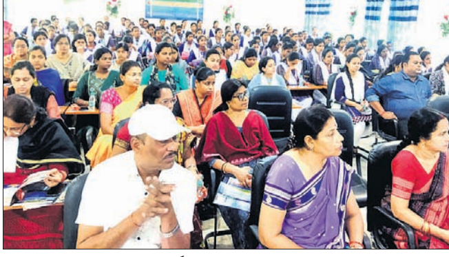
ସୁରକ୍ଷିତ ଲକ୍ଷ୍ମରନେଟ୍ ଦିବସ କାର୍ଯ୍ୟକ୍ରମରେ ନିମନ୍ତ୍ରିତ ଅତିଥି ଓ ଛାତ୍ରମାନେ ।