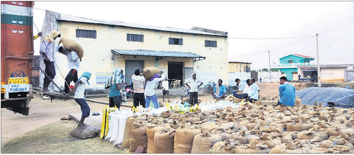
ଜିଲାର ଏକ ମଣ୍ଡିରେ ଧାନ କିଣା ଚାଲିଛି ।

ଜଳପ୍ରପାତରେ ନିଖୋଜ ଯୁବକଙ୍କ ମୃତଦେହ ଜବତ କୋକସରା, ୧୧୨୭ (ଭୁବନ କୁମାର ଦାଶ)