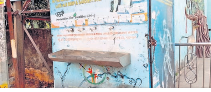
ଆୟୋଜିତ ଛକରେ ଥିବା ଅଟଳ ଜଳ ପ୍ରକଳ୍ପ।

ଖରାଦିନରେ ବାଗୋଇକୁ ସ୍କୁଲ ପାନୀୟ ଜଳ ଯୋଗାଇ ଦେବାକୁ ଗ୍ଲାନୀୟ ଆରବ୍ ସିଏମ୍ ପ୍ରଶାସନ ଓ ସମାଜସେବା ଅନୁଷ୍ଠାନ ପକ୍ଷରୁ ବିଭିନ୍ନ ଛକରେ ପାନୀୟ ଜଳ ପ୍ରକଳ୍ପ ତିଆରି କରାଯାଇଥିଲା।