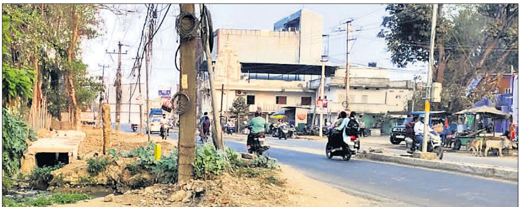
ଗାନ୍ଧୀପାକ ସାମନାରେ ଅଧାପଡ଼ିଆ ହୋଇ ପଡିରହିଥିବା ରାସ୍ତା ।

ସମ୍ବଳପୁରରେ ଉଚିତ ବେଗରେ ରାସ୍ତା ପ୍ରଶସ୍ତୀକରଣ କାମ ଚାଲିଛି। ଗୋଟିଏ ପଡେ ନିୟମିତ ଜରବରଖାଇ ଉଚ୍ଚେଦ କରାଯାଉଥିବା ବେଳେ ଚନ୍ଦ୍ରସିଂହ ଟ୍ରେନ ନିର୍ମାଣ କାମ ମଧ୍ୟ ଜାରି ରହିଛି। ତେବେ ସମ୍ବଳପୁରୀ୪ନମର ଖର୍ଚ୍ଚଦେଇଯାଇଥିବା ସହରର ପ୍ରବେଶ ପଥ ଜୁହାଯାଉଥିବା ଜେଲକ-ଗୋବିନ୍ଦତୋଳା ରାସ୍ତା କାମ କେବେ ସମ୍ପୂର୍ଣ୍ଣ ହେବ ତାହାକୁ ନେଇ ସାଧାରଣ ଲୋକେ ପ୍ରଶ୍ନ ଉଠାଇଛନ୍ତି। ୨୦୧୯ ପୂର୍ବରୁ ଏହି ରାସ୍ତା ପ୍ରଶସ୍ତୀକରଣ କାମ ଆରମ୍ଭ ହୋଇଥିଲା। ହେଲେ କଳ୍ପଦ ଗତିରେ କାମ ଚାଲିବା ପରେ ଏବେ ବନ୍ଦ ପଡିଛି। ସହରର ଅନ୍ୟ ଅଞ୍ଚଳରେ ରାସ୍ତା ବୋହରାକରଣ କାମ ଚାଲିଥିବା ବେଳେ ଜେଲକ-ଗୋବିନ୍ଦତୋଳା ପର୍ଯ୍ୟନ୍ତ ନିର୍ମାଣ କାମ କିଛି ଶେଷ ହେବା ନାଁ ଧରୁନାହିଁ। ଠିକାଦାର କାମ ହେବା କରୁଥିବା ବେଳେ ବିଭାଗୀୟ ଅଧିକାରୀ ଏଥିପ୍ରତି କୌଣସି ପଦକ୍ଷେପ ନେଉନାହାନ୍ତି। ଗାନ୍ଧୀ ପାକ ସାମନାରେ ରହିଥିବା ଜରବରଖାଇ ବାହାନା ଦେଖାଇ ଠିକାଦାର କାମ ଅଧାରେ ଅଟକାଇ ଦେଇଥିଲେ। ମହାନଗର ନିଗମ ଜରବରଖାଇ ଉଚ୍ଚେଦ