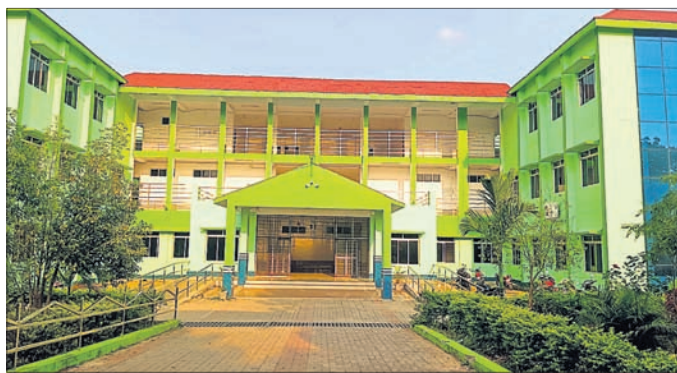
ନୟାଗଡ଼ ବ୍ଲକର ଲାଠିପଡ଼ାସ୍ଥିତ ଜିଲ୍ଲାର ଏକମାତ୍ର ସରକାରୀ ମତେଲ ଡିଗ୍ରୀ କଲେଜ।

ନୟାଗଡ଼ ବ୍ଲକର ଲାଠିପଡ଼ାସ୍ଥିତ ଜିଲ୍ଲାର ଏକମାତ୍ର ସରକାରୀ ମତେଲ ଡିଗ୍ରୀ କଲେଜରେ ବିଏଡ଼ କୋର୍ସ ଖୋଲିବାକୁ ଦାବି ହୋଇ ଆସୁଥିଲେ ମଧ୍ୟ ଉଚ୍ଚଶିକ୍ଷା ବିଭାଗ ଦାବିକୁ ଅଣଦେଖା କରି ଆସୁଥିବା ଅଭିଯୋଗ ହୋଇଆସୁଛି। ମତେଲ ଡିଗ୍ରୀ କଲେଜରେ ବିଏଡ଼ କୋର୍ସ ଖୋଲିବାକୁ ନୟାଗଡ଼ ଜିଲ୍ଲାପାଳ ଓ ସ୍ଥାନୀୟ ବିଧାୟକଙ୍କ ସୁପାରିସ ଓ ସହଯୋଗ ରହିଥିଲେ ବି ଫୁଲ ମିଳିନି। ବିଏଡ଼ କୋର୍ସ ଖୋଲିବାକୁ ମତେଲ ଡିଗ୍ରୀ କଲେଜ ପକ୍ଷରୁ ମଧ୍ୟ ରାଜ୍ୟ ସରକାରଙ୍କୁ ମଧ୍ୟ ଅନୁରୋଧ ଭାବେ ଅବଗତ କରାଯାଇଛି। ଏଭଳିସ୍ଥିତି ନୟାଗଡ଼ର ଛାତ୍ରଛାତ୍ରୀ ନିଜ ଜିଲ୍ଲା ସମେତ ରାଜ୍ୟରେ ବିଏଡ଼ କୋର୍ସ କରିବାର ସୁଯୋଗ ନ ପାଇ ଆନ୍ଧ୍ର ପ୍ରଦେଶ, ଜମ୍ମୁ ଓ କଶ୍ମୀର ଓ ଦିହାରକୁ ଯିବାକୁ ପଡୁଛି। ଶିକ୍ଷା ପାଇଁ ଦୂରଦୂରାନ୍ତର ଯିବାକୁ ପଡୁଥିବାରୁ ହତହତା ହେଉଛନ୍ତି। ବିଏଡ଼ କୋର୍ସ ପାଇଁ ଆନ୍ଧ୍ର ପ୍ରଦେଶ, ଜମ୍ମୁ ଓ କଶ୍ମୀର ଓ ଦିହାରରେ କଟେଜ ଛାତ୍ରଛାତ୍ରୀ ପିଛା ପ୍ରାୟ ଦେଢ଼ ଲକ୍ଷ ରୁ ୨ ଲକ୍ଷ ଟଙ୍କା ଖର୍ଚ୍ଚ ହେଉଛି। ସେହିପରି ଖାଇବା, ରହିବା, ବସ ଓ ଟ୍ରେନ