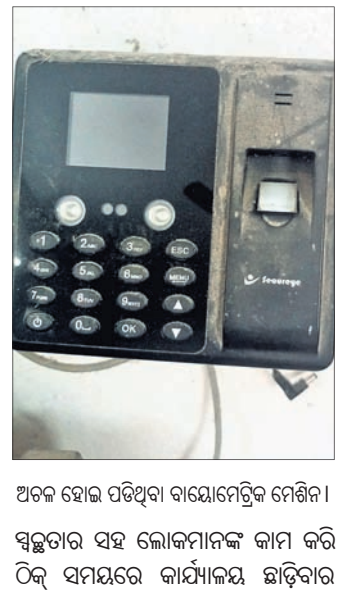
ଅଚଳ ହୋଇ ପଡିଥିବା ବାୟୋମେଟ୍ରିକ୍ ମେଶିନ। ସ୍ୱଚ୍ଛତା ସହ ଲୋକମାନଙ୍କ କାମ କରି ଠିକ୍ ସମୟରେ କାର୍ଯ୍ୟକାରୀ ଛାଡିବାର

ନୂଆପଲ୍ଲୀ, ୧୫/୧ (ଧନେଶ୍ୱର ସାହୁ) ନୟାଗଡ଼ ଜିଲ୍ଲା ନୂଆପଲ୍ଲୀ ବ୍ଲକ କର୍ମଚାରୀଙ୍କ ଉପସ୍ଥାନ ରଖିବା ପାଇଁ ବାୟୋମେଟ୍ରିକ୍ ମେଶିନ ଲଗାଯାଇଥିଲା। କିନ୍ତୁ ତାହା ଅଚଳ ହୋଇ ପଡ଼ିଥିବା ବେଳେ ତାହାକୁ ସଜାଡ଼ିବା ଲାଗି ଅଧିକାରୀ ମାନଙ୍କୁ ନୂଆପଲ୍ଲୀ ବ୍ଲକ କର୍ମଚାରୀ କାର୍ଯ୍ୟ ଦିବସରେ ନିୟମିତ ଭାବେ ଏବଂ ଠିକ୍ ସମୟରେ କାର୍ଯ୍ୟକାରୀକୁ ଆସୁ ନାହିଁ। ଫଳରେ କୌଣସି କାମରେ କାର୍ଯ୍ୟକାରୀକୁ ଆସୁଥିବା ଲୋକେ ହଇରାଣ ହେଉଥିବା ନେଇ ବାରମ୍ବାର ଅଭିଯୋଗ ହେବା ସହ ବିଭିନ୍ନ ଗଣମାଧ୍ୟମରେ ଖବର ପ୍ରକାଶ ପାଇଥିଲା। ତେଣୁ କର୍ମଚାରୀମାନଙ୍କୁ ସମୟାବଧିରେ କରାଯିବ ସହ ଠିକ୍ ସମୟରେ କାର୍ଯ୍ୟକାରୀକୁ ଆସିବା ଓ