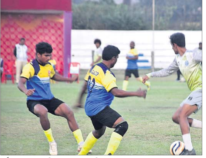
ଚୁନାମେଣ୍ଟରେ ଖେଳାଳିଙ୍କ ମଧ୍ୟରେ ଆୟୋଜିତ ସୁବର୍ଣ୍ଣ ମ୍ୟାଚ।

ପାରାଦୀପର ଗୋପବନ୍ଧୁ ଷ୍ଟାଡ଼ିୟମରେ ଚାଲିଥିବା ୪୬ତମ ସର୍ବଭାରତୀୟ ବୃହତ୍ତରମ ସୁବର୍ଣ୍ଣ ଚୁନାମେଣ୍ଟ ଗୁରୁବାର ଲିଗ୍ ପର୍ଯ୍ୟାୟ ଖେଳ ଶେଷ ହୋଇଛି। ଏଥିରୁ ୪ଟି ଟିମ ସେମିପାଇନାଲରେ ପହଞ୍ଚିଛନ୍ତି। ସେମାନେ ହେଲେ ମୁମ୍ବାଇ, ଚେନ୍ନାଇ, ପାରାଦୀପ ଓ ଭିଓସି। ଗୁରୁବାର ପ୍ରଥମ ମ୍ୟାଚ କୋଚିନ ବିଖାଖାପାଟଣା ମଧ୍ୟରେ ହୋଇଥିଲା। ତାହା ଅମାମାସିତ