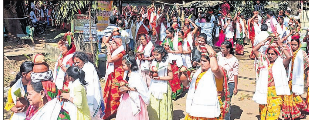
ମନ୍ଦିର ପ୍ରତିଷ୍ଠା କାର୍ଯ୍ୟକ୍ରମ ଅବସରରେ କଳସଯାତ୍ରା ।

ତାଳଚେର, ୧୪୧୨ (ମନୋଜ ନନ୍ଦ) ତାଳଚେର ବୁକ୍ ଯୋଗେଶ୍ଵର ଗ୍ରାମସ୍ଥିତ ବାବା ବାଲୁକେଶ୍ଵର ମନ୍ଦିର ପରିସରରେ ନବନିର୍ମିତ ଜଗନ୍ନାଥ ମନ୍ଦିର ଓ ପାର୍ଶ୍ଵ ଦେବତାମାନଙ୍କ ପ୍ରାଣପ୍ରତିଷ୍ଠା ମହୋତ୍ସବ ୧୩ ତାରିଖରୁ ଆରମ୍ଭ ହୋଇଛି । ଏହା ଆସନ୍ତା ୧୭ ତାରିଖ ପର୍ଯ୍ୟନ୍ତ ଚାଲିବ ।