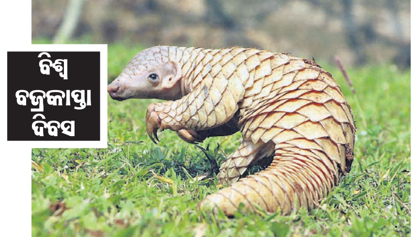
ବିଶ୍ୱ ବନ୍ଦକାୟା ଦିବସ

ବିଶ୍ୱ ବନ୍ଦକାୟା ଦିବସ ହେଉଛି ବିଶ୍ୱର ସର୍ବାଧିକ ଚାଲି ଯାଉଥିବା ପ୍ରାଣୀ ଜାତିର ପ୍ରତିଷ୍ଠା ଦିବସ। ଏହା ୧୯୯୬ରେ ପ୍ରଥମେ ପାଳନ କରାଯାଇଥିଲା। ଏହା ପଛରେ ଏହାକୁ ବନ୍ଦୀ କରିବା ପାଇଁ ଉଦ୍ଦେଶ୍ୟ ରଖିବା ପାଇଁ ସବୁଠାରୁ ବଡ଼ ବିପଦ ମନୁଷ୍ୟ ଏବଂ ସେମାନଙ୍କର ବ୍ୟବସାୟ ଥିଲା। ଏହାକୁ ସୁରକ୍ଷା ଦେବା ପାଇଁ ବିଶ୍ୱବ୍ୟାପୀ ପ୍ରାଣୀକଲ୍ୟାଣ ସଂଗଠନ ଏବଂ ସତେତନତା କାର୍ଯ୍ୟକ୍ରମର ଗଠନ କରାଯାଇଛି।