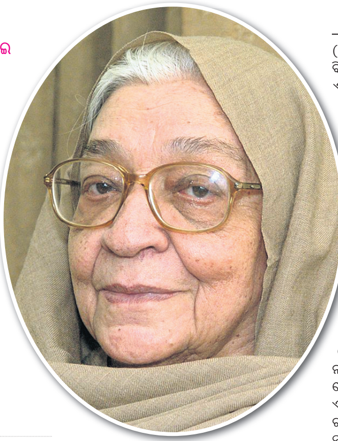
ପ୍ରସ୍ତୁତି ତ. ହୃଷୀକେଶ ମଲିକ