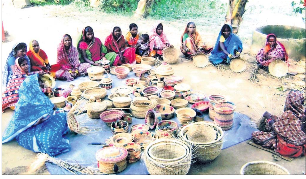
ସୁନାବିର ମହିଳାଙ୍କ ଦ୍ୱାରା ନାଳିଆ ଘାସରେ ପ୍ରସ୍ତୁତ କରାଯାଇଥିବା ବିକଳ ପ୍ରକାର ଘରକରଣ ସାମଗ୍ରୀ।

ନାଳିଆ ଘାସରେ ତିଆରି ଗୋକେଳ, ପାଣିଆ, ନାଳିଆ, ସେର, ମାଣ, ଚୁଲୁଲି ଆଦି ପ୍ରତ୍ୟେକକ ଘର ପରିଚିତ। ପ୍ରାୟ ୫୦ ବର୍ଷ ଧରି ଏହି ହସ୍ତଶିଳ୍ପ କୌଶଳ ବୃଦ୍ଧି ହୋଇ ରହି ଆସିଛି। ଏଥିରେ ଆର୍ଥିକ ସମ୍ପାଦନା ହେବା ସହ ପରିବାର ପ୍ରତିପୋଷଣରେ ସହଯୋଗ ମିଳିଥାଏ। ସମ୍ପ୍ରତି ଏହି ହସ୍ତଶିଳ୍ପ ବିକଳ କାରଣରୁ ଏବେ ଅଲୋଡ଼ା ହୋଇଛି। ଏହି ବୃତ୍ତିରେ ଆସୁଥିବା ଅର୍ଥ ଦ୍ୱାରା ୩ ଝିଅଙ୍କ ବିବାହ ହୋଇଛି ବୋଲି କେନ୍ଦ୍ରାପଡ଼ା ଜିଲ୍ଲା ମହାକାଳପଡ଼ା ବ୍ଲକ୍ ସୁନିତି ଗ୍ରାମର ହସ୍ତଶିଳ୍ପକୁ ବୁଝାଇ ଦେଇଛି। ପୂର୍ବରୁ ଏହାର କଞ୍ଚାମାଲ ବିନା ମୂଲ୍ୟରେ ଭିତରକନିକା ଜଙ୍ଗଲ ସହ ଅନ୍ୟ ଅଞ୍ଚଳରେ ମିଳୁଥିଲା। ବନ ବିଭାଗର କଟକଣା ଯୋଗୁ କଞ୍ଚାମାଲ