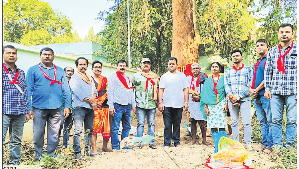
ରଥ କାଠ ଅନୁକୁଳ କରାଯାଇଛି।

ଖଣ୍ଡପଡ଼ା, ୧୫/୧ (ଅକ୍ଷୟ କୁମାର ମହାରଣା) ପ୍ରଭୁ ଶ୍ରୀଲିଙ୍ଗରାଜଦେବଙ୍କ ପବିତ୍ର ରୁକୁଣା ରଥପାତ୍ରା ପ୍ରତିବର୍ଷ ପରି ଚଳିତ ବର୍ଷ ଭୁବନେଶ୍ୱରଠାରେ ଅନୁଷ୍ଠିତ ହେବ। ଏହି ପରିପ୍ରେକ୍ଷାରେ ରୁକୁଣା ରଥ ନିର୍ମାଣ ନିମନ୍ତେ ପାରମ୍ପରିକ ରୀତିନୀତି ଅନୁଯାୟୀ ଖଣ୍ଡପଡ଼ାଠାରେ ଶୁକ୍ରବାର କାଠ ଅନୁକୁଳ