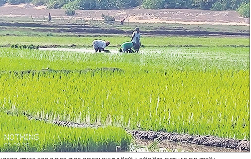
ରାମନଗର ପଞ୍ଚାୟତର ବରଳ ବାହାକୁବ ଗ୍ରାମର ମହାନଦୀ ସଂଲଗ୍ନ ଖରିବାଡ଼ି ଓ ଚାରିବାଡ଼ିରେ ତାଳୁଆଧାନ ଚାଷ ହେଉଛି।

କେନ୍ଦ୍ର ଓ ରାଜ୍ୟ ସରକାରଙ୍କ ପକ୍ଷରୁ ଗ୍ରାମାଞ୍ଚଳର କୃଷି ଓ କୃଷକଙ୍କ ବିକାଶ ପାଇଁ ଅନେକ ଯୋଜନା କାର୍ଯ୍ୟକାରୀ ହେଉଛି। କୃଷି ଓ କୃଷକମାନଙ୍କ ପାଇଁ ସରକାରୀ ରିହାତି ଦରରେ ବିହନ ଯୋଗାଣ ବିଭିନ୍ନ କୃଷି ଯନ୍ତ୍ରପାତି, ସାର, କୀଟନାଶକ ଆଦି ରଖି ଯୋଗାଇ ଦେଉଛନ୍ତି। ହେଲେ କୃଷି ଅଧିକାରୀମାନଙ୍କ ଖାମୁଖିଆଳି ମନୋଭାବ ପ୍ରଦର୍ଶନ ଯୋଗୁ ଗ୍ରାମାଞ୍ଚଳ ପାଇଁ ବାଧକ ସାଜିଛି। ସରକାରୀ କୃଷି ସହାୟତା, ଉପଯୁକ୍ତ ତାଲିମ ମିଳୁନାହିଁ ବୋଲି ସ୍ଥାନୀୟ ଚାଷୀ କହିଛନ୍ତି। ମିଳିଥିବା ସୂଚନା ଅନୁସାରେ, ମହାନଦୀପଡ଼ା ବ୍ଲକ୍ ଅଞ୍ଚଳର ରାମନଗର ପଞ୍ଚାୟତର ବରଳ ବାହାକୁବ ଗ୍ରାମ ପାର୍ଶ୍ୱ ଖରିବାଡ଼ି ଓ ଚାରିବାଡ଼ିରେ ୭୦ ଏକରର ଅଧିକ ଜମିରେ ଖରିବାଡ଼ି ଆଣ୍ଡାଧାନ ବେଉଷଣ ସରିବା ଶେଷ ପର୍ଯ୍ୟାୟରେ। ସ୍ଥାନୀୟ ଚାଷୀଙ୍କୁ ସରକାରୀ ସହାୟତା ମିଳୁ ନ ଥିବା ଅଭିଯୋଗ ହେଉଛି। ଅପରପକ୍ଷରେ ନିକଟ ମହାନଦୀରେ ଲୁଣାପାଣି ଯୋଗୁ ମଧୁର ଜଳସେଚନ ସୁବିଧା ନାହିଁ। ଚାଷୀମାନେ ବାଧ୍ୟହୋଇ ନିଜ ଜମିରେ ରୁଆ ଖୋଳି ମଧୁର ପାଣି