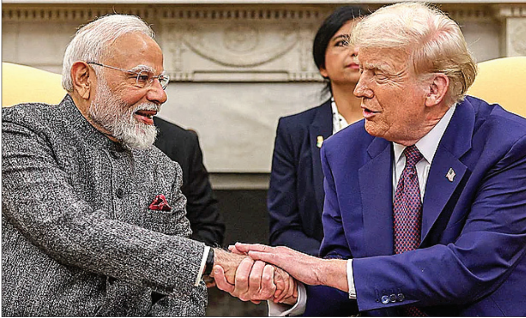
ଆମେରିକାର ଖ୍ରୀଷ୍ଟିୟାନ ଡିସିରେ ଆମେରିକା ରାଷ୍ଟ୍ରପତି ଡୋନାଲ୍ଡ ଟ୍ରମ୍ପ ଓ ଭାରତର ପ୍ରଧାନମନ୍ତ୍ରୀ ନରେନ୍ଦ୍ର ମୋଦି କରମର୍ଦନ କରୁଥିବାର ଏକ ବିଶେଷ ମୁହୂର୍ତ୍ତ।