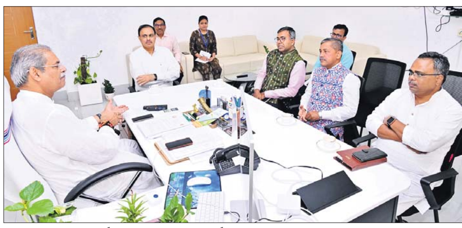
ଉପମୁଖ୍ୟମନ୍ତ୍ରୀ କନକ ବର୍ଦ୍ଧନ ସିଂଦେଓଙ୍କ ସହ ରାଜ୍ୟ ଅର୍ଥ କମିଶନ ଚେୟାରମ୍ୟାନ ଅରୁଣ କୁମାର ପଣ୍ଡାଙ୍କ ଆଲୋଚନା।

ଲୋକସେବା ଭବନରେ ଶନିବାର ଷଷ୍ଠ ରାଜ୍ୟ ଅର୍ଥ କମିଶନ ଚେୟାରମ୍ୟାନ ଅରୁଣ କୁମାର ପଣ୍ଡା ଓ ଅନ୍ୟ ସଦସ୍ୟମାନେ ଉପମୁଖ୍ୟମନ୍ତ୍ରୀ କନକ ବର୍ଦ୍ଧନ ସିଂଦେଓଙ୍କ ସହ ସୌଜନ୍ୟମୂଳକ ସାକ୍ଷାତ କରିଛନ୍ତି।