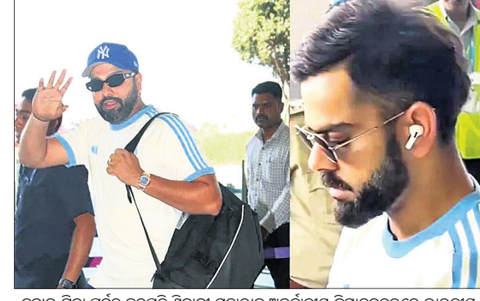
ଦୁବାଇ ସଭା ପୂର୍ବରୁ ଛତ୍ରପତି ଶିବାଜୀ ମହାରାଜ ଅନ୍ତର୍ଜାତୀୟ ବିମାନବନ୍ଦରରେ ଭାରତୀୟ ଦଳର ଅଧିନାୟକ ରୋହିତ ଶର୍ମା ଓ ବିରାଟ କୋହଲି।

ପୁରସ୍କାର (ପି.ଟି.) ଆକ୍ରମଣ ମ୍ୟାଚ୍ରେ ଉଚ୍ଚ ରାକାଳପ୍ରାପ୍ତ ଜର୍ମାନୀକୁ ସ୍ପେନ୍ ୨-୧ ଗୋଲରେ ପରାସ୍ତ କରିଛି। ଏଫଆଇଏଚ୍ ପ୍ରୋ ଲିଗ୍ରେ ଜର୍ମାନୀ ସମ୍ପୂର୍ଣ୍ଣ ୪ ଓ ସ୍ପେନ୍ ୮ ନମ୍ବର ସ୍ଥାନରେ ରହିଛି। ମାତ୍ର ଏଠାରେ ପ୍ରଥମ ପ୍ରଦର୍ଶନ କରି ସ୍ପେନ୍ ବାକି ମାରିଛି। ଡାକ୍ତର ସଂଘର୍ଷପୂର୍ଣ୍ଣ ମ୍ୟାଚ୍ରେ ପ୍ରଥମ ଦଳ ଭାବେ ଗୋଲଟିକୁ ମଧ୍ୟ ହରାଇଥିଲା। ଭାରତୀୟ ଦଳ ଗୋଲଟିକୁ ପରିଶୋଧ କରି ଦେଇଥିଲା।