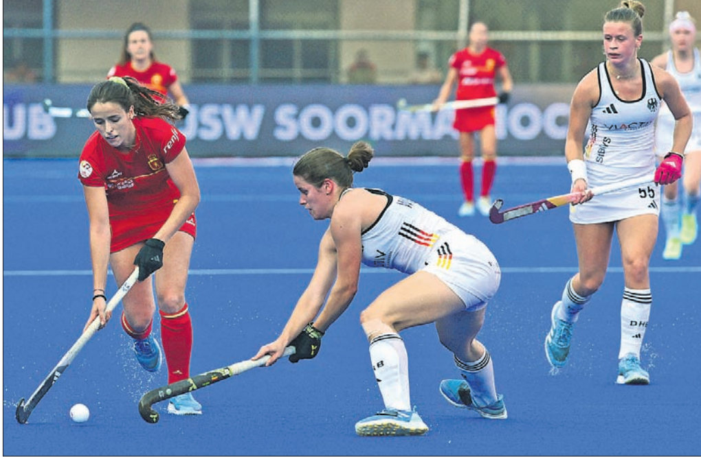
ଜର୍ମାନୀ ଓ ସ୍ପେନ୍ ମଧ୍ୟରେ ଅନୁଷ୍ଠିତ ମ୍ୟାଚ୍ରେ ଏକ ସଂଘର୍ଷପୂର୍ଣ୍ଣ ମୁହୂର୍ତ୍ତ।

ଅନୁଷ୍ଠିତ ହୋଇଛି। ସବୁଠାରୁ ଗୁରୁତ୍ୱପୂର୍ଣ୍ଣ ହେଲା ଭାରତ ପ୍ରୋ ଲିଗ୍ ୨୦୨୪-୨୫ ସିଜନ ଏହି କଳିଙ୍ଗ ଷ୍ଟାଡ଼ିୟମକୁ ହିଁ ଆରମ୍ଭ କରିଛି। ଏଫଆଇଏଚ୍ ପ୍ରୋ ଲିଗ୍ ଉଭୟ ମହିଳା ଓ ପୁରୁଷ ବିଭାଗରେ ହେଉଛି ଏହି ଗୁରୁତ୍ୱପୂର୍ଣ୍ଣ ପ୍ରତିଯୋଗିତା। ପ୍ରଥମ ଦିବସରେ ମହିଳା ବିଭାଗରେ ୨ଟି ଓ ପୁରୁଷ ବିଭାଗରେ ଗୋଟିଏ ମ୍ୟାଚ୍