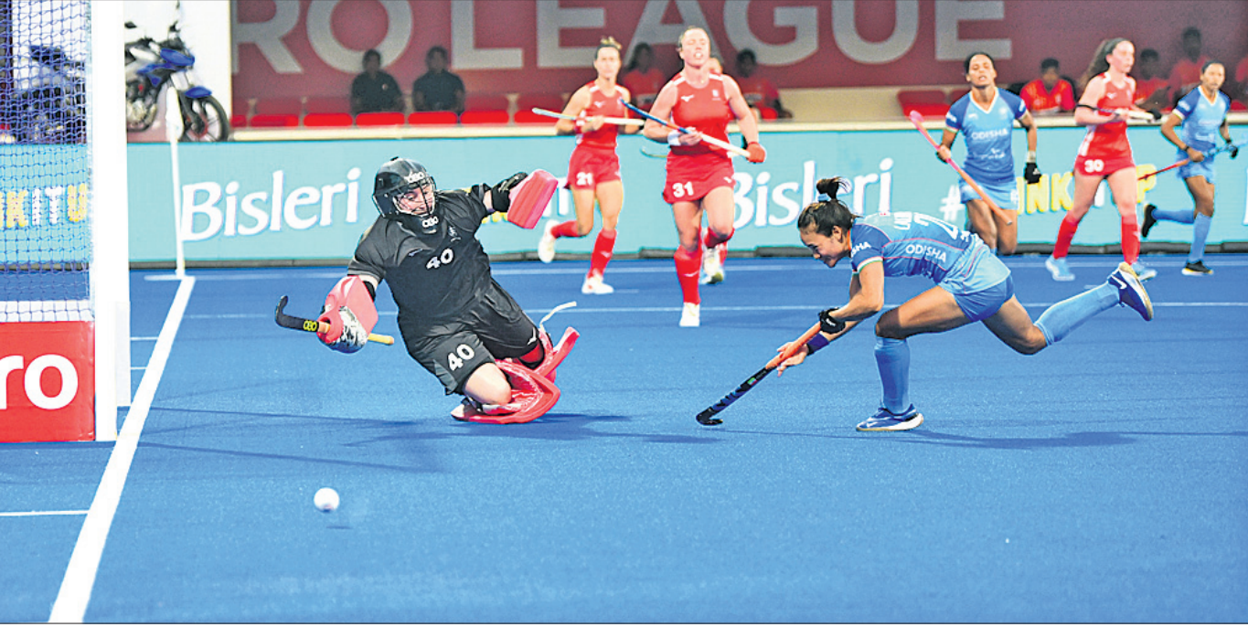
ଲଙ୍କାଶ୍ୱ ବିପକ୍ଷ ମହିଳା ଏଫଆଇଏଚ୍ ପ୍ରୋ ଲିଗ୍ ମ୍ୟାଚ୍ରେ ଗୋଲ୍ ଖୋଲି ଦେଇଥିବା ଭାରତୀୟ ଖେଳାଳି

ଭୁବନେଶ୍ୱର, ୧୫୧୨ (ତପନ ସାହୁ) ଭୁବନେଶ୍ୱରକୁ ଫେରିଛି ହକି ଆକ୍ରମଣ। ଶନିବାରଠାରୁ ଏଠାରେ ଆରମ୍ଭ ହୋଇଛି ଏଫଆଇଏଚ୍ ପ୍ରୋ ଲିଗ୍ ଉଭୟ ମହିଳା ଓ ପୁରୁଷ ବିଭାଗରେ ହେଉଛି ଏହି ଗୁରୁତ୍ୱପୂର୍ଣ୍ଣ ପ୍ରତିଯୋଗିତା। ପ୍ରଥମ ଦିବସରେ ମହିଳା ବିଭାଗରେ ୨ଟି ଓ ପୁରୁଷ ବିଭାଗରେ ଗୋଟିଏ ମ୍ୟାଚ୍