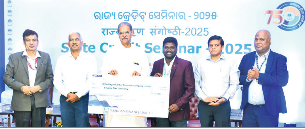
ରାଜ୍ୟ କ୍ରେଡିଟ୍ ସେମିନାର- ୨୦୨୫ ରାଜ୍ୟ ସ୍ତରୀୟ ସମାବେଶ-୨୦୨୫ State Credit Seminar-2025

ଭୁବନେଶ୍ୱର, ୧୫୧୨ (ଅଭିଜିତ ଦାଶ) ଜାତୀୟ କୃଷି ଏବଂ ଗ୍ରାମୀଣ ବିକାଶ ବ୍ୟାଙ୍କ ବା ନାବାର୍ଡର ବହୁ ପ୍ରତୀକ୍ଷିତ କାର୍ଯ୍ୟକ୍ରମ ତଥା ଷ୍ଟେଟ କ୍ରେଡିଟ୍ ସେମିନାର-୨୦୨୫ ଶନିବାର ଉଦ୍ଘାଟିତ ହୋଇଯାଇଛି। ଏପରି କି ଭୁବନେଶ୍ୱରରେ ଆୟୋଜିତ ଏହି ସେମିନାର ଅବସରରେ ନାବାର୍ଡ ପକ୍ଷରୁ ଉଦ୍ଘାଟନା ପାଇଁ ଏକ ସ୍ୱତନ୍ତ୍ର ଷ୍ଟେଟ ଫୋକସ୍ ପେପର୍ ପ୍ରକାଶ ପାଇଥିଲା। ଏହି ପେପର ଆଧାରରେ ଚଳିତ ଆର୍ଥିକବର୍ଷ ପାଇଁ ରଣ ଆକଳନ ସହ ପ୍ରାଥମିକତା କ୍ଷେତ୍ର ଅଧୀନରେ ସାମଗ୍ରିକ ରଣ ସମ୍ଭାବନା ୨,୫୨,୦୦୦ କୋଟି ଟଙ୍କା ରହିବ ବୋଲି ଉକ୍ତ ପେପରରେ ଦର୍ଶାଯାଇଥିଲା। ସେହିଭଳି ଏହି ଅବସରରେ ଏକ ସ୍ୱତନ୍ତ୍ର ଆଲୋଚନା