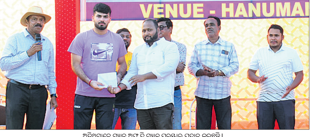
ଅତିଥିମାନେ ମ୍ୟାଚ୍ ଅର୍ପିତ ପୁରସ୍କାର ପ୍ରଦାନ କରୁଛନ୍ତି।

ଗାମ୍ଭୀରୀ ଟ୍ରଷ୍ଟି ଭେଟେରାଣ୍ଡ ଖେଳାଳିଙ୍କୁ ପ୍ରଦର୍ଶନ ଉପରେ ନଜର ରଖିବ। ଅନ୍ତର୍ଜାତୀୟ ଦିନିଆ ଲିଡିଆରେ ୧୪,୦୦୦ ରନ ପୁରଣ କରିବାରେ ବୃତ୍ତୀୟ ବ୍ୟାଟର ହେବାର ଗୌରବ ଅର୍ଜନ କରିବା ଲାଗି କୋହଲି ଆଉ ମାତ୍ର ୩୭୦ର ଆବଶ୍ୟକ କରୁଛନ୍ତି। ସେହିଭାବେ ରୋହିତ ଆଉ ମାତ୍ର ୧୨ ରନ କରିପାରିଲେ ୧୧,୦୦୦ ରନ ପୁରଣ କରିବାରେ ୧୦ମ ବ୍ୟାଟର ହେବେ। କିନ୍ତୁ ଟ୍ରଷ୍ଟି ହାସଲ କରିବା ପାଇଁ ରୋହିତଙ୍କୁ ୧୫୦ ରନ କରିବାକୁ ହେବ।