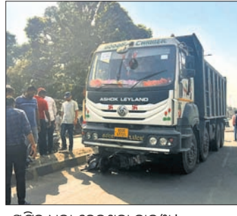
ଘୁରୁଗଣାରେ ଘଟଣାସ୍ଥଳରେ ଥିବା ଏକ ଟ୍ରାକ୍ଟର ।

ଘୁରୁଗଣା, ୧୭୨୨ (ମାନସ ମହାନ୍ତି) ଘୁରୁଗଣା, ୧୭୨୨ (ମାନସ ମହାନ୍ତି) ଘୁରୁଗଣା, ୧୭୨୨ (ମାନସ ମହାନ୍ତି) ଘୁରୁଗଣା, ୧୭୨୨ (ମାନସ ମହାନ୍ତି) ଘୁରୁଗଣା, ୧୭୨୨ (ମାନସ ମହାନ୍ତି)