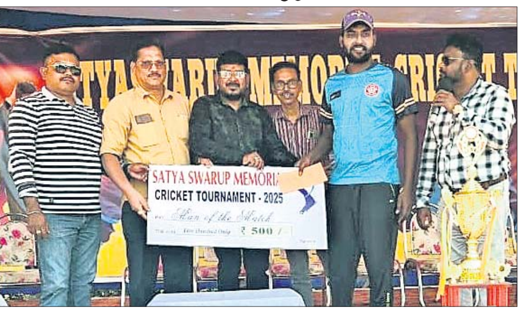
ଅତିଥି ମ୍ୟାଚ୍ ଅଫ୍ ଦି ମ୍ୟାଚ୍ ପୁରସ୍କାର ପ୍ରଦାନ କରୁଛନ୍ତି ।