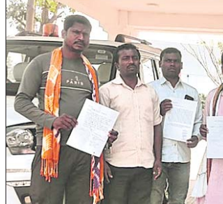
ଜିଲ୍ଲାପାଳଙ୍କୁ ଦାବିପତ୍ର ଦେବାକୁ ଆସିଥିବା ଚାଷୀ ପ୍ରତିନିଧି ।

ଅର୍ଥବିଭାଗରୁ ଧାନ ମଣ୍ଡିରୁ ବୋଲି ଚେତାବନା ଦେଇଛନ୍ତି । ଉକ୍ତ ଦାବିପତ୍ରରେ ଉଲ୍ଲେଖ ରହିଛି, ମାଲକାନଗିରି ଜିଲ୍ଲା ଶିଖପାଲ୍ଲୀ ଓ ଗୋରାଖୁଣ୍ଟା ପଞ୍ଚାୟତରେ ଧାନମଣ୍ଡି ଶିଖପାଲ୍ଲୀରେ ଅନୁଷ୍ଠିତ ହେଉଛି ।