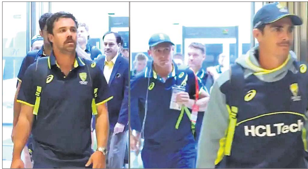
ଚାମ୍ପିୟନ୍ସ ଟ୍ରଫି ଖେଳିବା ଲାଗି ପାକିସ୍ତାନରେ ପହଞ୍ଚିଲା ଅଷ୍ଟ୍ରେଲିଆ ଦଳ ।

ଲାହୋର, ୧୭/୨ (ପି.ଟି.) ଆଇସିସି ଚାମ୍ପିୟନ୍ସ ଟ୍ରଫି ଖେଳିବା ଲାଗି ଅଷ୍ଟ୍ରେଲିଆ କ୍ରିକେଟ ଦଳ ଯୋଗଦାନ ପାକିସ୍ତାନରେ ପହଞ୍ଚିଛି ।