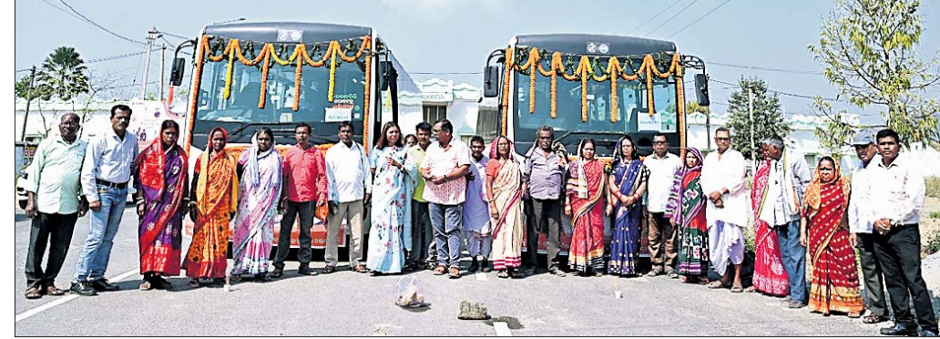
ରାୟଗଡ଼ା ଅଭିମୁଖେ ବାହାରିଥିବା ତୀର୍ଥଯାତ୍ରୀ ।

ମାଲକାନଗିରି, ୧୭।୨ (ଦୁର୍ଯ୍ୟୋଧନ ପାତ୍ର) ବରିଷ୍ଠ ନାଗରିକ ତୀର୍ଥଯାତ୍ରା ଯୋଜନାରେ ମାଲକାନଗିରି ଜିଲାରୁ ୭୧ ଜଣ ବରିଷ୍ଠ ନାଗରିକ କୋଲକାତା ଓ ଆସାମର ରୁଆହାଙ୍ଗ ନିକଟବର୍ତ୍ତୀ କାମାକ୍ଷା ଶକ୍ତିପୀଠ ଦର୍ଶନ ଅଭିମୁଖେ ବାହାରିଛନ୍ତି ।