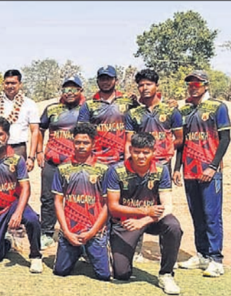
ପାଟଣାଗଡ଼ ଏବଂ ନୂଆପଡ଼ା ଦଳର ଖେଳାଳିଙ୍କ ଗହଣରେ ଅତିଥିମାନେ ।