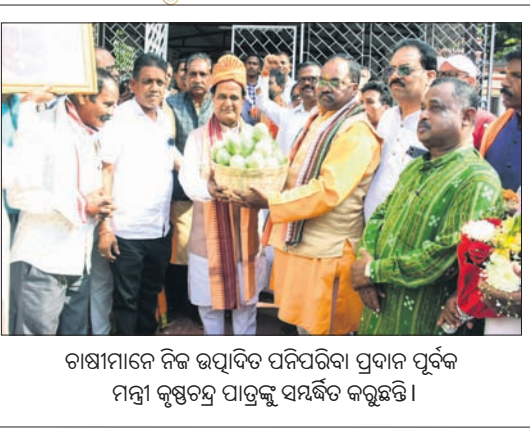
ରାଷ୍ଟ୍ରୀୟ ନିଜ ଉତ୍ପାଦିତ ପନିପରିବା ପ୍ରଦାନ ପୂର୍ବକ ମନ୍ତ୍ରୀ କୃଷକମାନଙ୍କୁ ପାତ୍ରକୁ ସମର୍ଥନ କରୁଛନ୍ତି।