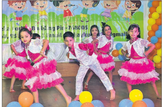
ବାର୍ଷିକ ଉତ୍ସବରେ କୁନି ଛାତ୍ରୀମାନେ ନୃତ୍ୟ ପରିବେଷଣ କରୁଛନ୍ତି।

ସମ୍ବଲପୁର, ୧୭/୨ (ପ୍ରମୋଦ ବହିରା) ସମ୍ବଲପୁର ଧରଣ ବିଭାଗ ମାଲ୍ ଛୋଟା ସ୍କୁଲର ବାର୍ଷିକ ଉତ୍ସବ ପ୍ରଗତି ଅନୁଷ୍ଠିତ ହୋଇଯାଇଛି।