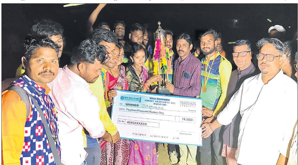
ବିଜେତା ଦଳକୁ ପୁତ୍ର ପ୍ରଦାନ କରାଯାଇଛି ।