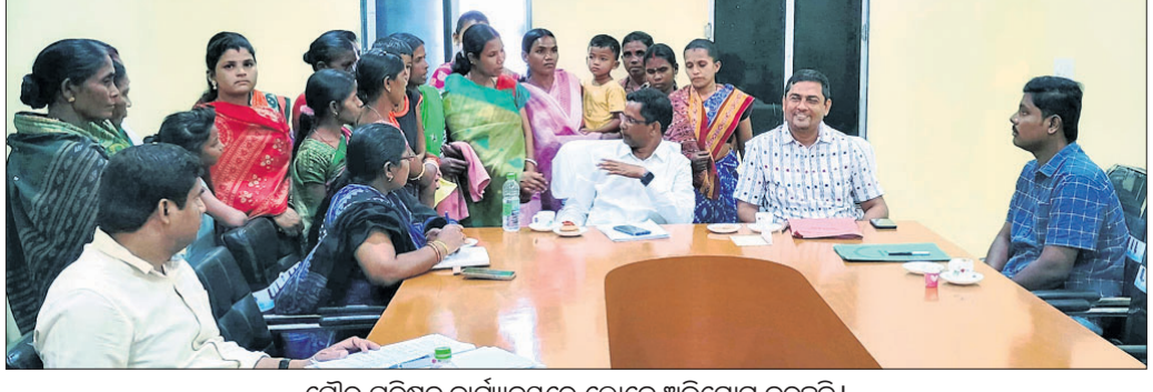
ପୌର ପରିଷଦ କାର୍ଯ୍ୟାଳୟରେ ଲୋକେ ଅଭିଯୋଗ କରୁଛନ୍ତି।

ଦେବଗଡ଼, ୧୭୧୨ (ଶଶୀକାନ୍ତ ଖଟ୍ଟର) ଦେବଗଡ଼ ପୌର ପରିଷଦ କାର୍ଯ୍ୟାଳୟରେ ଯୋଜନାବଦ୍ଧ ଅଭିଯୋଗ ଶୁଣାଣି ଶିବିର ଅନୁଷ୍ଠିତ ହୋଇଯାଇଛି।