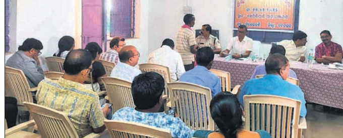
ଜିଲ୍ଲାପାଳଙ୍କ ମୁକ୍ତ ଅଭିଯୋଗ ଶୁଣାଣି ଶିବିରରେ ଉପସ୍ଥିତ ଅଧିକାରୀ।