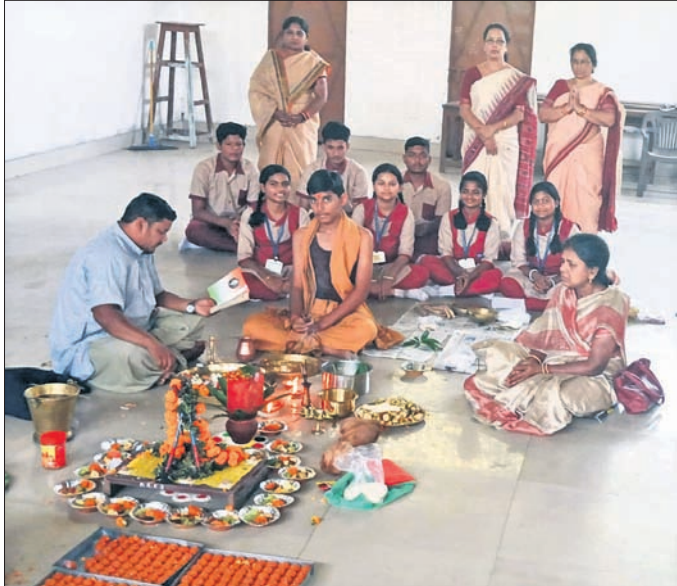
ସତ୍ୟନାରାୟଣ ପୂଜା ପୂର୍ବକ ଛାତ୍ରୀଛାତ୍ରୀଙ୍କୁ ବିଦାୟ ସମ୍ବର୍ଦ୍ଧନା ଦିଆଯାଇଛି।

ସମ୍ବଲପୁର, ୧୭/୨ (ପ୍ରମୋଦ ବହିରା) ଚଳିତବର୍ଷ ମାଟ୍ରିକ ପରୀକ୍ଷାରେ ଅବତୀର୍ଣ୍ଣ ହେବାକୁ ଯାଉଥିବା ସମ୍ବଲପୁର ବ୍ଲକର ଛାତ୍ରୀଛାତ୍ରୀଙ୍କୁ ବିଦାୟ ସମ୍ବର୍ଦ୍ଧନା ଛାପନ କରାଯାଇଛି।