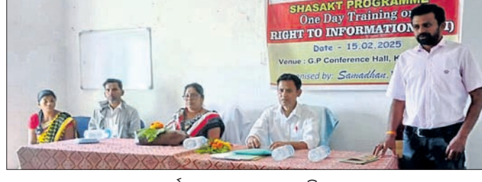
କାର୍ଯ୍ୟକ୍ରମରେ ମଞ୍ଚାସୀନ ଅତିଥି।

କାର୍ଯ୍ୟକ୍ରମରେ ଜିଲ୍ଲାର ମୁକ୍ତ ପରୀକ୍ଷା କେନ୍ଦ୍ର ପାଇଁ ନିମ୍ନଲିଖିତ ହୋଇଥିବା ୨୦ଜଣ ଅଧ୍ୟାକ୍ଷକ ଓ ୨୦ ପର୍ଯ୍ୟବେକ୍ଷକ ଓ ମାଟ୍ରିକ ପାଇଁ ନିମ୍ନଲିଖିତ ୪୦ଜଣ ଅଧ୍ୟାକ୍ଷକ, ୪୦ ପର୍ଯ୍ୟବେକ୍ଷକ, ୨୦ଟି ଡେପ୍ୟୁଟି ଚିଫର ପୂର୍ବକ ସେମାନଙ୍କର ପରୀକ୍ଷା ପରିଚାଳନା ସମ୍ପର୍କରେ ବୃଦ୍ଧ ଦୃଷ୍ଟି ଦିଆଯାଇଥିଲା।