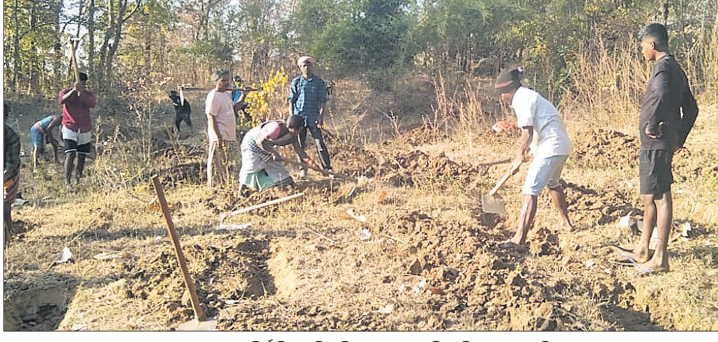
ତେଲଙ୍ଗାନାରେ ନିର୍ମାତା ଶ୍ରମିକ ନିଜ ଗ୍ରାମକୁ ଫେରି ମାଟି କାମ କରୁଛନ୍ତି ।

ଲାଇଫସାଇଟ, ୧୭୧୨ (ଭୁବନେଶ୍ୱର ବାରିକ) ଯୋଗଦାନ କଲାଣାର ଜିଲା ଆଗଲପୁର ଥାନା ରିନବଚନ ଓ ଉଚ୍ଚବାହାଳ ମଝିରେ ଏକ ବାଲକ୍ ପଞ୍ଚାୟତ ଗଠଣ କରାଯାଇଛି ।