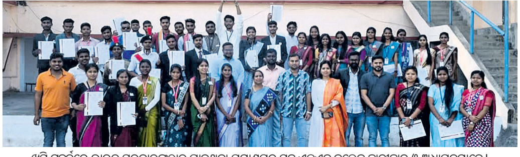
ଶୁଣି ପୁରୁଷ୍କୃତ ଭାରତ ସରକାରଙ୍କଠାରୁ ପାଇଥିବା ପ୍ରମାଣପତ୍ର ସହ ଏଲଏନ କଲେଜ ଛାତ୍ରାଛାତ୍ରୀ ଓ ଅଧ୍ୟାପକମାନେ।

ଝାରସୁଗୁଡ଼ା, ୧୭୧୨ (ଆଶିଷ ରଞ୍ଜନ ଦାଶ) ଝାରସୁଗୁଡ଼ା ସହରସ୍ଥିତ ଲକ୍ଷ୍ମୀ ନାରାୟଣ କଲେଜରେ ଗତ ତିନିଦିନ ୨୪ରେ ଜାତୀୟ ଭାଷା ଦିବସ ଉପଲକ୍ଷେ 'ୟୁବ ସଂସଦ' କାର୍ଯ୍ୟକ୍ରମ ଅନୁଷ୍ଠିତ ହୋଇଥିଲା।