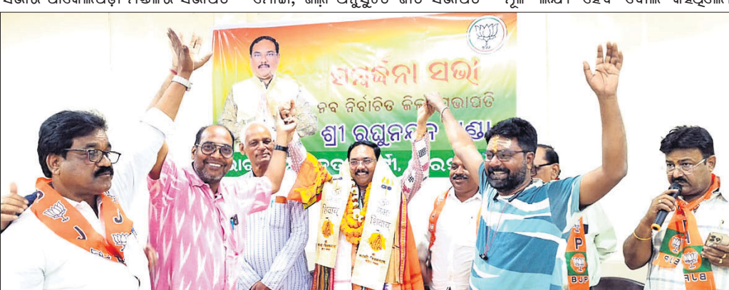
ଝାରସୁଗୁଡ଼ା ଭାଜପା ନୂତନ ଜିଲ୍ଲା ସଭାପତିଙ୍କୁ ସମର୍ଥନ ଦେଖାଉଛନ୍ତି।