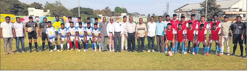
ଆୟୋଜକ ଏବଂ ଅତିଥିଙ୍କ ସହ ଝାରସୁଗୁଡ଼ା ଏବଂ ଦେବଗଡ଼ ଦଳର ଖେଳାଳିମାନେ।