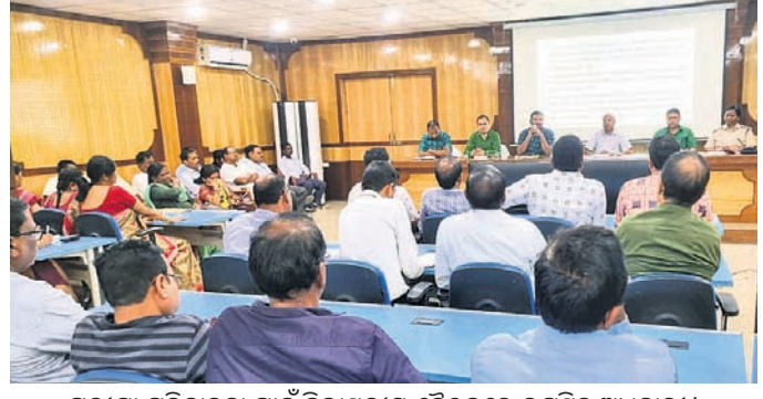
ପରୀକ୍ଷା ପରିଚାଳନା ପାଇଁ ଜିଲ୍ଲାସ୍ତରୀୟ ବୈଠକରେ ଉପସ୍ଥିତ ଅଧିକାରୀ।

ଝାରସୁଗୁଡ଼ା, ୧୭୧୨ (ଆଶିଷ ରଞ୍ଜନ ଦାଶ) ଝାରସୁଗୁଡ଼ା ଜିଲ୍ଲା ଶିକ୍ଷା କାର୍ଯ୍ୟାଳୟ ଆନୁକୂଲ୍ୟରେ ଚଳିତ ଶିକ୍ଷାବର୍ଷର ମାଟ୍ରିକ ବାର୍ଷିକ ପରୀକ୍ଷା ଓ ମୁକ୍ତ ପରୀକ୍ଷାର ଠିକ ପରିଚାଳନା ପାଇଁ ଯୋଜନାବଦ୍ଧ ଏକ ଓଡ଼ିଏସଏନ କାର୍ଯ୍ୟକ୍ରମ ଅନୁଷ୍ଠିତ ହୋଇଥିଲା।