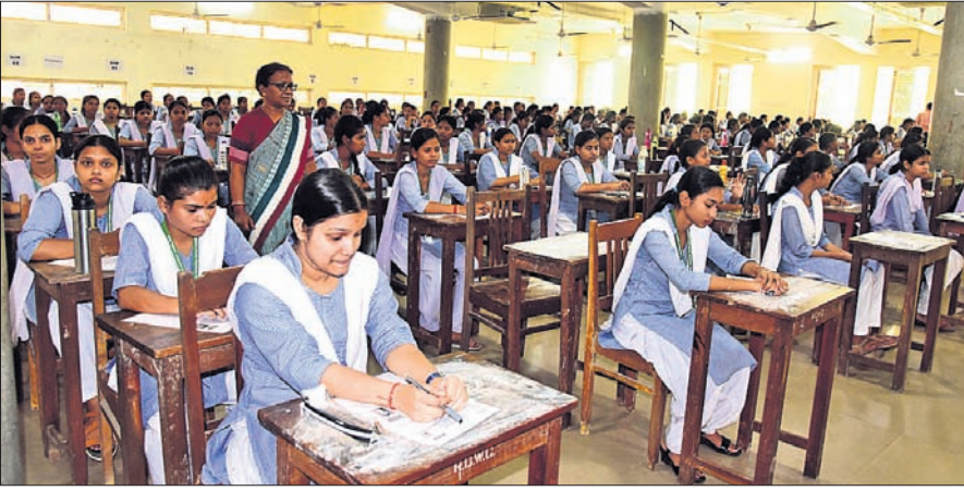
ପ୍ରଥମ ଦିନରେ ଭୁବନେଶ୍ୱରସ୍ଥିତ ରମାଦେବୀ ମହିଳା ଉଚ୍ଚ ମାଧ୍ୟମିକ ବିଦ୍ୟାଳୟରେ ଯୁକ୍ତ ୨ ବିଜ୍ଞାନ ଛାତ୍ରାଛାତ୍ରୀ ମାତୃକାରେ ପରୀକ୍ଷା ଦେଉଛନ୍ତି।

ସମୟ ନ ସରିବା ଯାଏ କୌଣସି ପରୀକ୍ଷାର୍ଥୀଙ୍କୁ ବାହାରକୁ ଯିବାକୁ ଦିଆଯାଇ ନ ଥିଲା। କପି ରୋକିବା ପାଇଁ ପଞ୍ଚସ୍ତରୀୟ ସ୍କାଫ୍ ବ୍ୟବସ୍ଥା କରାଯାଇଥିବାବେଳେ ପରୀକ୍ଷା କେନ୍ଦ୍ର ବାହାର ଗେଟଠାରୁ ପିଲାଙ୍କୁ ଚେକିଂ କରି ପଠାଯାଇଥିଲା। ସେହିପରି ବୁଧବାର କଳା ଓ ବାଣିଜ୍ୟ ବିଦ୍ୟାର୍ଥୀ ମାତୃକା(ଓଡ଼ିଆ)ରେ ପରୀକ୍ଷା ଦେବେ। ଏବର୍ଷ ଅଧିକ