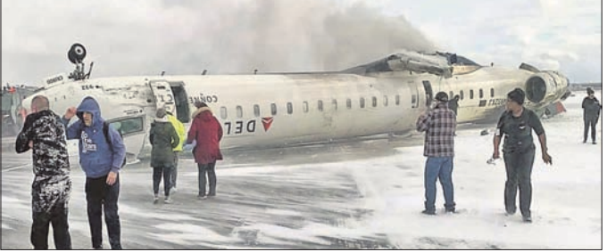
ଚରଖୋସ୍ଥିତ ଏୟାରପୋର୍ଟରେ ତେଲକା ଏୟାରଲାଇନରୁ ଦୁର୍ଘଟଣାଗ୍ରସ୍ତ ବିମାନ।

କାତାର ଚରଖୋସ୍ଥିତ ପିଅରସନ ଜଣ୍ଡରନାମାଗନାଲ ଏୟାରପୋର୍ଟରେ ମଙ୍ଗଳବାର ତେଲକା ଏୟାରଲାଇନରୁ 'ସିଇଆର୍ ୧୦୦' ବିମାନ ଦୁର୍ଘଟଣାର ଶିକାର ହୋଇଛି। ଏହି ଦୁର୍ଘଟଣାରେ ୧୮ ଜଣ ଆହତ ହୋଇଥିବାବେଳେ ୩ ଜଣଙ୍କର ଅବସ୍ଥା ଗୁରୁତର ରହିଛି। ବିମାନରେ ୭୬ ଜଣ ଯାତ୍ରୀ ଏବଂ ୪ ଜଣ କ୍ରୁ ଉପସ୍ଥିତ ରହିଥିଲେ। ରିପୋର୍ଟ ଅନୁଯାୟୀ, ବିମାନଟି ଲ୍ୟାଣ୍ଡିଂ କରୁଥିବାବେଳେ ଚରଖୋ ଏୟାରପୋର୍ଟର ବରଫାବୃତ୍ତ ରନ୍‌ଡ୍‌ଫ୍ରେରେ ଏହା ନିଜର ସମ୍ପୂର୍ଣ୍ଣ ହରାଇ ବସିଥିଲା। ଫଳରେ ବିମାନଟି ଓଲଟି ପଡ଼ିଥିଲା। ବିମାନଟି ଯାତ୍ରୀମାନଙ୍କୁ