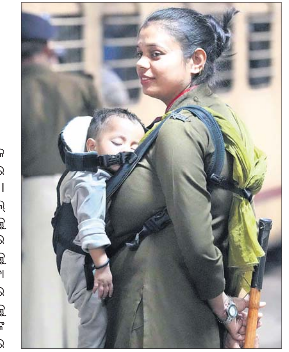
ନୂଆଦିଲ୍ଲୀ ରେଳ ଷ୍ଟେଶନରେ ବର୍ଷକର ପିଲାକୁ ଧରି ଚାଲି କରୁଛନ୍ତି ଆରପିଏସ୍ଏଫ୍ ମହିଳା କର୍ମଚାରୀଙ୍କୁ ରାଜ୍ୟ।

ନୂଆଦିଲ୍ଲୀ ରେଳ ଷ୍ଟେଶନରେ ଶନିବାର ରାତିରେ ଦଳାତକତା ଘଟି ୧୮ ଜଣଙ୍କର ମୃତ୍ୟୁ ଘଟିଥିଲା। ଏହାପରେ ରେଳ ଷ୍ଟେଶନଗୁଡ଼ିକର ସୁରକ୍ଷା ବଢ଼ାଯିବା ସହ ଭିଡ଼ ପରିଚାଳନା ପ୍ରତି ବିଶେଷ ଧ୍ୟାନ ଦିଆଯାଇଥିବା ନେଇ ରେଳଡେପ୍ଟ ପ୍ରୋଟେକ୍ଟିଭ ଫୋର୍ସ (ଆରପିଏଫ୍) ପକ୍ଷରୁ ସୂଚନା ଦିଆଯାଇଥିଲା। ଏହାରି ମଧ୍ୟରେ ନୂଆଦିଲ୍ଲୀ ରେଳ ଷ୍ଟେଶନରେ ରେଳଡେପ୍ଟ ପ୍ରୋଟେକ୍ଟିଭ ସ୍ୱେଚ୍ଛାଳ ଫୋର୍ସ (ଆରପିଏସ୍ଏଫ୍)ର ମହିଳା କର୍ମଚାରୀଙ୍କୁ ରାଜ୍ୟ ଏକ ଭିଡ଼ିଓ ସୋସିଆଲ ମିଡିଆରେ ଭାଇରାଲ ହେବାରେ ଲାଗିଛି। ଏହାରେ ଆରପିଏଫ୍ ଅଧିକାରୀଙ୍କୁ ହ୍ୟାଣ୍ଡେଲରୁ ରାଜ୍ୟ ଭିଡ଼ିଓକୁ ଶେୟାର କରାଯାଇଛି, ଯେଉଁଥିରେ ରାଜ୍ୟ ଡାକ୍ତରୀ ବର୍ଷକର ପିଲାକୁ ଛାତିରେ ଝୁଲାଇ ଚାଲି କରୁଥିବା ନକରକୁ ଆସିଛନ୍ତି। ଉକ୍ତ ଭିଡ଼ିଓରେ ରାଜ୍ୟ ହାତରେ ଏକ ଲାଠି ଧରି ଭିଡ଼ିକୁ ନିୟନ୍ତ୍ରଣ କରୁଥିବାବେଳେ ସେ ଡାକ୍ତରୀ ବର୍ଷକର ଶିଶୁକୁ ଏକ ବେଦି କ୍ୟାରିୟର ସାହାଯ୍ୟରେ ନିଜ ଛାତିରେ ବାନ୍ଧିଛନ୍ତି। ଭିଡ଼ିଓରେ ପିଲାଟି ପୁଞ୍ଜ୍ୟ-୪