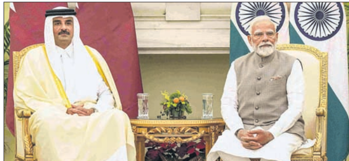
ନୂଆଦିଲ୍ଲୀସ୍ଥିତ ହାଇଡ୍ରାବାଦ ହାଉସ୍‌ରେ ପ୍ରଧାନମନ୍ତ୍ରୀ ନରେନ୍ଦ୍ର ମୋଦି ଏବଂ କତାରର ଅଧିକ ଶେଖ୍ ତମିମ୍ ବିନ୍ ହମ୍‌ଦ୍ ଅଲ୍-ଥାନା ଦ୍ୱିପାକ୍ଷିକ ଆଲୋଚନା କରୁଛନ୍ତି।

ନୂଆଦିଲ୍ଲୀସ୍ଥିତ ହାଇଡ୍ରାବାଦ ହାଉସ୍‌ରେ ମଙ୍ଗଳବାର ପ୍ରଧାନମନ୍ତ୍ରୀ ନରେନ୍ଦ୍ର ମୋଦି କାତାରର ଅଧିକ ଶେଖ୍ ତମିମ୍ ବିନ୍ ହମ୍‌ଦ୍ ଅଲ୍-ଥାନାଙ୍କ ସହ ବିଭିନ୍ନ ପ୍ରସଙ୍ଗରେ ଦ୍ୱିପାକ୍ଷିକ ଆଲୋଚନା କରିଛନ୍ତି। ଏହି ଅବସରରେ ଦୁଇ ଦେଶ ମଧ୍ୟରେ ବାଣିଜ୍ୟ, ନିବେଶ, ଶକ୍ତି, ଚେନ୍ନୋଲୋଜି ଆଦି କ୍ଷେତ୍ରରେ ଅନେକ ସୁନିମାମା ସ୍ୱାକ୍ଷର ହୋଇଛି। ବାଣିଜ୍ୟିକ ଏବଂ ଲୋକ ସମ୍ପର୍କକୁ ଆହୁରି ମଜବୁତ କରିବା ଦିଗରେ ଗଣନୈତିକ ଆଗାଧାରକୁ ବୃଦ୍ଧି କରିବା ପାଇଁ ୨ ନେତା ଗୋର୍ ଦେଇଥିଲେ। ଏହି ଅବସରରେ ଭାରତର ବହିର୍ବ୍ୟାପାର ମନ୍ତ୍ରୀ ଏସ୍