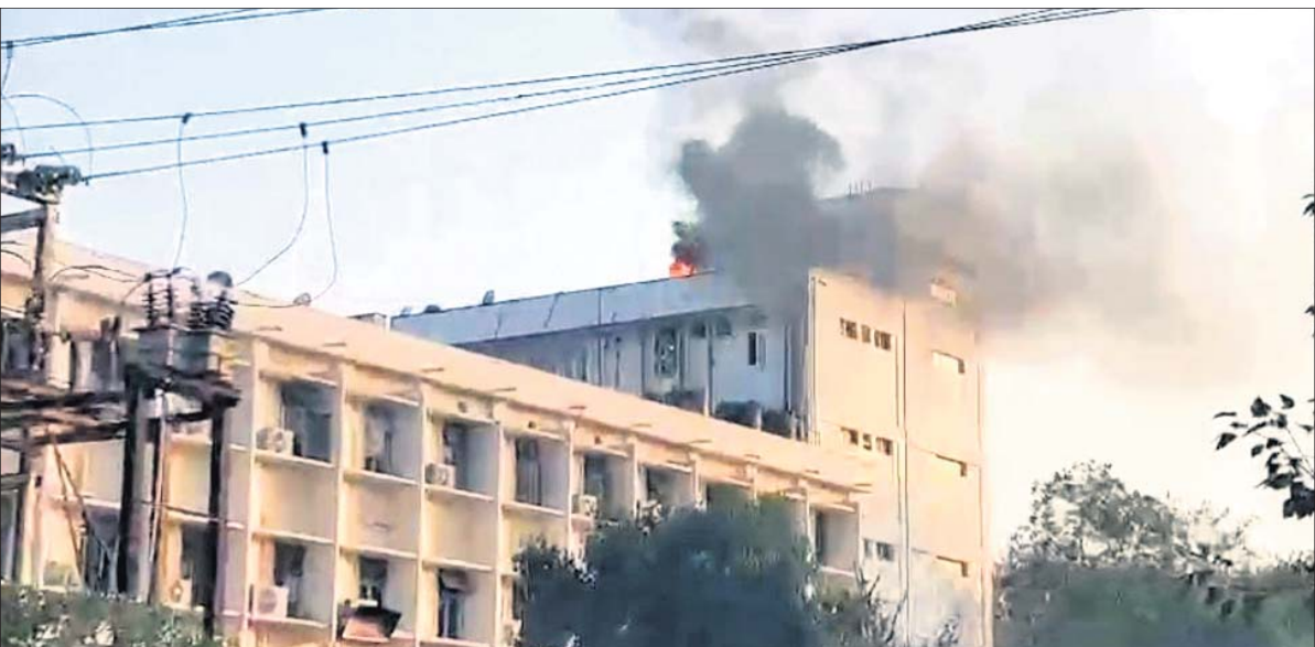
ଲୋକ ସେବା ଭବନର ଆନେକ ବିଲ୍ଡିଂ ପାର୍ଶ୍ୱ କୋଠାର ୫ମ ମହଲା ଛାତ ଉପରେ ମଙ୍ଗଳକାର ଅପରାହ୍ନରେ ଲାଗିଥିବା ନିଆଁ।