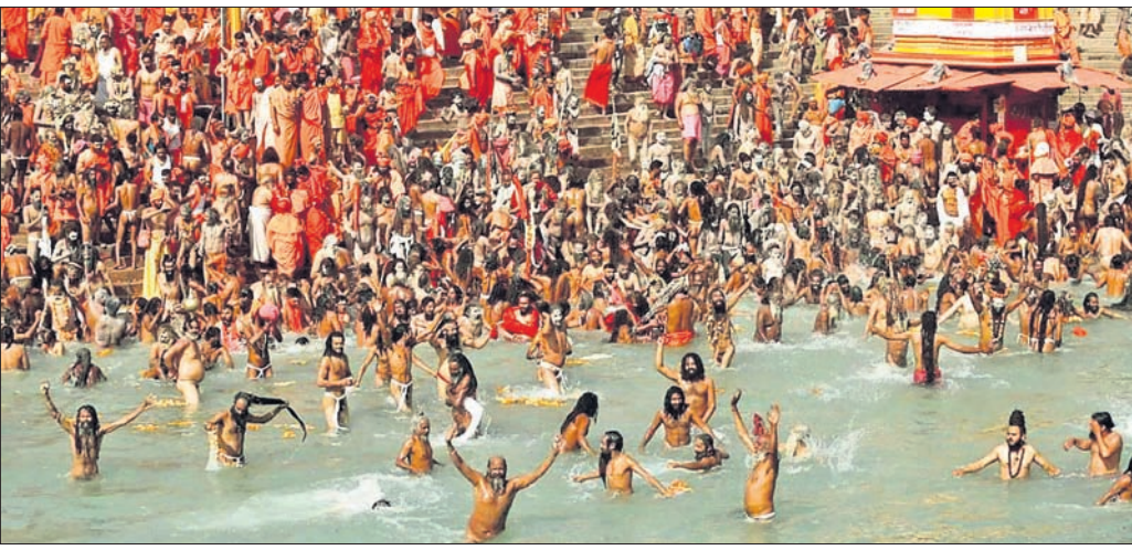
ମହାକୁମ୍ଭ ଅବସରରେ ପ୍ରୟାଗରାଜସ୍ଥିତ ତ୍ରିବେଣୀ ସଙ୍ଗମରେ ଶ୍ରଦ୍ଧାଳୁମାନେ ବୁଡ଼ି ପକାଉଛନ୍ତି।

ପ୍ରୟାଗରାଜରେ ମହାକୁମ୍ଭ ମେଳା ଚାଲିଥିବାବେଳେ ସେଠାର ନଦୀତୀର ଗାଧୋଇବା ପାଇଁ ମଧ୍ୟ ଉପଯୁକ୍ତ ରୁହେଁ ବୋଲି କେନ୍ଦ୍ରୀୟ ପ୍ରଦୂଷଣ ନିୟନ୍ତ୍ରଣ ବୋର୍ଡ (ସିପିସିବି) ସୋମବାର ନ୍ୟାଶନାଲ ଗ୍ରୀନ୍ ଟ୍ରିଭ୍ୟୁନାଲ (ଏନଜିଟି)କୁ ଜଣାଇଛି। ନଦୀତୀରରେ ଅତ୍ୟଧିକ ପରିମାଣରେ ମଲ ବ୍ୟାଜ୍ଞେରିଆ ଭରିରହିଛି। ସ୍ୱେଚ୍ଛେ ପ୍ରଦୂଷଣ ଯୋଗୁ ଜଳରେ ପାହାଳ କୋଲିଫର୍ମ ବ୍ୟାକ୍ଟେରିଆ ଏକ ପ୍ରକାର ଅଶୁଦ୍ଧତା ଯୋଗୁ ମଣିଷ ଏବଂ ପ୍ରାଣୀମାନଙ୍କ ଅନ୍ତରେ ରହିଥାନ୍ତି। ସେମାନଙ୍କ ମଳରେ ଆସି ଉଚ୍ଚ ବ୍ୟାକ୍ଟେରିଆ ପାଣିରେ