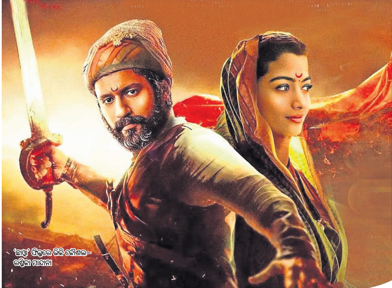
'ଛାଡ଼ା' ଫିଲ୍ମରେ ଭିକି କୌଶଲ-ରଶ୍ମିକା ନାୟା