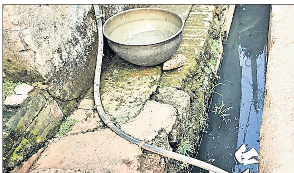
ଆବର୍ଜନାରେ ଭରି ହୋଇଥିବା ଡ୍ରେନ୍।