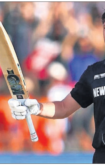
ଶତକ ହାସଲ ପରେ ଉଇକେଟ ଟମ୍ ଲଥାମ ଓ ଫ୍ଲିକ୍ ଯଜ୍ଞ।