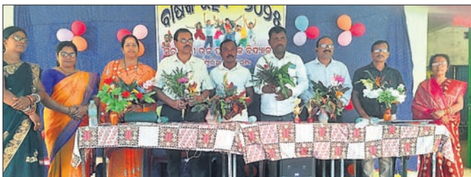
ବାଣିଜ୍ୟରେ ଉପସ୍ଥିତ ଅତିଥିମାନେ।