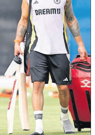
ଅଭ୍ୟାସ ଅବସରରେ ବିରାଟ କୋହଲି।

ପ୍ରସାରଣ: ସ୍ୱାଗତ ସୋର୍ଟ୍ ନେଟୱାର୍କ, ସୋର୍ଟ୍ ୧୮