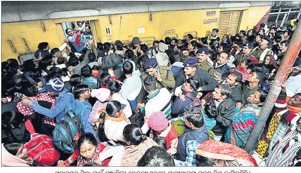
ମହାକୁଳୁସ୍ତ ଯିବା ପାଇଁ ନୂଆଦିଲ୍ଲୀ ରେଳଷ୍ଟେଶନରେ ସାମଗ୍ରୀମାନଙ୍କ ପ୍ରକଳ ଭଡ଼ ଲାଗିରହିଛି।

ନୂଆଦିଲ୍ଲୀ ରେଳଷ୍ଟେଶନରେ ଗତ ୧୫ ତାରିଖରେ ଦଳାଚକଟା ଯୋଗୁଁ ମହାକୁଳୁସ୍ତ ଯିବା ପାଇଁ ବାହାରିଥିବା ୧୮ ଶ୍ରଦ୍ଧାଳୁଙ୍କ ମୃତ୍ୟୁ ଘଟିଥିଲା। ଏହି ମାମଲାରେ ରୁଧିରା ଦିଲ୍ଲୀ ହାଇକୋର୍ଟ ରେଲଓ୍ଵେକୁ ଉର୍ଦ୍ଧନ କରିଛନ୍ତି। ଏକ କୋର୍ଟର ଧାରଣା କ୍ଷମତାଠାରୁ ଅଧିକ ସଂଖ୍ୟକ ଚିକେଟ ସାମଗ୍ରୀମାନଙ୍କୁ କାହିଁକି ବିକ୍ରି କରାଯାଇଥିଲା ବୋଲି ହାଇକୋର୍ଟ ପ୍ରଶ୍ନ କରିଛନ୍ତି। ନୂଆଦିଲ୍ଲୀ ରେଳଷ୍ଟେଶନରେ ଦଳାଚକଟା ପରେ ଭବିଷ୍ୟତରେ ଦେଶର ରେଳଷ୍ଟେଶନଗୁଡ଼ିକରେ ଏଭଳି ଘଟଣା ଏଡ଼ାଇବା ପାଇଁ ସୁରକ୍ଷା ପଦକ୍ଷେପ ସମ୍ପର୍କିତ ଏକ ପ୍ରତିଶ୍ଵର ଦିଲ୍ଲୀ ହାଇକୋର୍ଟରେ ଦାଖଲ ହୋଇଛି। ଇଷ୍ଟ୍ୱେ ଡିକେ ଉପାଧ୍ୟକ୍ଷ ଏବଂ ରୁଷ୍ଟାର ରାଓ ଗେଡେଲଙ୍କୁ ନେଇ ଖଣ୍ଡପୀଠ ଏହାର ଶୁଣାଣି କରି କହିଛନ୍ତି, ଏକ କୋର୍ଟର କେତେ ସଂଖ୍ୟକ ସାମଗ୍ରୀକୁ ବ୍ୟାୟାଜପାରିବ ତାହା ରେଲଓ୍ଵେ ସ୍ଥିର କରିଥାଏ। ଏଭଳି ସ୍ଥିତି ଅଧିକ ସଂଖ୍ୟକ ଚିକେଟ କାହିଁକି ବିକ୍ରି କରାଗଲା? ଦଳାଚକଟା ଘଟିବା ଦିନ ଷ୍ଟେଶନରେ କେତେ ଲକ୍ଷ ସାମଗ୍ରୀ ଥିଲେ ସେନେଇ