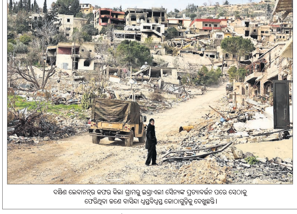
ଦକ୍ଷିଣ ଲେବାନନ୍‌ର କଫର୍ କିଲା ଗ୍ରାମରୁ ଉତ୍ସାଧିକା ସୈନ୍ୟଙ୍କ ପ୍ରତ୍ୟାବର୍ତ୍ତନ ପରେ ସେଠାକୁ ଫେରିଥିବା ଜଣେ ବାସିନ୍ଦା ଧୂସ୍ରବିଧିକୁ କୋଠାଗୁଡ଼ିକୁ ଦେଖୁଛନ୍ତି।