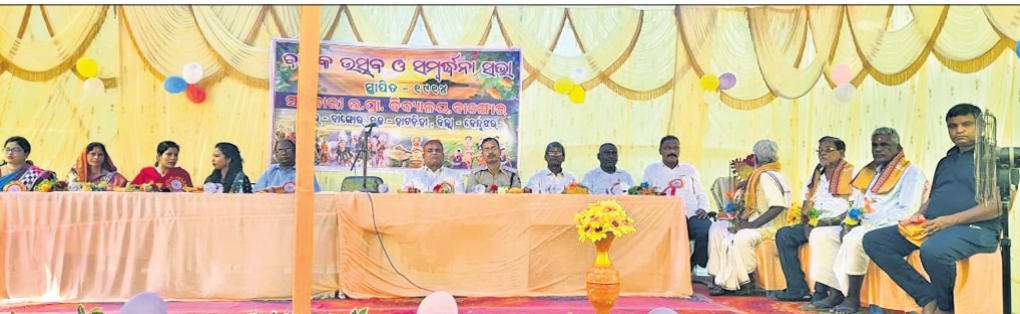
ବାଙ୍ଗୋର ଉ.ପ୍ରା. ବିଦ୍ୟାଳୟର ବାର୍ଷିକୋତ୍ସବରେ ଉପସ୍ଥିତ ଅତିଥି।