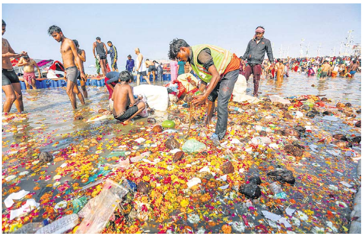
ଉତ୍ତରପ୍ରଦେଶ ପ୍ରଧାନମନ୍ତ୍ରୀଙ୍କ ସଙ୍ଗେ ମୁକ୍ତ ନଦୀ କଳରେ ଜମି ରହିଥିବା ଫୁଲ ଓ ଅନ୍ୟାନ୍ୟ ପୂଜା ସାମଗ୍ରୀର ବର୍ଷାଗୁଡ଼ିକୁ ଚୁପ୍‌ବାର ବାହାର କରାଯାଇଛି।

ଗୁରଜାତ୍ରାଙ୍କ ଗୋଳରେ ଭାରତ ବିଜୟୀ କଳିଙ୍ଗ ଖାତିୟମରେ ଚାଲିଥିବା ଏଫ୍ଆଇଏଚ୍ ଫ୍ରେଣ୍ଡ୍ ଲିଗର ଚୁପ୍‌ବାର ମ୍ୟାଚରେ ଗୁରଜାତ୍ରା ସିଂଗ ଗୋଳ ବଳରେ ଭାରତ ୧-୦ ଗୋଳରେ ଜର୍ମାନୀକୁ ପରାସ୍ତ କରିଛି।