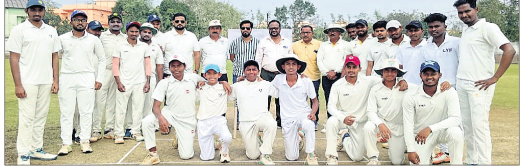
ଅତିଥିଙ୍କ ସହ ଖେଳାଳିମାନେ।