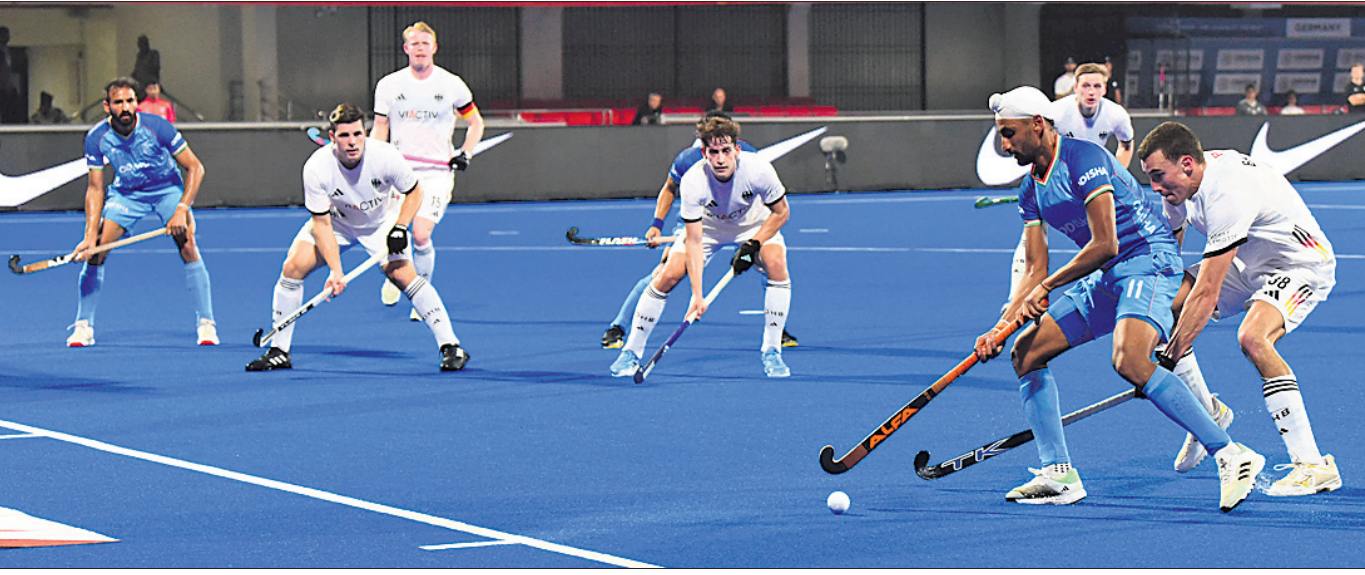
କଳିଙ୍ଗ ଷ୍ଟାଡ଼ିୟମରେ ଚାଲିଥିବା ଏଫଆଇଏଚ୍ ପ୍ରୋ ଲିଗ୍ରେ ଚୁଧବାର ଭାରତ ଓ ଜର୍ମାନୀ ମଧ୍ୟରେ ଅନୁଷ୍ଠିତ ମ୍ୟାଚର ଏକ ସଂଘର୍ଷପୂର୍ଣ୍ଣ ମୁହୂର୍ତ୍ତ।