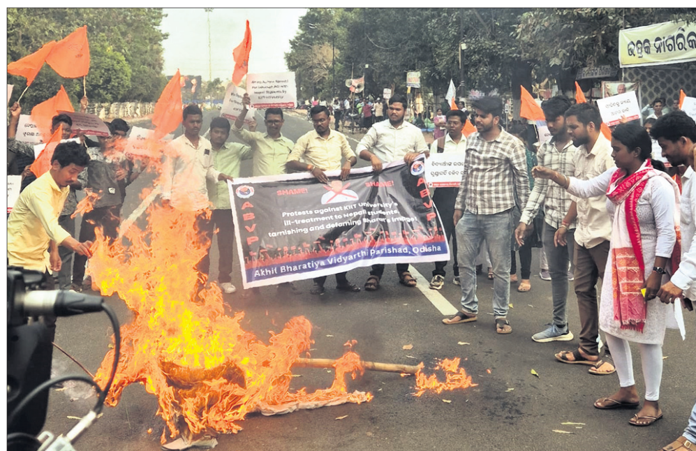
କିଏ ବିଶ୍ୱବିଦ୍ୟାଳୟରେ ନେପାଳୀ ଛାତ୍ରୀଙ୍କ ମୃତ୍ୟୁ ଓ ଆନ୍ଦୋଳନର ଛାତ୍ରୀଛାତ୍ରଙ୍କୁ ଆକ୍ରମଣ ଘଟଣାକୁ ନେଇ ରୁଧିରୀ ମାଷ୍ଟରଙ୍କାଣ୍ଡରେ ସିପିଆଇ(ଏମ୍‌ଏଲ୍) ପକ୍ଷରୁ ବିରୋଧ ପ୍ରଦର୍ଶନ କରାଯାଇ ଏବଂ ଏକିଭିପି ପକ୍ଷରୁ ଲୋୟର ପିଏମ୍‌ଜିଠାରେ କିଏ ପ୍ରତିଷ୍ଠା ଅତ୍ୟୁତ ସାମଗ୍ରୀକୁ ଗୁଣପୁରୁଣିକା ଦାହ କରାଯାଇଛି।