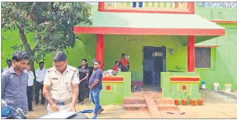
ଘଟଣାସ୍ଥଳରେ ଡ୍ରୁଗ୍ସିଙ୍ଗା ପୋଲିସ୍ ତଦନ୍ତ କରୁଛି।

କାମାକ୍ଷାନଗର, ୨୦୧୨ (ସୁଭାସ ପରିଡ଼ା) ରାତିରେ ପରିବାର ଲୋକଙ୍କ ସହ ଘରେ ଶୋଇଥିଲେ ପ୍ରଧାନଶିକ୍ଷୟିତ୍ରୀ। ହେଲେ ସକାଳୁ ତାଙ୍କ ମୃତଦେହ ଘର ବାହାରେ ଥିବା ଗ୍ୟାରେଜ୍‌ରେ ପଡ଼ିଥିଲା। ଗ୍ୟାରେଜ୍ ଘର ବାହାରୁ ତାଲା ପଡ଼ିଥିବା ବେଳେ ପ୍ରଧାନଶିକ୍ଷୟିତ୍ରୀଙ୍କ ବେକରେ କଳା ଦାଗ ରହିଛି। ତେଣୁ ରାତିରେ କେହି ତାଙ୍କୁ ବାହାରକୁ ଡାକି ତତ୍ପରିପି ହତ୍ୟା କରିଥିବା ସନ୍ଦେହ କରୁଛନ୍ତି ପରିବାର ଲୋକେ। ସମ୍ପୂର୍ଣ୍ଣ ପ୍ରଧାନଶିକ୍ଷୟିତ୍ରୀ ହେଉଛନ୍ତି ଡେକାନାଲ ଲିଲା ଡ୍ରୁଗ୍ସିଙ୍ଗା ଥାନା ଗୁନେଇବିଲି ଗ୍ରାମର ପ୍ରଭାତୀ ଦେବୁରୀ। ସେ ଡ୍ରୁଗ୍ସିଙ୍ଗା ଗ୍ରାମ ପଞ୍ଚସଖା ସରକାରୀ ଉଚ୍ଚ ବିଦ୍ୟାଳୟରେ କାର୍ଯ୍ୟରତ ଥିଲେ। ଘଟଣା ସମ୍ପର୍କରେ ପ୍ରଧାନଶିକ୍ଷୟିତ୍ରୀଙ୍କ ଶ୍ୱଶୁର ଧେଡ଼ିଆ ପଧାନ ଥାନାରେ ହତ୍ୟା ଅଭିଯୋଗ କରିବା ପରେ ଡ୍ରୁଗ୍ସିଙ୍ଗା ପୋଲିସ୍ ଓ ସାଇଣ୍ଟିଫିକ୍ ଟିମ୍ ଘଟଣାସ୍ଥଳରେ ପହଞ୍ଚି ତଦନ୍ତ ଚଳାଇଛି। ସୁତନା ଅନୁଯାୟୀ, ଡ୍ରୁଗ୍ସିଙ୍ଗା ଥାନା ଗୁନେଇବିଲି ଗ୍ରାମର ପ୍ରଭାତୀଙ୍କ ସ୍ୱାମୀ ୨ବର୍ଷ ତଳେ ପ୍ରାଣ ହରାଇଥିବା ବେଳେ ତାଙ୍କର ଗୋଟିଏ ଝିଅ ଓ ପୁଅ ଅଛନ୍ତି। ବୁଧବାର ରାତିରେ ପୁଅ, ଝିଅ, ଶ୍ୱଶୁର ଓ ଜଣେ ଦିବ୍ୟାଙ୍କ ଦିଅରଙ୍କ ସହ