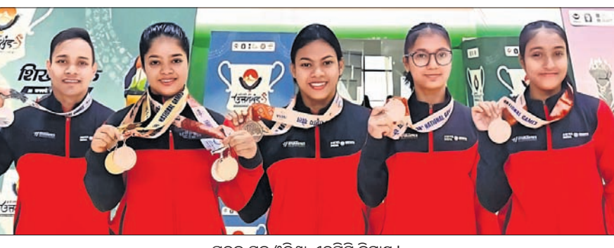
ପଦକ ସହ ଓଡ଼ିଶା ଏର୍ପିସି ଜିମ୍ନାଷ୍ଟ।

ଭୁବନେଶ୍ୱର, ୨୦୧୨ (ଅନାଦି କର) ଉତ୍ତରାଖଣ୍ଡର ଡେରାଡୁନରେ ଗତ ୮ ରୁ ୧୩ ତାରିଖ ପର୍ଯ୍ୟନ୍ତ ଅନୁଷ୍ଠିତ ୩୮ତମ ନ୍ୟାଶନାଲ୍ ଚେମ୍ପିୟନ୍ସ ଓଡ଼ିଶା ଜିମ୍ନାଷ୍ଟଙ୍କୁ ହାଇ-ପର୍ଫରମାନ୍ସ ସେକ୍ଟର (ଜିଏର୍ପିସି)ର ଜିମ୍ନାଷ୍ଟଙ୍କୁ ଉଲ୍ଲେଖନୀୟ ସଫଳତା ମିଳିଛି। ପ୍ରତିଯୋଗିତାରେ ଜିଏର୍ପିସିର ୧୨ ଜିମ୍ନାଷ୍ଟ ବିଭିନ୍ନ କ୍ୟାଟେଗୋରିରେ ଭାଗ ନେଇଥିବା ବେଳେ ସେମାନଙ୍କ ମଧ୍ୟରୁ ୬ ଜଣ ୧୧ ପଦକ ଜିତିଛନ୍ତି। ଏହି ପଦକ ତାଲିକାରେ ୬ଟି ସ୍ୱର୍ଣ୍ଣ, ୨ଟି ରୌପ୍ୟ ଓ ୩ଟି ବ୍ରୋଞ୍ଜ ରହିଛି। ଓଡ଼ିଶା ପକ୍ଷରୁ ପ୍ରତିନିଧିତ୍ୱ କରୁଥିବା ଓମେନ ଆର୍ଟିଷ୍ଟିକ