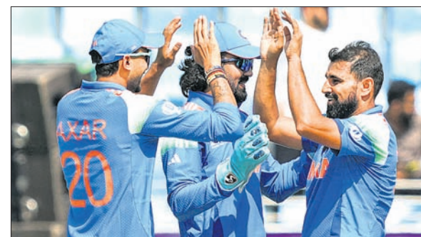
ଉଇକେଟ ହାସଲ ପରେ ମହମ୍ମଦ ଶାମିଙ୍କୁ ସାଥୀ ଖେଳାଳି ବଧୈର କଣାଉଛନ୍ତି।

ଭୁବନେଶ୍ୱର, ୨୦୧୨ (ପି.ଟି.) ବାଲାଦେଶ ବିପକ୍ଷ ଚାମ୍ପିୟନ୍ସ ଟ୍ରଫି ମ୍ୟାଚରେ ଷ୍ଟାର ପେସର ମହମ୍ମଦ ଶାମି ଦିନିକିଆ କ୍ରିକେଟରେ ଦ୍ରୁତ ୨୦୦ ଉଇକେଟ ପୁରଣ କରିଛନ୍ତି। ଗୁରୁବାର ଖେଳାଯାଇଥିବା ମ୍ୟାଚରେ ୫ ଉଇକେଟ ସଫଳତା ହାସଲ କରିବା ସହ ସେ ଏହି କାର୍ତ୍ତିମାନ ନିଜ ନାମରେ କରିଛନ୍ତି। ୩୪ ବର୍ଷୀୟ ଶାମି କ୍ୟାରିୟରର ୧୦୪ତମ ମ୍ୟାଚରେ ଏହି ମାଇଲଖୁଣ୍ଟରେ ପହଞ୍ଚିଛନ୍ତି। ତାଙ୍କ ପୂର୍ବରୁ ଏହି ରେକର୍ଡ ଭାରତର ପୂର୍ବତନ ପେସର ଅଜିତ ଅଗରକରଙ୍କ ନାମରେ ଥିଲା। ସେ କ୍ୟାରିୟରର ୧୩୩ତମ ମ୍ୟାଚରେ ୨୦୦ ଉଇକେଟ ଅର୍ଜନ କରିଥିଲେ। ତେବେ ଶାମି ଅଷ୍ଟମ ଭାରତୀୟ ଭାବେ ଦିନିକିଆ କ୍ରିକେଟରେ ୨୦୦ ଉଇକେଟ ଅକ୍ତିଆର କରିଛନ୍ତି। ଏତଦ୍ ବ୍ୟତୀତ ୫୦ ଓଭରୀଆ ଆଇସିସି ଇଭେଣ୍ଟରେ ଶାମି ଭାରତ ପାଇଁ ସର୍ବାଧିକ ଉଇକେଟ ନେବାର ରେକର୍ଡ ନିଜ ନାମରେ କରିଛନ୍ତି। ଦିନିକିଆ ବିଶ୍ୱକପ ଓ ଚାମ୍ପିୟନ୍ସ ଟ୍ରଫିକୁ ମିଶାଇ ଶାମି ମୋଟ ୬୦ ଉଇକେଟ ନେଇଛନ୍ତି। ଏହି ରେକର୍ଡ ପୂର୍ବରୁ ଜାହିର ଖାନ୍ଙ୍କ ନାମରେ ଥିଲା। ସେ ୫୯ ଉଇକେଟ ନେଇଥିଲେ। ଏହି ତାଲିକାରେ ଜାଭାଲ ଶ୍ରୀନାଥ (୪୭) ଓ ରବୀନ୍ଦ୍ର ଜାଡେଜା (୪୩) ରହିଛନ୍ତି।