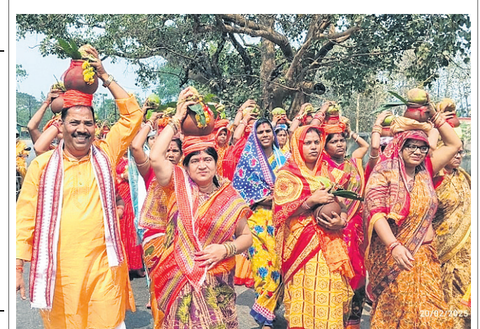
ନୟାଗଡ଼ ବୁକ୍ ଉତ୍ସାହୀନମାନେ ଶିଳିଡି ସାଲ ମନ୍ଦିର ଓ ନୂତନ ବିଗ୍ରହ ପ୍ରତିଷ୍ଠା ଉତ୍ସବରେ ଗୁରୁବାର ଆୟୋଜିତ କଳସ ଶୋଭାଯାତ୍ରାରେ ସାମିଲ ହୋଇଥିବା ଶ୍ରଦ୍ଧାଳୁ ।