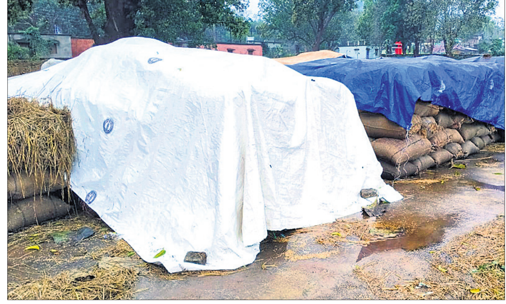
ବର୍ଷାରେ ଭିଜିଥିବା ଧାନବସ୍ତ୍ରାକୁ ଦୋହାଇ ରଖାଯାଇଛି ।