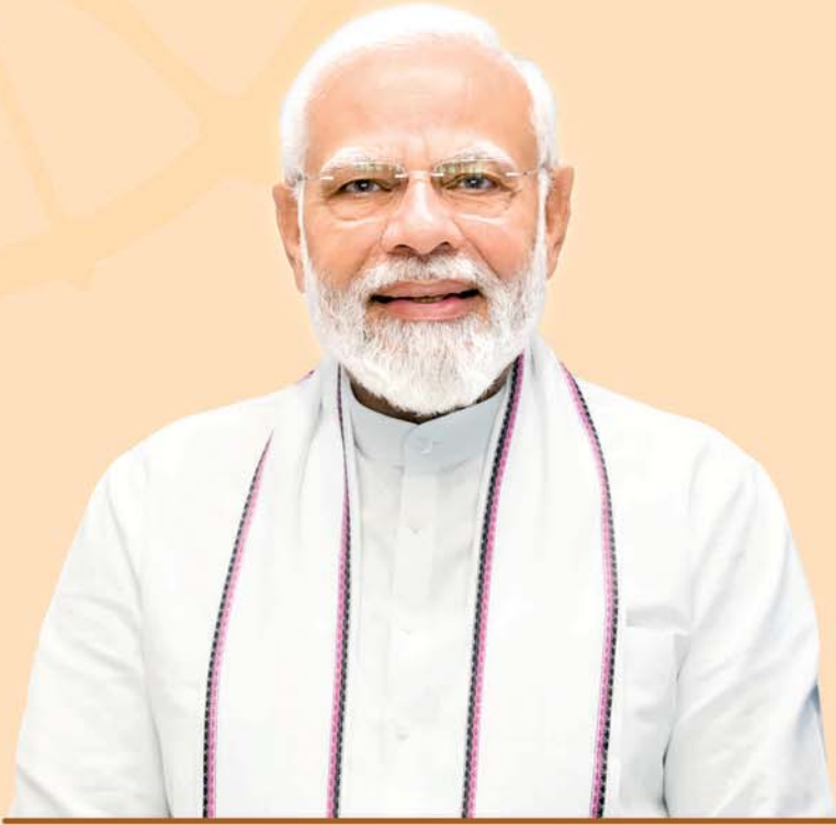
ଶ୍ରୀ ନରେନ୍ଦ୍ର ମୋଦୀ ପ୍ରଧାନମନ୍ତ୍ରୀ