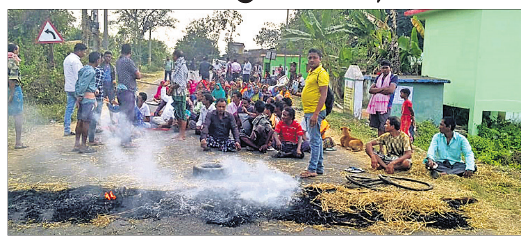
ଖଇରପଟି ମହାଦେବ ମନ୍ଦିର ସମ୍ମୁଖରେ ରାସ୍ତାରେକୋ କରାଯାଇଛି ।