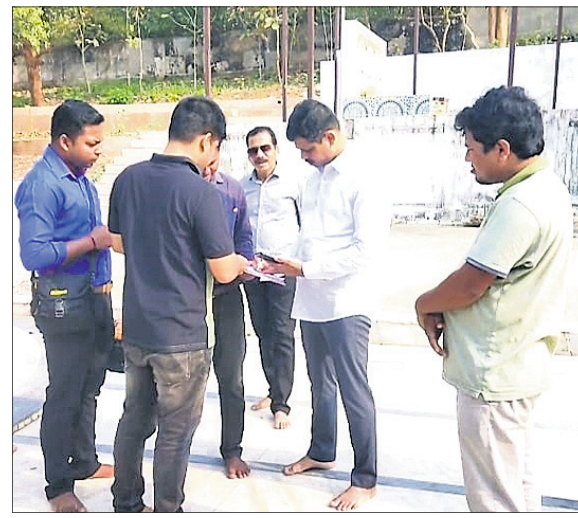
ରୁଧିରା ରାତିରେ ନୟାଗଡ଼ ପୁରୁଣା ସହରସ୍ଥିତ ଜଗନ୍ନାଥ ମନ୍ଦିରରୁ ଚୋରି ପରେ ମନ୍ଦିର ପରିସର ଶୁନଶାନ, ଦକ୍ଷିଣ ଦ୍ୱାର କବାଟ କଢ଼ା କରାଯାଇଛି ଓ ପୋଲିସ୍ ଏବଂ ପ୍ରଶାସନିକ ଅଧିକାରୀମାନେ ସ୍ଥିତି ଅନୁଧ୍ୟାନ କରୁଛନ୍ତି ।