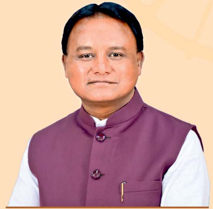
ଶ୍ରୀ ମୋହନ ଚରଣ ମାଝୀ ମୁଖ୍ୟମନ୍ତ୍ରୀ, ଓଡ଼ିଶା