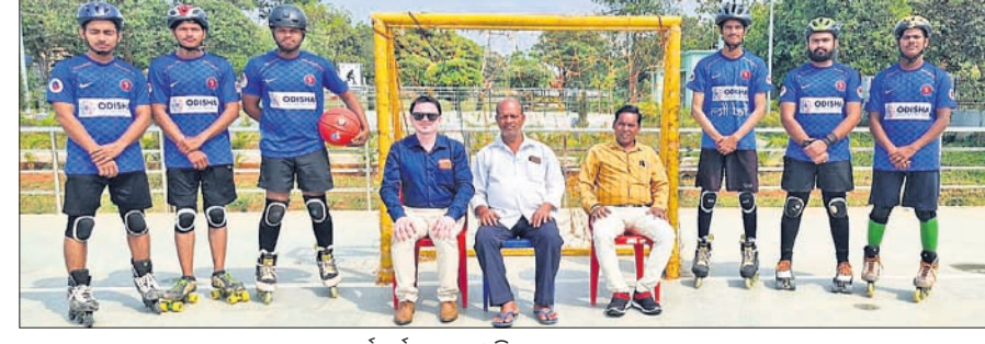
କର୍ମକର୍ତ୍ତାଙ୍କ ସହ ଓଡ଼ିଶା ରୋଲ୍‌ବଲ୍ ଦଳ।

ଭୁବନେଶ୍ୱର, ୨୦୧୨ (ତପନ ସାଲ୍) ଚାମ୍ପିୟନଶିପ୍ ଟ୍ରିଟିଓରେ ୨୧ତମ ଜାତୀୟ ସିନିୟର ରୋଲ୍ ବଲ୍ ଚାମ୍ପିୟନଶିପ୍ ୨୨ ତାରିଖରୁ ଆରମ୍ଭ ହେବ। ୨୫ ପର୍ଯ୍ୟନ୍ତ ଚାଲିବାରୁ ଥିବା ଏହି ସମ୍ମାନଜନକ ପ୍ରତିଯୋଗିତା ପାଇଁ ଗୁରୁବାର ଓଡ଼ିଶା ଦଳ ଯୋଗ୍ୟ କରାଯାଇଛି। ଅଭିଜିତ