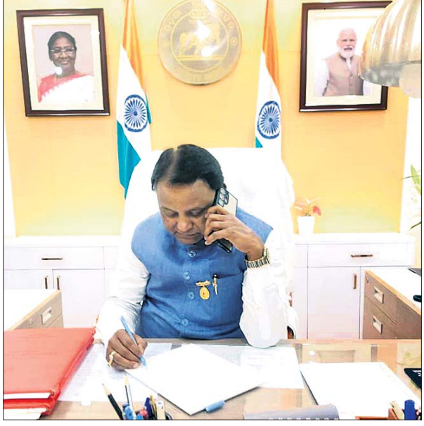
କିଏ ଘଟଣା ସମ୍ପର୍କରେ ଶନିବାର ଲୋକସଭା ଭବନରେ ମୁଖ୍ୟମନ୍ତ୍ରୀ ମୋହନ ଚରଣ ମାଝୀ ନେପାଳ ବୈଦେଶିକ ବ୍ୟାପାର ମନ୍ତ୍ରୀ ଆର୍ଜୁନ ରାୟଙ୍କ ସହ ପୋର୍ଟ ଯୋଗେ ଆଲୋଚନା କରୁଛନ୍ତି।

■ ଦୋଷୀଙ୍କ ବିରୋଧରେ ହେବ ଦୃଢ଼ କାର୍ଯ୍ୟାନୁଷ୍ଠାନ: ମୋହନ ■ ନେପାଳ ବୈଦେଶିକ ବ୍ୟାପାର ମନ୍ତ୍ରୀଙ୍କ ସହ ମୁଖ୍ୟମନ୍ତ୍ରୀ ଆଲୋଚନା କଲେ ■ ରାଜ୍ୟ ସରକାର ଶୀଘ୍ର ପଦକ୍ଷେପ ନେଇଛନ୍ତି: ନେପାଳ ଅଧିକାରୀ