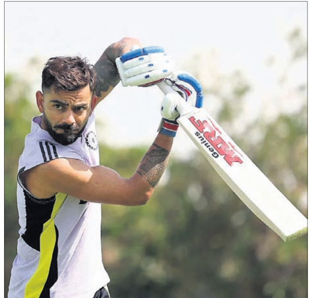
ଭୁବନେଶ୍ୱରରେ ଶନିବାର ଅଭ୍ୟାସ ଅବସରରେ ଭାରତର ବିରାଟ କୋହଲି ଓ ପାକିସ୍ତାନର ବାବର ଆଜମ।

ଚଳିତ ଆଇସିସି ଚାମ୍ପିୟନ୍ସ ଟ୍ରଫିର ସବୁଠାରୁ ହେତୁକେ ଲକ୍ଷ୍ୟ ଭାରତ-ପାକିସ୍ତାନ ମୁକାବିଲା ରବିବାର ଅନୁଷ୍ଠିତ ହେବ। ଏଥିପାଇଁ ଦୁଇ ଦଳ ଗୁଡ଼ିକର ଶ୍ରେଣୀଗତ ପ୍ରସ୍ତୁତ। ଉଭୟ ଦଳର ଗୁଡ଼ିକର ପ୍ରୋମିସ୍ କରାଯାଇ ନାହିଁ ନ ଥିବା ଉଦ୍ଦେଶ୍ୟ। ଏଥିରେ ବିଜୟ ହୋଇ ରୋହିତ ଶର୍ମାଙ୍କ ନେତୃତ୍ୱାଧୀନ ଦଳ ସେମିତି ଲକ୍ଷ୍ୟ ଲକ୍ଷ୍ୟ ରଖି। ମହମ୍ମଦ ରିଜ୍ୱାନଙ୍କ ପାକିସ୍ତାନ ଦଳ ପାଇଁ ଏହି ମ୍ୟାଚ ଅତ୍ୟନ୍ତ ଗୁରୁତ୍ୱପୂର୍ଣ୍ଣ। କାରଣ ଭାରତ ନିକଟରୁ ହାରିଲେ ଦଳର ସେମିତି ଲକ୍ଷ୍ୟ ଲକ୍ଷ୍ୟ ପ୍ରବେଶ ଆଶା ଯାଏ ହୋଇଥାଏ। ତେଣୁ ଦୁଇ ଦଳରୁ ଶାନ୍ତ ଦିବାକୁ ଏଡ଼ାଇବା ପାଇଁ ଏହି ଦଳ ନିଶ୍ଚିତ ଚେଷ୍ଟା କରିବ। ବ୍ୟାଲଦେଶ ବିପକ୍ଷରେ ଯୁଦ୍ଧରେ ବିଜୟ ଫଳରେ ଭାରତର ମନୋବଳ ବହୁ ଉଚ୍ଚରେ ରହିଛି। ଅନ୍ୟପକ୍ଷରେ ଲକ୍ଷ୍ୟ ଲକ୍ଷ୍ୟରେ ୬୦ ରନରେ ହାରିବାପରେ ପାକିସ୍ତାନ ଆଶଙ୍କା ମଧ୍ୟରେ ରହିଛି।