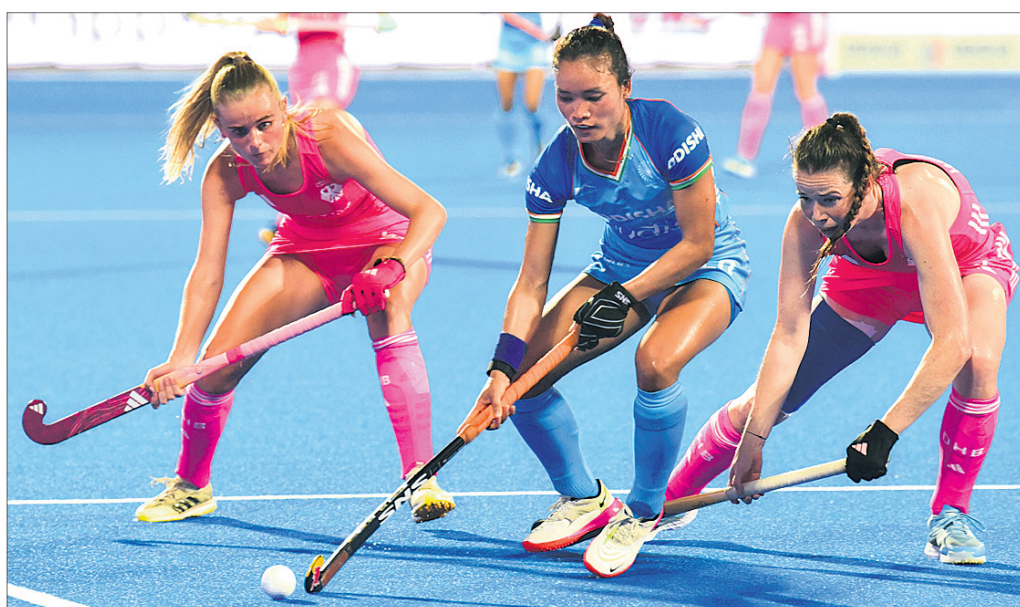
ଏସ୍ଆଇଏଚ୍ ପ୍ରେ ଲିଗ୍ରେ ଶନିବାର ଭାରତ ଓ ଜର୍ମାନୀ ମଧ୍ୟରେ ଅନୁଷ୍ଠିତ ମହିଳା ହକି ମ୍ୟାଚ।

ସ୍ଥାନୀୟ କଳିଙ୍ଗ ଷ୍ଟାଡ଼ିୟମରେ ଚାଲିଥିବା ଏସ୍ଆଇଏଚ୍ ପ୍ରେ ଲିଗ୍ରେ ଶନିବାର ଭାରତୀୟ ମହିଳା ଓ ପୁରୁଷ ଦଳ ବିଜୟ ହାସଲ କରିଛି। ଏକ ରଟର୍ ଲେଗ୍ ମ୍ୟାଚରେ ଭାରତୀୟ ମହିଳା ଦଳ ଜର୍ମାନୀକୁ ୧-୦ ଗୋଲରେ ହରାଇ ଦେଇଛି। ୧୨ଶ ମିନିଟ୍ରେ ମିଳିଥିବା ପେନାଲ୍ଟି କର୍ନରକୁ ବିଜୟପୁତ୍ରକ ଗୋଲ୍ଡିକୁ ଘୋର କରିଥିଲେ ତାରକା ଦ୍ରାଗ୍ ଫୁଲର ଦାପିକା। ୬ ମ୍ୟାଚରୁ ବିପକ୍ଷ ମ୍ୟାଚରେ ଲେଗ୍ ସିନର ବିଶାଦ ହୋଇଥିବାବେଳେ ଆଉଟ ହୋଇଥିଲେ। ଦିନିଆଁରେ ଲଗାତର ସ୍ପଷ୍ଟ ଧର ପାଇଁ ସେ ସିନରକ ବିପକ୍ଷରେ ଆଉଟ ହୋଇଥିଲେ। ପାକିସ୍ତାନ ବିପକ୍ଷ ମ୍ୟାଚରେ କୋହଲିଙ୍କୁ ଅବରୋ ଅହମ୍ମଦ, ଖୁମ୍ପାନ ଶାହା ଓ ସଲମାନ ଆଘାଙ୍କ ଭଳି ସିନରକ ସମ୍ମୁଖୀନ ହେବାକୁ ପଡ଼ିବ। ତେବେ ଶାହିନ ଶାହା ଆପ୍ରିବା, ହାରିବ ରୋପ୍ ଓ ନସିମ ଶାହାଙ୍କୁ ଅନୁକ ରଞ୍ଜନ, ଶ୍ରୀଧାର୍ ପଲ୍, ଅମିତ ସୁନା, ମରୋକୁ ପ୍ରଶାନ୍ତ, ଶଶାଙ୍କ ମାଲହୋତ୍ରା, ବଲଫ୍ରିଜ୍ କୁମାର, ରାହୁଲ ରାମାଉଦ, ରୋନିତ ମିତ୍ର ଓ ପ୍ରଶାନ୍ତ ସିଂ। ଷ୍ଟାଣ୍ଡବାଲ: ଶ୍ଲୋକ କୁମାର, ନିଜୋପ୍ କ୍ରପାପ, ମହମ୍ମଦ ଅଫଜଲ, ପରେ ଗ୍ରାଉଣ୍ଡରୁ ଯାଇଥିଲେ। ନେତୃତ୍ୱରେ ସେ ପ୍ରାୟତଃ ସିନର ବିପକ୍ଷରେ ବ୍ୟାଟିଂ କରିଥିଲେ।