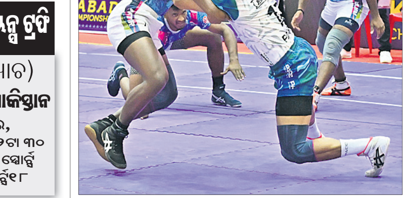
କଟକରେ ଚାଲିଥିବା ଜାତୀୟ କବାଡ଼ିରେ ଶନିବାର ରେଲଫ୍ରେ-କର୍ନାବଳ ମ୍ୟାଚର ଏକ ସଂଘର୍ଷପୂର୍ଣ୍ଣ ମୁହୂର୍ତ୍ତ। (ଫଟୋ:ରାଜକିଶୋର ମହାନ୍ତି)।

କରିଥିବା ଆଶା କରିବେ ନିଶ୍ଚିତ। ଲକ୍ଷ୍ୟ ଲକ୍ଷ୍ୟରେ ବିପକ୍ଷରେ ଶାହିନ ଶାହା ଆପ୍ରିବାକ ନେତୃତ୍ୱାଧୀନ ଦଳର ବୋଲି ଆକ୍ରମଣ ପ୍ରଭାବୀ ହୋଇ ନ ଥିଲା। ଅନ୍ୟପକ୍ଷରେ ଫିର୍ ହୋଇ ଦଳକୁ ଫେରୁଥିବା ମହମ୍ମଦ ଖାମିସ୍ ନେତୃତ୍ୱରେ ଭାରତୀୟ ବୋଲି ବାହିନୀ ଗତ ମ୍ୟାଚରେ ଚମତ୍କାର ପ୍ରଦର୍ଶନ କରିଥିଲା। ନିଜେ ଶାମି ୪ ଉଇକେଟ ନେଇ ବିପକ୍ଷ ଦଳ ଗୁଡ଼ିକୁ ସତେଜ କରାଇ ଦେଇଥିଲେ। ଆଇସିସିର ବଡ଼ ଚୁନାବଣ ଗୁଡ଼ିକରେ ଅଲରାଉଣ୍ଡର ହାର୍ଡିକ ପାଣ୍ଡା ଉପରେ ସ୍ୱତଃ ନଜର ରହିବ। ଗୁରୁତ୍ୱପୂର୍ଣ୍ଣ ୯୦ ବଲକୁ ୬୪ ରନ ସମାଲୋଚନା