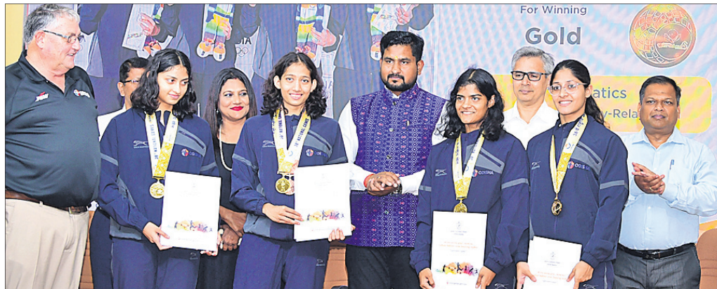
କ୍ରୀଡ଼ାମନ୍ତ୍ରୀ ସୂର୍ଯ୍ୟବଂଶୀ ସୁରଜ ଜାତୀୟ କ୍ରୀଡ଼ାରେ ପଦକ ବିଜୟୀ ଓଡ଼ିଶା ମହିଳା ସରକାରଙ୍କୁ ପୁରସ୍କୃତ କରୁଛନ୍ତି।