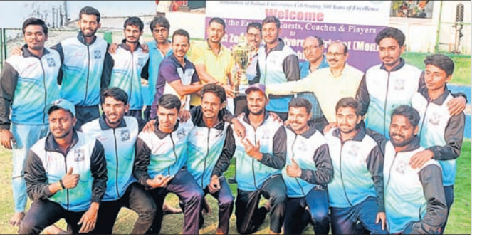
ଭିଜି ଟ୍ରଫି ପାଇଁ ମନୋନୀତ ପୂର୍ବାଞ୍ଚଳ କ୍ରିକେଟ ଦଳ।