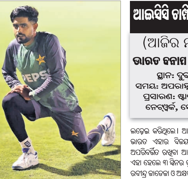
ଭୁବନେଶ୍ୱରରେ ଶନିବାର ଅଭ୍ୟାସ ଅବସରରେ ଭାରତର ବିରାଟ କୋହଲି ଓ ପାକିସ୍ତାନର ବାବର ଆଜମ।

ଭାରତୀୟ କପ୍ତାନ ରହିଥାଏ। ତେଣୁ ଶ୍ରେଣୀ ପ୍ରଦର୍ଶନ ପାଇଁ ଉଭୟ ଦଳର ଖେଳାଳି ଅତିରିକ୍ତ ଚାପର ବଶବର୍ତ୍ତୀ ହୋଇଥାନ୍ତି। ଚିନ୍ତା ଲକ୍ଷ୍ୟ ଆଧୁନାତନ ରୋହିତ ଶର୍ମା ଫର୍ମକୁ ଫେରୁଥିବା ସୂଚନା ମିଳିଛି। ଚନ୍ଦ୍ର ଅର୍ଦ୍ଧରେ ଚାକର ଦ୍ରୁତ ୪୧ ରନ ଭାରତକୁ ୨୨୯ ରନ ଚେକ୍ କରିବାରେ ବିଶେଷ ସହାୟକ ହୋଇଥିଲା। ଶୁବମନ ରିଲ୍ଲ ଟମ୍ ଦିନିଆଁ ଶତକ ହାସଲ କରି ଭାରତୀୟ ବ୍ୟାଟିଂର ମୋଡୁରୁ ସୂଚକ ହୋଇଥିଲା। ଅନ୍ୟପକ୍ଷରେ ୩୨୦ ରନ ବିଜୟ ଲକ୍ଷ୍ୟକୁ ପିଛା କରୁଥିବାବେଳେ ବାବର ଆଜମଙ୍କ ୯୦ ବଲକୁ ୬୪ ରନ ସମାଲୋଚନା