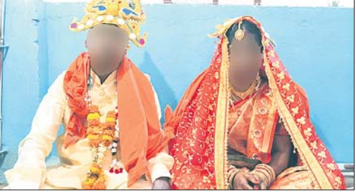
ମନ୍ଦିରରେ ବିବାହ କରିଥିବା ବର ଓ କନ୍ୟା।

ଶାଶୁଘର, ବାପଘର ଲୋକଙ୍କ ଉପସ୍ଥିତିରେ ଥାନାରେ ହେଲା ଚତୁର୍ଥୀ ପିଣ୍ଡ