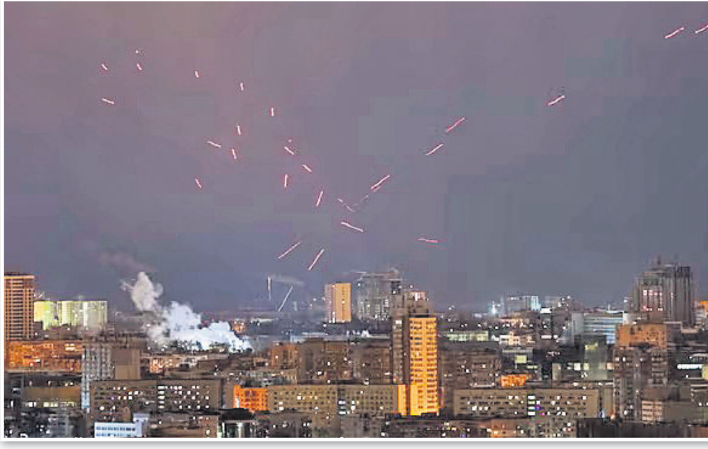
କିଭରେ ଡ୍ରୋନ୍ ଆକ୍ରମଣକୁ ପ୍ରତିହତ କରିଛନ୍ତି ୟୁକ୍ରେନୀୟ ସୈନ୍ୟ।

ପଶ୍ଚିମ ଆଫ୍ରିକୀୟ ଦେଶଗୁଡ଼ିକୁ ରପ୍ତାନି ହେଉଥିବା ଯନ୍ତ୍ରଣା ଉପଶମକାରୀ ଔଷଧରେ ଅଣଅନୁମୋଦିତ କମିନେଶନ (ନିଶ୍ଚଳ) ଯୋଗୁଁ ସେଠାରେ ଓପିଓଇଡ୍ ସଙ୍କଟ ବଢ଼ାଉଥିବା ଖବର ପ୍ରକାଶ ପାଇଥିଲା। ଫଳରେ ଗାସପିଆଡୋଲ୍ ଏବଂ କାରିସୋପ୍ରୋଡୋଲ୍ ଔଷଧର ସମସ୍ତ କମିନେଶନର ଉପାଦାନ ଓ ରପ୍ତାନିକୁ ଭାରତର ଔଷଧ ମହାନିୟନ୍ତ୍ରକ (ଡିସିଜିଆଇ) ବନ୍ଦ କରିଛନ୍ତି। ସମସ୍ତ ରପ୍ତାନି ଫେରାଇଆଣିବା ସହ ୨ ଔଷଧର ନିକଟ ଉପାଦାନ ପାଇଁ ଅନୁମତି ପ୍ରତ୍ୟାହାର କରିନେବାକୁ ଡିସିଜିଆଇ ରାଜ୍ୟ ଓ କେନ୍ଦ୍ରଶାସିତ ଅଞ୍ଚଳଗୁଡ଼ିକର ଔଷଧ ନିୟନ୍ତ୍ରକ କର୍ତ୍ତୃପକ୍ଷକୁ ନିର୍ଦ୍ଦେଶ ଦେଇଛନ୍ତି।