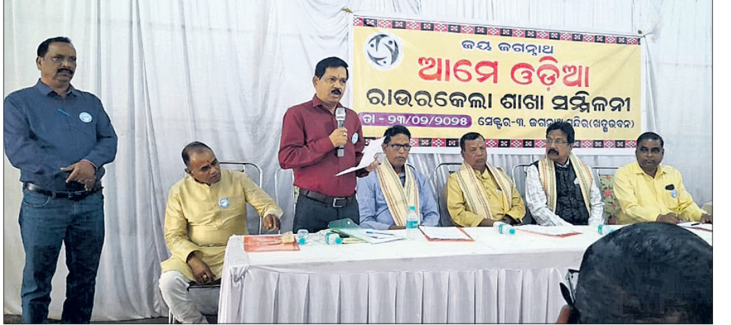
କାର୍ଯ୍ୟକ୍ରମରେ ମଞ୍ଚାସୀନ ଅତିଥିବୃନ୍ଦ।