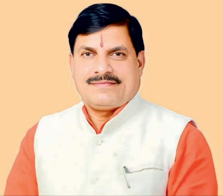
Dr. Mohan Yadav, Chief Minister

INVEST MADHYA PRADESH — INFINITE POSSIBILITIES —