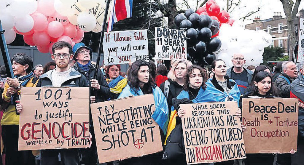
ଲଣ୍ଡନରେ ୟୁକ୍ରେନୀୟକ ସମର୍ଥନରେ ବିରୋଧ ଶୋଭାଯାତ୍ରା।