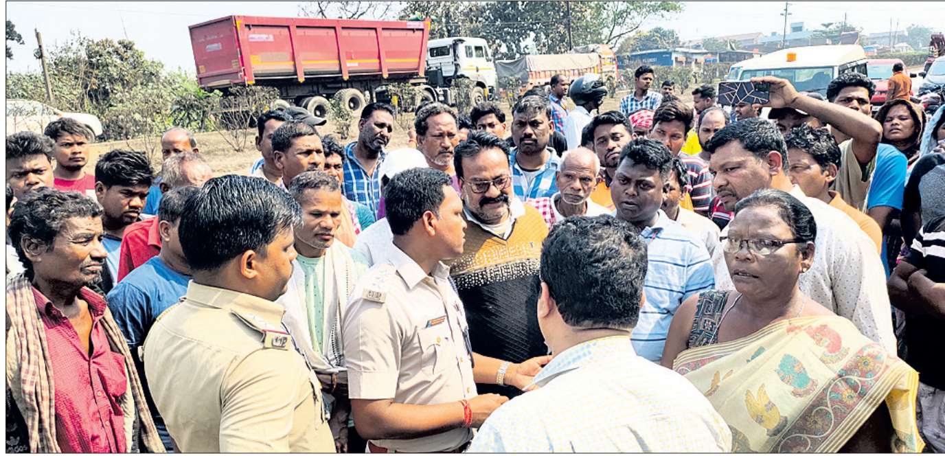
ରବିବାର ଲାଠିକଟା ରୁକ ଅଧୀନ କାଲୋକୁଦର ଅଞ୍ଚଳରେ ବିକ୍ଷୋଭ ଦେଲେ ପୋଲିସ ଆନ୍ଦୋଳନକାରୀଙ୍କୁ ବୁଝାଶୁଣା କରୁଛି।