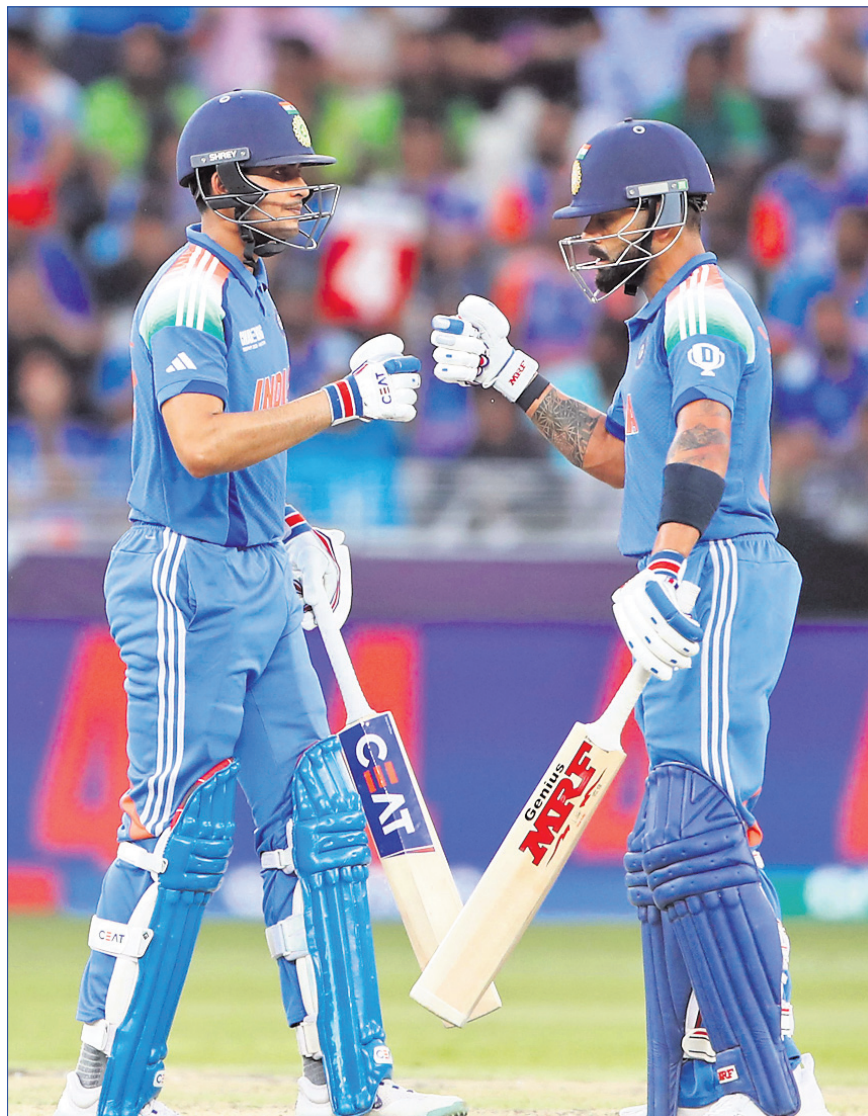
ଆଇସିସି ଚାମ୍ପିୟନଶିପ୍ରେ ଭାରତୀୟ ଦଳର ପାକିସ୍ତାନ ବିପକ୍ଷ ମ୍ୟାଚରେ ଅର୍ଦ୍ଧଶତକୀୟ ପାର୍ଟନରଶିପ୍ ଅବସରରେ ଭାରତର ଶୁଭମନ ବିଲ୍ଲି ଓ ବିରାଟ କୋହଲି।

ଚାର୍ଜେଟ୍ ବଡ଼ ନ ଥିବାରୁ ଭାରତ ସର୍ବୋଚ୍ଚ ସ୍ତରର ସହ ଇନିଂସ ଆରମ୍ଭ କରିଥିଲା। ଅଧିନାୟକ ରୋହିତ ଶର୍ମା ୨୦ ରନକରି ଆଉଟ ହୋଇ ଯାଇଥିଲେ ହେଁ ଶୁଭମନ ବିଲ୍ଲି ଓ ବିରାଟ କୋହଲି ବିତୀୟ ଇନିଂସରେ ୧୬୫-୪