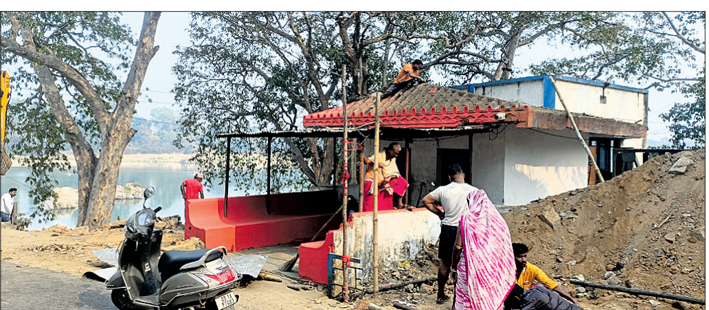
ଦେବଦାସ ପୀଠ ମନ୍ଦିର ପରିସରକୁ ସୌନ୍ଦର୍ଯ୍ୟକରଣ କରାଯାଇଛି।

ଆଉ ୨ ଦିନ ପରେ ମହାଶିବରାତ୍ରି। ଏହି ଉପଲକ୍ଷେ ପଶ୍ଚିମ ଓଡ଼ିଶାର ପ୍ରସିଦ୍ଧ ଶୈବପୀଠ ଦେବଦାସ ସଜେଇ ହେବାର ଲାଗିଛି। ରାଜାରାଜୁଡ଼ା କାଳରୁ ଆଜି ପର୍ଯ୍ୟନ୍ତ ଏହି ଧାମରେ ମହାଶିବରାତ୍ରି ମେଳା ଅନୁଷ୍ଠିତ ହୋଇଆସୁଛି। ପ୍ରଶାସନ ପକ୍ଷରୁ ମେଳା ସୁପରିଚାଳନା ପାଇଁ ବ୍ୟାପକ ପ୍ରସ୍ତୁତି ଆରମ୍ଭ ହୋଇଛି। ଏଠାରେ ଲକ୍ଷ ଲକ୍ଷ ଶ୍ରଦ୍ଧାଳୁ ଜାଗର ଜାଳିବା ସହ ଶଙ୍ଖ, କୋଏଲ ଓ ସରସ୍ୱତୀ ନଦୀର