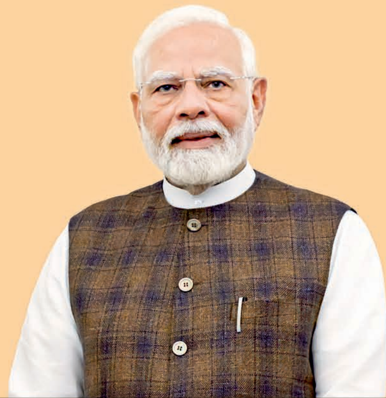
Narendra Modi, Prime Minister

Under the Visionary Leadership of Prime Minister Narendra Modi The Heartland Scripts its New Growth Story