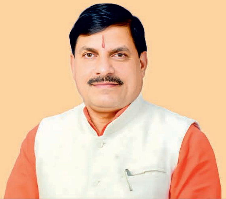
Dr. Mohan Yadav, Chief Minister

INVEST MADHYA PRADESH — INFINITE POSSIBILITIES —