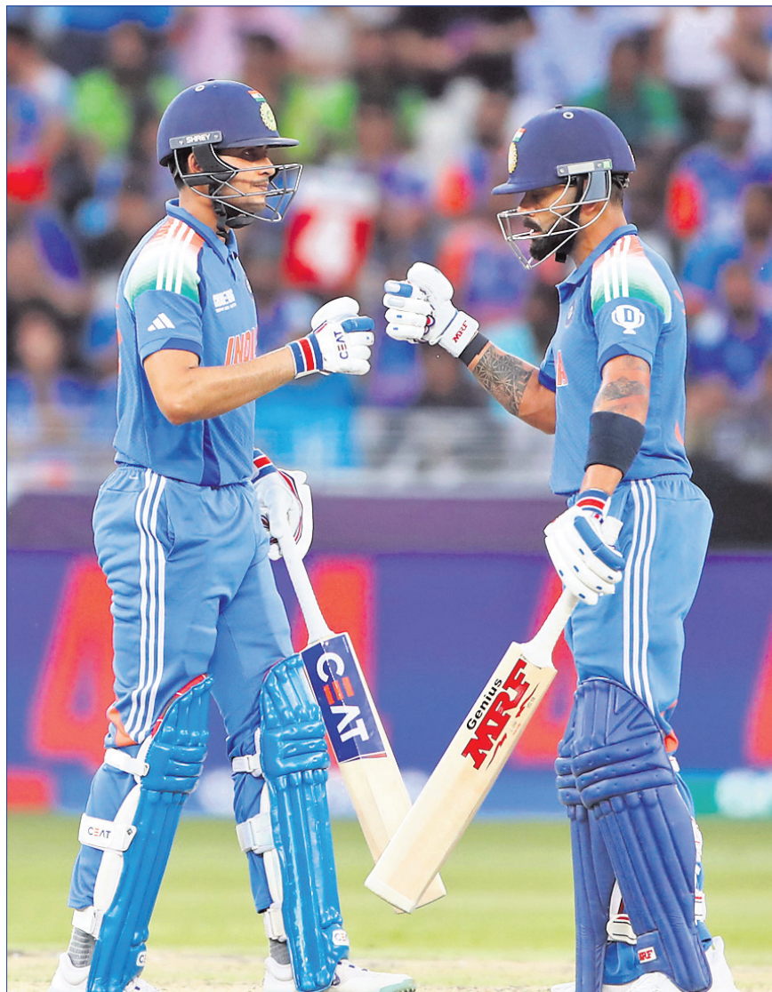
ଆଇସିସି ଚାମ୍ପିୟନଶିପ୍ ଗ୍ରୁପ୍ ଫିନାଲରେ ପାକିସ୍ତାନ ବିପକ୍ଷ ମ୍ୟାଚରେ ଅର୍ଦ୍ଧଶତକୀୟ ପାର୍ଟନରଶିପ୍ ଅବସରରେ ଭାରତର ଶୁଭମନ ବିଲ୍ଲି ଓ ବିରାଟ କୋହଲି।

ଚାର୍ଜେଟ ବଡ଼ ନ ଥିବାରୁ ଭାରତ ସର୍ବୋତ୍ତମ ସହ ଜର୍ମିସ ଆରମ୍ଭ କରିଥିଲା। ଅଧିନାୟକ ରୋହିତ ଶର୍ମା ୨୦ ରନକରି ଆଉଟ ହୋଇ ଯାଇଥିଲେ ହେଁ ଶୁଭମନ ବିଲ୍ଲି ଓ ବିରାଟ କୋହଲି ବିତୀୟ ଇନିଂସରେ ୧୬୫-୪