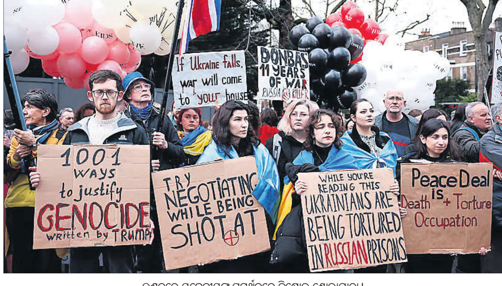
ଲଣ୍ଡନରେ ୟୁକ୍ରେନୀୟକ ସମର୍ଥନରେ ବିରୋଧ ଶୋଭାଯାତ୍ରା।