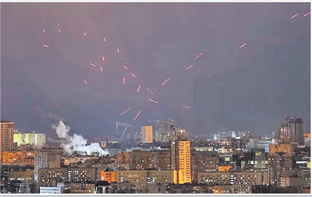
କିଭରେ ଡ୍ରୋନ୍ ଆକ୍ରମଣକୁ ପ୍ରତିହତ କରିଛନ୍ତି ୟୁକ୍ରେନୀୟ ସୈନ୍ୟ।

ପଶ୍ଚିମ ଆଫ୍ରିକୀୟ ଦେଶଗୁଡ଼ିକୁ ରପ୍ତାନି ହେଉଥିବା ଯନ୍ତ୍ରଣା ଉପଶମକାରୀ ଔଷଧରେ ଅଣଅନୁମୋଦିତ କମିନେଶନ (ନିଶ୍ଚଳ) ଯୋଗୁଁ ସେଠାରେ ଓପିଓଇଡ୍ ସଙ୍କଟ ବଢ଼ାଉଥିବା ଖବର ପ୍ରକାଶ ପାଇଥିଲା। ଫଳରେ ଗାସପିଆମୋଲ୍ ଏବଂ କାରିସୋପ୍ରୋଡୋଲ୍ ଔଷଧର ସମସ୍ତ କମିନେଶନର ଉପାଦାନ ଓ ରପ୍ତାନିକୁ ଭାରତର ଔଷଧ ମହାନିୟନ୍ତ୍ରକ (ଡିସିଜିଆଇ) ବନ୍ଦ କରିଛନ୍ତି। ସମସ୍ତ ରପ୍ତାନି ଫେରାଇଆଣିବା ସହ ୨ ଔଷଧର ନିକଟ ଉପାଦାନ ପାଇଁ ଅନୁମତି ପ୍ରତ୍ୟାହାର କରିନେବାକୁ ଡିସିଜିଆଇ ରାଜ୍ୟ ଓ କେନ୍ଦ୍ରଶାସିତ ଅଞ୍ଚଳଗୁଡ଼ିକର ଔଷଧ ନିୟନ୍ତ୍ରକ କର୍ତ୍ତୃପକ୍ଷକୁ ନିର୍ଦ୍ଦେଶ ଦେଇଛନ୍ତି।