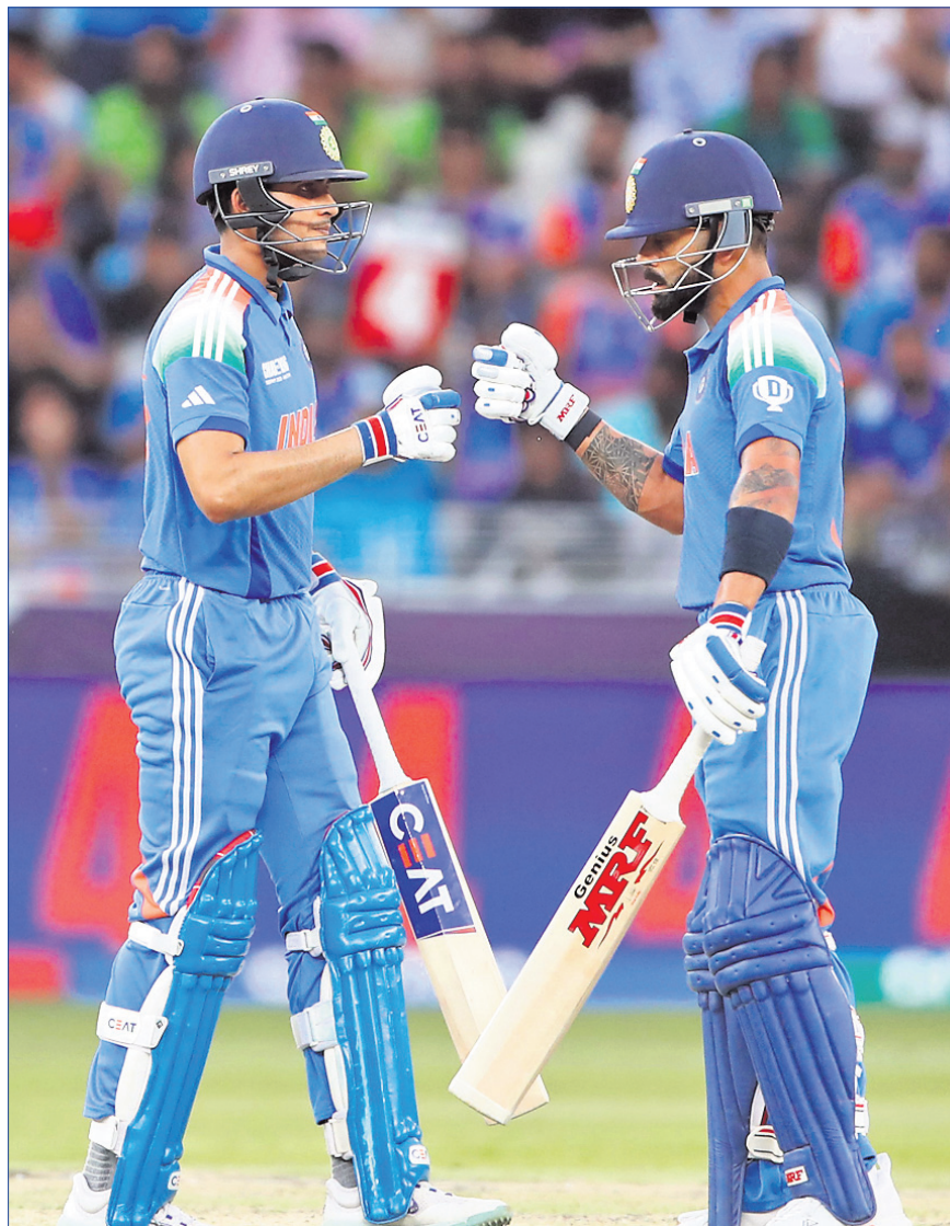
ଆଇସିସି ଚାମ୍ପିୟନଶିପ୍ ଗ୍ରୁପ୍ ଫେଜର ରବିବାର ପାକିସ୍ତାନ ବିପକ୍ଷ ମ୍ୟାଚରେ ଅର୍ଦ୍ଧଶତକୀୟ ପାର୍ଟନରଶିପ୍ ଅବସରରେ ଭାରତର ଶୁବମନ ରିଲ୍ ଓ ବିରାଟ କୋହଲି।

ଚାର୍ଜେଟ ବଡ଼ ନ ଥିବାରୁ ଭାରତ ସର୍ବୋଚ୍ଚ ସର୍ତ୍ତାତର ସହ ଇନିଂସ ଆରମ୍ଭ କରିଥିଲା। ଅଧିନାୟକ ରୋହିତ ଶର୍ମା ୨୦ ରନକରି ଆଉଟ ହୋଇ ଯାଇଥିଲେ ହେଁ ଶୁବମନ ରିଲ୍ ଓ ବିରାଟ କୋହଲି ବିଜୟ ଉଦ୍ଦେଶ୍ୟରେ ଫୁଲ୍ ପୁଷ୍ପା-୪