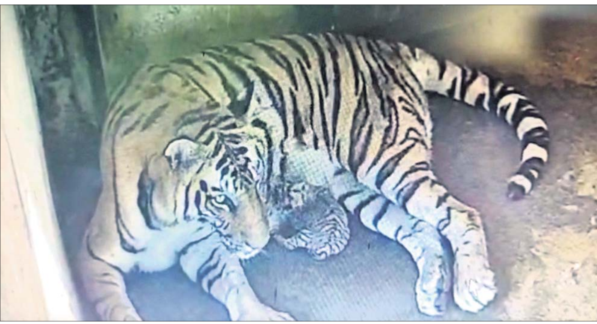
ସୋମବାର ଭୁବନେଶ୍ୱରସ୍ଥିତ ନନ୍ଦନକାନନ ପ୍ରାଣୀଭବ୍ୟାନରେ ନବଜାତକ ସହ ବାଘୁଣୀ 'ଅଙ୍କିତା'।