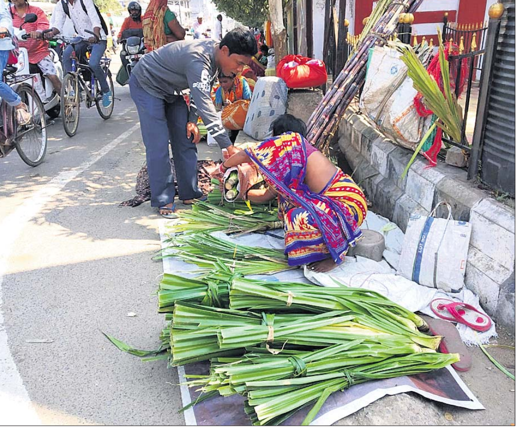
ମହାଶିବରାତ୍ରିର ଦୁଇ ଦିନ ପୂର୍ବରୁ ଯୋଗବାର ହିଂସାଳାଗୁଡ଼େ କେତକା ପୁଲ ବିକ୍ରି ହେଉଛି। ବଜାରରେ ପୁଲ ପ୍ରତି ଦର ୨୫୦ରୁ ୪୦୦ ଟଙ୍କା ପର୍ଯ୍ୟନ୍ତ ବିକ୍ରି କରାଯାଉଛି। (ଫଟୋ: ଦ୍ୱିତୀକୃଷ୍ଣ ପଣ୍ଡା)

ଅଭିଯୋଗ ଶୁଣାଣିରେ ଉପସ୍ଥିତ ଜିଲ୍ଲା ପରିଷଦ ପୁଷ୍ପା ଉନ୍ନତ ଅଧିକାରୀ ଓ ଅନ୍ୟମାନେ। ବ୍ରହ୍ମପୁର, ୨୪୧୨ (ସୁଚିତ ରଞ୍ଜନ ମହାଲିକ)