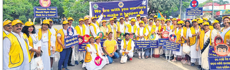
ପଟିଆ ଛକରୁ ଭୁବନେଶ୍ୱର ଆଡ଼େ ଯାତ୍ରା କରୁଥିବା ସଚେତନତା ପଦଯାତ୍ରୀ।