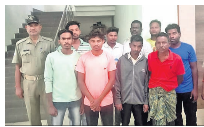
ଗିରଫ ଅଭିଯୁକ୍ତମାନେ ।