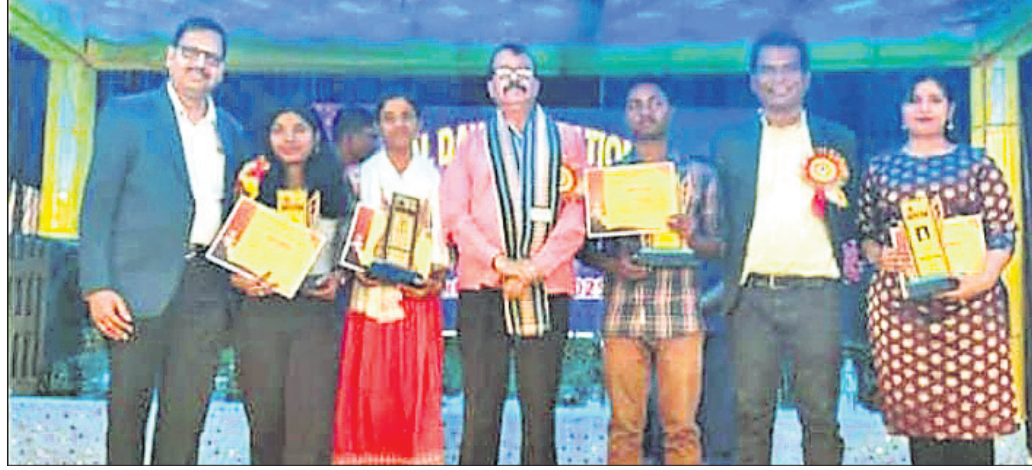
କୃତୀ ଛାତ୍ରଛାତ୍ରୀଙ୍କୁ ସହ ଅଭିନୂତ ।

ନାହିଁ । ଏହାକୁ ନେଇ ଜନ ଅସନ୍ତୋଷ ବଢ଼ି ପାଉଛି । ଏହା ଏବେ ମଧ୍ୟ କରା ରାସ୍ତା ଥିବାରୁ ଖାଲିକିପି ହୋଇ ବର୍ଷାପାଣି ଜମି ଦୁର୍ଗତଣା ହେଉଛି । ରାସ୍ତା ମଝିରେ ଥିବା ପୋଲ ଚଳରେ ଥିବାରୁ ବର୍ଷା ଦିନରେ ପୋଲ ଉପରେ ପାଣି ଯିବାରୁ ସ୍କୁଲ ଛାତ୍ରଛାତ୍ରୀ ଓ ପଥଚାରୀମାନେ ୫ କିଲୋମିଟର ବୁଲି କିର୍ମିରାକୁ ଆସନ୍ତି । ଏହି ରାସ୍ତାକୁ ବନ୍ଦଲି ଓ ବୁରୁପାଳି ଗ୍ରାମବାସୀ ଦୀର୍ଘ ଦିନରୁ କରା ରାସ୍ତା ପିନ୍ଧି କରିବା ଦାବି କରୁଥିଲେ ମଧ୍ୟ ଜନପ୍ରତିନିଧି କିମ୍ପା ଜିଲ୍ଲା ପ୍ରଶାସନ ଦୃଷ୍ଟି ଦେଖନାହାନ୍ତି । ସରକାର ରାସ୍ତା ଉନ୍ନତକରଣ ପାଇଁ କୋଟି କୋଟି ଟଙ୍କା ଖର୍ଚ୍ଚ କରୁଥିବା ବେଳେ ଏହି ରାସ୍ତାର ଉନ୍ନତକରଣ ପାଇଁ କାହିଁକି ଧାନ ଦେଇ ନାହାନ୍ତି ତାହା ଜନସାଧାରଣଙ୍କ ମନରେ ପ୍ରଶ୍ନବାଚି ଦୃଷ୍ଟି କରୁଛି । କିର୍ମିରା ବନ୍ଦଲିରୁ ମିର ହୋଇ ପୁଣ୍ୟ ରାସ୍ତାକୁ ନୂତନ କଂକ୍ରିଟ୍ ରାସ୍ତା ସହ ଦୁଇ ପାର୍ଶ୍ୱରେ ଡ୍ରେନ ଓ ଗାଁ ପୁଞ୍ଜରୁ ବନ୍ଦଲି କରା ରାସ୍ତାକୁ ପିନ୍ଧି କରିବା ପାଇଁ ଅଞ୍ଚଳବାସୀ ଜନପ୍ରତିନିଧି ଓ ଜିଲ୍ଲା ପ୍ରଶାସନକୁ ଦାବି କରୁଛନ୍ତି । ଏହା ନହେଲେ ଆଗାମୀ ଦିନରେ ଆୟୋଜନମୂଳକ ପଞ୍ଚା ଅବଲମ୍ବନ କରିବେ ବୋଲି ସ୍ଥାନୀୟ ଗ୍ରାମବାସୀ କହିଛନ୍ତି ।