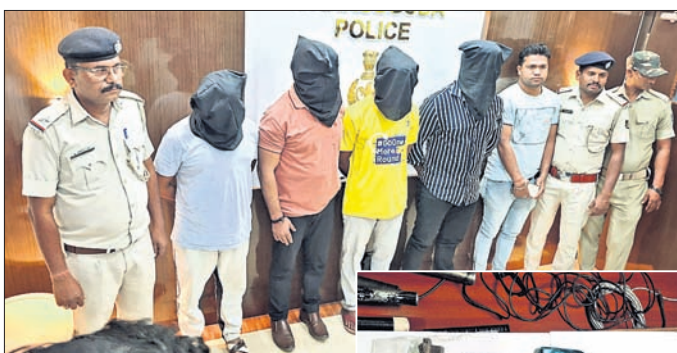
ଖବରଦାତା ସମ୍ମିଳନୀରେ ଅଭିଯୁକ୍ତଙ୍କୁ ହାଜର କରାଯାଇଛି ।

ଝାରସୁଗୁଡ଼ା, ୨୪.୧.୨୫ (ଆଶିଷ ରଞ୍ଜନ ଦାଶ) ଝାରସୁଗୁଡ଼ା ସହର ଭୁଲିଆଟିକ୍ରାଠାରେ ରବିବାର ଫାକା ଗୁଳି ଚଳାଣୀ ଘଟଣାରେ ସୋମବାର ପ୍ରଧାନମନ୍ତ୍ରୀ କିଷାନ ସମ୍ମାନ ସମାରୋହରେ ପିଏମ କିଷାନ ଯୋଜନାର ୧୯ତମ କିସ୍ତିର ହସ୍ତାନ୍ତର କରାଯାଇଛି। ଏହି ଅବସରରେ ଦେବଗଡ଼ ଜିଲ୍ଲାରେ ପ୍ରଧାନମନ୍ତ୍ରୀ ଆଭାସି ମାଧ୍ୟମରେ ୩୮,୯୮୧ଜଣ କୃଷକମାନଙ୍କ ଚାଷ କାର୍ଯ୍ୟ ନିମନ୍ତେ ବିଭିନ୍ନ କୃଷି ସାମଗ୍ରୀ କ୍ରୟ ଜନିତ ଖର୍ଚ୍ଚ ବାବଦକୁ ବର୍ଷିକ ମଧ୍ୟରେ କିସ୍ତି ପିଛା ୨୦୦୦ ଟଙ୍କା ହିସାବରେ ମୋଟ ୩୮ କିସ୍ତିରେ ୬୦୦୦ ଟଙ୍କା ପ୍ରଦାନ କରାଯାଇଛି।