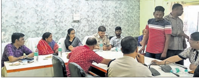
ଶୁଣାଣିରେ ଲୋକେ ନିଜର ଅଭିଯୋଗ ଦାଖଲ କରୁଛନ୍ତି ।