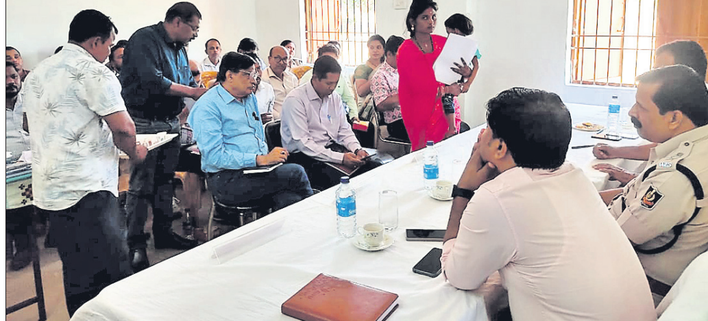
ଜିଲ୍ଲାପାଳ ଲୋକଙ୍କ ଅଭିଯୋଗ ଶୁଣୁଛନ୍ତି ।

ଦେବଗଡ଼, ୨୪.୧.୨୫ (ଶଶାଙ୍କ ଶେଖର ଝାଙ୍କର) ଦେବଗଡ଼ ଜିଲ୍ଲା ଡିଆମାଳ, ବାରକୋଟ ଓ ତିଲେଇବଣି ବ୍ଲକ୍ ଗଠିତ ଗ୍ରାମପଞ୍ଚାୟତ ନେଇ ଏକ ନୂତନ ବ୍ଲକ୍ ଗଠନ କରିବାକୁ ଦାବି ହୋଇଛି । ଏ ନେଇ ରବିବାର ଅପରାଧରେ ତିଲେଇବଣି ବ୍ଲକ୍ ଅନ୍ତର୍ଗତ ହେପିଲିପାଳି ଗ୍ରାମପଞ୍ଚାୟତ ବୃତ୍ତିକଲ ଗ୍ରାମରେ ଏକ ବୈଠକ ଅନୁଷ୍ଠିତ ହୋଇଛି । ତିଲେଇବଣି ବ୍ଲକ୍ କଲ୍ୟାଣ, ବଣିଆକିଲିଆ, ସୁଗୁଡ଼ା, ଛେପିଲିପାଳି, ବଡ଼ଛାପାଳ, ଡିଆମାଳ ବ୍ଲକ୍ ନୂଆଡିହି, ଖଲେଇ ଗ୍ରାମପଞ୍ଚାୟତ ଓ ବାରକୋଟ ବ୍ଲକ୍ ବସାଇଲ ଗ୍ରାମ ପଞ୍ଚାୟତର ଜନସାଧାରଣ ଯୋଗଦେଇ ଆଲୋଚନାରେ ଅଂଶଗ୍ରହଣ କରିଥିବା ଜଣାପଡ଼ିଛି । ଉଚ୍ଚ ସମସ୍ତ ପଞ୍ଚାୟତ ଲୋକେ ପଞ୍ଚାୟତ ସମିତି କାର୍ଯ୍ୟକ୍ରମକୁ ଯିବା ପାଇଁ ପ୍ରାୟ ୩୦ରୁ ୪୦ କି.ମି. ଅତିକ୍ରମ କରିବାକୁ ପଡୁଛି । ଏଥିସହ କେତେକ ପଞ୍ଚାୟତ ଲୋକେ ଜିଲ୍ଲା ସଦର ମହକୁମା ଅତିକ୍ରମ କରି ତିଲେଇବଣି ପଞ୍ଚାୟତ ସମିତି କାର୍ଯ୍ୟକ୍ରମକୁ ଯିବାକୁ ପଡୁଛି । ଫଳରେ ଉପରୋକ୍ତ ଗଠିତ ପଞ୍ଚାୟତକୁ ନେଇ ଏକ ନୂତନ ବ୍ଲକ୍ ଗଠନ କରିବା ସହିତ ସୁଗୁଡ଼ାଠାରୁ ହେପିଲିପାଳି ମଧ୍ୟରେ ଏହାର ସଦର ମହକୁମା କାର୍ଯ୍ୟକ୍ରମ ଗ୍ରାମ ପାଇଁ ବୈଠକରେ ଦାବି କରାଯାଇଥିଲା । ସେହିପରି ପର୍ଯ୍ୟାୟ କ୍ରମେ ପୁଣ୍ୟମନ୍ତ୍ରୀ ଏବଂ ବିଭିନ୍ନ ବିଭାଗର ମନ୍ତ୍ରୀ, ବିଧାୟକ, ଏମ୍ପି ଏବଂ ପ୍ରଶାସନିକ ଅଧିକାରୀଙ୍କୁ ଦାବିପତ୍ର ଦେବା ପାଇଁ ନିଷ୍ପତ୍ତି ନିଆଯାଇଥିଲା ।