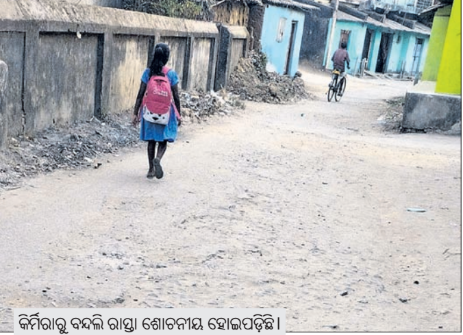
କିର୍ମିରାଠାରୁ ବନ୍ଦଲି ରାସ୍ତା ଶୋଚନୀୟ ହୋଇପଡ଼ିଛି ।