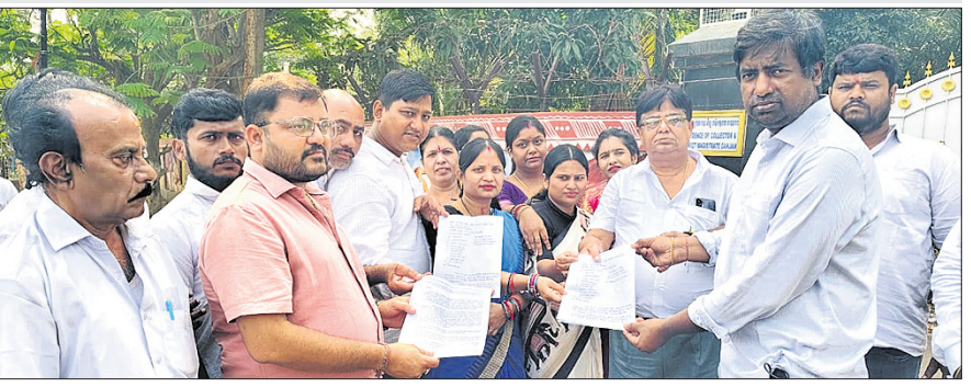
କାଉନସିଲରମାନେ ଅନାମ୍ନା ପ୍ରସ୍ତାବ ସମ୍ପର୍କିତ ପତ୍ର ଜିଲ୍ଲାପାଳଙ୍କୁ ଦେଇଛନ୍ତି।

ଅଧିକାରୀ ମଧ୍ୟ ବିଜେଡିର। ତେବେ ଡାକ ମନମୁଖି କାରବାର ଯୋଗୁ କାଉନସିଲରମାନେ ଅନାମ୍ନା ଆଣିବାକୁ ବାଧ୍ୟ ହୋଇଥିବା ଜଣାପଡ଼ିଛି।