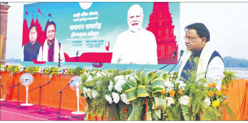
ବାବାଣୀପାଠରେ ଆୟୋଜିତ କାଶୀ-ତାମିଲ ସଙ୍ଗମ ୩.୦ କାର୍ଯ୍ୟକ୍ରମରେ ମୁଖ୍ୟମନ୍ତ୍ରୀ ମୋହନ ଚରଣ ମାଝୀ ଉଦ୍‌ବୋଧନ ଦେଉଛନ୍ତି।

ମୁଖ୍ୟମନ୍ତ୍ରୀ ମୋହନ ଚରଣ ମାଝୀ ସୋମବାର ବାବାଣୀପାଠରେ ଆୟୋଜିତ କାଶୀ-ତାମିଲ ସଙ୍ଗମ ୩.୦ କାର୍ଯ୍ୟକ୍ରମରେ ଯୋଗ ଦେଇଛନ୍ତି। ଏହି ଅବସରରେ ସେ କହିଛନ୍ତି, କାଶୀ-ତାମିଲ ସଙ୍ଗମ ହେଉଛି ଦେଶର ସାଂସ୍କୃତିକ ଐତିହ୍ୟ ଓ ଏକତାର ଅନନ୍ୟ ନିଦର୍ଶନ। ଭାରତର ପ୍ରତ୍ୟେକ ଅଞ୍ଚଳର ଭାଷା, ରୀତିନୀତି ଓ ପ୍ରଥା ଅଲଗା ହୋଇପାରେ କିନ୍ତୁ ଆମ ସମସ୍ତଙ୍କ ପାରମ୍ପରିକ ସ୍ନେହ, ସୌହାର୍ଦ୍ଦ ଓ ଆଧ୍ୟାତ୍ମିକ ଚିନ୍ତାଧାରା ସମାନ। ଆମର ଏହି ସାଂସ୍କୃତିକ ଏକତା ଭାରତକୁ ଅନନ୍ୟସବୁ ରାଷ୍ଟ୍ରଠାରୁ ସ୍ୱତନ୍ତ୍ର କରିଛି। ଆମେ ସମସ୍ତେ ମହାଭାରତୀୟ ସାଂସ୍କୃତିକ ଐତିହ୍ୟର ଗୋଟିଏ ଗୋଟିଏ ଅଂଶ। ଆମେ ସମସ୍ତେ ଏହି ମହାଭାରତୀୟ ଚେତନାରେ ବାନ୍ଧି ହୋଇ ରହିଛୁ ବୋଲି ମୁଖ୍ୟମନ୍ତ୍ରୀ କହିଛନ୍ତି। ସୂଚନାଯୋଗ୍ୟ, ଭାରତର ସାଂସ୍କୃତିକ ଏକତାକୁ ସୁରକ୍ଷିତ କରିବା ପାଇଁ ଓ ଏହାର ପ୍ରଚାର ପ୍ରସାର ପାଇଁ ପ୍ରଧାନମନ୍ତ୍ରୀ ନରେନ୍ଦ୍ର ମୋଦି ୨୦୨୨ରେ କାଶୀ-ତାମିଲ ସଙ୍ଗମ କାର୍ଯ୍ୟକ୍ରମର ଶୁଭାରମ୍ଭ କରିଥିଲେ। ଚଳିତ ବର୍ଷ ଏହା ଫେବୃଆରୀ ୧୫ରୁ ବାରାଣସୀର ନମୋ-ଘାଟରେ ଆୟୋଜିତ ହେଉଛି। ଏହି କାର୍ଯ୍ୟକ୍ରମରେ ମୁଖ୍ୟମନ୍ତ୍ରୀଙ୍କ ସହିତ କେନ୍ଦ୍ର ଶିକ୍ଷା ରାଷ୍ଟ୍ରମନ୍ତ୍ରୀ ସୁକାନ୍ତ ମଲ୍ଲମ୍‌ଦାର