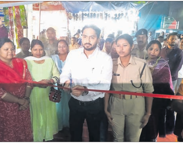
ରାଜରକେଲା ଏଡିଏମ୍ ବେଦବ୍ୟାସ ମେଳାକୁ ଉଦ୍ଘାଟନ କରୁଛନ୍ତି ।