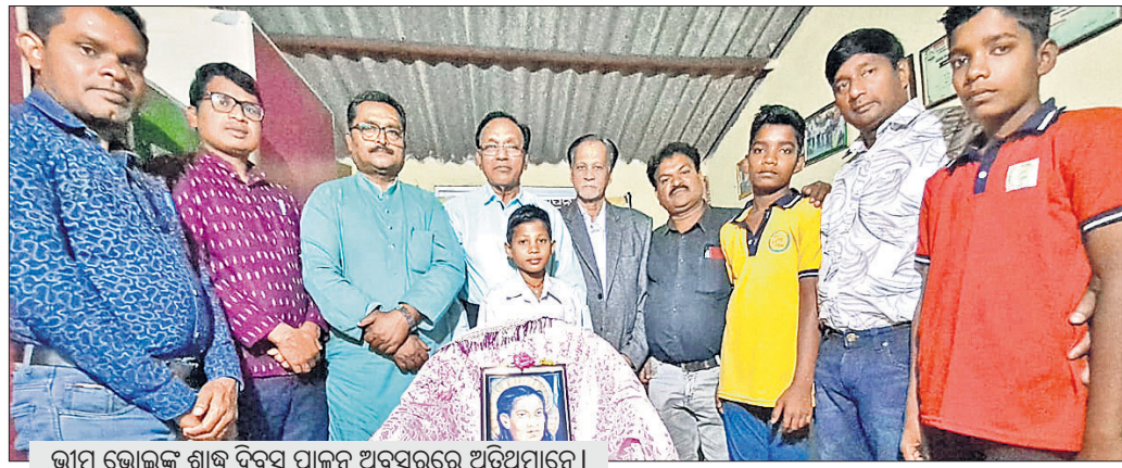
ଭୀମ ଭୋଇଙ୍କ ଶ୍ରାଦ୍ଧ ଦିବସ ପାଳନ ଅବସରରେ ଅତିଥିମାନେ ।