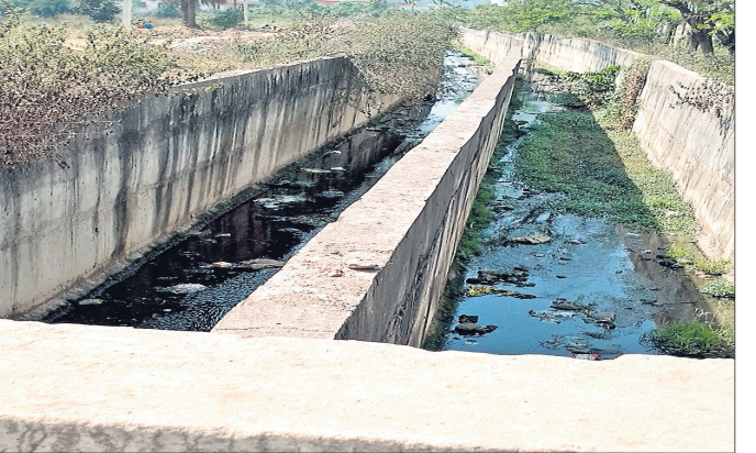
ସିଲିକାଗଜନଶିବସ୍ଥିତ ମୁକୁଳା ପଡ଼ିଥିବା ଡ୍ରେନ୍ ।

ରାଜରକେଲା ସିଲିକାଗଜନଶିବସ୍ଥିତ କେଟିଏଠି ଡାକ୍ତରଖାନା ସମ୍ମୁଖରେ ନିର୍ମିତ ନୂତନ ଅଧ୍ୟାପକରଥା ଭାବେ ପଡ଼ିରହିଛି । ଏହି ଡ୍ରେନ୍ ଉପରେ ଅଧ୍ୟାପକରଥ ପଡ଼ିଥିବାବେଳେ ଅବଶିଷ୍ଟ ମୁକୁଳା ଛାଡ଼ିଆଯାଇଛି । ଫଳରେ ରାସ୍ତାରେ ଗାଡ଼ିମୋଟର ଚଳାଚଳ ବେଳେ ଦୁର୍ଘଟଣା ଆଶଙ୍କା ରହିଛି । ଏ ନେଇ ଅଭିଯୋଗ ହୋଇଥିବା ମଧ୍ୟ କୌଣସି ସୁଫଳ ମିଳିନାହିଁ । କେଟିଏଠି ଡାକ୍ତରଖାନା ସମ୍ମୁଖରେ ସିଲିକାଗଜନଶିବସ୍ଥିତ ଅଞ୍ଚଳର ପ୍ରମୁଖ ଡ୍ରେନ୍ ହୋଇଥିବାବେଳେ ଏହା ହନୁମାନ ବାଟିକା ଛକ ଡ୍ରେନ୍ ସହ ସଂଯୁକ୍ତ ହୋଇ ସିଏସ୍ପିଏସ୍ ପାନପୋଷ ମୁଖ୍ୟମାର୍ଗ ନାଳରେ ମିଶିଛି । ଏହି ଡ୍ରେନ୍ ହନୁମାନ ବାଟିକା କଡ଼ରେ ଥିବା ଖଟାଳ ବସ୍ତି, ବାଲୁଆ ବସ୍ତି, ବର୍ଷିକ ସଂସ୍ପର୍ଶ କାର୍ଯ୍ୟାଳୟ ପଛପଟ ଦେଇ ଯାଇଛି । ଏହା ୨୦୧୯ ଫେବୃଆରୀ ମାସରେ ତିଆରି ହୋଇଥିଲା । ରାଜରକେଲାରେ ହଳି ବିଶ୍ୱକପ ପୂର୍ବରୁ ଉକ୍ତ ଡ୍ରେନ୍ କାମ ସମ୍ପୂର୍ଣ୍ଣ ଶେଷ ହେବା ପାଇଁ ସମୟ ନିର୍ଦ୍ଧାରିତ ହୋଇଥିଲା । କିନ୍ତୁ ଠିକାଦାର ଏହାକୁ ଅଧ୍ୟା କଲଭର ପକାଇ ଖୋଲା ଛାଡ଼ି