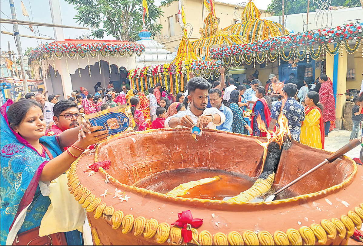
ରୁଧିରାରି ମହାଶିବରାତ୍ରି ଅବସରରେ କଟକ ଚାନ୍ଦିନୀଚୌକ ଅଞ୍ଚଳରୁ ମନ୍ଦିର ପରିସରରେ ପ୍ରକଳିତ ବିଶାଳ ଦୀପରେ ଶ୍ରଦ୍ଧାଳୁମାନେ ଦିଅ ଡାକୁଛନ୍ତି।

ଅଭିନେତା ସଞ୍ଜୟ ଦତ୍ତଙ୍କ ଆଗାମୀ ହରର ଫିଲ୍ମ ‘ଦି ଭୁତ୍ରି’ର ବିଜର ରୁଧିରାରି ରିଲିଜ୍ ହୋଇଛି। ଆସନ୍ତା ଏପ୍ରିଲ ୧୮ରେ ଏହି ଫିଲ୍ମ ରିଲିଜ୍ ହେବ।