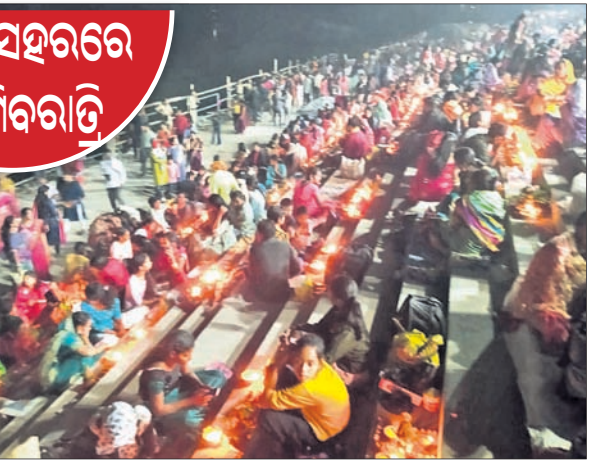
ମନ୍ଦିର ବେଢାରେ ଶ୍ରଦ୍ଧାକୁମାରୀଙ୍କ ଦୀପ ଜାଳି ଉଦ୍ଧାର ରହିଛି ।