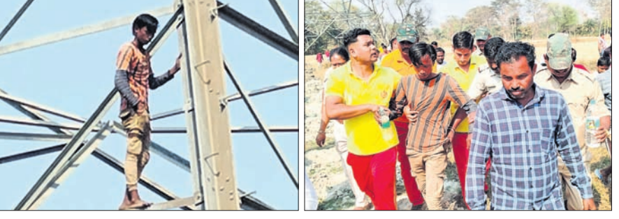
ହାଇ ଭୋଲଟେଜ ବିଦ୍ୟୁତ୍ ଟାଉର ଉପରେ ଯୁବକ ଠିଆ ହୋଇଛନ୍ତି।

ଓ ପୂର୍ବତଳା ତହସିଲଦାର ଘଟଣାସ୍ଥଳରେ ପହଞ୍ଚିଥିଲେ। ସେହି ଟାଉର ଚଳେ ଦମକକ ବାହିନୀ କର୍ମଚାରୀମାନେ ନେତୃ ଧରି ରହିଥିଲେ। ବିଦ୍ୟୁତ୍ ଟାଉର ଉପରକୁ ଚଢ଼ାଇବାକୁ ସେହି ଯୁବକଙ୍କୁ ବାରମ୍ବାର ଅନୁରୋଧ କରାଯାଇଥିଲେ ମଧ୍ୟ ସେଠାକୁ ସେ ଓହ୍ଲାଇ ନ ଥିଲେ। ମଝିରେ ମଝିରେ ହାଇ ଭୋଲଟେଜ ବିଦ୍ୟୁତ୍ ଟାଉର ଧରି ସେ ଓହ୍ଲାଇ ପହଞ୍ଚିଲେ। ପୋଲିସ୍, ଅଗ୍ନିଶମ ବାହିନୀ କର୍ମଚାରୀ, ତହସିଲଦାର ଉପସ୍ଥିତ ରହି ଯୁବକଙ୍କୁ ନିରାଶ୍ରୟ କରିଥିଲେ। ଯୁବକ ଜଣକ ଦୀର୍ଘ ସମୟ ଧରି ଯତ୍ନକୁ ନାକେଦମ କରିଦେଇଥିଲେ। ଏହି ଘଟଣା ସମ୍ପର୍କରେ ପ୍ରଚାରହେବା ପରେ ସେଠାରେ ଲୋକଙ୍କ ଭିଡ଼ ଜମିଥିଲା। ୨ଜଣ ଅଗ୍ନିଶମ ବିଭାଗ କର୍ମଚାରୀ ଟାଉର ଉପରକୁ ଯାଇ ବୁଝାଶୁଝା କରିଥିଲେ। ଟାଉର ସମ୍ପର୍କରେ ମଧ୍ୟ ବୁଝାଶୁଝା କରିଥିଲେ। ଦୀର୍ଘ ୬ ଘଣ୍ଟା ପରେ ଯୁବକ ଜଣକ ଅପରାଧ ପ୍ରାୟ ସାତଟି ୨ଟାରେ ଟାଉରରୁ ଚଳୁଛି ଓହ୍ଲାଇଥିଲେ। ଟାଉରରୁ ଓହ୍ଲାଇବା ବେଳେ ଅଧା ବାଟରୁ ଅଗ୍ନିଶମ ବିଭାଗ କର୍ମଚାରୀମାନେ ଟାଉର କାନ୍ଦୁ କରିନେଇଥିଲେ। କେଉଁ କାରଣରୁ ଯୁବକ ଜଣକ ଟାଉର ଉପରକୁ ଚଢ଼ି ଏଭଳି କାଣ୍ଡ କରିଥିଲେ ତାହା ସ୍ପଷ୍ଟ ହୋଇନାହିଁ।