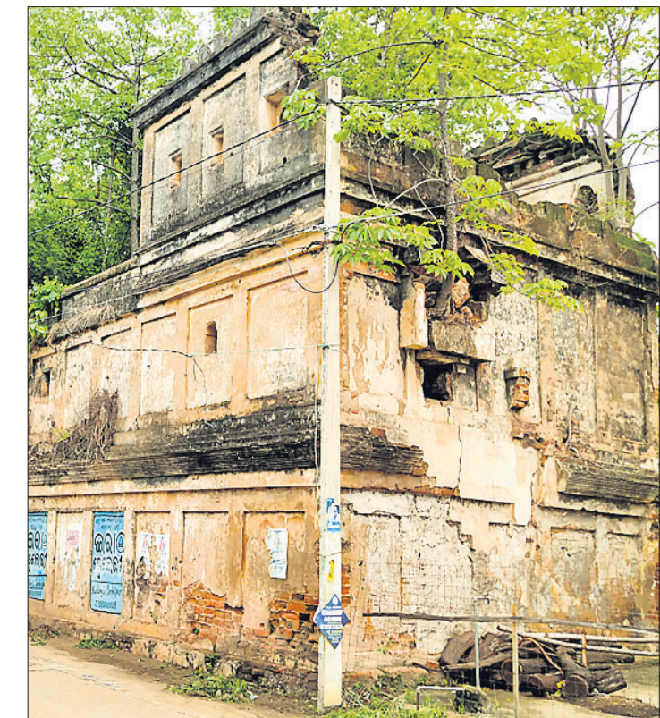
ଅର୍ଦ୍ଧଭଗ୍ନ ଅବସ୍ଥାରେ ସୋନପୁର ରାଜପ୍ରାସାଦ ।

ସୋନପୁର, ୨୬।୨ (ମୁଖ୍ୟମନ୍ତ୍ରୀ ଶତପଥୀ) ଉତ୍ତରାଞ୍ଚଳରେ ଅଭାବରୁ ସମୃଦ୍ଧ ଇତିହାସର ମୁକ୍ତସାକ୍ଷୀ ସୋନପୁର ରାଜପ୍ରାସାଦ ଏବେ ଧ୍ୟାନପ୍ରାପ୍ତ । ପ୍ରାସାଦ ଭିତରେ ଥିବା ସୁନ୍ଦର ଗମ୍ଭୀର ଓ କାଢ଼ ସବୁ ଭାଙ୍ଗିରୁଜି ଗଲାଣି । ମରାମତି ଆବଶ୍ୟକ କଳା, ସଂସ୍କୃତି ଓ ଭାଷ୍ୟାତ୍ମକ ଏହି ମୁକ୍ତସାକ୍ଷୀ ଧ୍ୱଂସ ହେଉ ଥାଉ ଏହା ଭାଙ୍ଗିବାକୁ ବଦଳିଲାଣି । ଏଠାରେ ରାଜପରିବାରର କେହି ରହୁନାହାନ୍ତି । ଫଳରେ ଲତା ମାଡ଼ିଗଲାଣି । ଏକଦା ସୋନପୁର ଗଡ଼ଜାତ ଶାସନଗଡ଼ ପ୍ରଭାବ, ଶିକ୍ଷା, ପ୍ରତିଷ୍ଠା ଓ ପ୍ରତିପତ୍ତି ପାଇଁ ବେଶ୍ ସୁନାମ ଅର୍ଜନ କରିଥିଲା । ମହାରାଜାଙ୍କ ଏହି ଘରେ ତତ୍କାଳୀନ ସୋନପୁର ଗଡ଼ଜାତର ବହୁ ସ୍ମୃତି ଲିପିବଦ୍ଧ ହୋଇଛନ୍ତି । ମହାନଦୀ କୂଳରେ ପଥର ବନ୍ଧ ବାନ୍ଧି ଏହି ରାଜପ୍ରାସାଦ ଅତି ଦୃଢ଼ ଓ ସୁନ୍ଦର ଭାବରେ ନିର୍ମାଣ ହୋଇଥିଲା । ଦୀର୍ଘବର୍ଷ ଧରି ମରାମତି ଆବଶ୍ୟକ ଏହା ସମ୍ପୂର୍ଣ୍ଣ ଧ୍ୟାନ ହେବାକୁ ବଦଳିଲାଣି । ମାଟିରେ ମିଶି ଯିବା ପୂର୍ବରୁ ଏହାର ପୁନରୁଦ୍ଧାର ପାଇଁ ଗଡ଼ଜାତ ଅଞ୍ଚଳବାସୀ ଦାବି କରିଛନ୍ତି । ୧୯୦୨ ମସିହା ଅଗଷ୍ଟ ୮ରୁ ୧୯୩୭ ଅପ୍ରେଲ ୨୯ ପର୍ଯ୍ୟନ୍ତ ବାରମିଶ୍ରୋଦୟ ସୋନପୁରରେ ଶାସନ କରିଥିଲେ । ତାଙ୍କ ଶାସନ କାଳରେ ୧୯୦୫ରେ ସୋନପୁର ରାଜ୍ୟ ସେକ୍ସୁଆଲ ପ୍ରୋଭିଡ଼ନ୍ସ ପଶୁମବଳ ଅଧିନ କମିଶନର ଅଧିକାରୀ ତିଳକନକୁ ଆସିଥିଲା । ତାଙ୍କ ପୁଷ୍ପପାଞ୍ଚକପାରେ