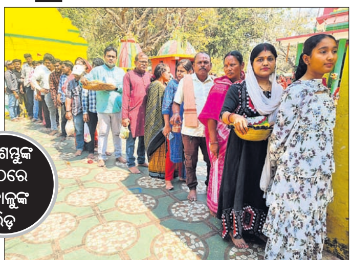
ଅଷ୍ଟଶତାବ୍ଦୀ ପୀଠରେ ଶ୍ରଦ୍ଧାଳୁଙ୍କ ଭିଡ଼

ସୋନପୁର, ୨୬।୨ (ମୁଖ୍ୟମନ୍ତ୍ରୀ ଶତପଥୀ) ପବିତ୍ର ମହା ଶିବରାତ୍ରି ଅବସରରେ ସୁବର୍ଣ୍ଣପୁର ଜିଲ୍ଲାର ସମସ୍ତ ଶୈବପୀଠ ରୁଦ୍ଧିକ ରୂପରେ ଚଳଚଞ୍ଚଳ ହୋଇଉଠିଛି । ସବୁଠି ଓ ନମଃ ଶିବାୟ ଶୁଣିବାକୁ ମିଳୁଛି । ଶିବଙ୍କ ଦର୍ଶନ ପାଇଁ ସକାଳଠାରୁ ପୀଠରୁଦ୍ଧିକରେ ଭକ୍ତଙ୍କ ଗହଳ ଲାଗି ରହିଥିଲା । ଶ୍ରଦ୍ଧାଳୁମାନେ ଶିବଙ୍କ ନିକଟରେ ମନୋଧ୍ୟାନା ପୂରଣ ପାଇଁ ପୂଜାର୍ଚ୍ଚନା କରିବା ସହ ବିଭିନ୍ନ ପୀଠ ରୁଦ୍ଧିକ ଶିବଙ୍କ ଦର୍ଶନ କରିଥିଲେ । ସୁବର୍ଣ୍ଣପୁର ସହରର ପ୍ରସିଦ୍ଧ ଅଷ୍ଟଶତାବ୍ଦୀ ପୀଠ ଓ ଜିଲାର ପ୍ରମୁଖ ଶୈବପୀଠରୁଦ୍ଧିକରେ ଭକ୍ତଙ୍କ ଲୟ ଧାଡ଼ି ଦେଖିବାକୁ ମିଳିଥିଲା । ଶ୍ରଦ୍ଧାଳୁମାନଙ୍କ ପାଇଁ ଧାର୍ଯ୍ୟ ଦର୍ଶନ, ମନ୍ଦିର ବେଢାବାହାରେ ଦୀପ ଜାଳିବା ବ୍ୟବସ୍ଥା ହୋଇଥିଲା ।