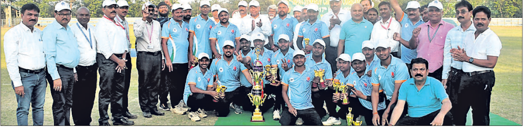
ଅତିଥିମାନଙ୍କ ଗହଣରେ ଟ୍ରଫି ସହ ଚାମ୍ପିୟନ ଦଳର ଖେଳାଳି ।