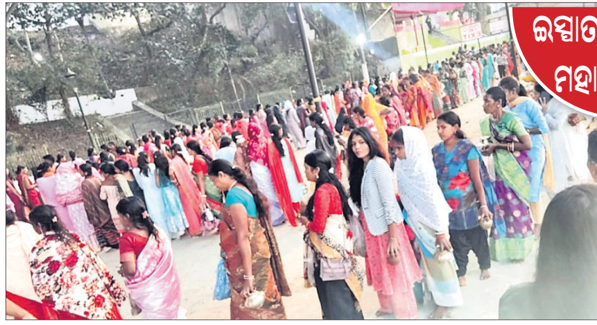
ବେଦବ୍ୟାସ ପାଠରେ ରୁଧିରୀର ସକାଳେ ଶ୍ରଦ୍ଧାକୁମାରୀଙ୍କ ଧାଡ଼ିରେ ଛିଡ଼ା ହୋଇଛନ୍ତି ।

ପୁଣି ଅଲୋଡ଼ା ହେଲା କନ୍ୟା ସତ୍ତାମୀ । ନିଜ କର୍ମଫଳ ଲୁଚାଇବା ପାଇଁ ସମ୍ଭବତଃ କନ୍ୟାପୁତ୍ରୀ ନବଜାତକ କନ୍ୟାସତ୍ତାମୀକୁ ନର୍ଦ୍ଦମାରେ ଫିଙ୍ଗିବାକୁ ପଛାଇନାହିଁ । ଏପରି ଦୁର୍ଘଟଣା ଦେଖିବାକୁ ମିଳିଛି ସେକ୍ଟର-୩ ଥାନା ଅନ୍ତର୍ଗତ ସେକ୍ଟର-୧ ଏବଂ ବ୍ଲକ ବିବେକାନନ୍ଦ ସ୍ତ୍ରୀ ସମ୍ମୁଖ ନର୍ଦ୍ଦମାରେ । ଏହାକୁ ଦେଖିବାକୁ ପ୍ରବଳ ଗହଳି ହୋଇଥିଲା । ରୁଧିରୀର ସକାଳ ପ୍ରାୟ ୯ଟାରେ ଏପରି ସୂଚନା ପାଇ ପୋଲିସ ଘଟଣାସ୍ଥଳରେ ପହଞ୍ଚିଥିଲା । ମୃତଦେହକୁ ଉଦ୍ଧାର କରି ରାଜରକେଲା ସରକାରୀ ଡାକ୍ତରଖାନା ମର୍ଗ ହାଉସରେ ରଖାଯାଇଛି । ଏ ନେଇ ଥାନାରେ ଏକ ମାମଲା (ନଂ.୪/୨୫) ରୁଜୁ ହୋଇଛି । ଯାଞ୍ଚ ଅଧିକାରୀ ଆର. କେ. ଭୁବକ କହିବା ଅନୁସାରେ, ଉକ୍ତ ମୃତଦେହ ପ୍ରାୟ ୨୪ଘଣ୍ଟା ମଧ୍ୟରେ ଫିଙ୍ଗାଯାଇଥିବା ସନ୍ଦେହ କରାଯାଇଛି । ଆଖପାଖ ସ୍ଥିତି ଯିଏତେ ଓ ଲୋକଙ୍କୁ ପଚାରି ତଦନ୍ତ କରାଯାଇଛି । ଏପର୍ଯ୍ୟନ୍ତ ମୃତଦେହର କେହି ଦାବିଦାର ନାହାନ୍ତି । ଗୁରୁବାର ବ୍ୟବହୃତ ପରେ ୩୬ ଘଣ୍ଟା ମଧ୍ୟରେ ପୋଡ଼ାଯିବ ବୋଲି ଭୁବ କହିଥିଲେ ।