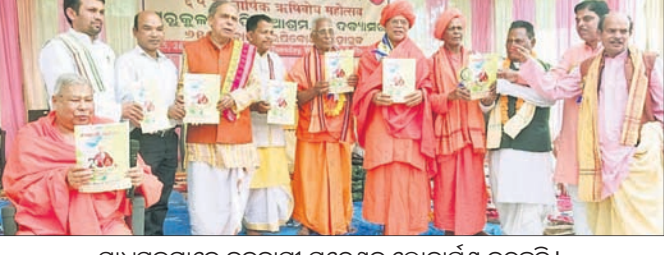
ସାଧୁସଂପ୍ରଦାୟରେ ବେଦବ୍ୟାସ ସମ୍ବନ୍ଧକୁ ଲୋକାର୍ପଣ କରୁଛନ୍ତି ।