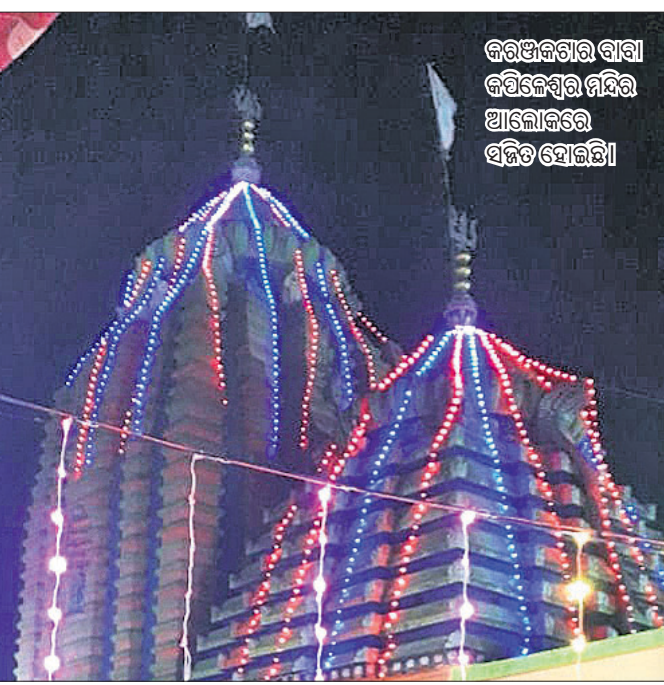
କରଞ୍ଜିଗଣା ବାବା କପିଳେଶ୍ୱର ମନ୍ଦିର ଆଲୋକିତ ହେଉଛି

ପୂଜାର୍ଚ୍ଚନା କରି ମହାଦୀପ ଉଠିବାକୁ ଚାହିଁ ରହିଥିଲେ । ଶୈବ ପୀଠରୁଦ୍ଧିକରେ ଜାଗର ଯାତ୍ରା ଉପଲକ୍ଷେ ଭଜନ ସମ୍ପା, ହରପାର୍ବତୀ ସୁଆଙ୍ଗ, ଅଷ୍ଟପ୍ରହର ନାମ ସଂକୀର୍ତ୍ତନ ଆଦି ସାଂସ୍କୃତିକ କାର୍ଯ୍ୟକ୍ରମ ଆୟୋଜିତ ହୋଇଥିଲା । ସେହିପରି ସର୍ବପୁରାତନ ଶୈବପୀଠ ସୋନପୁର ବ୍ଲକ୍ ବିଦ୍ୟାଳୟର କୋଶଳେଶ୍ୱର ମନ୍ଦିର, ଗଡ଼ଜକଲାର ଖୁଲୁଡେଶ୍ୱର, ବିନିକା ଚରଦାର କପିଳେଶ୍ୱର ମନ୍ଦିର, ବାରମହାରାଜପୁର ଚମ୍ପାମାନଙ୍କ ଚନ୍ଦେଶ୍ୱର ମନ୍ଦିର ଓ କଟକସିଂହାର ଗୋଧନେଶ୍ୱର ମନ୍ଦିରରେ ଶ୍ରଦ୍ଧାଳୁଙ୍କ ସମାଗମ ହୋଇଥିଲା । ଏହି ଯାତ୍ରାକୁ ଶାନ୍ତିଶୁଖିଳାକାର ସହ ସମ୍ପାଦନ କରିବା ପାଇଁ ପୋଲିସ୍ ଟିମ୍ ଓ ଅଗ୍ନିଶମ ବାହିନୀ ସୁତରାପ ରହିଥିଲେ । ମନ୍ଦିର କର୍ମିକାଠି ଓ ବିଭିନ୍ନ ସ୍ୱେଚ୍ଛାସେବୀ କର୍ମକର୍ତ୍ତା ଓ ବିଭିନ୍ନ ସ୍ୱେଚ୍ଛାସେବୀ ବାବା ସଂଗଠନ କର୍ମକର୍ତ୍ତାମାନେ ଶ୍ରଦ୍ଧାଳୁ ମାନଙ୍କୁ ସେବା ଯୋଗାଇ ଦେଇଥିଲେ ।