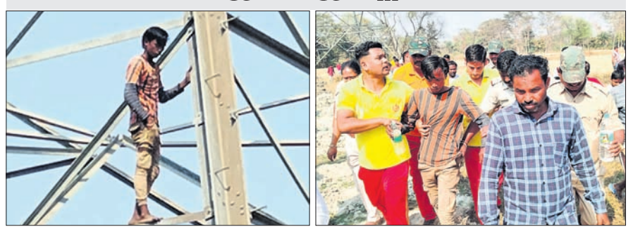
ହାଇ ଭୋଲଟେଜ ବିଦ୍ୟୁତ୍ ଟାଉର ଉପରେ ଯୁବକ ଠିଆ ହୋଇଛନ୍ତି।

ଓ ପୂର୍ବତଳା ତହସିଲଦାର ଘଟଣାସ୍ଥଳରେ ପହଞ୍ଚିଥିଲେ। ସେହି ଟାଉର ଉପରେ ଯୁବକଙ୍କୁ ଚଢ଼ିବା ପାଇଁ ନିକଟ ଏକ ହାଇ ଭୋଲଟେଜ ବିଦ୍ୟୁତ୍ ଟାଉର ଉପରକୁ ଚଢ଼ିଯାଇଥିଲା। ଏହି ଯୁବକଙ୍କୁ ବନ୍ଦୁ କନ୍ଦେ ଚଳକୁ ଓହ୍ଲାଇବା ପରେ ତାଙ୍କୁ ସ୍ୱାସ୍ଥ୍ୟ ପରୀକ୍ଷା କରାଯାଇ ପୋଲିସ୍ ଗୁମାସ୍ତା ଭାବେ ଭୋଲଟେଜ କଲେଜ ହସ୍ତାନ୍ତର କରାଯାଇଛି।