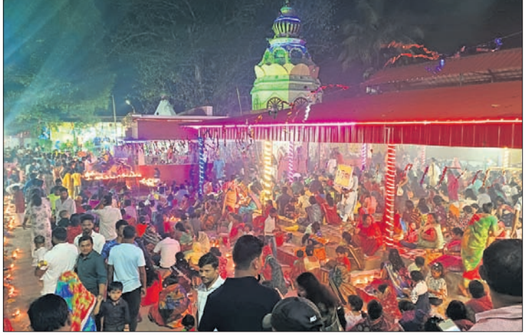
ଶ୍ରୀବାଳୁମାନେ ମନ୍ଦିର ପରିସରରେ ଜାଗର କାଳୁଛନ୍ତି।

■ ସକାଳୁ ମହାଦେବଙ୍କ ଦର୍ଶନ କଲେ ■ ସନ୍ଧ୍ୟାରେ ବେଢ଼ାରେ ଜାଗର ଜାଳିଲେ