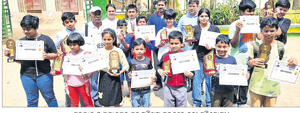
ପୁରସ୍କାର ଓ ପ୍ରମାଣପତ୍ର ସହ ଅତିଥି ଗଣତରଫେ କୃତା ପ୍ରତିଯୋଗୀ।