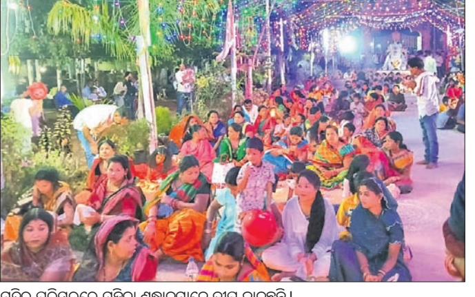
ମନ୍ଦିର ପରିସରରେ ମହିଳା ଶ୍ରଦ୍ଧାଳୁମାନେ ଦୀପ ଜାଳୁଛନ୍ତି।