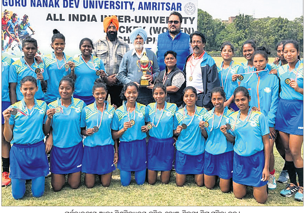
ସର୍ବଭାରତୀୟ ଆନ୍ତର୍ଜାତୀୟ ବିଶ୍ୱବିଦ୍ୟାଳୟ ହକିର ଗ୍ରୋଉଥ ବିଜୟୀ କିର୍ ମହିଳା ଦଳ।

ପିକ୍ ଲେଡ଼ିଜ କପ ପୁରସ୍କାର: କୋରିଆଠାରୁ ଭାରତ ହାରିଲା। ଶାରଦା, ୨୭୨ (ପି.ଟି.): ଭାରତୀୟ ସିନିୟର ମହିଳା ପୁରସ୍କାର ଦଳ ପିକ୍ ଲେଡ଼ିଜ କପ ପୁରସ୍କାରରେ ପରାଜୟ ସହ ଅଭିଯାନ ଶେଷ କରିଛି।