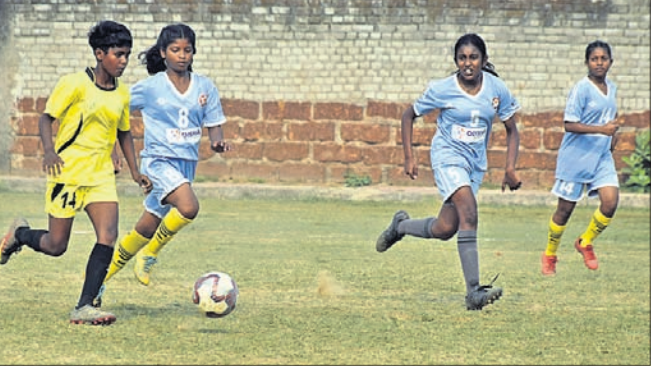
କିର୍-ଓଡ଼ିଆ ମଧ୍ୟରେ ଅନୁଷ୍ଠିତ ମ୍ୟାଚ୍