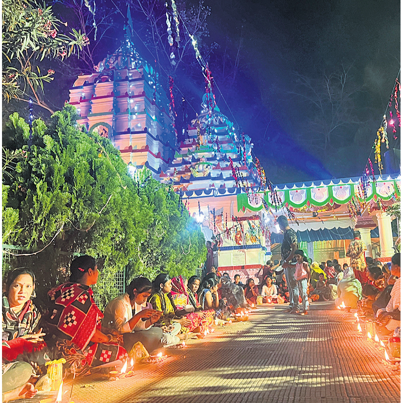
ଅନୁଗୋଳ ହେମପୁରପଡ଼ା ସ୍ୱପ୍ନେଶ୍ୱର ଶିବ ମନ୍ଦିରରେ ଜାଗର ଅବସରରେ ଭକ୍ତମାନେ ଦୀପ ଜାଳୁଛନ୍ତି। (ଫଟୋ- ବୁଢ଼)

ବଇଣ୍ଡା, ୨୬/୨ (ପରିକ୍ଷିତ ସାହୁ) କିଶୋରନଗର ବ୍ଲକ୍ ବଇଣ୍ଡା ଶିବ ମନ୍ଦିରରେ ରୁଧିବାର ମହାଶିବରାତ୍ରି ପାଳିତ ହୋଇଯାଇଛି। ଜାଗରରେ ମହାଦେବଙ୍କୁ ଦର୍ଶନ ପାଇଁ ସକାଳୁ ବହୁ ଶ୍ରଦ୍ଧାଳୁ ମନ୍ଦିରରେ ଭିଡ଼ ଲାଗାଇଥିଲେ। ମାନସିକ କରିଥିବା ଭକ୍ତମାନେ ସନ୍ଧ୍ୟାରେ ମନ୍ଦିରକୁ ଆସି ଦୀପ ଜାଳିଥିଲେ। ମନ୍ଦିର ପରିଚାଳନା କମିଟି ପକ୍ଷରୁ ଆୟୋଜିତ ଏହି ଉତ୍ସବରେ ବିଭିନ୍ନ ସ୍ଥାନରୁ ନାନା ସଂକୀର୍ତ୍ତନ ମଣ୍ଡଳୀ ଯୋଗଦେଇ