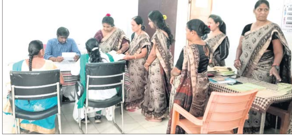
ଜିଲ୍ଲାପାଳ ସଖୀ କେନ୍ଦ୍ରର କାର୍ଯ୍ୟ ତନଖି କରୁଛନ୍ତି ।

ଅଞ୍ଚଳର ଏକ ନିକଟିଆ ସ୍ଥାନରୁ ଟ୍ରକ ଠାବ ହୋଇଛି । ଚୋରି କରିଥିବା ଅଭିଯୁକ୍ତ ପମ୍ପ ପରିସରରେ ଟ୍ରକକୁ ପାର୍କିଂ କରି ଡ୍ରାଇଭର ଏକ ହୋଟେଲରେ ଶୋଇଥିବା ସମୟରେ ଗାଡ଼ି ଚୋରି ହୋଇଥିଲା । ୨୪ ଘଣ୍ଟା ମଧ୍ୟରେ ପୋଲିସ ଉକ୍ତ ଟ୍ରକକୁ ଠାବ କରିଛି । ଟ୍ରକ ଠାବ କରିବା ପାଇଁ ଗୋପାଳପୁର ଥାନା ପୋଲିସ ଏକ ଟିମ ଗଠନ କରି ବିଭିନ୍ନ ସ୍ଥାନରେ ଚଢ଼ାଉ କରିଥିଲା । ବୁଧବାର ଗାଡ଼ି ଚୋରି ହୋଇଥିଲା । ଗାଡ଼ି ଚୋରିରେ ପୁରୀ ଜିଲ୍ଲା ଖୁଣ୍ଟିଆ ବାଗପୁର