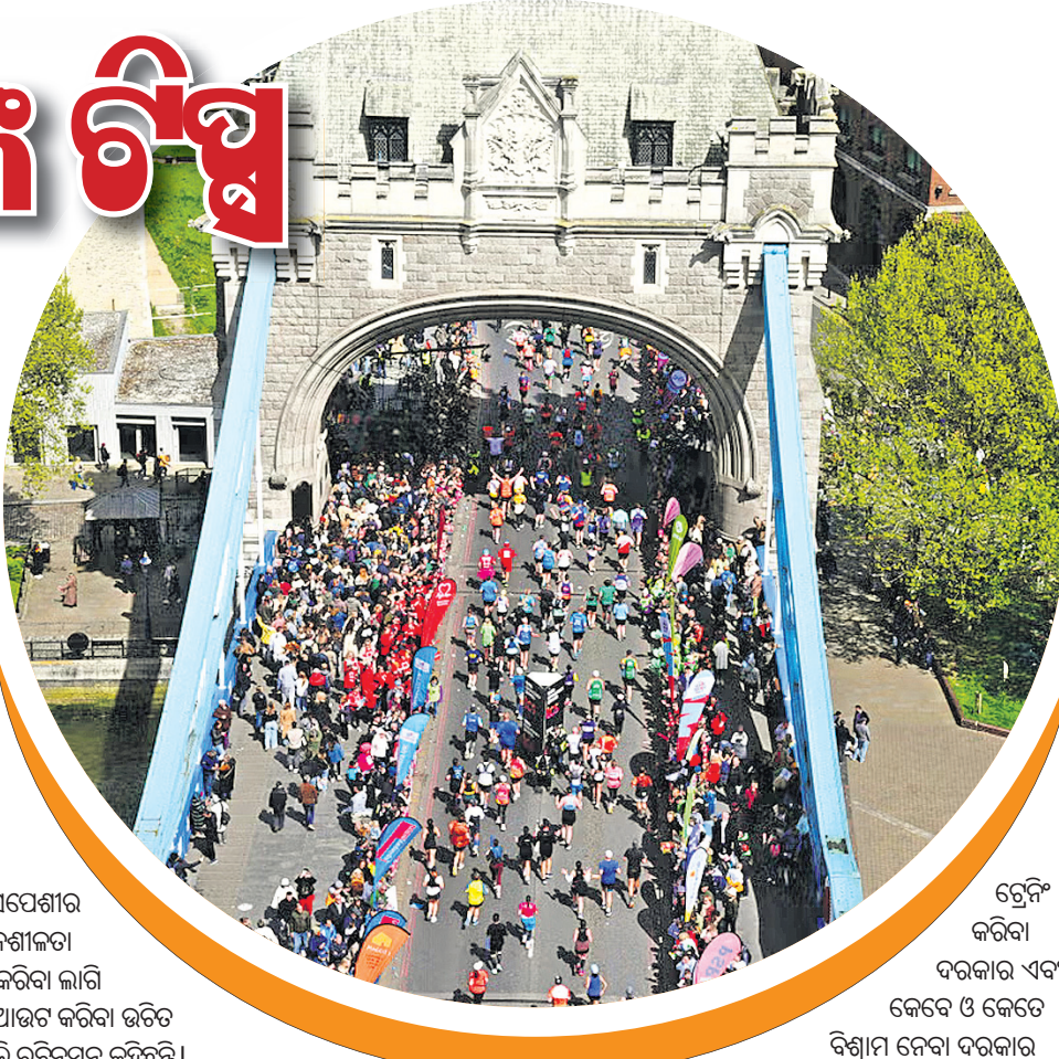
ଟ୍ରେନିଂ କରିବା ଦରକାର ଏବଂ କେତେ ଓ କେତେ ବିଶ୍ରାମ ନେବା ଦରକାର