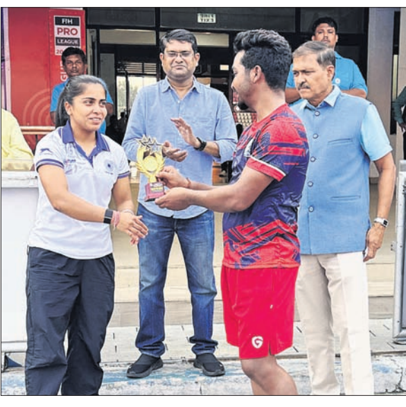
ଅତିଥି ଚେନ୍ନାଇ ଅଫ୍ ମ୍ୟାଚ ପୁରୀସ୍ତ୍ରୀ ପ୍ରଦାନ କରୁଛନ୍ତି।