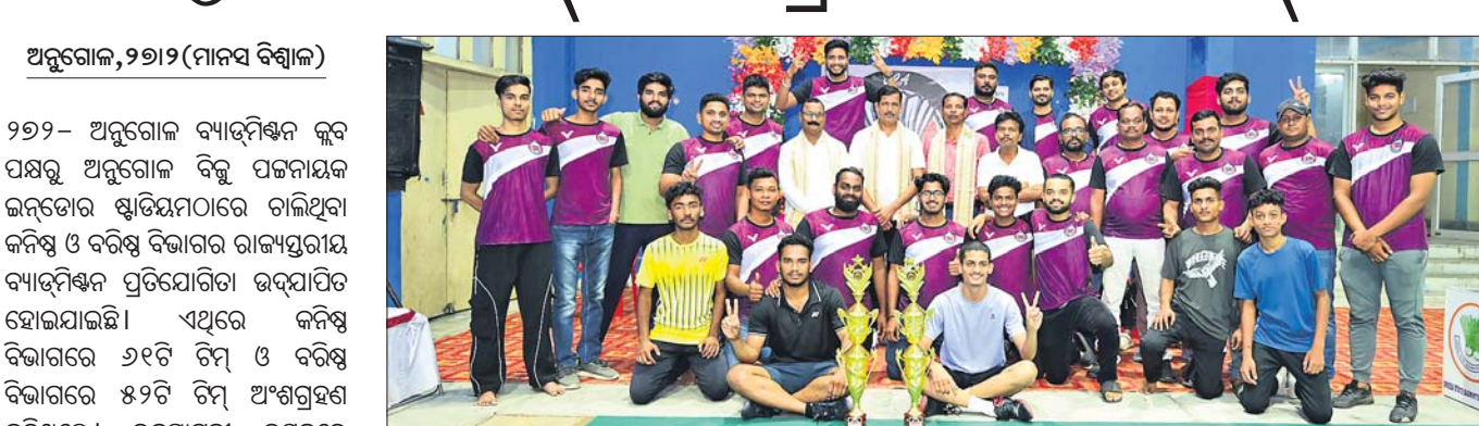
ପୁରସ୍କୃତ ଖେଳାଳିଙ୍କ ସହ ଅନ୍ୟମାନେ ।

ଅନୁଗୋଳ ବନ ବିଭାଗ ଓ ଏକେଡ଼ିଆଲ ଚିମ୍ପ ପକ୍ଷରୁ ବନ୍ୟପ୍ରାଣୀ ସୁରକ୍ଷା ସଚେତନତା କାର୍ଯ୍ୟକ୍ରମ ରୁପାବାର ଅନୁଷ୍ଠିତ ହୋଇଯାଇଛି । ବନ୍ୟପ୍ରାଣୀଙ୍କ ସୁରକ୍ଷାରେ ସ୍ଥାନୀୟ ସମ୍ପ୍ରଦାୟକୁ ଚଢ଼ିତ କରିବା ପାଇଁ ପାରମ୍ପରିକ ପାଲା ମାଧ୍ୟମରେ ଅନେକ ସମୟରେ ଏହି କାର୍ଯ୍ୟକ୍ରମ କରାଯାଇଥାଏ । ଗ୍ରାମାଞ୍ଚଳର ସ୍ଥାନୀୟ କଳାକାର ଏବଂ ବନ ସୁରକ୍ଷା ସମିତି ପକ୍ଷରୁ ପାଲା ଓ ନୃତ୍ୟ ମାଧ୍ୟମରେ ବିକଳପ୍ରାଣୀ ବନ୍ୟଜୀବ, ପ୍ରଜାତି ଏବଂ ସମାଜିକ ବାସସ୍ଥାନକୁ ସୁରକ୍ଷା ଦେବାକୁ ଆବଶ୍ୟକତା ସମ୍ପର୍କରେ ବୁଝାଇ ଦିଆଯାଇଛି । ମହାଶିବରାତ୍ରି ଉତ୍ସବ ପାଳନ ସମୟରେ ବୁଢ଼ିପାହାଡ଼ ବନ ସୁରକ୍ଷା ସମିତି ପକ୍ଷରୁ ଗ୍ରାମର ସହଦେବ ମନ୍ଦିର ପରିସରରେ ଏକ ବିଶେଷ ସଚେତନତା କାର୍ଯ୍ୟକ୍ରମ ଅନୁଷ୍ଠିତ ହୋଇଥିଲା । ଜଙ୍ଗଲ