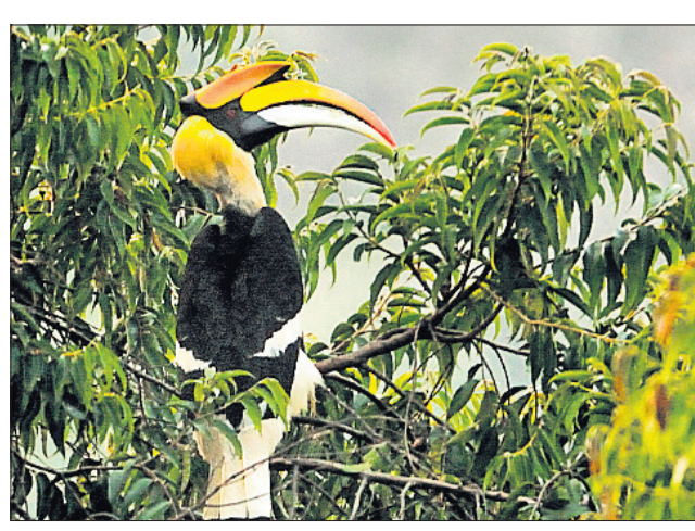
ସାତକୋଶିଆ ଅଭୟାରଣ୍ୟରେ ଦେଖାଯାଉଥିବା କୋଟିକାଖାଇ ପକ୍ଷୀ

ମିଳିଥାଆନ୍ତି। ଏହିପକ୍ଷୀ ଦେଖିବାକୁ ବହୁତ ସୁନ୍ଦର। ଏହାର ଶରୀର କଳା ଧଳା ମିଶ୍ରିତ ହୋଇଥିବା ବେଳେ ବେକ ତଳେ ଧଳା ରଙ୍ଗର ଦାଗ ରହିଥାଏ। ଅର୍ଦ୍ଧଚନ୍ଦ୍ରାକାର ତୁଳନାରେ ଯଥେଷ୍ଟ ଲମ୍ବିଆ ଓ ବକ୍ର। ହଳଦୀ ରଙ୍ଗର ଲମ୍ବିଆ ଅଣ୍ଟା ଉପରେ ମୁକୁଟ ପରି ଗଠନ ରହିଥିବାରୁ ଏହା ଅତ୍ୟନ୍ତ ସୁନ୍ଦର ଦେଖାଯାଇଥାଏ। ଦେଖା କୋଟିକାଖାଇ ପକ୍ଷୀ କୋଟିକା ଫଳ ଓ ଜଙ୍ଗଲର ଅନ୍ୟାନ୍ୟ ଫଳକୁ ଖାଏ ଓ ଗ୍ରହଣ କରିଥାଏ। ଶୀତଦିନେ ସକାଳ ୯ ଘଣ୍ଟା ପୂର୍ବରୁ ଏମାନେ ମହାନଦୀ କୂଳରେ ଥିବା ଉକା ବରଗଛ, ଫାପାଗଛ ଓ କୋଟିକା ଗଛର ଅଗ୍ର ଭାଗରେ ବସିଥାନ୍ତି। ଗୋଟିଏ ଦିନରେ ୧୫ରୁ ୨୦ଟି କୋଟିକାଖାଇ ପକ୍ଷୀ ରହିଥାଆନ୍ତି। ଗୋଟିଏ ମାଲ କୋଟିକାଖାଇ ପକ୍ଷୀ ୨ରୁ ୩ଟି ଅଣ୍ଟା ଦେଇଥାଏ। ନିଜକୁ ଏବଂ ଛୁଆକୁ ଶତ୍ରୁ ବାଉରୁ ରକ୍ଷା କରିବା ପାଇଁ ଏମାନେ ଉଚ୍ଚ ଗଛର କୋରଡ଼ରେ ବସା ବାସିଥାନ୍ତି। ତେବେ ଏହି ବିରଳ ପ୍ରକାରର ପକ୍ଷୀ ଧୀରେ