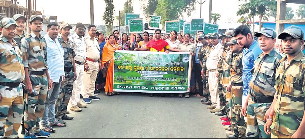
ସଚେତନତା କାର୍ଯ୍ୟକ୍ରମରେ ଉପସ୍ଥିତ ବନ ବିଭାଗ ଅଧିକାରୀ ଓ ଅନ୍ୟମାନେ ।

ଅନୁଗୋଳ ବନ ବିଭାଗ ଓ ଏକେଡ଼ିଆଲ ଚିମ୍ପ ପକ୍ଷରୁ ବନ୍ୟପ୍ରାଣୀ ସୁରକ୍ଷା ସଚେତନତା କାର୍ଯ୍ୟକ୍ରମ ରୁପାବାର ଅନୁଷ୍ଠିତ ହୋଇଯାଇଛି । ବନ୍ୟପ୍ରାଣୀଙ୍କ ସୁରକ୍ଷାରେ ସ୍ଥାନୀୟ ସମ୍ପ୍ରଦାୟକୁ ଚଢ଼ିତ କରିବା ପାଇଁ ପାରମ୍ପରିକ ପାଲା ମାଧ୍ୟମରେ ଅନେକ ସମୟରେ ଏହି କାର୍ଯ୍ୟକ୍ରମ କରାଯାଇଥାଏ । ଗ୍ରାମାଞ୍ଚଳର ସ୍ଥାନୀୟ କଳାକାର ଏବଂ ବନ ସୁରକ୍ଷା ସମିତି ପକ୍ଷରୁ ପାଲା ଓ ନୃତ୍ୟ ମାଧ୍ୟମରେ ବିକଳପ୍ରାଣୀ ବନ୍ୟଜୀବ, ପ୍ରଜାତି ଏବଂ ସମାଜିକ ବାସସ୍ଥାନକୁ ସୁରକ୍ଷା ଦେବାକୁ ଆବଶ୍ୟକତା ସମ୍ପର୍କରେ ବୁଝାଇ ଦିଆଯାଇଛି । ମହାଶିବରାତ୍ରି ଉତ୍ସବ ପାଳନ ସମୟରେ ବୁଢ଼ିପାହାଡ଼ ବନ ସୁରକ୍ଷା ସମିତି ପକ୍ଷରୁ ଗ୍ରାମର ସହଦେବ ମନ୍ଦିର ପରିସରରେ ଏକ ବିଶେଷ ସଚେତନତା କାର୍ଯ୍ୟକ୍ରମ ଅନୁଷ୍ଠିତ ହୋଇଥିଲା । ଜଙ୍ଗଲ