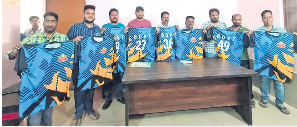
ଖବରଦାତା ସମ୍ମିଳନୀରେ ଗ୍ରନ୍ଥ କର୍ମକର୍ମୀମାନେ କର୍ତ୍ତୃ ଉଦ୍ଘୋଟନ କରୁଛନ୍ତି ।

ଅନୁଗୋଳ, ୨୭/୧ (କ୍ୟୋତିରଞ୍ଜନ ସାହୁ) ବାସନ୍ତୀ ଭଲିବଲ୍ ଗ୍ରନ୍ଥ ପକ୍ଷରୁ ଅନୁଗୋଳ କମ୍ପ ୨୦୨୫ ଆସନ୍ତା ମାର୍ଚ୍ଚ ୧ରୁ ଆରମ୍ଭ ହୋଇ ୨ ତାରିଖରେ ଶେଷ ହେବ । ଜାତୀୟସ୍ତରର ଏହି ଚୂର୍ଣ୍ଣାମେଣ୍ଟରେ ରାଜ୍ୟର କିଛି ଭଲିବଲ୍, ସୂର୍ଯ୍ୟଶିଖା ଭଲିବଲ୍, ଷୋର୍ଟ୍ ହସ୍ପେଲ ଭୁବନେଶ୍ୱର, ବାସନ୍ତୀ ଭଲିବଲ୍ ଏବଂ ରାଜ୍ୟ ବାହାରରୁ ହରିଆନା ସ୍ଥାନକର୍ତ୍ତା ଓ ଉତ୍ତରପ୍ରଦେଶ ଯଙ୍ଗ୍‌ସ୍ପୁର ଭଳି ୬ଟି ଦଳ ଭାଗ ନେବ ।