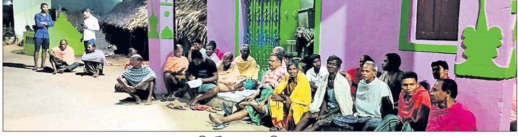
ପ୍ରସ୍ତୁତି ବୈଠକରେ ଉପସ୍ଥିତ ଅଞ୍ଚଳବାସୀ ।

ବରକଳା, ୨୭/୧ (ପୁଷ୍ପିତ ସାହୁ) ଅନୁଗୋଳ ଜିଲ୍ଲା ବରକଳା ପଞ୍ଚାୟତ ସାହାରାଚୋଡ଼ା ଗ୍ରାମରେ ମେଳଣ ଯାତ୍ରା ପାଇଁ ଏକ ପ୍ରସ୍ତୁତି ବୈଠକ ଅନୁଷ୍ଠିତ ହୋଇଯାଇଛି । ଆସନ୍ତା ମାର୍ଚ୍ଚ ୧୨ ତାରିଖରେ ମେଳଣ ଯାତ୍ରା ଅନୁଷ୍ଠିତ ହେବ ବୋଲି ବୈଠକରେ ନିଷ୍ପତ୍ତି ନିଆଯାଇଛି । ନାରିନିର୍ଦ୍ଦେଶ ଅନୁସାରେ ମଧ୍ୟାହ୍ନ ୧୨ଟାରେ ହୋମଯାତ୍ରା, ସନ୍ଧ୍ୟା ୭ଟାରେ ରାଧାକୃଷ୍ଣଙ୍କ ବିଗ୍ରହକୁ ସୁସଜ୍ଜିତ ବିମାନରେ ବସାଇ