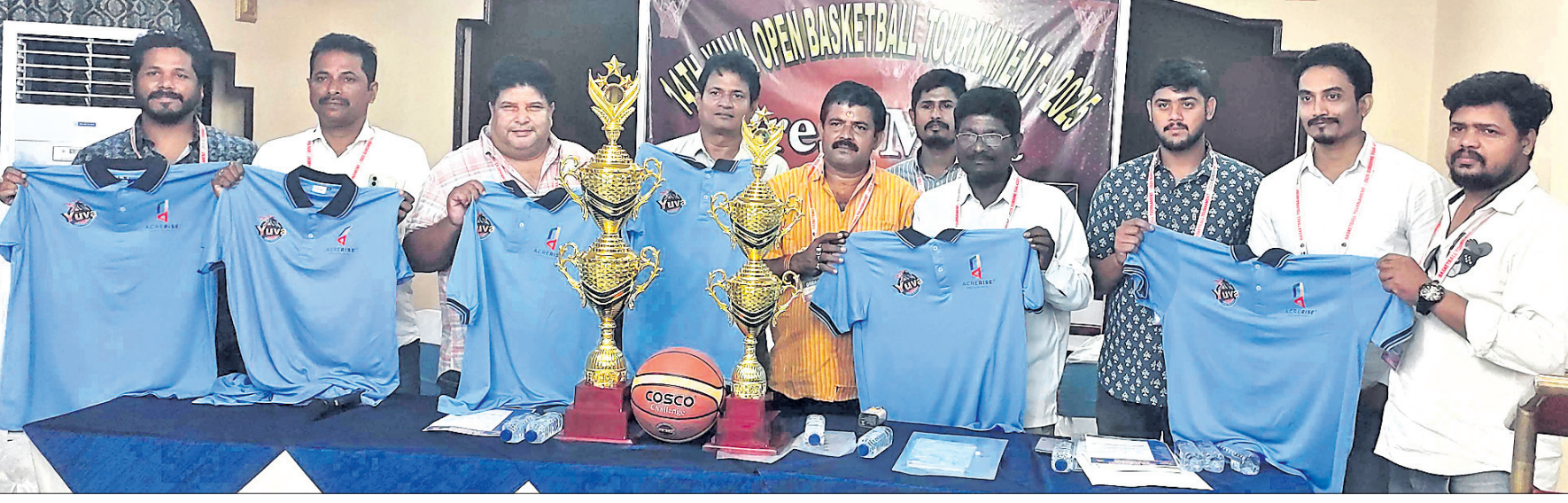
ଖବରଦାତା ସମ୍ମିଳନୀରେ ଆୟୋଜକମାନେ ଟ୍ରଫି ଓ ଜର୍ସି ଉନ୍ମୋଚନ କରୁଛନ୍ତି।

ଭୁବନେଶ୍ୱର, ୨୭/୨ (ତପନ ସାହୁ) ସନ୍‌ସାଇନ୍ ଯୁବ ଆସୋସିଏସନ୍ ଆନୁକୂଲ୍ୟରେ ୧୪ଶ ଓପନ ବାସ୍‌କେଟ୍‌ବଲ୍ ପ୍ରତିଯୋଗିତା ଶୁକ୍ରବାରଠାରୁ ଆରମ୍ଭ ହେବାକୁ ଯାଉଛି। ଇମ୍ପାପାକି ବାସ୍‌କେଟ୍‌ବଲ୍ କୋର୍ଟରେ ଏହା ମାର୍ଚ୍ଚ ୨ ତାରିଖ ପର୍ଯ୍ୟନ୍ତ ଚାଲିବ। ଲିଗ୍ ପଦକ୍ଷେପରେ ଖେଳାଯିବାକୁ ଥିବା ଏହି ପ୍ରତିଯୋଗିତାରେ ବିଭିନ୍ନ ରାଜ୍ୟର ମୋଟ ୧୨ଟି ଦଳ