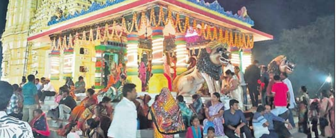
ରେଙ୍ଗାଳିର ଏକ ଶୈବପୀଠରେ ଜାଗରଯାତ୍ରା ପାଳନ କରାଯାଇଛି ।

କଣିହାଁ କୁଳ ରେଙ୍ଗାଳି ପ୍ରକଳ୍ପ ଅଞ୍ଚଳରେ ଥିବା ଆଖଣ୍ଡଳମଣି ମନ୍ଦିର, କପିଳେଶ୍ୱର ମନ୍ଦିର ସମେତ ରେଙ୍ଗାଳି ଗ୍ରାମ ଶିବମନ୍ଦିର, ଦେବାଳି ଗ୍ରାମ ରାମେଶ୍ୱର ମନ୍ଦିର, ବଜ୍ରକୋଟ ଗ୍ରାମ ଭିକ୍ଷେଶ୍ୱର ମନ୍ଦିର ଆଦିରେ ରୁପାବାର ମହାଶିବରାତ୍ରି ପାଳିତ ହୋଇଯାଇଛି । ରେଙ୍ଗାଳି ପ୍ରକଳ୍ପ ଓସିଦି କଲୋନି ନିକଟସ୍ଥ ବାବାମଣି ମନ୍ଦିରରେ ଶୁଣ୍ଠିକିତ ଭାବେ ନାଟକାଦି ଅନୁଷ୍ଠିତ ହୋଇଥିଲା । ମୁଖ୍ୟ ଉପଦେଷ୍ଟା ଆକୃଳ ପଣ୍ଡାଙ୍କ ପୌରୋହିତ୍ୟରେ ବିଭିନ୍ନ ପୀଠରୁ ୩୨୭୫ ଦେବଦେବୀଙ୍କ ସହ ରେଙ୍ଗାଳି ପ୍ରକଳ୍ପର ମା' ବାଟମଙ୍ଗଳା ଓ ତାଳଚେରର ମା' ହିଙ୍ଗୁଳାଙ୍କୁ ରେଙ୍ଗାଳି ପ୍ରକଳ୍ପରୁ ବାପଘର ଆଖଣ୍ଡଳମଣି ମନ୍ଦିରକୁ ଆନୁଗ୍ରହ କରି ଶାଣାୟାଇଥିଲା ।