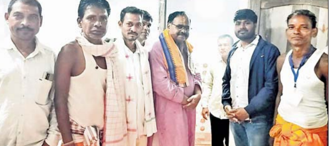
ଆଠମଲିକ ବିଧାୟକଙ୍କ ସହିତ ଅନ୍ୟମାନେ ।