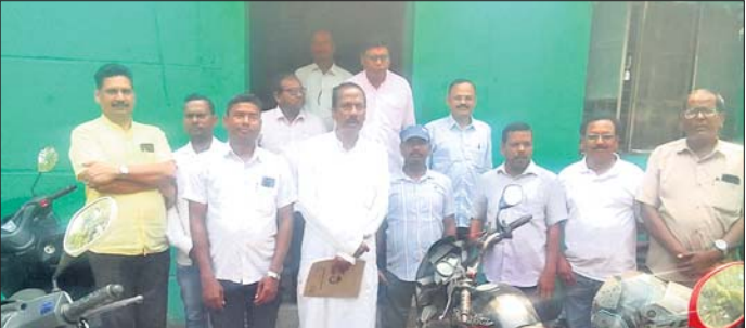
ବୈଠକରେ ପୂର୍ବତନ ଏମ୍ପିଏ ସମେତ ସଚେତନ ନାଗରିକ ମଞ୍ଚର କର୍ମକର୍ମୀମାନେ ।

ତାଳଚେର ଶିଳ୍ପାଞ୍ଚଳରେ ଥିବା ବିପ୍ଳାବିତଙ୍କ ସମସ୍ୟା, ନିୟୁତ୍ତି, ଅଭିଯାନ, ପରିପାତ୍ରିକ ଭବନ ଆଦି ନେଇ ସାଧାରଣ ଲୋକଙ୍କ ସମସ୍ୟା ବଢ଼ି ଚାଲିଛି । ଏହାର ସମାଧାନ ପାଇଁ ଶିଳ୍ପାଞ୍ଚଳ, ପ୍ରଶାସନ କର୍ମୀ ଲୋକ ପ୍ରତିନିଧିଙ୍କ ମଧ୍ୟରେ ଆନ୍ତରିକତା