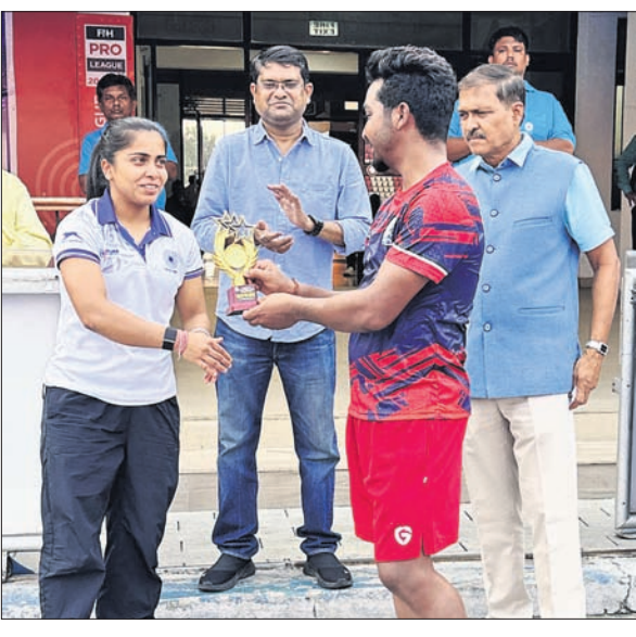
ଅତିଥି ଚୋପର ଅଫ୍ ମ୍ୟାଚ ପୁରୀସ୍ତ୍ରୀ ପ୍ରଦାନ କରୁଛନ୍ତି।