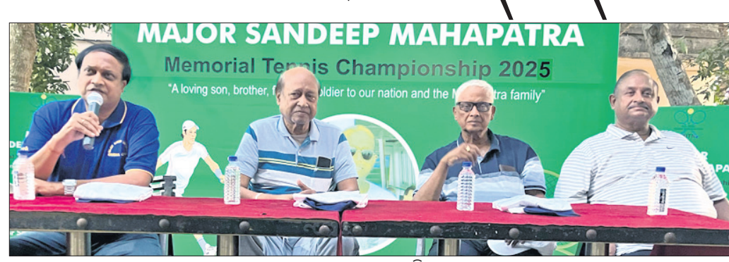
ଉଦ୍‌ଘାଟନା ଅବସରରେ ଅତିଥିମାନେ।

ଯୋଗ୍ୟତା ପର୍ଯ୍ୟାୟରେ ଓଡ଼ିଶାର ଶୁଭମ୍, ସ୍ୱପ୍ନିକ, ଶୁଭନିଲ, ଆହାନ ବିଜୟୀ ଭୁବନେଶ୍ୱର, ୧୩ (ତପନ ସାହି) ମେଣ୍ଟାଲିଟି ଉନ୍ନତ କରିବା ପାଇଁ ଆଖ୍ୟାୟିକା କ୍ଲବ ପରିସରରେ ଶନିବାର ୨.୫ ଲକ୍ଷ ଟଙ୍କା ବିଶିଷ୍ଟ ଯୋଗ୍ୟତା ସନ୍ମାପ ସର୍ବଭାରତୀୟ ଚେନିସ୍ ପ୍ରତିଯୋଗିତା ଆରମ୍ଭ ହୋଇଛି। ମିଶନ ଅଲିମ୍ପିକ୍ ସ୍ପୋର୍ଟ୍ସ ପାଉଣ୍ଡେସନ (ଏମ୍‌ଏସ୍‌ଏସ୍), ସର୍ବଭାରତୀୟ ଚେନିସ୍ ଆସୋସିଏସନ (ଏଆଇଟିଏ) ଏବଂ ଓଡ଼ିଶା ଚେନିସ୍ ଆସୋସିଏସନ (ଓଟିଏ)ର ମିଳିତ ଆୟତ୍ତନରେ ଆୟୋଜିତ ଏହି ପ୍ରତିଯୋଗିତା ୬ ତାରିଖ ପର୍ଯ୍ୟନ୍ତ ଚାଲିବ। ଚୂନାମେଣ୍ଟରେ ଓଡ଼ିଶା, ଗାମ୍ପା, ହରିୟାଣା, କର୍ନାଟକ, ଦିଲ୍ଲୀ, ମଧ୍ୟ ପ୍ରଦେଶ, ଉତ୍ତର ପ୍ରଦେଶ, ମଣିପୁର, ପଞ୍ଜାବ, ପଶ୍ଚିମବଙ୍ଗ, ଆସାମ, ତେଲଙ୍ଗାନା, ଆନ୍ଧ୍ର ପ୍ରଦେଶ ଓ ମହାରାଷ୍ଟ୍ର ଆଦି ୧୪ଟି ରାଜ୍ୟରୁ ୪୯ ପ୍ରତିଭାସମ୍ପନ୍ନ ଖେଳାଳି ଅଂଶଗ୍ରହଣ