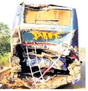
ଭୁବନେଶ୍ୱର ଗ୍ରାସ୍ତ ବସ୍

୧୨ ନଂ. ଜାତୀୟ ରାଜପଥର ଭଦ୍ରକ ଜିଲା ଭଞ୍ଜାରିପୋଖରୀ ଥାନା ଅଧୀନ ଛତାବନ ନିକଟରେ ଶୁକ୍ରବାର ରାତି ପ୍ରାୟ ୩ଟା ବେଳେ ଦିଲ୍ଲି ବୁର୍ସଟଣା ଯାତ୍ରୀ ବସ୍ ଧକ୍କା ଖାଇ ଏବଂ କଣ୍ଠେନର ଧକ୍କା ଦେବାରୁ ୧୨ଜଣ ଆହତ ହୋଇଛନ୍ତି। ସେମାନଙ୍କ ମଧ୍ୟରୁ ୭ଜଣ ଗୁରୁତର ଥିବାବେଳେ କଟକ ବଡ଼ ଡାକ୍ତରଖାନାକୁ ସ୍ଥାନାନ୍ତର କରାଯାଇଛି। ସୂଚନା ଅନୁଯାୟୀ, ଗତାଗୁ ପ୍ରାୟ ୫୦ରୁ ଊର୍ଦ୍ଧ୍ୱ ଯାତ୍ରୀଙ୍କୁ ନେଇ 'ନିର୍ମି' ନାମକ ବସ୍ ପୁରୀ ଅଭିଯୁକ୍ତ ଯାଉଥିବା ବେଳେ ଛତାବନ ନିକଟରେ ଗାୟାର ପକ୍ଷରୁ ହୋଇଯାଇଥିଲା। ବସ୍ତୁ ରାସ୍ତାପାର୍ଶ୍ୱରେ ସାଇଡ୍ କରି ଚଳା ବଦଳାଉଥିବା ବେଳେ ପଛପଟୁ ଦୁରନ୍ତରେ ଯାଉଥିବା ଏକ ବାଲି ଦେଖି ହାଇଡ୍ରା ଧକ୍କା ଦେଇଥିଲା। ତା' ପଛକୁ ଏକ କଣ୍ଠେନର ମଧ୍ୟ ହାଇଡ୍ରା ସହ ବସ୍ତୁ ଧକ୍କା ଦେଇଥିଲା।