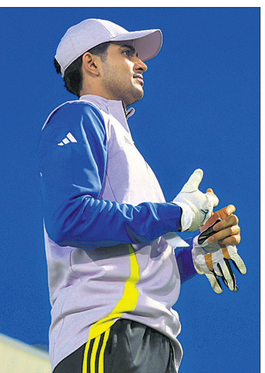
ଶନିବାର ଦୁବାଇରେ ଅଭ୍ୟାସ ଅବସରରେ ଶ୍ରେଣୀଭେଦ ରିଲିଂ ଓ ଅର୍ଶଦାପ ଦିଏ।

ଦୁବାଇ, ୧୩ (ପି.ଟି.) ଚଳିତ ଆଇସିସି ଚାମ୍ପିୟନ୍ସ ଟ୍ରଫି ଚୂନାମେଣ୍ଟର ସେମିଫାଇନାଲରେ ପ୍ରବେଶ କରିଥିବା ଦକ୍ଷିଣ ଆଫ୍ରିକା ନେତୃତ୍ୱାଧୀନ ଭାରତୀୟ ଦଳ ରବିବାର ଚା'ର ଅତିନି ତଥା ତୃତୀୟ ମ୍ୟାଚରେ ଖେଳିବାକୁ ଭେଟିବାକୁ ଯାଇଛି। ଉଭୟ ଦଳ ଗ୍ରୁପ୍ ପର୍ଯ୍ୟାୟରେ ଲଗାତର ଦୁଇଟି ବିଜୟ ସହ ସେମିଫାଇନାଲରେ ସ୍ଥାନ ପକ୍ଷ କରିଛନ୍ତି। ଏହାପରେ ଏହି ମ୍ୟାଚର ବିଶେଷ ଗୁରୁତ୍ୱ ରହିଛି। ଏହି ମ୍ୟାଚର ଫଳାଫଳ ଆଧାରରେ ସେମାନେ ସେମିଫାଇନାଲରେ କାହାକୁ ଭେଟିବେ, ତାହା ନିଶ୍ଚିତ ହେବ। ଚୂନାମେଣ୍ଟରେ ଦୁଇ ମ୍ୟାଚରେ ଦୁଇଟି ବିଜୟ ସହ ଭାରତୀୟ ବ୍ୟାଟରମାନେ ଶ୍ରେଣୀଭେଦ ଆଗରେ ଅବହଳ ଅନୁଭବ କରୁଥିବା ପରିଲକ୍ଷିତ ହୋଇଛି। ଦକ୍ଷିଣ ଆଫ୍ରିକା ଦଳର ବିଭାଗ ଭାରତ ଲାଗି ଚ୍ୟାଲେଞ୍ଜ ହୋଇପାରେ। ଅଧିନାୟକ ମିଚେଲ ସାଣ୍ଟନର ଦକ୍ଷିଣ ଆଫ୍ରିକା ଦଳର ନେତୃତ୍ୱ ନେବେ। ଏପର୍ଯ୍ୟନ୍ତ ଚୂନାମେଣ୍ଟରେ ଭାରତୀୟ ବ୍ୟାଟରମାନେ ଶ୍ରେଣୀଭେଦ ବିପକ୍ଷରେ ଏକ ଓ ଦୁଇ ରନ ନେଇଥିବା ବେଳେ ପ୍ରେସ ବୋଲରଙ୍କ ବିପକ୍ଷରେ ସୁତରାପରେ ରନ କରିବାକୁ ବ୍ୟବହାର କରାଯାଇଛି। ରବିବାର ହେବାକୁ ଥିବା ମ୍ୟାଚରେ ଭାରତୀୟ ଦଳକୁ ମାଲକେଲ ଟ୍ରେସେଲ୍ଲୋ, ଅଧିନାୟକ ସାଣ୍ଟନର ଓ ନିୟମିତ ବୋଲିଂ କରୁ ନ ଥିବା ବ୍ରେନ ପିଲିସ୍ କୁ ସମ୍ମୁଖୀନ ହେବାକୁ ପଡ଼ିବ। ପାକିସ୍ତାନ ବିପକ୍ଷରେ ଶ୍ରେଣୀଭେଦ ରିଲିଂ ବିରାଟ କୋହଲିଙ୍କ ଦର୍ଶନୀୟ ବ୍ୟାଟିଂ ଦର୍ଶାଇ ମନୋବଳକୁ ବଢ଼ାଇଛି। କିନ୍ତୁ ଦୁବାଇ ଅନ୍ତର୍ଜାତୀୟ କ୍ରିକେଟ ଷ୍ଟୁଡିଓମରେ ପିକ୍ଚର ଧାରେ ଧାରେ ଖରାପ ହେଉଥିବାରୁ ବ୍ୟାଟିଂ ଅଧିକ କଷ୍ଟକର ହୋଇପାରେ। ଏହାକୁ ଦୃଷ୍ଟିରେ ରଖି ଭାରତ ଦଳର