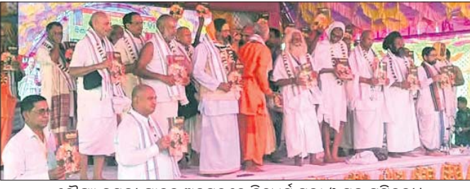
ରୌପ୍ୟ ଜୟନ୍ତୀ ପାଳନ ଅବସରରେ ହିନ୍ଦୁଧର୍ମ ସଭା ଓ ସହ ସମ୍ମିଳନୀ।

ପବିତ୍ରଗର, ୧୩ (ନିରୋଜ ପ୍ରଧାନ) କର୍ମିନ୍ଦ୍ର ବୁକ୍ ଗହମସ୍ଥିତ ନିତାଇଗୌର ଆଶ୍ରମର ରୌପ୍ୟ ଜୟନ୍ତୀ ପାଳନ ବାବଦ ଟଙ୍କା ସମ୍ପୂର୍ଣ୍ଣ ଗହଣା ମାଲିକଙ୍କୁ ଦିଆଯିବ ବୋଲି ଲୋଭ ଦେଖାଇଥିଲେ। ୧୧ ଦିନ ଧରି ଚାଲିଥିବା ଏହି ଠକେଇକାରୀ ଚାଳକରେ ବିଭିନ୍ନ ଦିବସରେ ଅନେକ ଆଧ୍ୟାତ୍ମିକ କାର୍ଯ୍ୟକ୍ରମ କରାଯାଇଥିଲା। ସପ୍ତାହ ଧରି ଦେବା ସହ ପ୍ରଦେଶକୁ ୨୦୦/୩୦୦ ଟଙ୍କା ସହ କିଛି ବାସନ ସାମଗ୍ରୀ ଦେଇଥିଲେ। ଏହାଦେଖି ଅନ୍ୟ ମହିଳାମାନେ ଲୋଭରେ ସୁନା ଅଳଙ୍କାର ଫଟୋ ଉଠାଇବାକୁ ଦେଇଥିଲେ। ଏହାପରେ ୨ ଅପରିଚିତ ମହିଳା ଗହଣାତକ ଧରି ଚଳନ୍ତ ମାରିଥିଲେ।