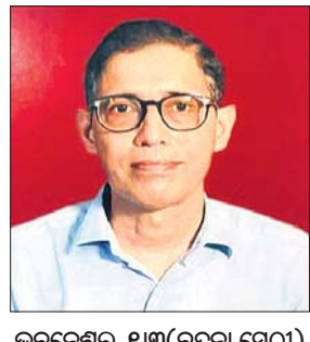
ଭୁବନେଶ୍ୱର, ୧୩ (ବନ୍ଦନା ସେଠା)