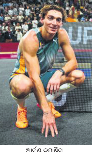
କ୍ଲେମେଣ୍ଟ-ଫେରାଷ୍ଟ (ଫ୍ରାନ୍ସ), ୧୩ (ଏପି)