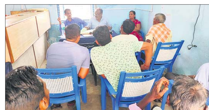
ପୋକଚୁକା ସେବା ସମବାୟ ସମିତିରେ ଦୁର୍ନୀତି ଅଭିଯୋଗର ତଦନ୍ତ କରାଯାଇଛି।