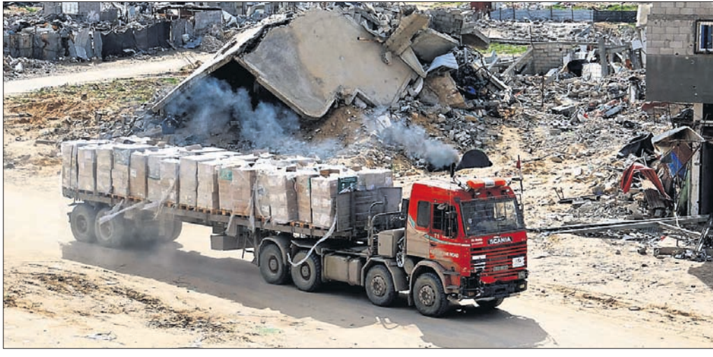
ମାନବୀୟ ସହାୟତା ନେଇ ଯାଉଥିବା ଏକ ଟ୍ରକ୍ ଗାଜା ସୀମାରେ ଅଟକିଛି।

ଗାଜା ଷ୍ଟିପ୍ସକୁ ସହାୟତା ସାମଗ୍ରୀ ନେଇ ଯାଉଥିବା ଗାଜାକୁ ଉପାଡ଼ନ କରାଯାଇଛି। ମୁକ୍ତବିରତି ସମୟସୀମା ବଢ଼ାଇବା ପାଇଁ ନୂଆ ପ୍ରସ୍ତାବକୁ ହମାସ୍ ଯଦି ଗ୍ରହଣ ନ କରେ, ତେବେ ଏହାର ଅତିରିକ୍ତ ପରିଣାମ ପାଇଁ କେନ୍ଦ୍ରକଲମ୍ପ ଚେତାବନା ଦେଇଛି।