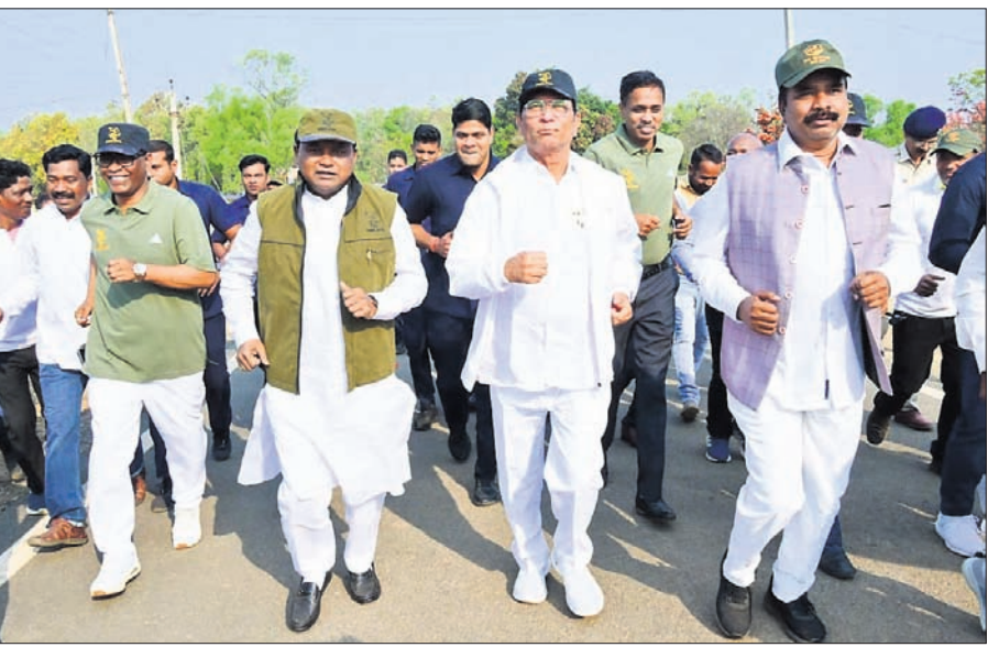
ମାରାଧନରେ ଅଂଶ ଗ୍ରହଣ କରିଥିବା ମୁଖ୍ୟମନ୍ତ୍ରୀ ମୋହନ ଚରଣ ମାଝୀ ଓ ଅନ୍ୟମାନେ।