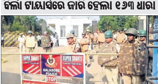
ବିକାଳ ଗାୟାରେ ଜାରି ହେଲା ୧୨୩ ଧାରା

ବାଲେଶ୍ୱର (ବାସ୍ତବିକ ସେ)/ ରେପୁଣ୍ଡା (ରବୀନ୍ଦ୍ର ମହାକୁଡ଼), ୨୩ ବାଲେଶ୍ୱର ବାମପଦାସ୍ଥିତ ବିକାଳ ଗାୟା (ତାଲମିଆ ଭାରତ ଏବଂ ହିମାଦ୍ରୀ କେମିକାଲସ) ଫାଟକ ସମ୍ମୁଖରେ ରବିବାର ଭରଜନା ଦେଖାଦେଇଥିବା ଦୀର୍ଘଦିନ ଧରି ଫାଟକ ସମ୍ମୁଖରେ ବସିଥିବା ଆନ୍ଦୋଳନକାରୀଙ୍କୁ ପୋଲିସ ଉଠାଇ ନେଇଛି।