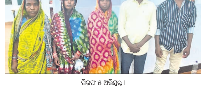
ଗିରଫ ୫ ଅଭିଯୁକ୍ତ।

ପୋଲିସ୍ ଅଧିକାରୀମାନେ ଗାଁରେ ତଦନ୍ତ କରୁଛନ୍ତି। ସ୍ୱାମୀ ନାଟକ ପରିବେଷଣ କରାଯାଇଛି। ଶନିବାର ରାତିରେ ଲୋକେ ଘରେ ତାଲା ପକାଇ ନାଟକ ଦେଖିବାକୁ ଯାଇଥିଲେ। ଦୁର୍ଭିକ୍ଷମାନେ ଏହାର ସୁଯୋଗ ନେଇ ୫ ଜଣଙ୍କ ଘରୁ ବିଭିନ୍ନ ସାମଗ୍ରୀ ଚୋରିକରି ମାମଲା (ନଂ.୩୫/୨୫) ରୁକୁ କରାଯାଇଛି। ମାତ୍ର ଅଭିଯୁକ୍ତମାନଙ୍କ କୌଣସି ପତା ମିଳିପାରିନାହିଁ। ଜାଗରଯାତ୍ରା ଉପଲକ୍ଷେ ସ୍ଥାନୀୟ ବାଲୁକେଶ୍ୱର ମହାଦେବଙ୍କ ପୀଠରେ ଚାରି ଦିନ ବ୍ୟାପୀ ଗ୍ରାମ ମୁବକମାନଙ୍କ