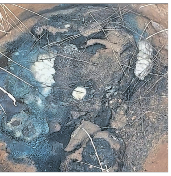
କୁଅ ଭିତର ପଡ଼ିଥିବା ହାତୀର ଗଳିତ ମୃତଦେହ।

ଆଠଗଡ଼, ୨୩ (ସେବା ପ୍ରସାଦ ରଥ) କଟକ ଜିଲ୍ଲା ଆଠଗଡ଼ ବନ୍ୟଜନ୍ତୁ ସଂରକ୍ଷଣ କ୍ଷେତ୍ରର କୁଅରୁ ହାତୀର ଗଳିତ ମୃତଦେହ ଠାବ କରାଯାଇଛି।