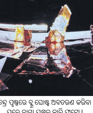
ଚନ୍ଦ୍ର ପୃଷ୍ଠରେ କୁ ଘୋଷ୍ଟ ଅବତରଣ କରିବା ପରେ ନାମା ପଦରୁ ବାରି ଫଟୋ।

କେନେଡ଼ି ସ୍ନେସ୍ ସେଣ୍ଟରରୁ କୁ ଘୋଷ୍ଟ ଲୁନାର ଲାଣ୍ଡରକୁ ଲଞ୍ଚ କରାଯାଇଥିଲା। ଏହି ଲାଣ୍ଡର ନାମ ପାଇଁ ଚନ୍ଦ୍ରରେ ୧୦ ବିଭିନ୍ନ ପରୀକ୍ଷା କରିବା କୁ ଘୋଷ୍ଟ ଲାଣ୍ଡରରେ ଏକ ସ୍ୱତନ୍ତ୍ର ଭାଷ୍ୟ ପ୍ରଦାନ କରାଯାଇଛି, ଯାହା ବିଶ୍ୱାସୀ ପାଇଁ ଚନ୍ଦ୍ରପୃଷ୍ଠରେ ଥିବା ମାଟିକୁ ସୁରକ୍ଷିତ ରଖିପାରିବ।