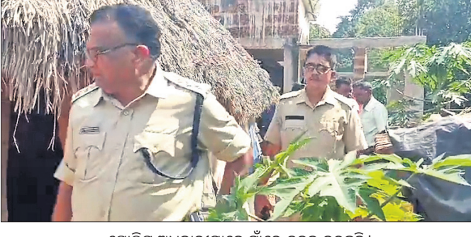
ପୋଲିସ୍ ଅଧିକାରୀମାନେ ଗାଁରେ ତଦନ୍ତ କରୁଛନ୍ତି।