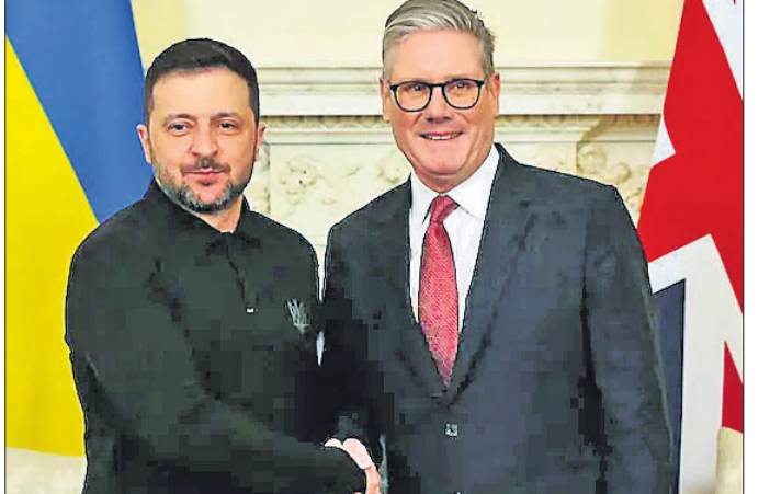
ବ୍ରିଟେନ୍ ପ୍ରଧାନମନ୍ତ୍ରୀ କେର୍ ଷ୍ଟର୍ମର ସହ ୟୁକ୍ରେନ୍ ରାଷ୍ଟ୍ରପତି ଭୋଲୋଡିମିର ଜେଲେନ୍ସ୍କି।

ରୁଷିଆ-ୟୁକ୍ରେନ୍ ମୁକ୍ତବିରତି ଅବସ୍ଥାନ ପାଇଁ ଅନୁବିରତି ଯୋଜନା ଉପରେ ବ୍ରିଟେନ୍, ଫ୍ରାନ୍ସ ଏବଂ ୟୁକ୍ରେନ୍ ଏକାଠି କାର୍ଯ୍ୟ କରିବାକୁ ରାଜି ହୋଇଛନ୍ତି।