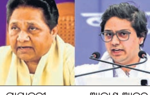
ମାୟାବତୀ ଆକାଶ ଆନନ୍ଦ ଅନୁଯାୟୀ, ରବିବାର ଦଳର ଶୀର୍ଷ ନେତାଙ୍କ ସହ ଏକ ବୈଠକରେ ମାୟାବତୀ ତାଙ୍କ ଭାଇ ଆନନ୍ଦ କୁମାର ଏବଂ ରାମକା ଗୌତମଙ୍କୁ ବିଏସ୍ପିର ଜାତୀୟ ସଂଯୋଜକ ଭାବେ ନିଯୁକ୍ତ ହୋଇଛନ୍ତି।