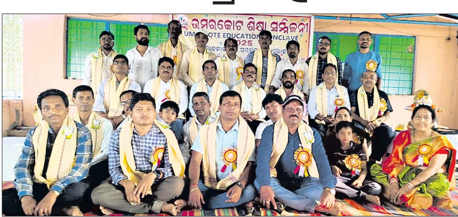
ଆଲୋଚନାରେ ଉପସ୍ଥିତ ଅତିଥି ଏବଂ ଶିକ୍ଷକ।