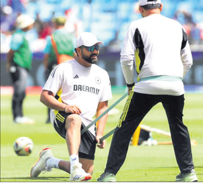
ଅଭ୍ୟାସ ସେସନରେ ଷ୍ଟ୍ରିକ୍ କରୁଛନ୍ତି ରୋହିତ ଶର୍ମା।

ଚଳିତ ଆଇସିସି ଚାମ୍ପିୟନ୍ସ ଟ୍ରଫିରେ ମଙ୍ଗଳବାର ଖେଳାଯିବାକୁ ଥିବା ପ୍ରଥମ ସେମିଫାଇନାଲରେ ଭାରତ ଓ ଅଷ୍ଟ୍ରେଲିଆ ପରସ୍ପରକୁ ଭେଟିବେ। ଉଭୟ ଦଳ ସେମାନଙ୍କ ଗ୍ରୁପରେ ଅପରାଜିତ ରହି ସେମିଫାଇନାଲରେ ପ୍ରବେଶ କରିଛନ୍ତି। ଭାରତ ତା'ର ୩୦୦ ଓ ୩୩୩ ଖେଳିଥିବା ବେଳେ ଅଷ୍ଟ୍ରେଲିଆ କେବଳ ୨୦୦ ଓ ୨୩୩ ଖେଳିଥିଲା। ଅନ୍ୟ ଦୁଇଟି ମ୍ୟାଚ ବର୍ଷାରେ ଯୋଜା ଯାଇଥିଲା।