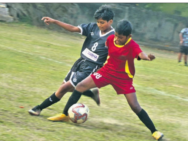
କିସ୍ ଓ ଫାଓ ମଧ୍ୟରେ ଅନୁଷ୍ଠିତ ମ୍ୟାଚ୍