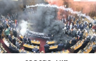
ବେଲଗ୍ରାଡ୍, ୪ ମାର୍ଚ୍ଚ

ୟୁରୋପୀୟ ଦେଶ ସର୍ବିଆର ପାର୍ଲିମେଣ୍ଟରେ ମଙ୍ଗଳବାର ବିଖୁଣ୍ଟାକା ଦେଖାଦେଇଛି। ସଂସଦ ଚାଲିଥିବା ବେଳେ ବିରୋଧୀ ସଦସ୍ୟମାନେ ସରକାରଙ୍କ କିଛି ନୀତିକୁ ବିରୋଧ କରି ଗୃହ ମଧ୍ୟରେ ହଜାମା କରିବା ସହ ପାର୍ଲିମେଣ୍ଟ ମଧ୍ୟରେ ସ୍ଲୋକ୍ ବମ୍ ଏବଂ ଲୁହକ୍ଷୁଦ୍ରା ଗ୍ୟାସ୍ ପକାଇଥିଲେ। ଫଳରେ ପାର୍ଲିମେଣ୍ଟ ମଧ୍ୟରେ ଧୂଆଁ ବ୍ୟାପିଯାଇଥିଲା। ଘଟଣାରେ ସର୍ବିଆର ୩ ଏମ୍ପି ଆହତ ହୋଇଛନ୍ତି।