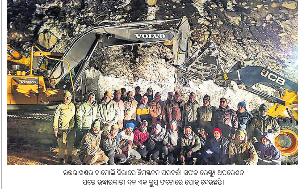
ଉତ୍ତରାଖଣ୍ଡର ଚାମୋଲି ଜିଲ୍ଲାରେ ହିମଶଙ୍କର ପରବର୍ତ୍ତୀ ସଫଳ ରେଷ୍ଟୁ ଅପରେଶନ ପରେ ଉଦ୍ଧାରକାରୀ ଏକ ବଳ ଗୁପ୍ତ ଫଟୋରେ ପୋଜ୍ ଦେଇଛନ୍ତି।