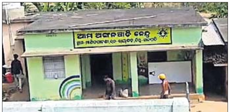
ଓଡ଼ିଶାର ଅଙ୍ଗନୂତ୍ୱାତି କେନ୍ଦ୍ର