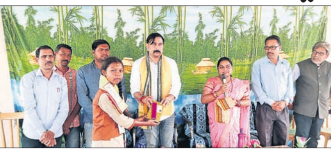
ଭବନ ବିଧାୟକ ଛାତ୍ରୀଙ୍କୁ ଶୁଭେଚ୍ଛା ଜଣାଇଛନ୍ତି।