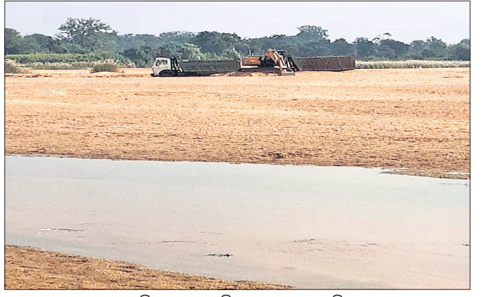
କୁମ୍ଭିର ଘାଟରୁ ବାଲି ଚାଲାଣ କରାଯାଉଛି।

ପଦ୍ମପୁର ଅନ୍ତର୍ଗତ ଜଗଦଲପୁର ଧାନା କୁମ୍ଭିର ନିକଟସ୍ଥ ଅଜନନୀରୁ ପ୍ରତିଦିନ ଶହ ଶହ ଟ୍ରାକ୍ଟର ବାଲି ଛତିଶଗଡ଼କୁ ଚାଲାଣ ହେଉଛି। କୁମ୍ଭିର ସଂରକ୍ଷିତ ଜଙ୍ଗଲ ଭିତରେ ମୂଲ୍ୟବାନ ଗଛ କାଟି ବେଆଇନ୍ ଭାବେ ରାସ୍ତା ନିର୍ମାଣ ହୋଇଥିବା ଗ୍ରାମବାସୀ ଅଭିଯୋଗ କରିଛନ୍ତି। କିନ୍ତୁ ଜଙ୍ଗଲ ବିଭାଗ ଓ ରାଜସ୍ୱ ବିଭାଗ ରୁଦ୍ଧ ବସିବା ଯୋଗୁ ସାଧାରଣରେ ଅସନ୍ତୋଷ ସୃଷ୍ଟି ହେଉଛି। ଜଗଦଲପୁର ଧାନା କୁମ୍ଭିର ଘାଟ ଅଜନନୀରୁ ପ୍ରତିଦିନ ହାଲୁକା ଓ ଟ୍ରାକ୍ଟରରେ ବେଆଇନ୍ ଭାବରେ ବାଲି ଚାଲାଣ ହେଉଛି। ଏହି ଅଞ୍ଚଳ ଛତିଶଗଡ଼ ସାମାଜିକ ଲାଭିଥିବାକୁ ବାଲି ମାଟିଆମାନେ ଲିଭି ଏଡ଼ିଆ ବାହାରୁ ବାଲି ଉତ୍ତୋଳନ କରୁଛନ୍ତି। ଏପରି କି ସଂରକ୍ଷିତ ଜଙ୍ଗଲ ଭିତରେ ଗଛ କାଟି ରାସ୍ତା