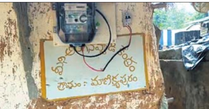
ଆନ୍ଧ୍ରପ୍ରଦେଶର ଅଙ୍ଗନୂତ୍ୱାତି କେନ୍ଦ୍ର

ପାରଳାଖେମୁଣ୍ଡି, ୪୩୩ (ବିରିଧିଧାରା ପରିଚାଳି) ଗୋଟିଏ ଗାଁ, ମାତ୍ର ରହିଛି ୨ଟି ଅଙ୍ଗନୂତ୍ୱାତି କେନ୍ଦ୍ର। ତାହା ପୁଣି ଚୁକ୍ତିତ ପ୍ରକାରର। ଏଭଳି ଏକ ଗାଁ ହେଉଛି ଗଜପତି