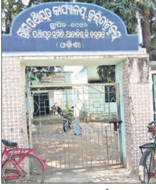
ଗ୍ରାମବାସୀ ପଞ୍ଚାୟତ କାର୍ଯ୍ୟକ୍ରମରେ ତାଲା ପକାଇ ଦେଇଛନ୍ତି।

ଅତୀତରୁ ନୂଆ ଗ୍ରାମ୍ୟ ପଞ୍ଚାୟତ କାର୍ଯ୍ୟକ୍ରମରେ ସମସ୍ୟା ନେଇ ମଙ୍ଗଳବାର ଗ୍ରାମବାସୀ ତାଲା ପକାଇ ଦେଇଥିଲେ। ଗ୍ରାମରେ ଡ୍ରୋନ୍ ସଫେଇ କରା ନ ଯିବା ଏବଂ ପାଳାୟକ ସମସ୍ୟା ପ୍ରତିବନ୍ଧରେ ଗ୍ରାମବାସୀ ଏଭଳି ଆନ୍ଦୋଳନକୁ ଉଦ୍ଘୋଷିତ କଲେ। ଫଳରେ ପୂର୍ଣ୍ଣ ପ୍ରାୟ ୧୦ଟି ଗାଁରେ ଡ୍ରୋନ୍ ଅପରାହ୍ଣ ୧ଟି ଗାଁରେ ଡ୍ରୋନ୍ ସଫେଇ କରାଯାଇଛି। ଡ୍ରୋନ୍ ସଫେଇ କରାଯାଇ ନାହିଁ। ସେହିପରି ପାଳାୟକ ସମସ୍ୟା ନିର୍ଦ୍ଦେଶନା ଘରଣୀରେ ପରିଶତ