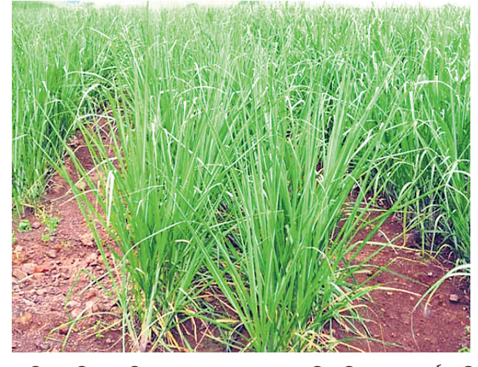
ପାଣିରେ ମିଶାଇ ସିଞ୍ଚନ କରନ୍ତୁ । ଏକର ପ୍ରତି ୨ଟି ଗ୍ରାଉଥାକ୍ଟିଭାକ୍ସିନ ପ୍ରତି ସହଜ କାଣ୍ଡବିକ୍ଷା ପୋକ ଦମନ ପାଇଁ ସପ୍ତାହ ଅନ୍ତରରେ କିଆରିରେ ଲଗାନ୍ତୁ ।

ଆଖୁ ଲଗାଇବା କାର୍ଯ୍ୟ ଶେଷ କରନ୍ତୁ । ପୂର୍ବରୁ ଲଗାଯାଇଥିବା ଆଖୁ ଫସଲରେ ସଞ୍ଚଳ କିସମରେ ୪୫ ଓ ୯୦ ଦିନରେ ଏବଂ ମଧ୍ୟମ ଓ ବିଳମ୍ବ କିସମରେ ୪୫, ୯୦ ଓ ୧୨୦ ଦିନରେ ହେକ୍ଟର ପ୍ରତି ୩୦୦ କି.ଗ୍ରା. ଯବସ୍ଥାନକାନ ସାରି ସମାନ କିସ୍ତିରେ ପ୍ରୟୋଗ କରନ୍ତୁ । ୧୨୦ ଦିନ ପରେ ଆଖୁ ଫସଲରେ ଯବସ୍ଥାନକାନ ସାରି ପ୍ରୟୋଗ କରିବା ଉଚିତ ନୁହେଁ । କଳାଛଟା ରୋଗ ଆଖୁ ଗଛରେ ଦେଖାଦେଲେ ଆକ୍ରାନ୍ତ ଗଛକୁ ମୂଳରୁ ଓପାଡ଼ି କିଆରି ବାହାରେ ଯୋଡ଼ିଦିଅନ୍ତୁ । ଆକ୍ରାନ୍ତ କିଆରିରେ କାର୍ବେନ୍‌ଡିମ୍ ୩୭.୫% ଓ ଥିରାମ୍ ୩୭.୫% ୩ ଗ୍ରାମ୍, ୧ ଲିଟର