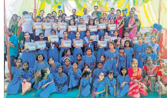
ବାର୍ଷିକ ଉତ୍ସବ ଅବସରରେ କୁଟା ପ୍ରତିଯୋଗା ।