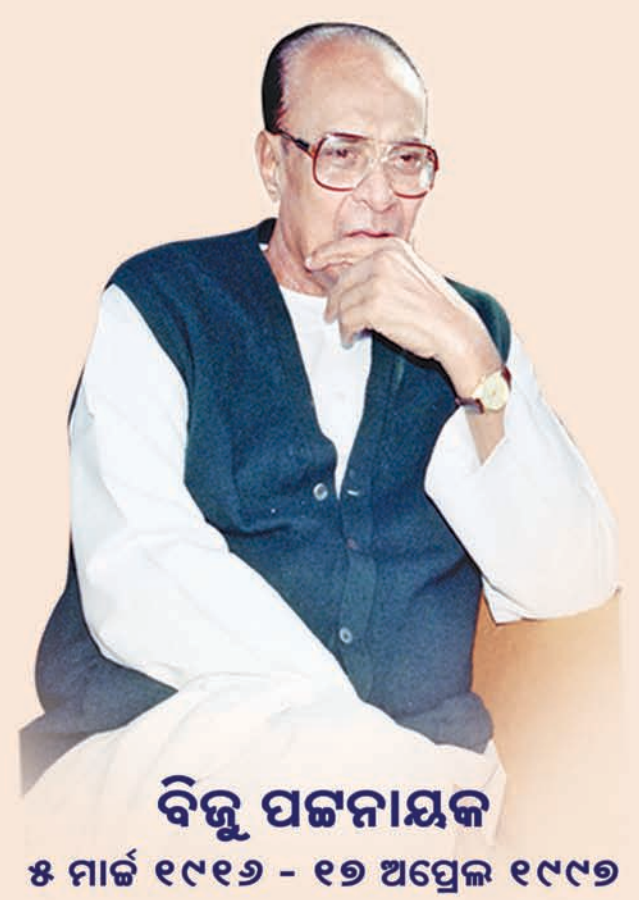
ବିଜୁ ପଟ୍ଟନାୟକ ୫ ମାର୍ଚ୍ଚ ୧୯୧୭ - ୧୭ ଅପ୍ରେଲ ୧୯୯୭