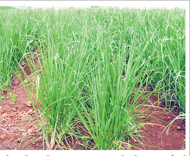
ଆଖୁ ଲଗାଇବା ସମୟରେ... ଆଖୁ ଲଗାଇବା ସମୟରେ...