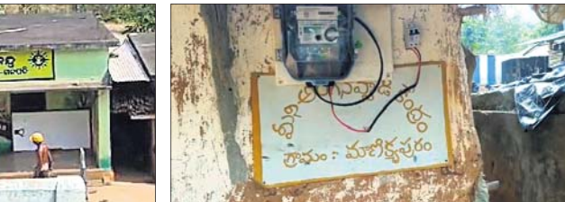
ଆନ୍ଧ୍ରପ୍ରଦେଶର ଅଙ୍ଗନୂପାତି କେନ୍ଦ୍ର

ପାରଳାଖେମୁଣ୍ଡି, ୪୩୩ (ବିଭିଧାତା ପରିକଳା) ଗୋଟିଏ ଗାଁ, ମାତ୍ର ରହିଛି ୨ଟି ଅଙ୍ଗନୂପାତି କେନ୍ଦ୍ର। ତାହା ପୁଣି ଚୁକ୍ତିତ ରାଜ୍ୟ ଓଡ଼ିଶା ଓ ଆନ୍ଧ୍ରପ୍ରଦେଶର। ଏଭଳି ଏକ ଗାଁ ହେଉଛି ଗଜପତି