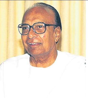
ବିଜୁ ପଟ୍ଟନାୟକଙ୍କ ଜୟନ୍ତୀ ଉପଲକ୍ଷେ

କବଳରୁ ସୁଲତାନ ସାଜହରିରକୁ ମୁକ୍ତ କରି ସମସ୍ତଙ୍କୁ ବିକ୍ଷିତ କରିଥିଲେ। ସେଥିପାଇଁ ବିଜୁବାବୁଙ୍କୁ ଇଣ୍ଡୋନେସିଆର ସର୍ବୋଚ୍ଚ ସେନାପତିଙ୍କ ସମ୍ମାନ 'ଭୂମିପୁତ୍ର' ପ୍ରଦାନ କରାଯାଇଥିଲା। ଓଡ଼ିଶା ରାଜନୀତିରେ ଅର୍ଦ୍ଧଶତାବ୍ଦୀ ଧରି ସେ ଜଡ଼ିତ ଥିଲେ। ୧୯୯୦ରୁ ୧୯୯୫ ବିଜୁ ପଟ୍ଟନାୟକଙ୍କ ଶାସନ କାଳରେ ଓଡ଼ିଶାରେ ପଞ୍ଚାୟତରାଜ ବ୍ୟବସ୍ଥା ସମ୍ପୂର୍ଣ୍ଣ କାର୍ଯ୍ୟକାରୀ ହେବା ସହ ସେ ହିଁ ବାସ୍ତବ କ୍ଷେତ୍ରରେ