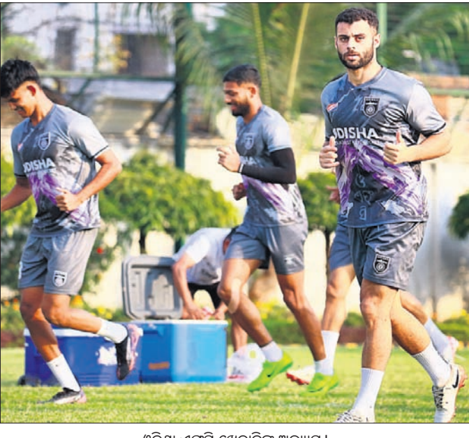
ଓଡ଼ିଶା ଏପ୍ସି ଖେଳାଳିଙ୍କ ଅଭ୍ୟାସ।

ପ୍ରସ୍ତୁତ। ଦଳ ଇତିମଧ୍ୟରେ ୨୩ ମ୍ୟାଚ ଖେଳିସାରିଛି। ସେଥିରୁ ୩୦ ପଏଣ୍ଟ ଅର୍ଜନ କରିବା ସହ ଚେନ୍ନାଇରେ ୬ମ ସ୍ଥାନରେ ରହିଛି। ଜାମସେଦପୁର ବିପକ୍ଷରେ ଦିବ୍ୟ ହାସଲ କରିପାରିଲେ ଦଳର ପଏଣ୍ଟ ସଂଖ୍ୟା ୩୩ରେ ପହଞ୍ଚିବ। ୬ଷ୍ଠ ସ୍ଥାନରେ ରହିଥିବା ପୁୟାଲ ସିଟି ଏପ୍ସି ସବି ଏହାର ଅବଶିଷ୍ଟ ଦୁଇଟି ରେମ୍‌ରେ ପରାଜୟ ବରଣ କରେ ତେବେ ୩୩ ପଏଣ୍ଟ ସହ ଲିଗ୍ ପର୍ଯ୍ୟାୟ ଶେଷ କରିବ। ଏକ୍ସେକ୍ୟୁଟିଭ ଗୋଲ୍ ବ୍ୟବଧାନ ଦେଖାଯିବ। ତେଣୁ ଓଡ଼ିଶା ଏପ୍ସିକୁ ଭୁବନେଶ୍ୱର ମ୍ୟାଚରେ