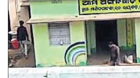
ଓଡ଼ିଶାର ଅଙ୍ଗନୂପାତି କେନ୍ଦ୍ର