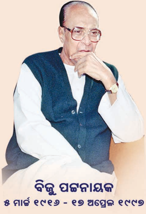
ବିଜୁ ପଟ୍ଟନାୟକ ୫ ମାର୍ଚ୍ଚ ୧୯୧୬ - ୧୭ ଅପ୍ରେଲ ୧୯୯୭