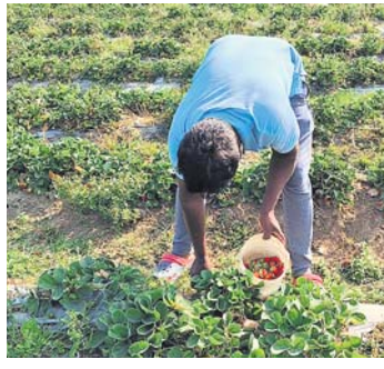
କମ୍ପାନୀର ସୁବେରି ଚାଷରେ

ଆଧୁନିକ ଜ୍ଞାନକୌଶଳ, ଜୈବିକ ପଦ୍ଧତିରେ ଚାଷ କରିଛନ୍ତି ଜ୍ୟୋତିର୍ମୟ ଛାତ୍ରୀମାନେ... ଶ୍ରୀମତୀ ଲୋକେ କମ୍ପାନୀ ଆଦି ସୁବେରି ଚାଷ ଯାଉଛନ୍ତି।