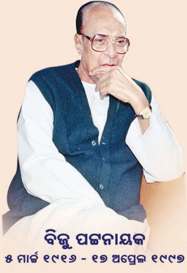
ବିଜୁ ପଟ୍ଟନାୟକ ୫ ମାର୍ଚ୍ଚ ୧୯୧୭ - ୧୭ ଅପ୍ରେଲ ୧୯୯୭

ମହାନ ଜନନାୟକ ଓଡ଼ିଶାର ପୂର୍ବତନ ମୁଖ୍ୟମନ୍ତ୍ରୀ ସ୍ୱର୍ଗତ ବିଜୁ ପଟ୍ଟନାୟକଙ୍କ ଜୟନ୍ତୀ ଅବସରରେ ଭକ୍ତିପୂର୍ଣ୍ଣ ଶ୍ରଦ୍ଧାଞ୍ଜଳି