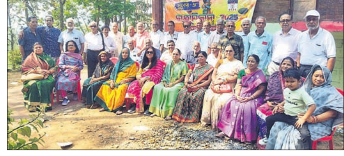
ବନ୍ଧୁମିଳନ ଉତ୍ସବରେ ଯୋଗଦେଇଥିବା ପୁରାତନ ସହପାଠୀ ।

ନୟାଗଡ଼/ଓଡ଼ିଶା, ୪୩ (ଲୋକନାଥ ମିଶ୍ର/ଆଦର୍ଶ ପଟ୍ଟନାୟକ)