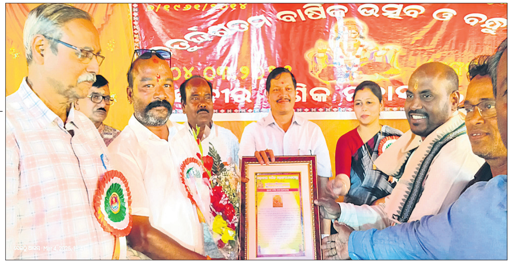
ମହାସଂଘର ବାର୍ଷିକ ଉତ୍ସବରେ ମହାଧ୍ୟାନ ଅତିଥି ।