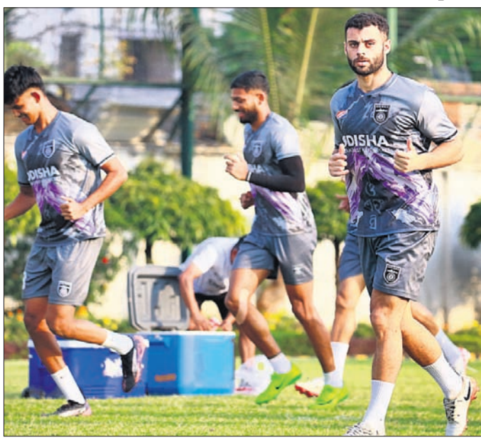
ଓଡ଼ିଶା ଏପ୍ସି ଖେଳାଳିଙ୍କ ଅଭ୍ୟାସ।

ଇଣ୍ଡିଆନ ପୁପର ଲିଗ୍ (ଆଇଏସ୍‌ଏଲ୍)ରେ ଭୁଧର ଖେଳାଳିଙ୍କୁ ଥିବା ଏକ ମ୍ୟାଚରେ ଜାମସେଦପୁର ଏପ୍ସିକୁ ଭେଟିବ ଫ୍ଲୋ-ଅପ୍‌ରେ ଗ୍ଲାନ ପାଇବା ଲକ୍ଷ୍ୟରେ ଥିବା ଓଡ଼ିଶା ଏପ୍ସି। ଜାମସେଦପୁର ଏପ୍ସି ପୂର୍ବରୁ ଫ୍ଲୋ-ଅପ୍‌ରେ ଏ ହାର ଗ୍ଲାନ ପକ୍ଷା କରିସାରିଛି। ଦଳ ୨୨ଟି ରେମ୍ ଖେଳି ୧୨ ବିଜୟ ଓ ୨ ଡ୍ର ସହ ୩୮ ପଏଣ୍ଟ ଅର୍ଜନ କରି ଚେନ୍ନାଇର ୪ର୍ଥ ସ୍ଥାନରେ ରହିଛି। ଓଡ଼ିଶାର ଏପ୍ସି ଏହାର ଫାଇନାଲ ଲିଗ୍ ମ୍ୟାଚ ପାଇଁ