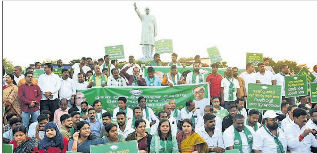
ସରକାରଙ୍କ ନିଷ୍ଠୁର ବିରୋଧରେ ମଙ୍ଗଳବାର ଏୟାରପୋର୍ଟ ଛକ ଠାରେ ଥିବା ବିଜୁବାବୁଙ୍କ ପ୍ରତିମୂର୍ତ୍ତି ତଳେ ବିଜେଡି ପ୍ରତିବାଦ କରୁଛି।