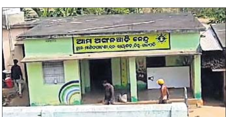
ଓଡ଼ିଶାର ଅଙ୍ଗନୂପାତି କେନ୍ଦ୍ର