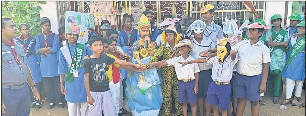
ପଥପ୍ରାନ୍ତ ନାଟକରେ ଭାଗ ନେଇଥିବା ଛାତ୍ରଛାତ୍ରୀ ।