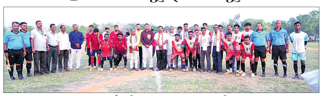
ମ୍ୟାଚ ପୂର୍ବରୁ ଅତିଥିଙ୍କ ଗହଣରେ ଭଉଣ୍ୟ ଦଳର ଖେଳାଳି ।