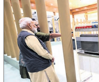
ପ୍ରଧାନମନ୍ତ୍ରୀ ମୋଦିଙ୍କୁ ବନ୍ତାରା ବିଷୟରେ ଅନନ୍ତ ଅଧ୍ୟାୟୀ ଅବଗତ କରାଉଛନ୍ତି।

ପୁରୀ, ୪ମାର୍ଚ୍ଚ ରିଲାଏନ୍ସ ଟ୍ରଷ୍ଟର ଅଧ୍ୟକ୍ଷ ତଥା ବିଶିଷ୍ଟ ଶିଳ୍ପପତି ପ୍ରକେଶ ଅଧ୍ୟାୟୀଙ୍କ ପୁଅ ଅନନ୍ତ ଅଧ୍ୟାୟୀଙ୍କ ଉଦ୍ୟମରେ ଏକ ପଶୁ ସଂରକ୍ଷଣ କେନ୍ଦ୍ର ଗୁଜରାଟର କାମରଗଠାଠାରେ 'ବନ୍ତାରା'ର ନିର୍ମାଣ କରାଯାଇଛି। ପ୍ରଧାନମନ୍ତ୍ରୀ ନରେନ୍ଦ୍ର ମୋଦି 'ବନ୍ତାରା'କୁ ଉଦ୍ଘାଟନ କରିଛନ୍ତି। ଅପରପକ୍ଷରେ ପ୍ରଧାନମନ୍ତ୍ରୀ ବେଶ୍ କିଛି ସମୟ ବିତାଇଥିଲେ ଏବଂ ପଶୁମାନଙ୍କ ପାଇଁ ସେଠାରେ ନିର୍ମିତ ବିଶ୍ୱସ୍ତରୀୟ ସୁବିଧାଗୁଡ଼ିକର ନିରୀକ୍ଷଣ କରିଥିଲେ। ବନ୍ତାରା ହେଉଛି ବନମୁଖୀଙ୍କ ସଂରକ୍ଷଣ ଏବଂ ପ୍ରୋସାହନ ପାଇଁ ଏକ ଉପଯୋଗୀ କେନ୍ଦ୍ର। ୩,୦୦୦ ଏକର ପରିମିତ