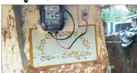
ଆନ୍ଧ୍ରପ୍ରଦେଶର ଅଙ୍ଗନୂପାତି କେନ୍ଦ୍ର

ପାରଳାଖେମୁଣ୍ଡି, ୪୩୩ (ବିରିଧିଧାରା ପରିଚାଳିତ)