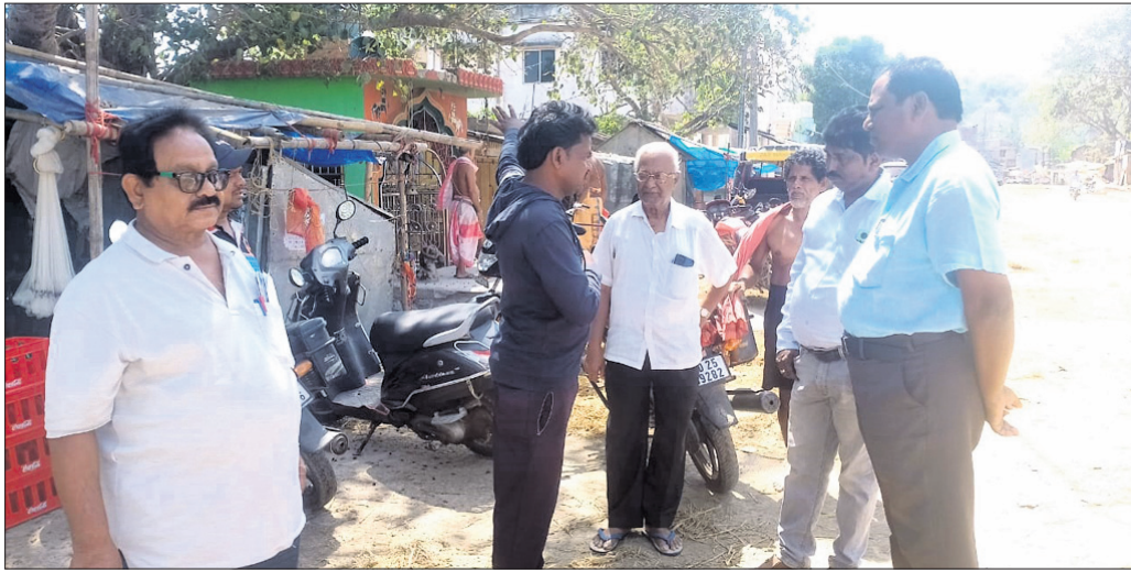
ତଦନ୍ତ ଦାୟିତ୍ୱ ଚାଲିଥିବା ଅଧିକାରୀଙ୍କ ସହ ସ୍ଥାନୀୟ ଲୋକେ ଆଲୋଚନା କରୁଛନ୍ତି ।

କୃଷିଲୋ ଶ୍ରୀନୀଳମାଧବ ପୀଠ ସର୍ବକଳ ବିଦିତ । ବ୍ରହ୍ମାପୁତ୍ର ଓ ପଦ୍ମାପୁତ୍ରୀ ପାହାଡ଼ ଉପରେ ବିରାଜିତ ହୋଇଛନ୍ତି ପ୍ରଭୁ ଶ୍ରୀନୀଳମାଧବଜୀ । ହେଲେ ଉକ୍ତ ମନ୍ଦିରର ପରିଚାଳନାଗତ ଛୁଟି ଯୋଗୁ ବିଭିନ୍ନ ସମସ୍ୟା ଲାଗି ରହିଛି । ଅପରପକ୍ଷେ ବର୍ଷା ସମୟରେ ପାହାଡ଼ ଉପରୁ ନିର୍ଗତ ବର୍ଷା ଜଳ ବିଭିନ୍ନ ସାହିଲୁ ପ୍ରବାହିତ ହେଉଛି ଏଥିପାଇଁ ପଞ୍ଚାୟତ ପକ୍ଷରୁ ବହୁଦିନ ତଳେ ଡ୍ରେନ ନିର୍ମାଣ ହୋଇଥିଲା । ସେହି ନାଳ ଦେଇ ବର୍ଷା ତଳ ପ୍ରବାହିତ ହୋଇଥାଏ । ମାତ୍ର ସମୟାନୁକ୍ରମେ ରାସ୍ତା ଉଚ୍ଚ ହେବା ପରେ ନିର୍ଗତ ବର୍ଷାଜଳ ପ୍ରବାହିତ ହେବାରେ ବାଧା ସୃଷ୍ଟି ହୋଇଥିଲା ଏପରି କି ସମ୍ପୂର୍ଣ୍ଣତା ହୋଇପାରିଥିବା ଡ୍ରେନ ଦେଇ ନୀଳମାଧବଙ୍କ ବିଭିନ୍ନ ସଂରକ୍ଷିତ ଜଳଭଣ୍ଡରେ ଚାହା ଜମି ରହୁଥିଲା । ମାତ୍ର ଏସବୁ ଜଳଭଣ୍ଡକୁ ଦେବୋତ୍ତର ବିଭାଗ ବିକ୍ରୀ କରିଦେବା ଫଳରେ ଏବେ ମନ୍ଦିର ପାହାଡ଼ରୁ ଏବଂ ବିଭିନ୍ନ ସାହିଲୁ ନିର୍ଗତ ନଦୀ ତଥା ବର୍ଷାଜଳ ସେହି ସମ୍ପୂର୍ଣ୍ଣତା ଡ୍ରେନରେ ପ୍ରବାହିତ ହେଉଛି । ରାଜ୍ୟର ପ୍ରମୁଖ ପର୍ଯ୍ୟଟନସ୍ଥଳୀ ଭାବେ ଜଣାଶୁଣା କୃଷିଲୋ