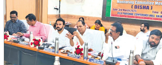
ପାରଳାଖେମୁଣ୍ଡି ଦିଶା ବୈଠକରେ ଉପସ୍ଥିତ ଏମ୍ପି, ବିଧାୟକ ଓ ଅନ୍ୟମାନେ।