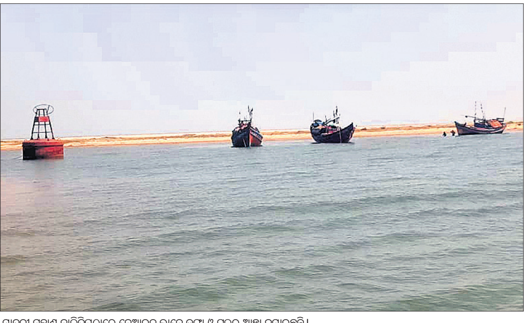
ମାଦଳା ମୁହାଣ ବାଲିଭିତ୍‌ପରେ ବେଆଇନ ଭାବେ ତଳା ଓ ଗୁଲର ଆଞ୍ଚଳିକ କମିଶନର ସହ ସମୁଦ୍ରକୁ ବରଳ ପ୍ରକାଶିତ ମାଛ, କଳ୍ପଣା ଓ ଅନ୍ୟ ସାମୁଦ୍ରିକ ଜୀବ ଧରି ସିଧାସଳଖ ସମୁଦ୍ର ପଥଦେଇ ପାରାପାଦକୁ ଚାଲାଣ କରାଯାଇଛି ।

କେନ୍ଦ୍ରାପଡ଼ା ଜିଲ୍ଲା ମହାକାଳପଡ଼ା ବ୍ଲକ ଉପକୂଳ ଅଞ୍ଚଳ ଗହୀରମଥା ସାମୁଦ୍ରିକ ଅଭୟାରଣ୍ୟ ଅଞ୍ଚଳ ହୁକିଗୋଲା-ମାଦଳା ମୁହାଣରେ ବେଆଇନ ଭାବେ ଗୁମାସ୍ତା କଳ୍ପଣା ଧରାଣି ଓ ମହାକାଳପଡ଼ା ଆଞ୍ଚଳିକ ବହୁଛି । ବନ ବିଭାଗ ପକ୍ଷରୁ ମାଦଳାଠାରେ ଅସ୍ଥାୟୀ କ୍ୟାମ୍ପ କରାଯାଇ ଅନୁପ୍ରବେଶକ ଉପରେ ଚାଷୀ ନଜର ରଖିବାକୁ କର୍ମଚାରୀ ନିୟୋଜିତ କରାଯାଇଛି । ମାତ୍ର କ୍ୟାମ୍ପ ନିକଟରେ କର୍ମଚାରୀ ଉପସ୍ଥିତ ରହିଥିଲେ ମଧ୍ୟ କିପରି ଓ କେଉଁ ପରିସ୍ଥିତିରେ ବଡ଼ ବଡ଼ ତଳା, ଚାପା ତଳା, ଗୁଲରଗୁଡ଼ିକ ଏଠାରେ ଲଙ୍ଘନ ପକାଇଛନ୍ତି ତାହା ପରିବେଶବିତ୍ଙ୍କୁ ଆଶ୍ଚର୍ଯ୍ୟ କରିଛି । ଏହି ବାଲିଭିତ୍‌ପରେ ଆଞ୍ଚଳିକ କମିଶନର ସହ ସମୁଦ୍ରକୁ ବରଳ ପ୍ରକାଶିତ ମାଛ, କଳ୍ପଣା ଓ ଅନ୍ୟ ସାମୁଦ୍ରିକ ଜୀବ ଧରି ସିଧାସଳଖ ସମୁଦ୍ର ପଥଦେଇ ପାରାପାଦକୁ ଚାଲାଣ କରାଯାଇଛି ।