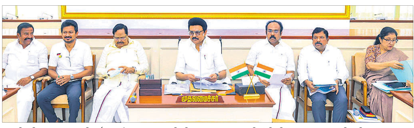
ଚେନାଇସ୍ଥିତ ସର୍ବଦଳୀୟ ବୈଠକରେ ଅଧ୍ୟକ୍ଷ କରୁଛନ୍ତି ଚାରିଲମ୍ବୁ ମୁଖ୍ୟମନ୍ତ୍ରୀ ଏମ୍.କେ. ଷ୍ଟାଲିନ୍ (ମଝି)। ନିକଟରେ ଉପମୁଖ୍ୟମନ୍ତ୍ରୀ ଉପସିଦ୍ଧି ଷ୍ଟାଲିନ୍ ଓ ଅନ୍ୟ ନେତାମାନେ।

ଚେନାଇ(ପି.ଟି.)/ ନୂଆଦିଲ୍ଲୀ(ରବିବର), ୫ ମାର୍ଚ୍ଚ ୨୦୧୧ ପରଠୁ ଦେଶରେ ଜନଗଣନା ହୋଇନାହିଁ। କେନ୍ଦ୍ର ସରକାର ସେହି ଜନଗଣନା ଆଧାରରେ ସଂସଦୀୟ କ୍ଷେତ୍ର ସୀମା ପୁନଃ ନିର୍ଦ୍ଧାରଣ ଯୋଜନା କରିଥିବାବେଳେ ଦକ୍ଷିଣ ଭାରତର ରାଜନୈତିକ ଦଳଗୁଡ଼ିକ ଏହା ପରିବର୍ତ୍ତେ ୧୯୭୧ ଜନସଂଖ୍ୟା ଭିତ୍ତିରେ ତିଲିମିଟେଶନ କରାଇବା ପାଇଁ ରୂପସାଗର ପ୍ରସ୍ତାବ ଦେଇଛନ୍ତି। ଦକ୍ଷିଣ ଭାରତର ସବୁଠୁ ଧନୀ ଅଥଚ କମ୍ ଜନସଂଖ୍ୟା ବିଶିଷ୍ଟ ରାଜ୍ୟ ତାମିଲନାଡୁର ମୁଖ୍ୟମନ୍ତ୍ରୀ ଏମ୍.କେ. ଷ୍ଟାଲିନ୍ କେନ୍ଦ୍ରରେ ନେତୃତ୍ୱରେ ଅନୁଷ୍ଠିତ ସର୍ବଦଳୀୟ ବୈଠକରେ କେନ୍ଦ୍ରର ହିନ୍ଦୀ ଲାଗାତାର ଅଭିଯାନକୁ ମଧ୍ୟ ଦୃଢ଼ ବିରୋଧ କରାଯାଇଛି।