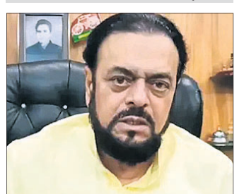
ସୂଚନାଯୋଗ୍ୟ, ଆଜ୍ଞା ଏକ କାର୍ଯ୍ୟକ୍ରମରେ ଯୋଗଦେଇ କହିଥିଲେ, ଔରଙ୍ଗଜେବ୍‌ଙ୍କ ଶାସନ କାଳରେ ଭାରତର ସାମ୍ରାଜ୍ୟ ଆଫଗାନିସ୍ତାନକୁ ବର୍ଦ୍ଧା (ମ୍ୟାନ୍‌ମାର) ଯାଏ ଥିଲା। ଆମ ଇତିପବିଷ୍ଣୁ ଗିତିପର ୨୪୪ ରହିଥିଲା ଏବଂ ଭାରତକୁ ଗୋଲ୍ଡେନ୍ ଯାତ୍ରା କୁହାଯାଉଥିଲା। ସମ୍ରାଜ୍ୟ ସହ ଔରଙ୍ଗଜେବ୍‌ଙ୍କୁ ଯୁଦ୍ଧ ରାଜନୈତିକ ଥିଲା। ତାଙ୍କର ଏହି ମନ୍ତବ୍ୟକୁ ନେଇ ମଜଲିସ୍‌ରେ ଗୃହରେ ହଟଗୋଳ ଘଟଣା ସହ ଶାସକ ପକ୍ଷ ତାଙ୍କ ନିଲମ୍ବିତ ସହ ଧ୍ୱନିତରରେ ପ୍ରସ୍ତାବ ଗୃହୀତ ହୋଇଥିଲା।