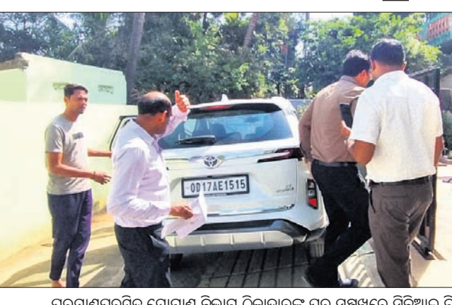
ପରମାଣୁପୁରସ୍ଥିତ ଯୋଗାଣ ବିଭାଗ ଠିକାଦାରଙ୍କ ଘର ସମ୍ମୁଖରେ ସିବିଆଇ ଚିମ୍ପ।