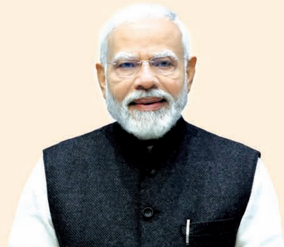
ଶ୍ରୀ ନରେନ୍ଦ୍ର ମୋଦୀ ପ୍ରଧାନମନ୍ତ୍ରୀ