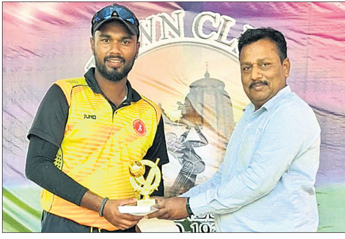
ପୂର୍ଣ୍ଣା ଷୋର୍ଟ ପ୍ରଦାନ ପୂର୍ଣ୍ଣା ପ୍ରଦାନ କରାଯାଇଛି।