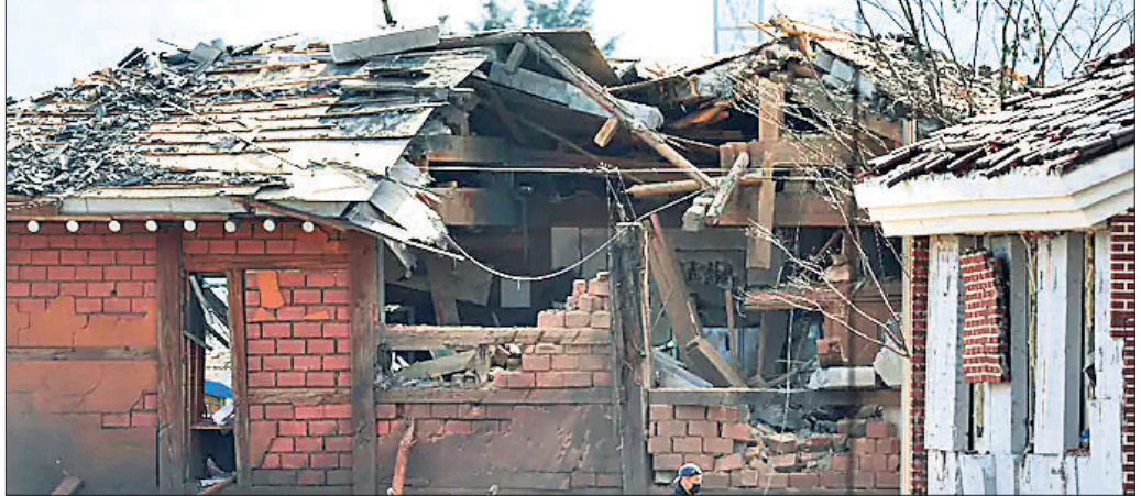
ୟୁକ୍ଷାଭାସ୍ୟ ବେଳେ ଦକ୍ଷିଣ କୋରିଆର କେଏଫ୍-୧୬ ଲକ୍ଷୁଆ ବିମାନରୁ ବୋମା ପଡ଼ି ଗୋଟିଏ ଘର ଯତ୍ନସ୍ତ ହୋଇଛି।

ସିଂଗାପୁର, ୨୩ ଆମେରିକା ସେନା ସହ ମିଳିତ ସମରାଜ୍ୟାସ ବେଳେ ଦକ୍ଷିଣ କୋରିଆର ୨ଟି ଯୁଦ୍ଧବିମାନ ଲୁଲୁଚିଗଠା ୮ଟି ବୋମା ଜନସମ୍ପତ୍ତି ଅଞ୍ଚଳରେ ଖସାଇଥିଲେ। ଏଥିରେ ୧୫ ଜଣ ଆହତ ହେବା ସହ କେତେକ ଘର ଯତ୍ନସ୍ତ ହୋଇଛି। କେଏଫ୍-୧୬ ଯୁଦ୍ଧବିମାନରୁ ଫାୟାରିଂ ରେଞ୍ଜ ବାହାରେ ଏମ୍‌କେ-୮୨ ବୋମା