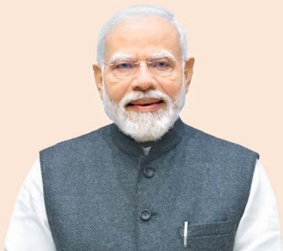
ଶ୍ରୀ ନରେନ୍ଦ୍ର ମୋଦୀ ପ୍ରଧାନମନ୍ତ୍ରୀ