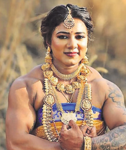
କନ୍ୟା ବେଶରେ ଚିତ୍ରାଙ୍କର ବାହୁବଳୀ ଲୁକ୍।