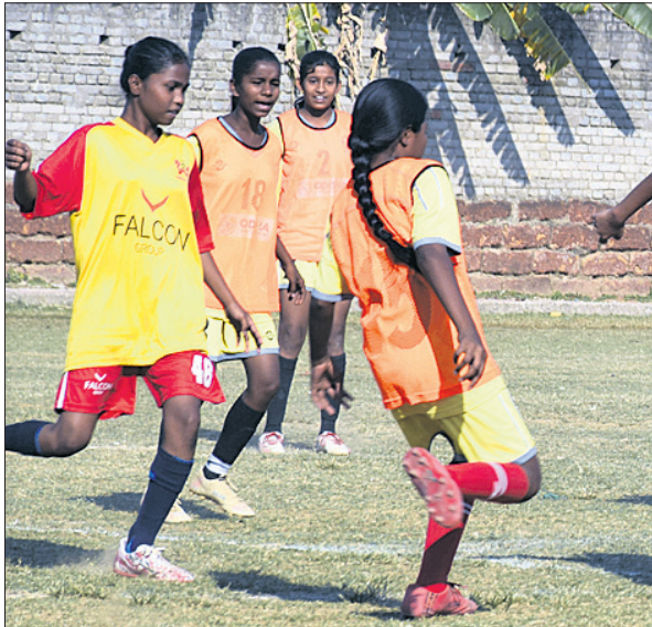
ଓଡ଼ିଶା ଓ ପାଲକନ ମଧ୍ୟରେ ଅସ୍ଥିତ ମ୍ୟାଚ୍

ଭୁବନେଶ୍ୱର, ୬ମାର୍ଚ୍ଚ (ବିକେୟ ରଣା) ଅସ୍ଥିତା ୧୩ ବର୍ଷରୁ କମ୍ ମହିଳା ଖେଳୋ ଇଣ୍ଡିଆ ପୁରସ୍କାର ଲିଗ୍‌ରେ ଗୁରୁବାର କିର୍/କିଏ ଓ ଓଡ଼ିଶା ସେମାନଙ୍କ ମ୍ୟାଚରେ ବିଜୟ ଲାଭ କରିଛନ୍ତି। କଟକ ବିଦ୍ୟାଳୟ ଗ୍ରାଉଣ୍ଡରେ ଖେଳାଯାଇଥିବା