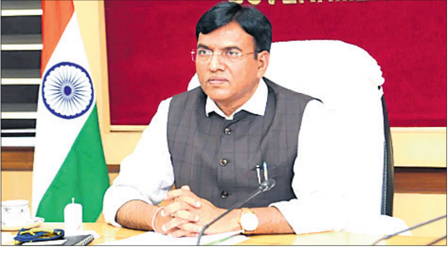
କ୍ରୀଡ଼ା ମନୁସ୍କ୍ରୀମ୍ ମାଧ୍ୟମରେ

ନୂଆଦିଲ୍ଲୀ, ୬ମାର୍ଚ୍ଚ (ପି.ଟି.) କ୍ରୀଡ଼ାକ୍ଷେତ୍ରରେ ଉତ୍ତରଦାୟିତ୍ୱ ଓ ସ୍ଥିରତା ନିଶ୍ଚିତ କରିବା ଲାଗି କ୍ରୀଡ଼ା ମନ୍ତ୍ରଣାଳୟ ପକ୍ଷରୁ ଗୁରୁତ୍ୱପୂର୍ଣ୍ଣ ପଦକ୍ଷେପ ନିଆଯାଇଛି। ନିକଟ ଅତୀତରେ ରେସଲିଂ, ଶୁଟିଂ ଓ ଅନ୍ୟ କିଛି ଫିଲ୍ଡ ଖେଳ ଲିଭେଣ୍ଡରେ ଆଥଲେଟ ଓ ଫେଡେରେଶନ ମଧ୍ୟରେ ଦେଖାଦେଇଥିବା ବିବାଦ କାରଣରୁ ଏଭଳି ପରିସ୍ଥିତିକୁ ଏଡ଼ାଇବା ଲାଗି କ୍ରୀଡ଼ା ମନ୍ତ୍ରଣାଳୟ ପକ୍ଷରୁ କ୍ରୀଡ଼ା ମନୁସ୍କ୍ରୀମ୍ ମାଧ୍ୟମରେ ନିର୍ଦ୍ଦେଶ ଦେଇଥିଲେ। ଚୟନ ନୀତିର ମାନବତା ସମ୍ପର୍କରେ ଆଧିକାରୀଙ୍କୁ ଗ୍ରହଣ କରି ୧୫ ଦିନ ଆଗରୁ ସୂଚନା ଦେବା ସହ ଅନ୍ୟାୟ ହୋଇଥିବା ଆବଦାନୁ ସୂଚ୍ୟ ବିବାଦର ସମାଧାନ ପାଇଁ ଏକ କମିଟି ଗଠନକୁ କ୍ରୀଡ଼ା ମନ୍ତ୍ରଣାଳୟ ପକ୍ଷରୁ ନିର୍ଦ୍ଦେଶ ଦେଇଥିଲେ। ଏକ ପ୍ରତିଯୋଗିତା ପୂର୍ବରୁ ୩ ମାସର ସମୟ ସୀମା ଥିଲେ, ଏହାକୁ କାର୍ଯ୍ୟକାରୀ କରାଯିବ। ଚୟନ ନିତିରେ ଭିତ୍ତିପ୍ରତିଷ୍ଠା କରିବାକୁ ମଧ୍ୟ ବାଧ୍ୟତାମୂଳକ କରାଯାଇଛି। ଚୟନ ନିତିର ଭିତ୍ତି ଓ ରେକର୍ଡକୁ ସାଜ ନିକଟକୁ ପଠାଯିବା ଦରକାର। ପ୍ରତ୍ୟେକ ଚୟନ ନିତିର ପୂର୍ବରୁ