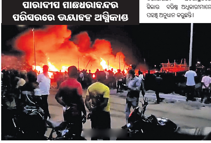
ପାରାଦୀପ ମାଛଧରାବନ୍ଦର ପରିସରରେ ଭୟାବହ ଅଗ୍ନିକାଣ୍ଡ

ପାଟିବାରୁ ପରିସ୍ଥିତି ଅଣାୟତ୍ତ ହୋଇଯାଇଛି। ଅଗ୍ନିଶମ ବିଭାଗ କର୍ମଚାରୀମାନଙ୍କ ପାଇଁ ନିଆଁ ପାଖକୁ ଯିବା ସହଜ ହେଉନାହିଁ। ଏହି ଅଗ୍ନିକାଣ୍ଡରେ ବହୁ କୋଟି ଟଙ୍କାର ସମ୍ପତ୍ତି ନଷ୍ଟ ହୋଇଥିବା ଆଶଙ୍କା କରାଯାଉଛି। ଘଟଣାସ୍ଥଳରେ ଜିଲ୍ଲାର ବରିଷ୍ଠ ଅଧିକାରୀମାନେ ପହଞ୍ଚି ଅନୁଧ୍ୟାନ କରୁଛନ୍ତି।