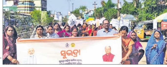
ରୁକ କାର୍ଯ୍ୟାଳୟ ନିକଟରୁ ବାହାରିଥିବା ସଚେତନତା ଶୋଭାଯାତ୍ରା।