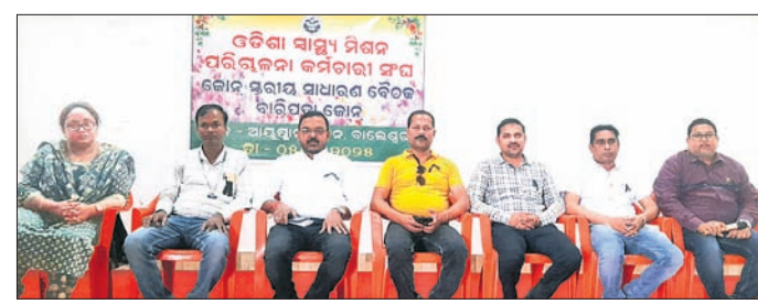
ବୈଠକରେ ଉପସ୍ଥିତ ସଂଘ ନେତୃବୃନ୍ଦ।

ବାଲେଶ୍ୱର ଗୋପାଳଗାଁସ୍ଥିତ ଆୟୁଷ୍ମାନ ଭବନ ପରିସରରେ ଓଡ଼ିଶା ସ୍ୱାସ୍ଥ୍ୟ ମିଶନ ପରିଚାଳନା କର୍ମଚାରୀ ସଂଘର ଜେନସ୍ପୋରାୟ ସାଧାରଣ ବୈଠକ ରୁଧିର ଅପରାହ୍ ୨ତା ୩୦ରେ ଅନୁଷ୍ଠିତ ହୋଇଯାଇଛି।