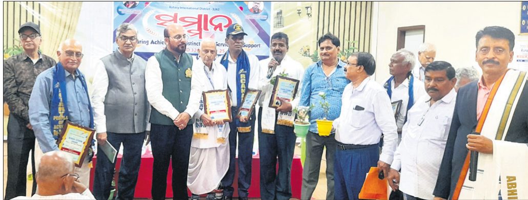
ଅତିଥିଙ୍କ ଦ୍ୱାରା ସମ୍ମାନିତ କରାଯାଇଛି।

ବାଲେଶ୍ୱର ରୋଗୀମାନଙ୍କୁ ଓ ରୋଗୀମାନଙ୍କୁ ୩୨୨୨ ମିଳିତ ଆନୁକୁଲ୍ୟରେ ରୁଧିର ରୋଗୀର ସମ୍ମାନ ସମାବେଶ ଅନୁଷ୍ଠିତ ହୋଇଯାଇଛି।