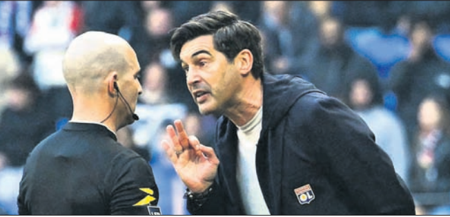
ରେଫରି ଓ କୋର୍ ଫନସେକା ମୁହାଁମୁହିଁ