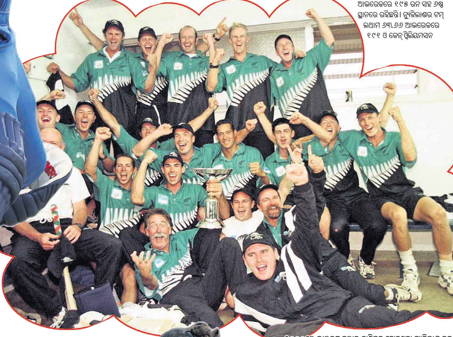
୨୦୦୦ରେ ଭାରତକୁ ହରାଇ ଚାମିୟନ ହୋଇଥିବା ନ୍ୟୁଜିଲାଣ୍ଡ ଦଳ ।

ଦ୍ୱିତୀୟ ଥର ଟ୍ରଫି ଜିତିବାର ସୁଯୋଗ ପ୍ରତିଯୋଗିତାର ୯ ସଂସ୍କରଣରେ ମୋଟ ୧୪ ଦଳ ଟୁର୍ନାମେଣ୍ଟ ଖେଳିଛନ୍ତି । ଏଥର ଆଫଗାନିସ୍ତାନ ଚାମିୟନ୍ ଟ୍ରଫିରେ ଡେବ୍ୟୁ କରିଥିଲା । ମାତ୍ର ଏହି ଦଳ ଲିଗ୍ ପର୍ଯ୍ୟାୟରୁ ବିଦାୟ ନେଇଥିଲା । ଅଷ୍ଟ୍ରେଲିଆ ଓ ଭାରତ ସମ୍ଭ୍ରାନ୍ତ ସଫଳ ଦଳଭାବେ ୨ ଥର ଲେଖାଏଁ ଚାମିୟନ୍ ଟ୍ରଫି ଜିତିସାରିଛନ୍ତି । ଦକ୍ଷିଣ ଆଫ୍ରିକା, ନ୍ୟୁଜିଲାଣ୍ଡ, ଶ୍ରୀଲଙ୍କା, ଫ୍ରେସ୍‌କ୍ଲଣ୍ଡ ଓ ପାକିସ୍ତାନ ଥରେ ଲେଖାଏଁ ଟ୍ରଫି ସ୍ୱାଦ ପାଇଛନ୍ତି । ଏଥର ଭାରତ ନିଜର ସର୍ବାଧିକ ସଫଳ ଦଳ ହେବାର ସୁଯୋଗ ରହିଛି । ତେବେ ଏଥିପାଇଁ ଦଳକୁ ଫାଇନାଲରେ ଶ୍ରେଷ୍ଠ ପ୍ରଦର୍ଶନ କରି ନ୍ୟୁଜିଲାଣ୍ଡକୁ ହରାଇବାକୁ ହେବ । ନଡେଟ ନ୍ୟୁଜିଲାଣ୍ଡ ସଫଳ ଦଳ ତାଲିକାରେ ଥିବା ଭାରତ ଓ ଅଷ୍ଟ୍ରେଲିଆ ସହ ସମକକ୍ଷ ହୋଇଯିବ ।