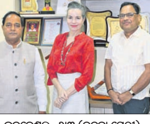
ଭୁବନେଶ୍ୱର, ୬ମାର୍ଚ୍ଚ (ବନ୍ଦନା ସେଠା)

■୪ ଅନ୍ତେବାସୀଙ୍କ ସହ ୩ କର୍ମଚାରୀ ଗିରଫ ■ ପୁଲିସ୍ ବାଡ଼ି ଓ ସିସିଡିଭି ହାତରେ ଧରିବ