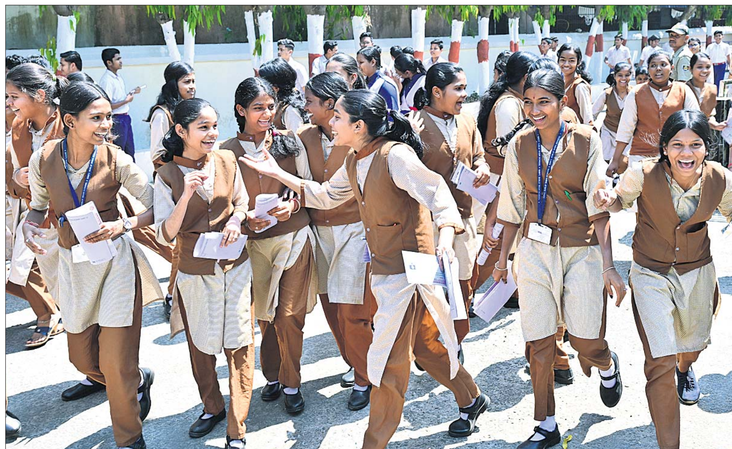
ଓଡ଼ିଶା ମାଧ୍ୟମିକ ଶିକ୍ଷା ପରିଷଦ ଦ୍ୱାରା ପରିଚାଳିତ ମାଟ୍ରିକ୍ ପରୀକ୍ଷାର ଗୁରୁବାର ଶେଷ ଦିନରେ କଟକ ରେଭେନ୍ସା କଲେଜରୁ ସ୍କୁଲରୁ ପରୀକ୍ଷା ଦେଇ ଫେରୁଥିବା ଛାତ୍ରୀଛାତ୍ରୀ ।