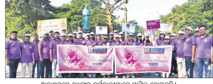
ଖାକାଥନରେ ବ୍ୟାଙ୍କର କର୍ମଚାରୀମାନେ ସାମିଲ ହୋଇଛନ୍ତି ।

ଏକପ୍ରକାର ଆୟୋଜନ କରି ଶଶି ଓ ଭିଡିଭିଆ ଖେଳପ୍ରତିଷ୍ଠାନ ପ୍ରଦର୍ଶନୀ ଉଦଘାଟନ କରାଯାଇଛି । ଏହି ଖେଳପ୍ରତିଷ୍ଠାନ ଆୟୋଜନ କରିବା ପାଇଁ ଶାସ୍ତ୍ର ଓଡ଼ିଶା ଶଶି ଓ ଭିଡିଭିଆ ଖେଳପ୍ରତିଷ୍ଠାନ ପ୍ରଦର୍ଶନୀ ଉଦଘାଟନ କରାଯାଇଛି । ଏହି ଖେଳପ୍ରତିଷ୍ଠାନ ଆୟୋଜନ କରିବା ପାଇଁ ଶାସ୍ତ୍ର ଓଡ଼ିଶା ଶଶି ଓ ଭିଡିଭିଆ ଖେଳପ୍ରତିଷ୍ଠାନ ପ୍ରଦର୍ଶନୀ ଉଦଘାଟନ କରାଯାଇଛି । ଏହି ଖେଳପ୍ରତିଷ୍ଠାନ ଆୟୋଜନ କରିବା ପାଇଁ ଶାସ୍ତ୍ର ଓଡ଼ିଶା ଶଶି ଓ ଭିଡିଭିଆ ଖେଳପ୍ରତିଷ୍ଠାନ ପ୍ରଦର୍ଶନୀ ଉଦଘାଟନ କରାଯାଇଛି ।