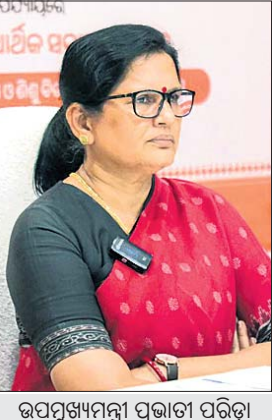
ଉପମୁଖ୍ୟମନ୍ତ୍ରୀ ପ୍ରଭାତୀ ପରିଡା