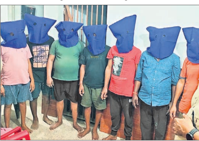
ଗିରଫ ୭ ଅଭିଯୁକ୍ତ