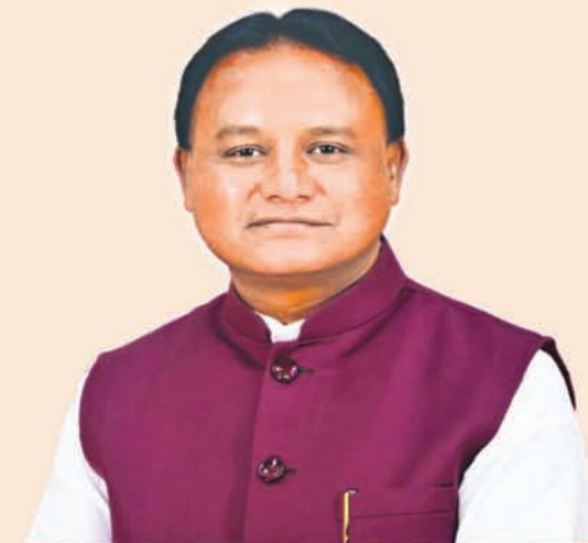
ଶ୍ରୀ ମୋହନ ଚରଣ ପାଟ୍ଟୀ ମୁଖ୍ୟମନ୍ତ୍ରୀ, ଓଡ଼ିଶା