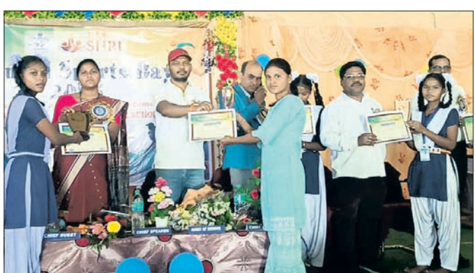
ବାର୍ଷିକୋତ୍ସବରେ କୃତୀ ଛାତ୍ରୀଙ୍କୁ ପୁରସ୍କୃତ କରାଯାଇଛି।