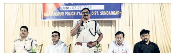
କାର୍ଯ୍ୟକ୍ରମରେ ମଞ୍ଚାସୀନ ଅତିଥି।