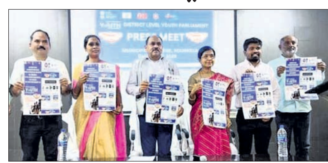
ଖବରଦାତା ସମ୍ମିଳନୀରେ ସୂଚନା ପ୍ରଦାନ କରାଯାଇଛି।