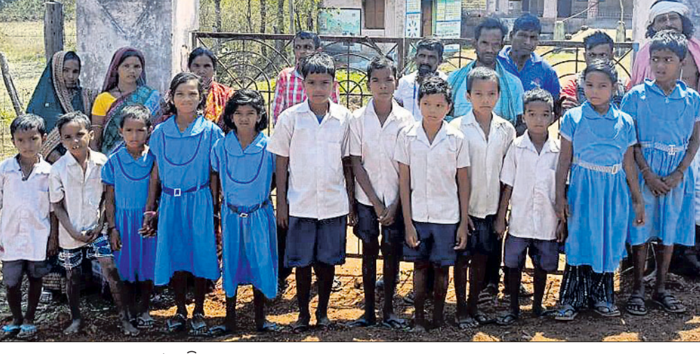
ବିଦ୍ୟାଳୟ ଆଗରେ ଛାତ୍ରାଛାତ୍ରୀ ଓ ଅଭିଭାବକ । ସକାଳ ୯ଟାରେ ବିଦ୍ୟାଳୟରେ ତାଲା ପକାଇ ଗ୍ରାମବାସୀ ଧାରଣାରେ ବସିଛନ୍ତି । ଯେ ପର୍ଯ୍ୟନ୍ତ ଶିକ୍ଷକଙ୍କ ବଦଳି ନ ହୋଇଛି ସେ ଯାଏ ଆନ୍ଦୋଳନ ଚାଲୁ ରହିବ ବୋଲି ସେମାନେ ଚେତାବନା ଦେଇଛନ୍ତି । ଏପେଟ ଆସନ୍ତା ୧୭ ତାରିଖକୁ ପରୀକ୍ଷା ଆରମ୍ଭ ହେବାକୁ ଥିବା ବେଳେ ବିଦ୍ୟାଳୟରେ ତାଲା ଛାତ୍ରାଛାତ୍ରୀଙ୍କ ଭବିଷ୍ୟତ ଅନ୍ଧାର ନ ହୋଇଛି ସେ ଯାଏ ଆନ୍ଦୋଳନ ଚାଲୁ ରହିବ ବୋଲି ସେମାନେ ଚେତାବନା ଦେଇଛନ୍ତି । ଏପେଟ ଆସନ୍ତା ୧୭ ଗ୍ରାମବାସୀ ଅଭିଯୋଗ କରିଥିଲେ, ପୂର୍ବରୁ କେବେ କିଛି ଅଭିଯୋଗ କରିନାହାନ୍ତି, ସେମାନଙ୍କୁ ଆଗକୁ ପରୀକ୍ଷା ଅଧିକାରୀ ସହିତ ପଦକ୍ଷେପ ନିଆଯିବ ବୋଲି ଗ୍ରାମବାସୀଙ୍କୁ କହିଥିଲେ, କିନ୍ତୁ ଗ୍ରାମବାସୀ ଶୁଣୁନାହାନ୍ତି ବୋଲି ସେ କହିଥିଲେ ।

ବୌଦ୍ଧ ଜିଲ୍ଲା ହରଭଙ୍ଗା ବ୍ଲକର ବଗାସାହୁ ଯୋଗା ଚକ୍ରାଣୀ ପଞ୍ଚାୟତର ବଡ଼କୋଇ ସରକାରୀ ପ୍ରାଥମିକ ବିଦ୍ୟାଳୟରେ ଶିକ୍ଷକଙ୍କ ବଦଳି ନ ହେବାରୁ ଶୁକ୍ରବାର ଗ୍ରାମବାସୀ ତାଲା ପକାଇ ଆନ୍ଦୋଳନ କରିଛନ୍ତି । ଉଚ୍ଚ ବିଦ୍ୟାଳୟରେ ଦୁଇ ଜଣ ଶିକ୍ଷକ ଅଛନ୍ତି । କିନ୍ତୁ ସେମାନେ ମନଇଚ୍ଛା ବିଦ୍ୟାଳୟକୁ ଆସୁଛନ୍ତି । ଏହା ଦ୍ୱାରା ପିଲାମାନଙ୍କ ପାଠ ପଢ଼ାରେ ବ୍ୟାଘାତ ସୃଷ୍ଟି ହେଉଛି । ଯାହାକୁ ନେଇ ଅଭିଭାବକମାନଙ୍କ ମଧ୍ୟରେ ଅସନ୍ତୋଷ ସୃଷ୍ଟି ହୋଇଥିଲା । ଶିକ୍ଷକମାନେ ପାଳି କରି ଆସୁଥିବା ନେଇ ଗତ ଗୁରୁବାର ଶିକ୍ଷା କମିଟି ପକ୍ଷରୁ ହରଭଙ୍ଗା ଗୋଷ୍ଠୀ ଶିକ୍ଷାଧିକାରୀଙ୍କୁ ଲିଖିତ ଜଣାଇଥିଲେ । ଶାସ୍ତ୍ର ଶିକ୍ଷକମାନଙ୍କୁ ବଦଳି କରିବାକୁ ଶିକ୍ଷା କମିଟି ଓ ଗ୍ରାମବାସୀ ଅଭିଯୋଗ କରିଥିଲେ । କିନ୍ତୁ ଶିକ୍ଷା ବିଭାଗ ପକ୍ଷରୁ କୌଣସି ପଦକ୍ଷେପ ନ ନେବାରୁ ଶୁକ୍ରବାର