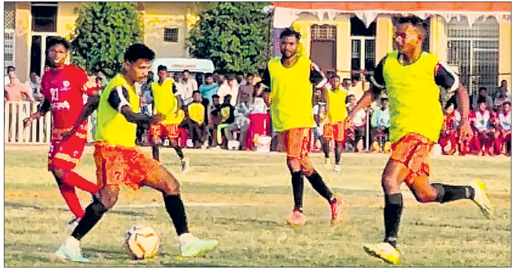
ଖେଳାଳୀଙ୍କ ମଧ୍ୟରେ ଯୁବକଲ ମ୍ୟାଚ ଚାଲିଛି ।