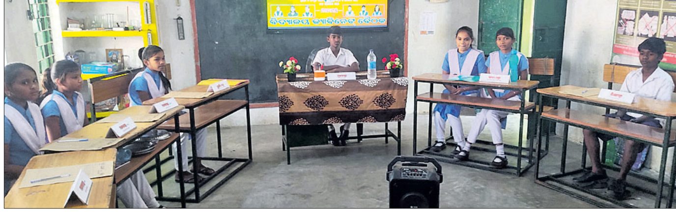
ବୈଠକରେ ବିଭିନ୍ନ ବିଭାଗ ସମ୍ପର୍କରେ ଆଲୋଚନା କରାଯାଇଛି ।