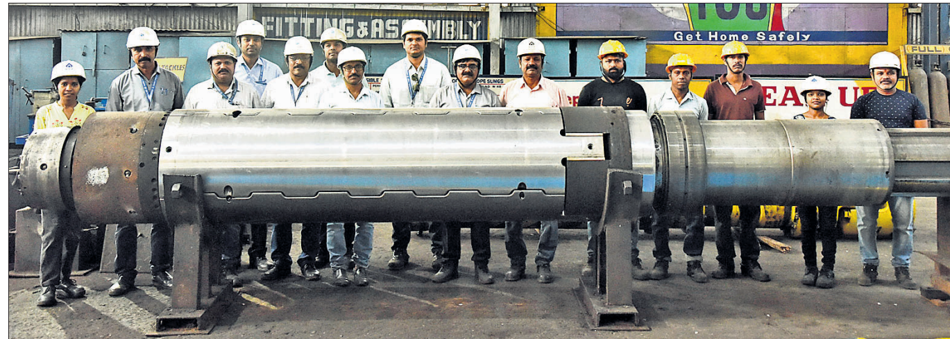
ହର୍ ଷ୍ଟିପ୍ ମିଲ୍-୨ ବିଭାଗରେ ଉପସ୍ଥିତ କର୍ମଚାରୀ।

ରାଉରକେଲା ଇସ୍ପାତ କାରଖାନା (ଆର୍.ଏସ୍.ସି)ର ଶପ୍ତ-ମେକାନିକାଲ୍ ବିଭାଗର ଉଦ୍ୟୋଗୀ କର୍ମଚାରୀମାନେ ହର୍ ଷ୍ଟିପ୍ ମିଲ୍-୨ (ଏସ୍.ଏସ୍.ଏମ୍ -୨) ବିଭାଗରେ ଏକ କଏଲ୍‌ର ମାଷ୍ଟ୍ରେଲ ନିଷ୍କାସନ ସହ ଏହାର ପୁନର୍ନିର୍ମାଣ କାର୍ଯ୍ୟ ସଫଳତାର ସହ ସମ୍ପାଦନ କରିଛନ୍ତି। ଯାହା ବହୁଳ ସଞ୍ଚୟ ଆଣିବା ସହିତ ରକ୍ଷଣାବେକ୍ଷଣ ତଥା କାର୍ଯ୍ୟକାରୀତାରେ ଆତ୍ମନିର୍ଭରଶୀଳତା ଦିଗରେ ବୃହତ୍ ପଦକ୍ଷେପ ହୋଇପାରିଛି। ୧ ନିୟୁତ ଟନ୍ କଏଲ୍ ଉତ୍ପାଦନ ପାଇଁ ଡିଜାଇନ୍ ହୋଇଥିବା କଏଲ୍‌ର ମାଷ୍ଟ୍ରେଲ, ଏସ୍.ଏସ୍.ଏମ୍-୨ ବିଭାଗ ଆରମ୍ଭ ହେବା ପରଠାରୁ ନିରନ୍ତର କାର୍ଯ୍ୟ କରୁଥିଲା ଏବଂ ୨.୫ ନିୟୁତ ଟନ୍ ହର୍ ରୋଲ୍ (ଏସ୍.ଏମ୍) କଏଲ୍ ପ୍ରକ୍ରିୟାକରଣ ସମ୍ପନ୍ନ କରିଥିଲା। ଦୀର୍ଘକାଳୀନ ବ୍ୟବହାର ଏବଂ ଦୁର୍ବଳ କଏଲ୍ ଯନ୍ତ୍ରଣାକୁ ଦୃଷ୍ଟିରେ ରଖି ପୁନର୍ଗଠନ ପାଇଁ ମାଷ୍ଟ୍ରେଲ ନିଷ୍କାସନ କରିବାକୁ ନିଷ୍ପତ୍ତି ନିଆଯାଇଥିଲା। ବିଭାଗରେ ଏହାର ନିଷ୍କାସନ ଏବଂ ପୁନର୍ ନିର୍ମାଣ ପାଇଁ ବିସ୍ତୃତ