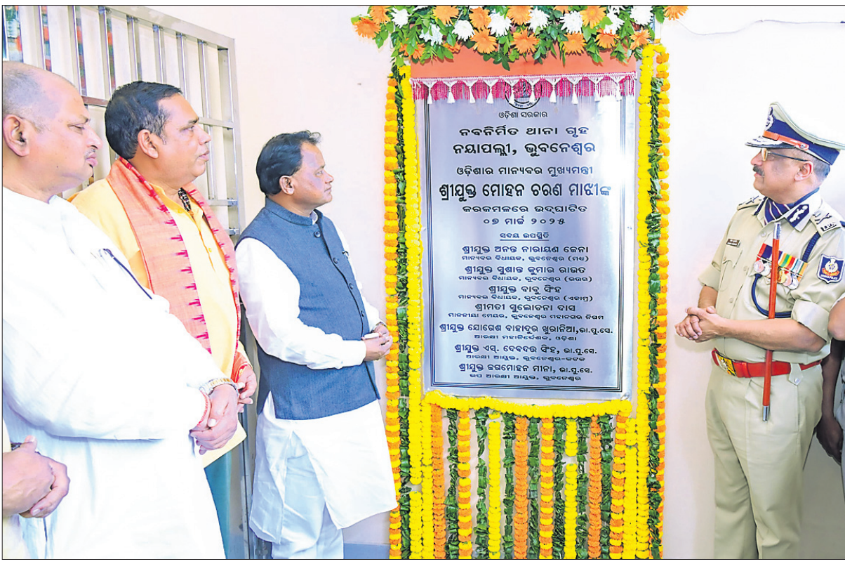
ମୁଖ୍ୟମନ୍ତ୍ରୀ ମୋହନ ଚରଣ ମାଝୀ ଅନ୍ୟମାନଙ୍କ ଉପସ୍ଥିତିରେ ନୟାପଲ୍ଲୀ ଆନାର ନବନିର୍ମିତ ଗୃହକୁ ଉଦ୍ଘାଟନ କରୁଛନ୍ତି।

କେନ୍ଦ୍ରର ସ୍ୱର ଆନରେ ଭୁବନେଶ୍ୱର ଆଇଆଇଏଲ ଏକମି ଆରମ୍ଭର ଶିକାର ହୋଇଥିଲା। ଶୁକ୍ରବାର ରାଜ୍ୟର ବିଭିନ୍ନ ଜିଲ୍ଲାରେ ଥିବା ୧୪ ଆନାର ନୂତନ ଗୃହକୁ ଉଦ୍ଘାଟନ କରିବା ଅବସରରେ ମୁଖ୍ୟମନ୍ତ୍ରୀ ଅତୀତର ସେହି ପୃଷ୍ଠାକୁ ମନେପକାଇ ଗୋଲିସର ଏହି ମନୋଭାବ ଦୂର କରିବାକୁ ପରାମର୍ଶ ଦେଇଛନ୍ତି। ଆନାକୁ ଆପ୍ତୁବା ଅଭିଯୋଗକାରୀଙ୍କ ଏତଲା କପି(ଏଫଆଇଆର୍) ରଖିବାକୁ କହିଛନ୍ତି। ଏତଲା ନ ରଖିଲେ ତୁରନ୍ତ ଆଇଆଇଏଲ ନିଲମ୍ବନ କରାଯିବ ବୋଲି ଚାରିବ କରିବା ସହ ଏନେଇ ପଦକ୍ଷେପ ନେବାକୁ ଗୋଲିସ ଡିଭିଜନ୍ ନିର୍ଦ୍ଦେଶ ଦେଇଛନ୍ତି। ଏହାସହ ଜିଲ୍ଲା ଏଫଆଇଆର୍କୁ ସେ ଗୁରୁତ୍ୱ ଦେଇଛନ୍ତି। ଆଇନ ଶୁଣାଣି ରକ୍ଷା କ୍ଷେତ୍ରରେ ଆନାର ପ୍ରମୁଖ ଭୂମିକା ରହିଛି। ତେଣୁ ଆନାକୁ ବିଭିନ୍ନ ସମସ୍ୟା ନେଇ ଆପ୍ତୁବା ଜନସାଧାରଣଙ୍କୁ ଉତ୍ତର ଦିଆ ବନ୍ଧୁକପୂର୍ଣ୍ଣ ବ୍ୟବହାର ପ୍ରଦର୍ଶନ କରିବାକୁ ମୁଖ୍ୟମନ୍ତ୍ରୀ ଆହ୍ୱାନ ଦେଇଛନ୍ତି। ସେହିଭଳି ରାଜ୍ୟରେ ଅପରାଧ ନିୟନ୍ତ୍ରଣ ଓ ନିରାକରଣ ପାଇଁ ସରକାର ବିଭିନ୍ନ ଯୋଜନା ହାତକୁ ନେଇଛନ୍ତି। ଆଗାମୀ ଦିନରେ ସମସ୍ତ ଆନାକୁ ଅତିରିକ୍ତ ଯାନ ଉପକଳ୍ପ କରିବା ନିମନ୍ତେ ଉଚ୍ଚ ମାନର ତୁଚ୍ଚଗାମୀ ମହିତ୍ତା ସ୍ୱର୍ପି ଓ ଗତି ସହ ପ୍ରତ୍ୟେକ ଆନାକୁ ଶ୍ରୀ ମୋଟର ସାଇକେଲ ମଧ୍ୟ ଦିଆଯିବାକୁ ପଦକ୍ଷେପ ନିଆଯାଇଛି। ଏହାସହ ଭୁବନେଶ୍ୱର ଭରତପୁର ଆନା ଘଟଣାର ଆଇ ଯେପରି ପୁନରାବୃତ୍ତି ନ ହେବ, ସେଥିପ୍ରତି ସଜାଗ ରହିବା ପାଇଁ ଉପସ୍ଥିତ ଗୋଲିସ ଅଧିକାରୀଙ୍କୁ ମୁଖ୍ୟମନ୍ତ୍ରୀ ନିର୍ଦ୍ଦେଶ ଦେଇଛନ୍ତି। ସୂଚନାଯୋଗ୍ୟ, ମୁଖ୍ୟମନ୍ତ୍ରୀ ଭୁବନେଶ୍ୱର ନୟାପଲ୍ଲୀ ଆନାର ନୂତନ ଗୃହକୁ ପ୍ରଥମେ ଉଦ୍ଘାଟନ କରିଥିଲେ। ପରେ