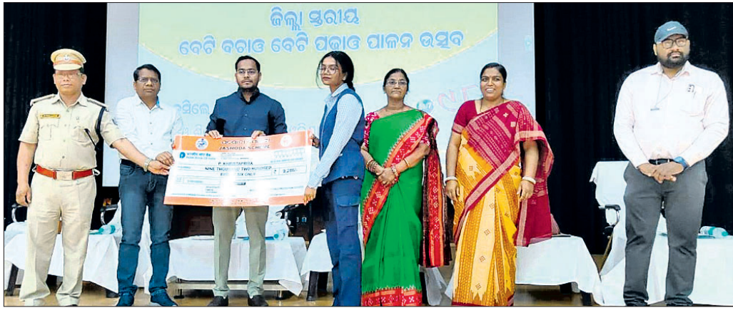
ଅତିଥିମାନେ ଜିଲ୍ଲାପ୍ରଧାନ କାର୍ଯ୍ୟକ୍ରମରେ ଯୋଗ୍ୟ କନ୍ୟା ସମ୍ମାନକୁ ଆର୍ଥିକ ସହାୟତା ପ୍ରଦାନ କରୁଛନ୍ତି ।