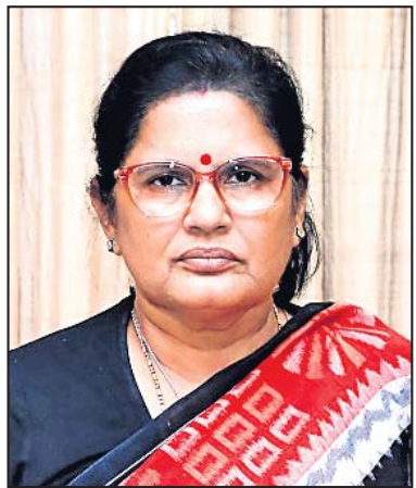
ପୂର୍ଣ୍ଣିମା ପାତ୍ର ଉପ ମୁଖ୍ୟମନ୍ତ୍ରୀ, ଓଡ଼ିଶା