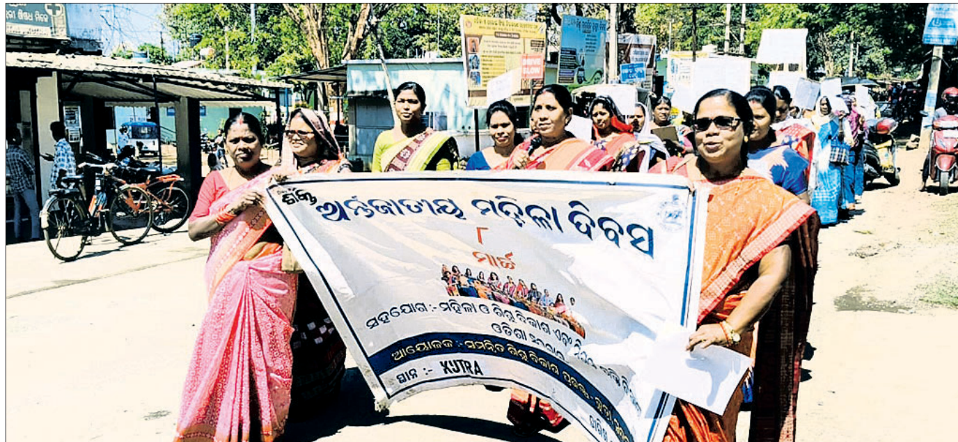
ଅନ୍ତର୍ଜାତୀୟ ମହିଳା ଦିବସ ପାଳନ ଉପଲକ୍ଷେ ଶୁକ୍ରବାର ମହିଳାମାନେ ଶୋଭାଯାତ୍ରାରେ କୁଡ୍ରା ଗ୍ରାମ ପରିକ୍ରମା କରୁଛନ୍ତି।