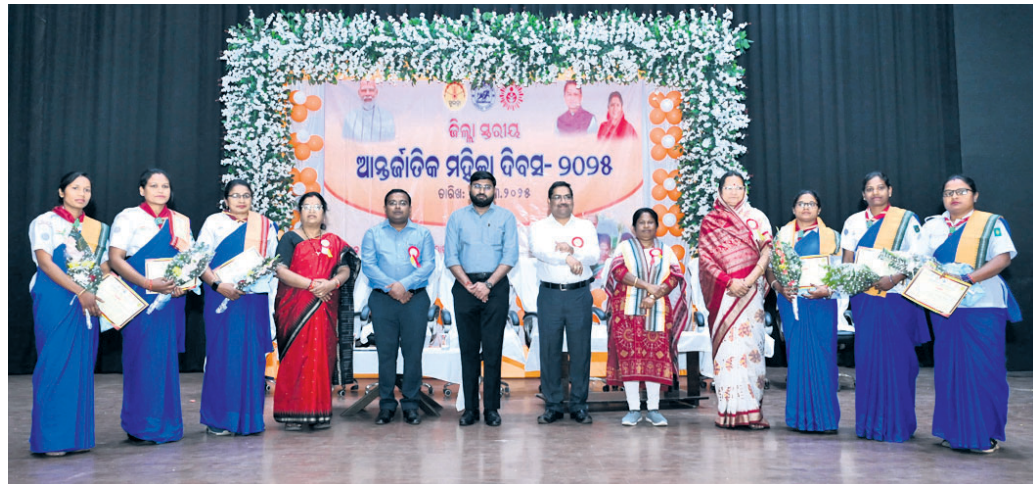
ମହିଳା ଦିବସ କାର୍ଯ୍ୟକ୍ରମରେ ସମ୍ବର୍ଦ୍ଧିତ ପ୍ରତିଭାକ ସହ ଅତିଥିଗଣ।