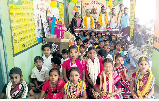
ଅତିଥିଙ୍କ ଗହଣରେ ଛାତ୍ରାଛାତ୍ରୀ ।