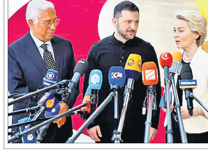
ବେଙ୍ଗାଳୁରୁ, ୭୩ (ପି.ଟି.)

ମୁସ୍ଲିମ୍ ଦଣ୍ଡାଦେଶ ବୋଲି ରାଶା ଉଲ୍ଲେଖ କରିଥିଲେ। ତେବେ ସୁପ୍ରିମକୋର୍ଟ ବିଚାରପତି ଆୟୋସିଏସ୍ କଣ୍ଠସ୍ ଏଲେନା କଗାନ୍ ତାଙ୍କ ଜରୁରୀ ଆବେଦନକୁ ଖାରଜ କରିଦେଇଛନ୍ତି।