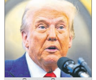
ଆମେରିକା ରାଷ୍ଟ୍ରପତି ଡୋନାଲ୍ଡ ଟ୍ରମ୍ପ

ଆମେରିକା ରାଷ୍ଟ୍ରପତି ଡୋନାଲ୍ଡ ଟ୍ରମ୍ପ ଶୁକ୍ରବାର ଭାରତକୁ ପୁଣିଥରେ 'ଅତ୍ୟନ୍ତ ଉଚ୍ଚ ଚାରିଫ୍ ରାଷ୍ଟ୍ର' ରୂପେ ଅଭିହିତ କରିଛନ୍ତି।