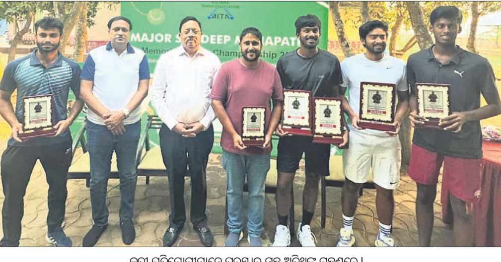
କୃତୀ ପ୍ରତିଯୋଗିତାରେ ପୁରସ୍କାର ସହ ଅତିଥିଙ୍କ ଗହଣରେ।