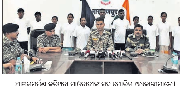
ଆତ୍ମହତ୍ୟା କରିଥିବା ମାଉସୀଙ୍କ ସହ ପୋଲିସ୍ ଅଧିକାରୀମାନେ।

ମାଲକାନଗିରି, ୭/୩ (ସୁଧା ବେହେରା) ଛତିଶଗଡ଼ ନାଗରାଜପୁର ଜିଲ୍ଲା ପୋଲିସ୍ ନିକଟରେ ୧୧ ମାଉସୀଙ୍କୁ ଶୁକ୍ରବାର ଆତ୍ମହତ୍ୟା କରିଛନ୍ତି। ବର୍ତ୍ତମାନ ଛତିଶଗଡ଼ରେ ମାଉସୀଙ୍କୁ ବିରୋଧୀ ଅଭିଯାନ ଓ ଘର ଖୁପସା କାର୍ଯ୍ୟକ୍ରମ ଚାଲିଥିବା ବେଳେ ସରକାରଙ୍କ ଅଧିକାରୀ ନିକଟରେ ଅନୁପ୍ରାଣିତ ହୋଇ ଏମାନେ ଆତ୍ମହତ୍ୟା କରିଛନ୍ତି। ଏମାନଙ୍କ ମଧ୍ୟରୁ ୮ ଲକ୍ଷ ପୁରସ୍କାର ଯୋଗ୍ୟ ଥିବା ଓଡ଼ିଆ ମଙ୍ଗଳ ଉପରେ, ତିନିସାମି ମଙ୍ଗଳ ସହ ଓଡ଼ିଆ ବନ୍ଦୁ ଓଡ଼ିଆ ଜଳକୋ କୋରାମ ଓ ସୁନା ମାଣ୍ଡାଳ ସହ ଅନ୍ୟମାନେ ରହିଛନ୍ତି।