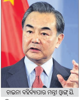
ଚାଇନା ବହିର୍ବାପାର ମନ୍ତ୍ରୀ ଓଁଜି ଯି

ହାତୀ ଓ ଭ୍ରାଗନକୁ ନୃତ୍ୟ କରାଇ ପରସ୍ପର ସମ୍ପର୍କ ପ୍ରତି ଅବଦାନ ହିଁ ଭାରତ-ଚାଇନା ସମ୍ପର୍କ ପାଇଁ ଏକମାତ୍ର ଉପଯୁକ୍ତ ବିକଳ ବୋଲି ଶୁକ୍ରବାର ଚାଇନା ବହିର୍ବାପାର ମନ୍ତ୍ରୀ ଓଁଜି ଯି କହିଛନ୍ତି।