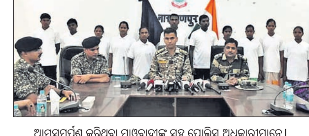
ଆତ୍ମସମର୍ପଣ କରିଥିବା ମାଓବାଦୀଙ୍କ ସହ ପୋଲିସ୍ ଅଧିକାରୀମାନେ।

ମାଲକାନଗିରି, ୭ମାର୍ଚ୍ଚ (ଦୁର୍ଦ୍ଦିତ ଚରଣ ମହାନ୍ତି) ଛତିଶଗଡ଼ ନାରାୟଣପୁର ଜିଲ୍ଲାରେ ୧୧ ମାଓବାଦୀଙ୍କ ଆତ୍ମସମର୍ପଣ କରାଯାଇଛି।