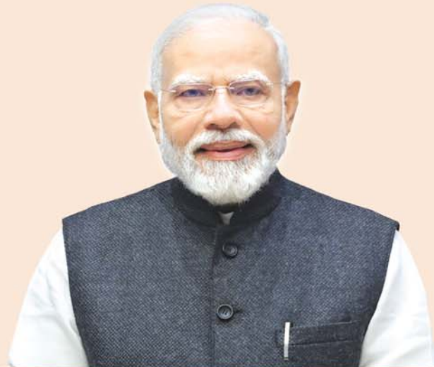
ଶ୍ରୀ ନରେନ୍ଦ୍ର ମୋଦୀ ପ୍ରଧାନମନ୍ତ୍ରୀ