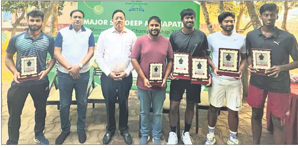
କୃତୀ ପ୍ରତିଯୋଗୀମାନେ ପୁରସ୍କାର ସହ ଅତିଥିଙ୍କ ଗହଣରେ।