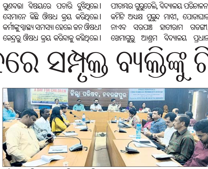
ବୈଠକରେ ଜିଲ୍ଲାପାଳ, ଏସ୍‌ପି, ପ୍ରଶାସନିକ ଅଧିକାରୀ ଓ ଅନ୍ୟମାନେ ।