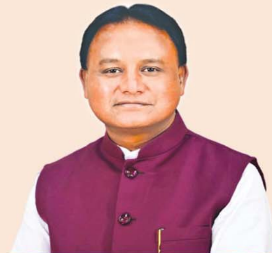
ଶ୍ରୀ ମୋହନ ଚରଣ ମାଝୀ ମୁଖ୍ୟମନ୍ତ୍ରୀ, ଓଡ଼ିଶା