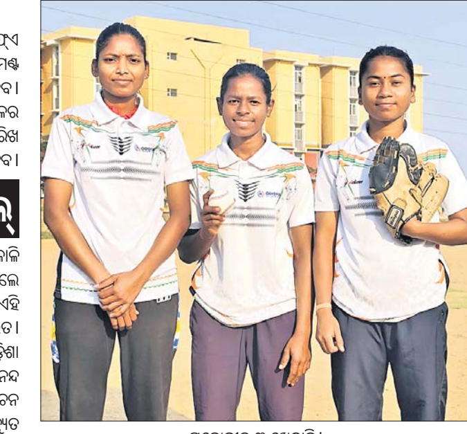
ମନୋନୀତ ୩ ଖେଳାଳି

ଆଇଲାଣ୍ଡର ବ୍ୟାଙ୍କଠାରେ ୪ର୍ଥ ଦିବସ ଏସିଆ କପ୍ ମହିଳା ବେସବଲ୍ ଟୁର୍ନାମେଣ୍ଟ ଏପ୍ରିଲ ୨୩ରୁ ୨୯ ପର୍ଯ୍ୟନ୍ତ ଅନୁଷ୍ଠିତ ହେବ। ଏଥିପାଇଁ ଭାରତୀୟ ମହିଳା ବେସବଲ୍ ଦଳର ଚନ୍ଦନ ଟ୍ରାଏଲ୍ ଚଳିତ ମାସ ୮ ଓ ୯ ତାରିଖ ରୁଜିନିଧିପରି ପଞ୍ଚାବର ସଙ୍ଗ୍ରହରେ ହେବ।