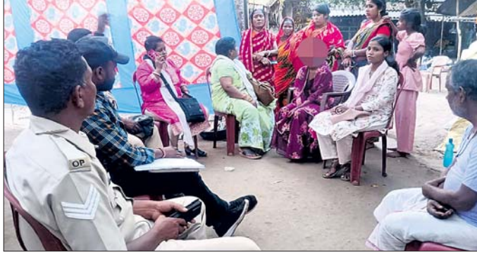
ଝିଅଙ୍କ ପରିବାର ସଦସ୍ୟଙ୍କ ସହ ଚାଇଲ୍ଲୁ ହେଲ୍ପ ଲାଇନ୍ ସଦସ୍ୟ ।