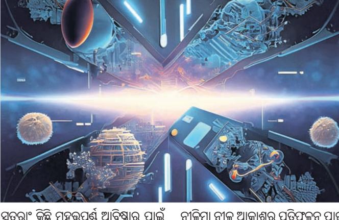
ସୁତରାଂ କିଛି ମହତ୍ୱପୂର୍ଣ୍ଣ ଆବିଷ୍କାର ପାଇଁ ନିଜର ସ୍ୱପ୍ନ ଓ କଳ୍ପନା ଯେ ଜଣକ ମନରେ ବାଲ୍ୟକାଳରୁ ବସା ବାନ୍ଧିବା ଉଚିତ, ତାହା

“ରମଣଙ୍କ ନୋବେଲ ପୁରସ୍କାର ଲାଭର ଦୀର୍ଘ ୯୦ବର୍ଷ ବିତିଯାଇଥିଲେ ସୁଦ୍ଧା ଭାରତର ଅନ୍ୟ କୌଣସି ବୈଜ୍ଞାନିକ ଇତିମଧ୍ୟରେ ଏହି ମର୍ଯ୍ୟାଦାପୂର୍ଣ୍ଣ ପୁରସ୍କାର ପାଇବାକୁ ସମର୍ଥ ହୋଇନାହାନ୍ତି। ଆମ ଦେଶରେ ରମଣଙ୍କ ଦ୍ୱାରା ପ୍ରତିଷ୍ଠିତ ବିଜ୍ଞାନର ଏଭଳି ଉନ୍ନତ ପରମ୍ପରା ସତ୍ତ୍ୱେ ଆଜିର ଯୁବପିଢ଼ି କିନ୍ତୁ ମୌଳିକ ଗବେଷଣା ପ୍ରତି ବିଶେଷ ଆଗ୍ରହ ପ୍ରକାଶ ନ କରି ଯାନ୍ତ୍ରିକ ଓ ପ୍ରଯୁକ୍ତିବିଦ୍ୟା କ୍ଷେତ୍ରରେ ଅଧିକ ରୁଚି ରଖୁଛନ୍ତି। ଏହି କାରଣରୁ ଆମର ଦେଶ ଏବେ ବିଜ୍ଞାନ ଗବେଷଣା କ୍ଷେତ୍ରରେ ବିଶ୍ୱର ଅନ୍ୟ ଦେଶ ତୁଳନାରେ ଯଥେଷ୍ଟ ପଛରେ ରହିଛି। ବିଜ୍ଞାନର ବିକାଶରେ ଯୁବପିଢ଼ିଙ୍କର ଗୁରୁତ୍ୱପୂର୍ଣ୍ଣ ଭୂମିକା ରହିଛି।”