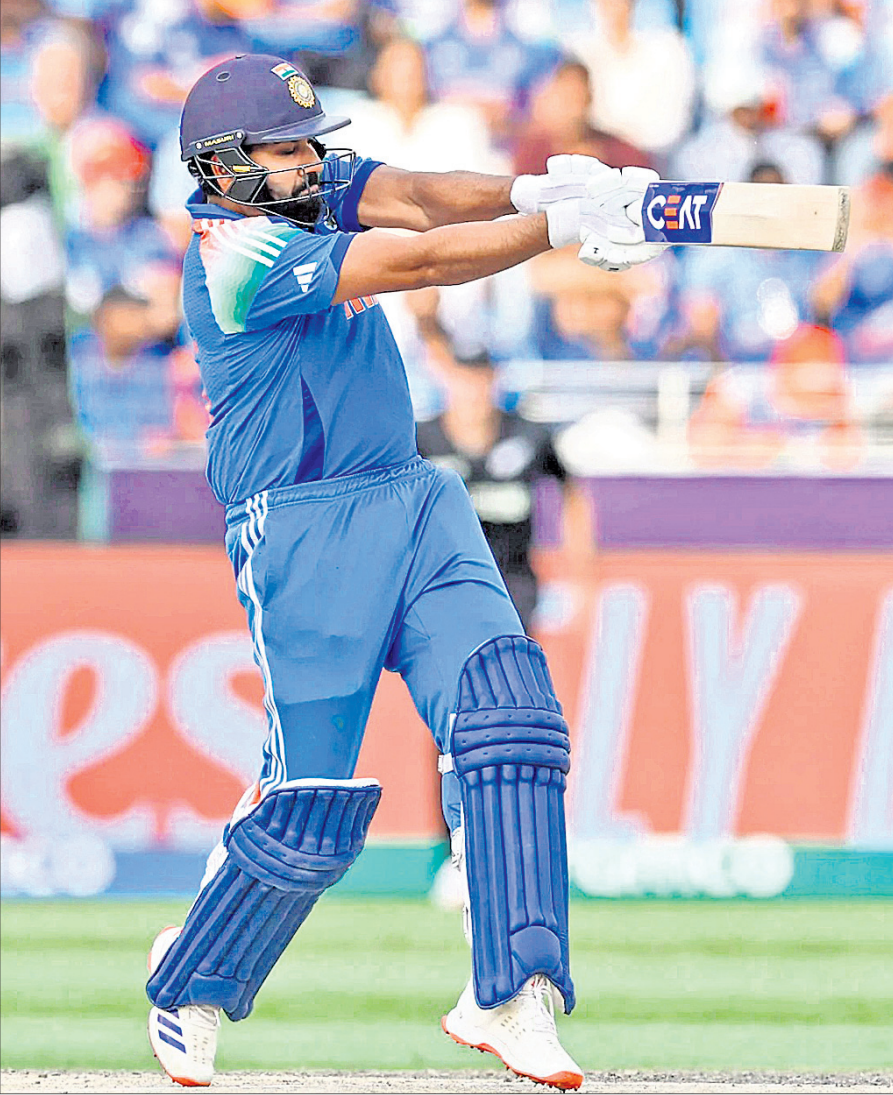
ଅର୍ଦ୍ଧଶତକୀୟ ଇନିଂସ୍ ଆବେଶରେ ଶତ ଖେଳୁଛନ୍ତି ଭାରତୀୟ ଅଧିନାୟକ ରୋହିତ ଶର୍ମା ।