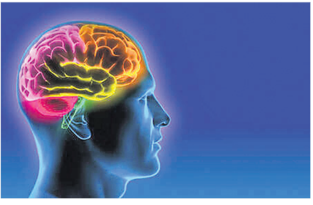
କରାଯାଇଛି। ତେଣୁ ସବୁବେଳେ ସଫଳିତ ତଥା ଭିତ୍ତିମୂଳ ଖାଦ୍ୟ ଖାଆନ୍ତୁ ଏବଂ ବ୍ୟାୟାମ, ଯୋଗ, ପ୍ରାଣାୟାମକୁ ନିଜର ଦୈନନ୍ଦିନ ଜୀବନଶୈଳୀରେ ସାମିଲ କରିବାକୁ ଉଚ୍ଚ ବିଶ୍ୱବିଦ୍ୟାଳୟର ବିଶେଷଜ୍ଞମାନେ ପରାମର୍ଶ ଦେଇଛନ୍ତି।

ମିନିଲୋଇ ଖାଦ୍ୟ ଦେଖିଲେ ତାହାକୁ ଖାଇବାକୁ ପ୍ରାୟ ଅନେକଙ୍କ ମନରେ ଆଗ୍ରହ ସୃଷ୍ଟି ହୋଇଥାଏ। ହେଲେ ନିଜକୁ ସୁସ୍ଥ ରଖିବା ପାଇଁ ଖାଦ୍ୟପେୟ ଉପରେ ନିୟନ୍ତ୍ରଣ ନିହାତି କଠୁରା। ଆପଣ ଅଧିକ ଫ୍ୟାଟ୍‌ଜାତୀୟ ଖାଦ୍ୟ ଖାଇଛନ୍ତି କି? ଯଦି ହଁ, ତେବେ ଏହାର ପରିମାଣକୁ ସୀମିତ କରନ୍ତୁ। ନ ହେଲେ ଏହାଦ୍ୱାରା ମସ୍ତିଷ୍କର କାର୍ଯ୍ୟଧାରା ପ୍ରଭାବିତ ହେବାର ଆଶଙ୍କା ରହିଛି। ଖ୍ରୀଷ୍ଟୀୟ ବିଶ୍ୱବିଦ୍ୟାଳୟର ବିଶେଷଜ୍ଞମାନେ ନିଜର ଏଭଳି ସତର୍କ ସୂଚନା ଦେଇଛନ୍ତି। ଏଭଳି ଖାଦ୍ୟ ନିୟମିତ ଖାଇଥିବା କେତେକ ବ୍ୟକ୍ତିଙ୍କର ମସ୍ତିଷ୍କର କାର୍ଯ୍ୟଧାରାକୁ ସେମାନେ ଚର୍ଚ୍ଚନା କରିବା ପରେ ଏଭଳି ସିଦ୍ଧାନ୍ତରେ ଉପନୀତ ହୋଇଛନ୍ତି। ଏଭଳି ଖାଦ୍ୟକୁ ନିୟନ୍ତ୍ରଣରେ ରଖିଲେ ଆମେ ନିଜକୁ କେତେକ ମସ୍ତିଷ୍କଜନିତ ସମସ୍ୟା ଠାରୁ ମଧ୍ୟ ଦୂରରେ ରଖିପାରିବା ବୋଲି ପ୍ରକାଶିତ ରିପୋର୍ଟରେ ଉଲ୍ଲେଖ କରାଯାଇଛି। ତେଣୁ ସବୁବେଳେ ସଫଳିତ ତଥା ଭିତ୍ତିମୂଳ ଖାଦ୍ୟ ଖାଆନ୍ତୁ ଏବଂ ବ୍ୟାୟାମ, ଯୋଗ, ପ୍ରାଣାୟାମକୁ ନିଜର ଦୈନନ୍ଦିନ ଜୀବନଶୈଳୀରେ ସାମିଲ କରିବାକୁ ଉଚ୍ଚ ବିଶ୍ୱବିଦ୍ୟାଳୟର ବିଶେଷଜ୍ଞମାନେ ପରାମର୍ଶ ଦେଇଛନ୍ତି।