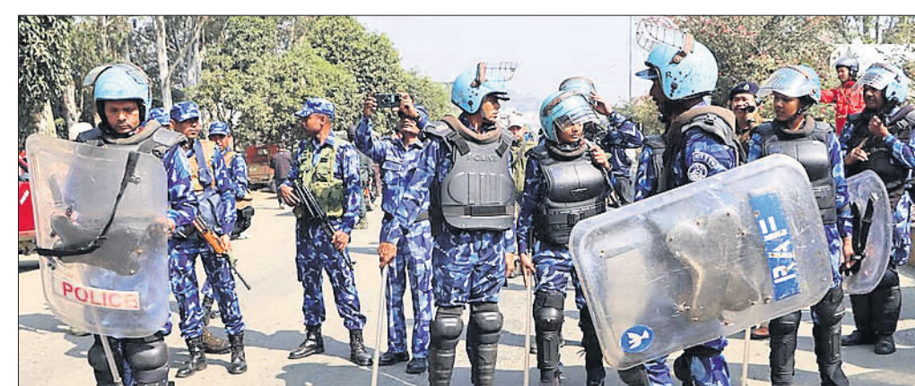
ମଣିପୁର ବନ୍ଦବେଳେ ସୁରକ୍ଷାକର୍ମୀ ରାସ୍ତାରେ ଚାଲି ରହିଛନ୍ତି।

କୂଳି-ଜୋ ସମ୍ପ୍ରଦାୟ ଉପରେ ସୁରକ୍ଷା ପ୍ରକାଶ ଯେ, ଏହା ପୂର୍ବରୁ ମଧ୍ୟ ଟ୍ରମ୍ପଙ୍କ ଉପରେ ଏକାଧିକ ଥର ହତ୍ୟା ଉଦ୍ୟମ ହୋଇଛି। ଗତ ଫେବୃଆରୀ ୨୭ରେ ଟ୍ରମ୍ପଙ୍କୁ ମିଶାଇଲରେ ଉଡ଼ାଇବା ନେଇ ଫ୍ଲୋରିଡାରେ ଜଣ୍ଡିନ ଗୁଣ୍ଡାମାନଙ୍କୁ ୧୧୧ ଥର କଳ୍ପ କରିଥିଲେ। ଏପରି କି ଦୁଧିୟକକୁ ଧୂସୃତ୍ୟୁ କରିଦେବେ ବୋଲି କହିଥିଲେ। ପୋଲିସ୍ ତାଙ୍କୁ ଗିରଫ କରିଛି। ୨୦୨୪ ଜୁଲାଇ ୧୩ରେ ପେନ୍‌ସିଲଭାନିଆରେ ନିର୍ବାଚନ ପ୍ରଚାରବେଳେ ଚିପ୍‌ସ୍କାନ୍ ଟ୍ରମ୍ପଙ୍କ ଉପରକୁ ଗୁଳି ଚଳାଯାଇଥିଲା। ଗୁଳି ତାଙ୍କ କାନ ସହ ଘଷିହୋଇ ଯାଇଥିଲା। ଆକ୍ରମଣକାରୀ ଥୋମାସ୍ କୁକ୍ସ୍‌ସିକ୍ରେଟ୍ ସର୍ଭିସ୍ ଏଜେଣ୍ଟମାନେ କାନ୍ଦୁ କରିଥିଲେ।