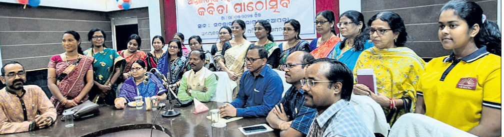
କବିତା ପାଠୋତ୍ସବରେ ଅତିଥିଙ୍କ ଗହଣରେ ଉପସ୍ଥିତ ମହିଳା।