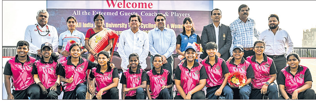
ପ୍ରତିଯୋଗୀମାନେ ଅତିଥିକ ଗହଣରେ ।

ଭୁବନେଶ୍ୱର, ୯ମାର୍ଚ୍ଚ (ତପନ ସାଲ) କିନ୍ତୁ ବିଶ୍ୱବିଦ୍ୟାଳୟ ପରିସରରେ ରବିବାର ସର୍ବଭାରତୀୟ ଆନ୍ତଃ ବିଶ୍ୱବିଦ୍ୟାଳୟ ସାଇକ୍ଲିଂ (ମହିଳା ଓ ପୁରୁଷ) ଚାମ୍ପିୟନଶିପ୍ ଉଦ୍‌ଘାଟିତ ହୋଇଛି। ଆସୋସିଏଟିଭ ଅଫ୍ ଇଣ୍ଡିଆ ମୁନିସିପାଲିଟି (ଏଆଇୟୁ) ଦ୍ୱାରା ଅନୁମୋଦିତ ଏବଂ ସାଇକ୍ଲିଂ ଫେଡେରେଶନ ଅଫ୍ ଇଣ୍ଡିଆ ଓ ଓଡ଼ିଶା ସାଇକ୍ଲିଂ ଆସୋସିଏଟିଭ ସହଯୋଗରେ ଏହି ପ୍ରତିଯୋଗିତା କିଏ କ୍ୟାମ୍ପସରେ ନବନିର୍ମିତ ମାନବି ମହାପାତ୍ର ସାଇକ୍ଲିଂ