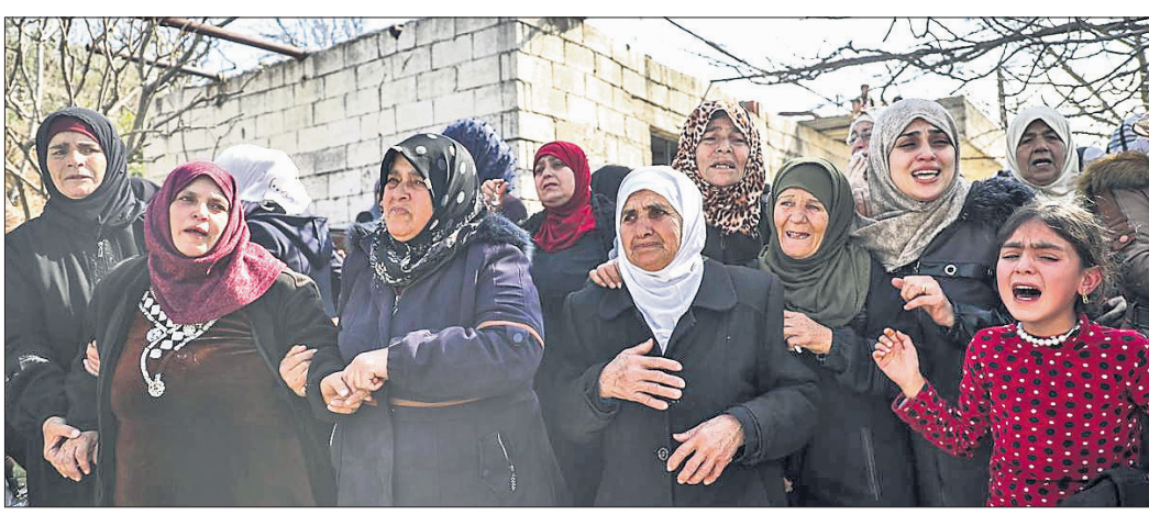
ସିରିଆ ସଂଘର୍ଷରେ ମୃତ ୪ ସୈନ୍ୟଙ୍କ ପାଇଁ ଇଡିଲ୍‌ବର ଅଲ୍-କନୌଦିୟା ଗ୍ରାମରେ ଅନୁଷ୍ଠିତ ଶୋକାୟାତ୍ରାରେ ଶୋକାକୁଳ ସମ୍ପର୍କୀୟମାନେ।

ହେବ ବୋଲି ସେ କହିଛନ୍ତି। ୩ ମାସ ପୂର୍ବରୁ ଉଗ୍ରପକ୍ଷମାନେ ଅସାଧାରଣ ସଂଗଠନକୁ କରି ଶାସନ ସମତା ନିଜ ହାତକୁ ନେଇଥିଲେ। ସଂଘର୍ଷ ଏବଂ ପ୍ରତିଶୋଧ ହିଂସାକରିତ ଉତ୍ତରଜନା ବୃଦ୍ଧି ନୂଆ ସରକାରଙ୍କ ପାଇଁ ଚ୍ୟାଲେଞ୍ଜ ସୃଷ୍ଟି କରିଛି। ଅସାଧାରଣ ଅନୁଚର ବାହିନୀର ଆକ୍ରମଣର ଜବାବ ପାଇଁ ସିରିଆର ଅନ୍ତର୍ଗତ ରାଷ୍ଟ୍ରପତି ଅହମଦ ଶାରା ରବିବାର ଆହ୍ୱାନ ଦେଇଛନ୍ତି। ଆମକୁ ଜାତୀୟ ଏକତା ଏବଂ ଆତ୍ମାନ୍ତରାଣ ଶାନ୍ତି ଫେରାଇ ଆଣିବାକୁ ହେବ ବୋଲି ସେ କହିଛନ୍ତି।