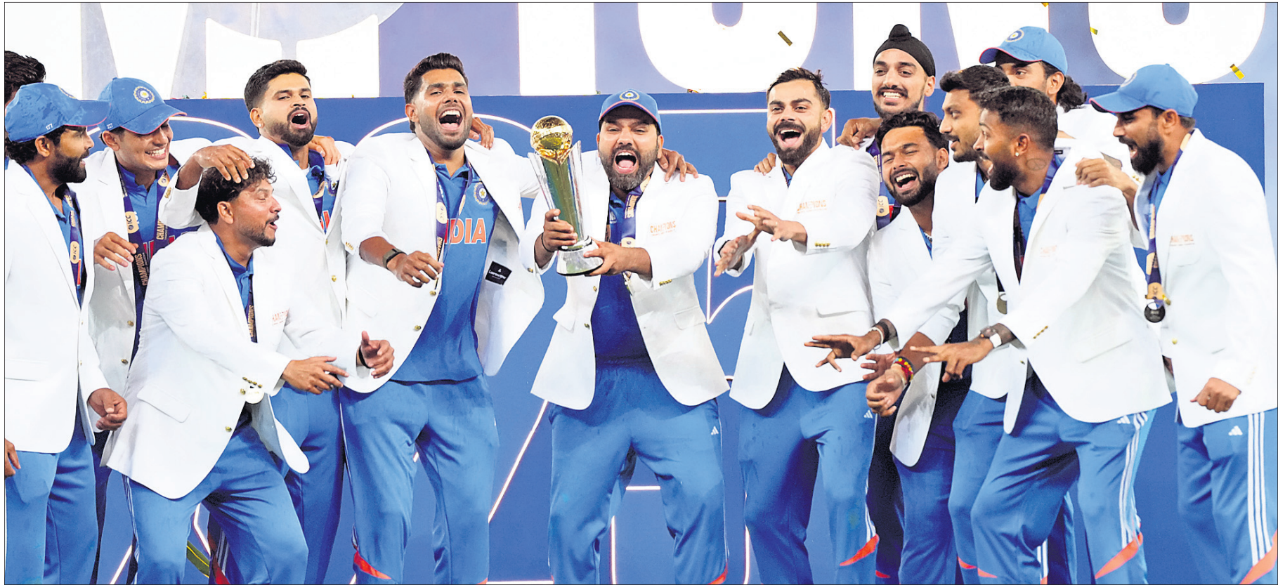
୨୦୨୫ ଆଇସିସି ଚାମ୍ପିୟନ୍ସ ଟ୍ରଫି ବିଜୟୀ ଭାରତୀୟ ଦଳ ।

ଦୁବାଇ, ୯/୩ ୨୦୨୫ ଆଇସିସି ଚାମ୍ପିୟନ୍ସ ଟ୍ରଫିରେ ଭାରତୀୟ ଦଳ ଚାମ୍ପିୟନ ହୋଇଛି। ଶ୍ରୀମନ୍ତବ୍ୟ ଚମତ୍କାର ପ୍ରଦର୍ଶନ ଓ ଅଧିନାୟକ ରୋହିତ ଶର୍ମାଙ୍କ ଦୃଢ଼ ବ୍ୟାଟିଂ ବଳରେ ଭାରତ ରବିବାର ଅନୁଷ୍ଠିତ ଫାଇନାଲରେ ଚାମ୍ପିୟନ୍ସ ଟ୍ରଫି ଉପରେ ପରାସ୍ତ ହୋଇଛି।