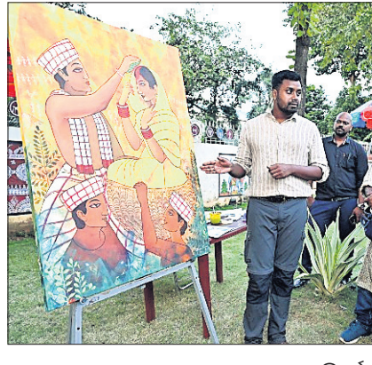
ରାଜଧାନୀ ଭୁବନେଶ୍ୱରରେ ପ୍ରତିବର୍ଷ ଆୟୋଜିତ ହେଉଥିବା ଆଦିବାସୀ ମେଳା, ଏ ମେଳାର ଚାହିଦା ତଥା ଆଦର ଏହାର ଏକ କଳ୍ପନା ଉପାହରଣ ଯେ, ଆଦିବାସୀ ଅଞ୍ଚଳର ବିଭିନ୍ନ ଜଙ୍ଗଲଜାତ ଦ୍ରବ୍ୟ ଓ ଉତ୍ପାଦନ ଚାହିଦା କେତେ ବେଶି । କିନ୍ତୁ ବର୍ଷକୁ ଥରେ ମାତ୍ର କିଛିଦିନ ପାଇଁ ଆୟୋଜିତ ହେଉଥିବା ଏ ମେଳା କ'ଣ ସମଗ୍ର ରାଜ୍ୟର ଉପଭୋକ୍ତାଙ୍କର ଚାହିଦାକୁ ମେଣ୍ଟାଇ ପାରିବାର ସମ୍ଭାବନା ଅନୁକୋଶୀ ଅଟେ ।

ଅନନ୍ଦକୁ ଭୋଗିନେବା ବି ପଣ୍ୟ । ପ୍ରାକୃତିକ ଜଙ୍ଗଲ ଭଳି ପ୍ରାକୃତିକ ମଧ୍ୟ ସେ ମାଟିର ମଣିଷ । ନାଟ, ଗୀତ, ମାଦକ, ସକପରେ ଜିଲିଆସ ଜୀବନରେ । କୋଳାହଳପୂର୍ଣ୍ଣ ଯାନ୍ତ୍ରିକ ଜୀବନରେ ପ୍ରତି ମୁହୂର୍ତ୍ତରେ ଅନିର୍ଦ୍ଧାରଣ ଲକ୍ଷ୍ୟ ନେଇ ଧାର୍ଯ୍ୟ ସହର ମଣିଷ ପାଇଁ ଏ ଜଙ୍ଗଲୀ ଜୀବନ ଜୀବନୀୟ ଭଳି । ସେମାନଙ୍କ ଗହଣରେ ସେଇଠି କିଛିଦିନ ରହି, ସେମାନଙ୍କର ପାରମ୍ପରିକ ଖାଦ୍ୟ ଖାଇ, ପୋଷାକ ପିନ୍ଧି, ସେ ନିଜ ଜୀବନକୁ ତଥା ଜନଜାତିର ଜୀବନଶୈଳୀକୁ ଆବିଷ୍କାର କରିପାରିବ ଏକ ନୂଆଁଜଙ୍ଗଲରେ, ନିଜ ବାଗରେ, ବିନୋହିତ ମାଟି ବାସୀରେ ।