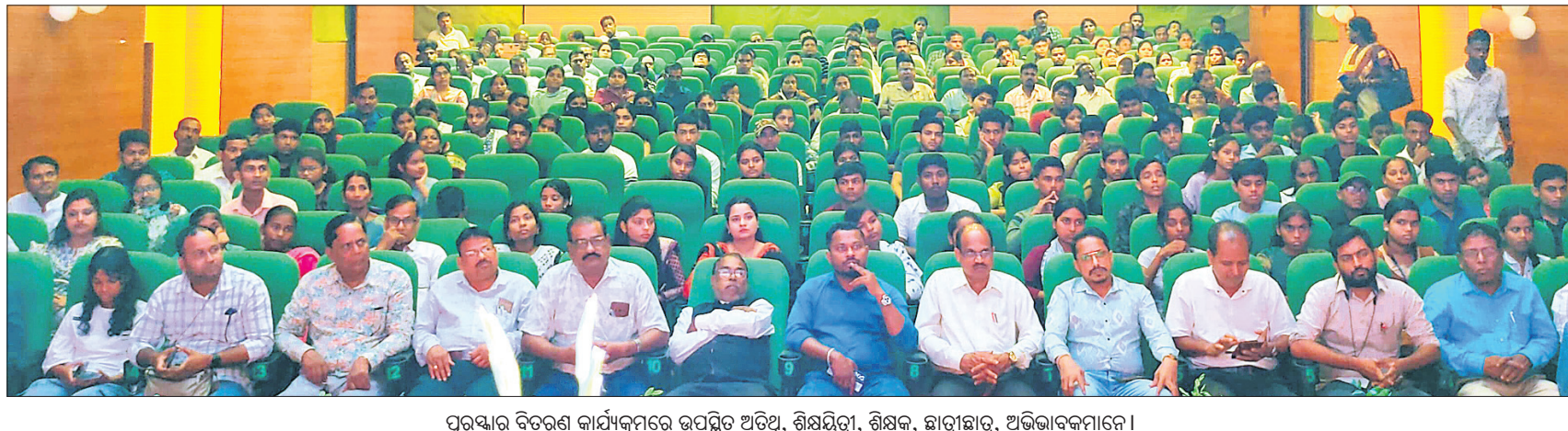
ପୁରସ୍କାର ବିତରଣ କାର୍ଯ୍ୟକ୍ରମରେ ଉପସ୍ଥିତ ଅତିଥି, ଶିକ୍ଷକଗଣ, ଛାତ୍ରାଛାତ୍ରୀ, ଅଭିଭାବକମାନେ।

ପ୍ରତିଯୋଗିତା ଛାତ୍ରାଛାତ୍ରୀଙ୍କ ମଧ୍ୟରେ ଆତ୍ମବିଶ୍ୱାସ ଜାଗ୍ରତ କରିଥାଏ। ଧରିତ୍ରୀ ୫୦ ବର୍ଷରୁ ଉର୍ଦ୍ଧ୍ୱ ସମୟ ଧରି ଛାତ୍ରାଛାତ୍ରୀଙ୍କ ପାଇଁ ଏଭଳି ସୁଯୋଗ ସୃଷ୍ଟି କରିଆସୁଛି। ଏହାସହ ଏକ ନିରାପେକ୍ଷ ଓ ସାଧାରଣ ଜନତାଙ୍କ ସ୍ୱର ଭାବେ ବିବେଚିତ ହୋଇପାରିଛି ବୋଲି ଯାଜପୁର ଚାନ୍ଦିନୀ ଗୋଟମ ବୁକ୍ସ ସଂସ୍କୃତି ଭବନରେ ରବିବାର ଅନୁଷ୍ଠିତ ଧରିତ୍ରୀ ମେଗା କୁଇଜ୍ ପ୍ରତିଯୋଗିତାର ପୁରସ୍କାର ବିତରଣ କାର୍ଯ୍ୟକ୍ରମରେ ବକ୍ତାମାନେ ମତ ପ୍ରକାଶ କରିଛନ୍ତି।