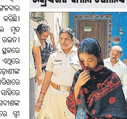
ସିନା ରିକ୍ରିଏସନ ବେଳେ ହାରି ପୋଲିସ୍‌କୁ ଘଟଣା ସମ୍ପର୍କରେ ଅବଗତ କରାଉଛି।

ଘଟଣାସ୍ଥଳକୁ ନେଇ ସିନା ରିକ୍ରିଏସନ କଲା ପୋଲିସ୍