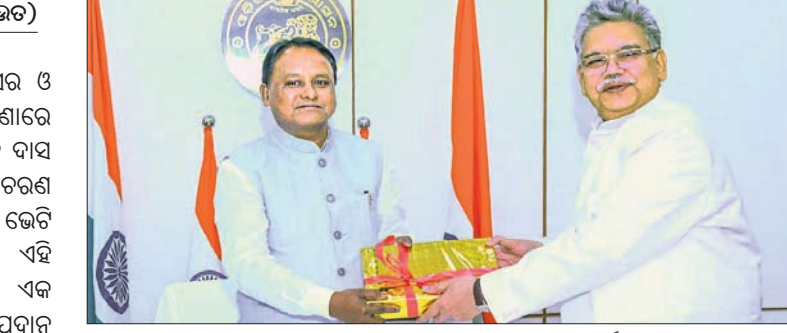
ମୁଖ୍ୟମନ୍ତ୍ରୀ ମୋହନ ଚରଣ ମାଝୀଙ୍କୁ ଉଦ୍ଦେଶ୍ୟରେ ଦାସ ତଦନ୍ତ ରିପୋର୍ଟ କପି ପ୍ରଦାନ କରୁଛନ୍ତି। ମୁଖ୍ୟ ଶାସନ ସଚିବ ସଚିବ ସତ୍ୟକିନ୍ଦ ତଦନ୍ତ ରିପୋର୍ଟ ଗୃହ ସଚିବଙ୍କୁ ପ୍ରଦାନ କରାଯାଇଥିଲା। ଏଥିସହ ସତ୍ୟକିନ୍ଦ ତଦନ୍ତ ରିପୋର୍ଟ ଗୃହ ସଚିବଙ୍କୁ ପ୍ରଦାନ କରାଯାଇଥିଲା।

ରାଜ୍ୟର ଦୂର୍ବ୍ୟବହାର ଅଭିଯୋଗକୁ ନେଇ ଆର୍ମି ଅଫିସର ଓ ବାନ୍ଧବୀ ଭରତପୁର ଥାନା ଯାଇଥିବା ବେଳେ ନିର୍ଯ୍ୟାତନା ଘଟଣାରେ ଆଇଆଇସିଙ୍କ ସହ ୪ଜଣ ପୋଲିସ କର୍ମଚାରୀଙ୍କୁ ଚାକିରିରୁ ନିଲମ୍ବନ କରାଯିବା ସହ ଗ୍ରାମପଞ୍ଚାୟତକୁ ତଦନ୍ତ ଭାର ସମ୍ଭାଳିବାକୁ ନିର୍ଦ୍ଦେଶ ଦିଆଯାଇଥିଲା। କମିଶନ ଘଟଣାସ୍ଥଳ ପରିଦର୍ଶନ କରିବା ସହ ଏକାଧିକ ଲୋକଙ୍କୁ ପଚରାଉଚରା କରି ତଥ୍ୟ ହାସଲ କରିଥିଲେ। ଏଥିସହ ସତ୍ୟକିନ୍ଦ ତଦନ୍ତ ରିପୋର୍ଟ ଗୃହ ସଚିବଙ୍କୁ ପ୍ରଦାନ କରାଯାଇଥିଲା। ଏଥିସହ ସତ୍ୟକିନ୍ଦ ତଦନ୍ତ ରିପୋର୍ଟ ଗୃହ ସଚିବଙ୍କୁ ପ୍ରଦାନ କରାଯାଇଥିଲା।