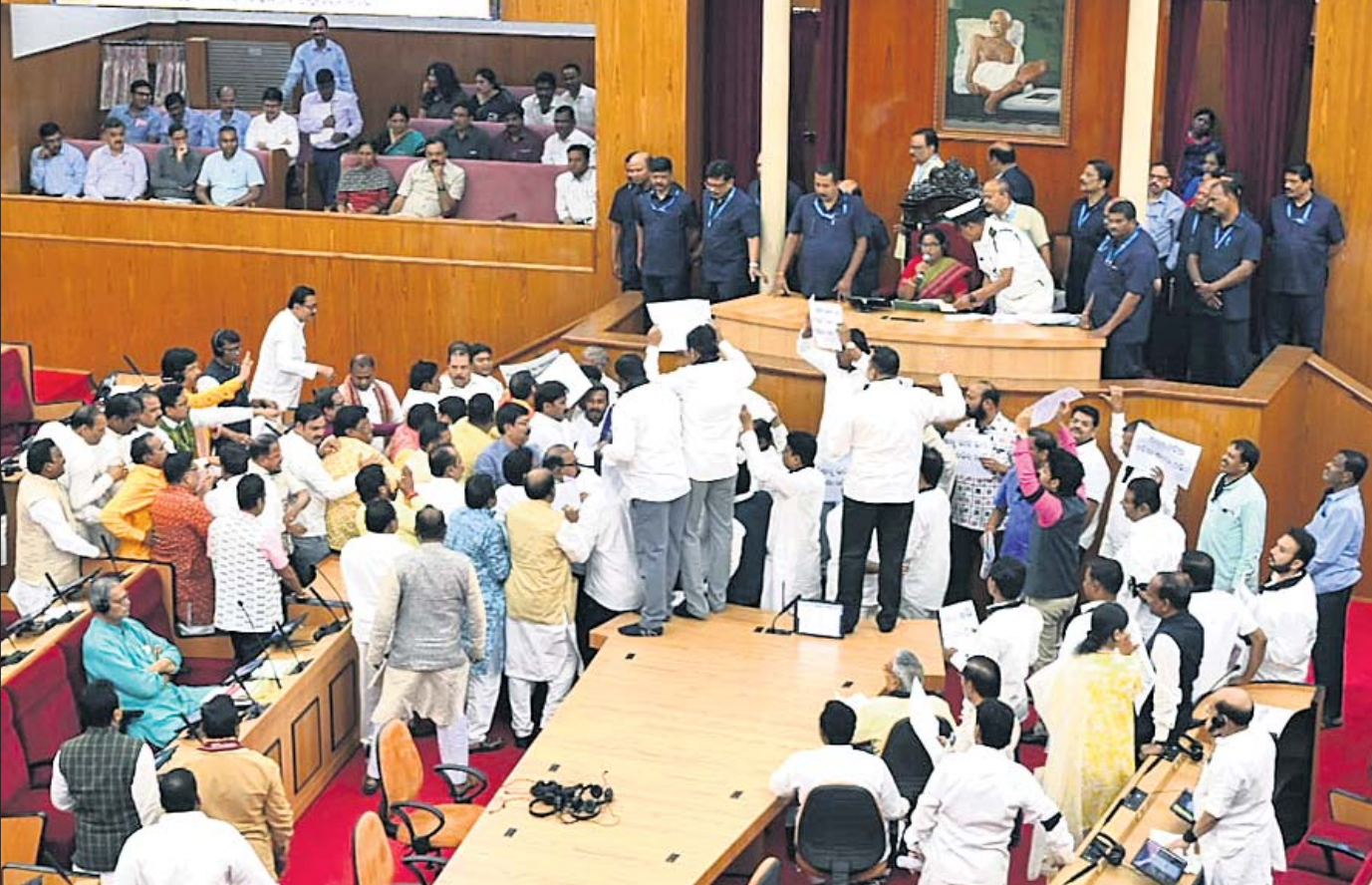
ବିଧାନସଭା ଅଧିବେଶନ ପ୍ରଥମାବସରରେ କୃଷକ ଶାସକ-ବିରୋଧୀଙ୍କ ମଧ୍ୟରେ ଧସ୍ତାଧସ୍ତି ପରିସ୍ଥିତି ସୃଷ୍ଟି ହୋଇଛି।