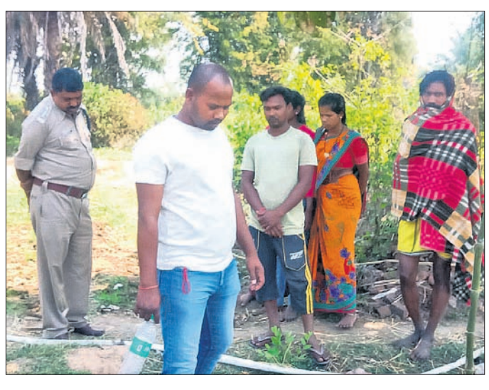
ସୋନପୁର ଏସ୍‌ଡିପିଓ ସାଇଡିଫିକ୍ ଟିମ୍ ସହ ଘଟଣାସ୍ଥଳରେ ତଦନ୍ତ କରୁଛନ୍ତି।