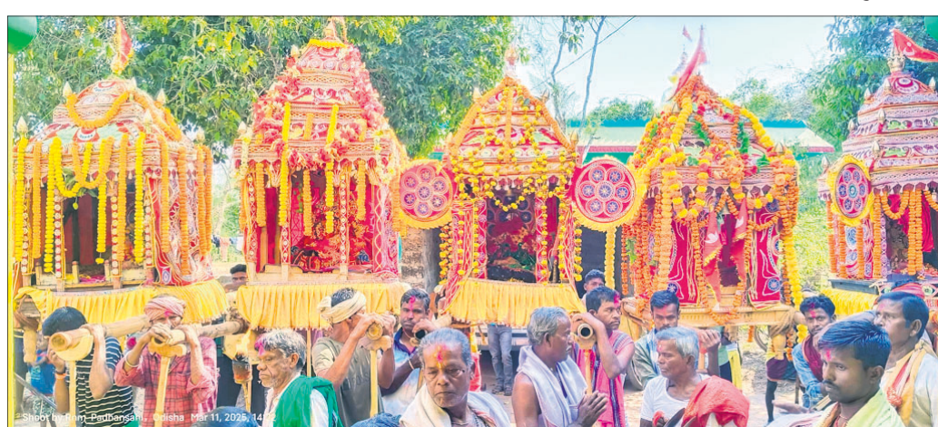
ଠାକୁରଙ୍କୁ ସୁସଜ୍ଜିତ ବିମାନରେ ଗ୍ରାମ ଅଭିଯୁକ୍ତେ ନିଆଯାଉଛି।

କଟଣା, ୧୧ମାର୍ଚ୍ଚ(ରବୀନ୍ଦ୍ରନାଥ ମହାକୁଡ଼) କଟଣା ପଞ୍ଚାଙ୍ଗ ଅନୁସାରେ ପାଞ୍ଚଦିନିଆ ଚାଟେରି ଭୋଗ ପାଳନ କରାଯାଉଛି। ଚାଟେରି ଭୋଗ ପାଳନ ପ୍ରସଙ୍ଗରେ ଗ୍ରାମ ଅଭିଯୁକ୍ତେ ଠାକୁରଙ୍କୁ ସୁସଜ୍ଜିତ ବିମାନରେ ଗ୍ରାମ ଅଭିଯୁକ୍ତେ ନିଆଯାଉଛି।