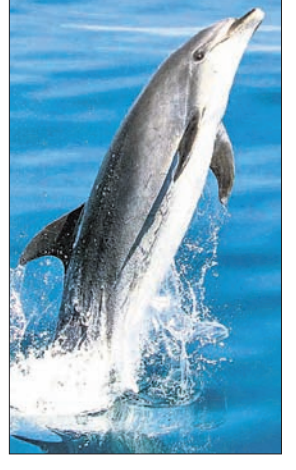
ଚିହ୍ନଟ କରାଯାଇଛି। ଏଥିସହ ପୁରୀରେ ୭ଟି, ବ୍ରହ୍ମପୁର ୧୩ଟି,

ଧାମରା ପୁରୀରୁ ଦେବା ପୁରୀ ଯାଏ ସମୁଦ୍ର ମଧ୍ୟରେ ଓ ଭିତରକନିକା ମଧ୍ୟରେ ଥିବା କ୍ରିକ୍ ଓ ନଦୀରେ ୯ଟି ଗଣନାକାରୀ ଟିମ୍ ଡଲ୍ଫିନ୍ ଗଣନା କରିଥିଲେ। ଭିତରକନିକା ସହ ଚିଲିକା, ପୁରୀ, ବ୍ରହ୍ମପୁର, ଭଦ୍ରକ ଓ ବାଲେଶ୍ୱରରେ ଡଲ୍ଫିନ୍ ଗଣନା କରାଯାଇଥିଲା। ରିପୋର୍ଟ ଅନୁସାରେ ଭିତରକନିକାରେ ଲରାଝାଡ଼ ଡଲ୍ଫିନ୍ ୨୨ଟି, ବରନୋଇ ୫ଟି, ହସ୍ତବ୍ୟାଜ ୪୦୦ଟି, ସ୍ଥାନର ୮ଟି ମିଶାଇ ୫୦୫ଟି ଡଲ୍ଫିନ୍ ଦେଖିବାକୁ ମିଳିଛି। ଚିଲିକାରେ ଲରାଝାଡ଼ ଡଲ୍ଫିନ୍ ୧୫୯ଟି, ହସ୍ତବ୍ୟାଜ ୧୫୯ଟି ମୋଟ ୧୭୪ଟି