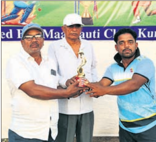
ଅତିଥିଙ୍କଠାରୁ ଜଣେ ଖେଳାଳି ମ୍ୟାନ ଅଫ୍ ଦି ମ୍ୟାଚ ପୁରସ୍କାର ଗ୍ରହଣ କରୁଛନ୍ତି।

ଖୋର୍ଦ୍ଧା ବ୍ଲକ ଅଧୀନ କୁରାଫଳାଠାରେ ଚାଲିଥିବା ରାଜ୍ୟ ଚିକିତ୍ସା ସ୍ତ୍ରୀକେନ୍ଦ୍ର ଚୁନାମରେ ମଙ୍ଗଳବାର ଏଭରେଷ୍ଟ କ୍ରିକେଟ କ୍ଲବ ଘାଟିକିଆ ଏବଂ ସ୍ଵାର ଇଲେଭେନ ସାରୁଆ ବିଜୟୀ ହୋଇଥିଲେ।