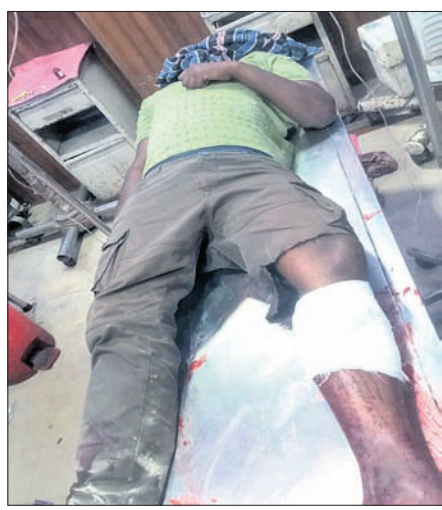
ପୋଲିସ୍ ବୁଲିବେ ଆହତ ୨ ଗୋଟାଲାଶକାରୀ।