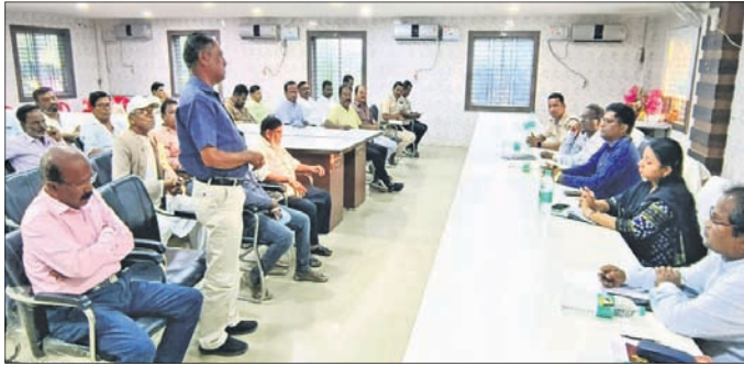
ବୈଠକରେ ଉପସ୍ଥିତ ଅଧିକାରୀ ଏବଂ ଅନ୍ୟମାନେ।

ବାଲୁଗାଁ ବଜାରସ୍ଥିତ ଗୁରୁଗୁରୁ ଛକଠାରେ ଦୁଇ ଦିନ ବାସିନ୍ଦା ମଧ୍ୟରେ ଗତ ଶୁକ୍ରବାର ବିକଳିତ ରାତିରେ ହୋଇଥିବା ଗୋଷ୍ଠୀ ସଂଘର୍ଷ ଘଟଣା ବର୍ତ୍ତମାନ ସମ୍ପୂର୍ଣ୍ଣ ନିୟନ୍ତ୍ରଣାଧୀନ ରହିଛି। ଏହି ଘଟଣାରେ ସମ୍ପୂର୍ଣ୍ଣ ଉଭୟ ଗୋଷ୍ଠୀର ୬ ଜଣଙ୍କୁ ଗିରଫ କରାଯାଇଛି।