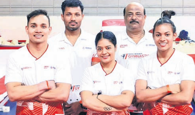
କୋର୍ଟ୍ ସହ ଓଡ଼ିଶା ଏନ୍‌ପିସିର ଜିମ୍ନାଷ୍ଟମାନେ।

ଏକ୍ସପରସାକ୍ଟ/ସ୍ପିଲି ରିଙ୍ଗ ପାଇଁ ଲାଗି ଭାରତ ଯୋଗ୍ୟତା ହାସଲ କରିବାରେ ବିଫଳ ହେବାକୁ ଲଢ଼ୁ ଗ୍ରାଉଣ୍ଡକୁ ରାଜସ୍ୱରେ ୪ ନିୟୁତ ପାଉଣ୍ଡ (ପାଖାପାଖି ୪୫ କୋଟି ଟଙ୍କା) କ୍ଷତି ସହିବାକୁ ପଡ଼ିବ। ଗତ ବୁଦ୍ଧ ଥରର ରନରଥ ଭାରତୀୟ ଦଳ ପାଇଁ ଲାଗି ଯୋଗ୍ୟତା ହାସଲ କରିପାରିନଥିଲା। ଆସନ୍ତା ଜୁନରେ ହେବାକୁ ଥିବା ଏହି ପାଇଁ ଲାଗି ଯୋଗ୍ୟତା ହାସଲ କରିବାରେ ବିଫଳ ହେବାରୁ ଲାଗି ଯୋଗ୍ୟତା ଓ ଦକ୍ଷିଣ ଆଫ୍ରିକା ପରସ୍ତରକୁ ଭେଟିବେ ଆଇସିସି ଓଲିମ୍ପିକ୍ସ ଚାମ୍ପିୟନଶିପ୍ (ଡିଏସ୍‌ଏଫ୍‌ଆଇ) ପାଇଁ ଲାଗି ଯୋଗ୍ୟତା ହାସଲ କରିବାରେ ବିଫଳ ହୋଇଥିବାରୁ ଲଢ଼ୁ ପାଖାପାଖି ୪