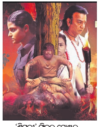
'ଶିମ୍ପଳା' ଫିଲ୍ମର ପୋଷ୍ଟର