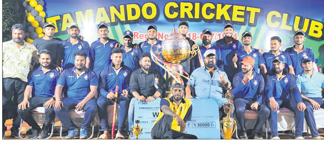
ଚାମ୍ପିୟନ ତମାଣ୍ଡୋ କ୍ରିକେଟ୍ କ୍ଲବ୍ ଖେଳାଳିମାନେ ଟ୍ରଫି ସହ ଅତିଥିକ୍ ଗହଣରେ।

ଡିଏମ୍ ୧୭.୧ ଓକ୍ଟୋବର ୬ ଉଲ୍ଲେଖରେ ୧୯୮୦ର ସଂଗ୍ରହ କରି ବିଜୟ ହୋଇଥିଲା। କ୍ଷମାସାଗର ବଳ ମ୍ୟାନ ଅଫ୍ ଦି ମ୍ୟାଚ୍ ଏବଂ ମ୍ୟାନ ଅଫ୍ ଦି ସିରିଜ୍ ବିବେଚିତ ହୋଇଥିଲେ। ଧାରକ ସିଂହ କ୍ଲବ୍ (ଟିଏସ୍‌ସି) ଚାମ୍ପିୟନ ହୋଇଛି। କ୍ଲବ୍ କୋର୍ଟ୍‌ରେ ଚାମ୍ପିୟନ ହେବାକୁ ଯାଉଥିବା ୪୦ ହଜାର ଆମେରିକୀୟ ଡଲାର ପୁରସ୍କାର ରାଶିବିଷୟ ଇଣ୍ଡିଆନ୍ ଓପନ୍ ଟୁର୍ନାମେଣ୍ଟରେ ଲକ୍ଷ୍ମି, କାମାତା, ମାଲେସିଆ ଓ ଜାପାନ ଭଳି ଦେଶର ଖେଳାଳିମାନେ ଅଂଶଗ୍ରହଣ କରିବେ। ତେବେ ୨୦୧୮ ପରେ ପ୍ରଥମଥର ପାଇଁ କୌଣସି ଶ୍ରେଣ୍ଡ ସ୍ୱାଶ୍ଟି ଟୁର୍ନାମେଣ୍ଟ ଭାରତରେ ଆୟୋଜିତ ହେବାକୁ ଯାଉଛି। ଗତଥର ମୁମ୍ବାଇରେ ସିଏସ୍‌ଏସ୍ ଇଣ୍ଡିଆନ୍ ଟୁର୍ନାମେଣ୍ଟ ଆୟୋଜିତ ହୋଇଥିଲା, ଯାହାକି ପିଏସ୍‌ଏସ୍ ଓଲିମ୍ପିକ୍ସର ଟୁର୍ନାମେଣ୍ଟ।