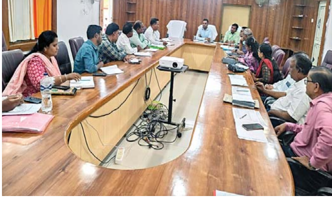
ବୈଠକରେ ଉପସ୍ଥିତ ଅଧିକାରୀ। ବିଭାଗୀୟ ଅଧିକାରୀଙ୍କୁ ନିର୍ଦ୍ଦେଶ ଦେଇଛନ୍ତି। ପାଣି ସମସ୍ୟା ନେଇ ଯେ କେହି ଅଭିଯୋଗ ଆଣୁଛନ୍ତି, ତାହାର ଦୂରକ୍ତ ସମାଧାନ କରିବାକୁ କହିଛନ୍ତି।