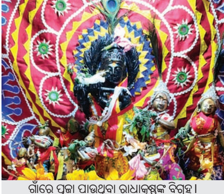
ଗାଁରେ ପୂଜା ପାଉଥିବା ରାଧାକୃଷ୍ଣଙ୍କ ବିଗ୍ରହ।

ବାଲେଶ୍ୱର, ୧୩୩୩(ସଞ୍ଚାଳିତ ଦେ) ୧୦୦ବର୍ଷ ପରମ୍ପରା ପିଞ୍ଚାବଣିଆ ଦୋଳମେଳଣ ହେଲେ ଆଗଭଳି ଆଉ ଦୋଳ ବିମାନରେ ରାଧାକୃଷ୍ଣଙ୍କ ବିଗ୍ରହ ସାମିଲ ହେଉନାହାନ୍ତି। ଐତିହ୍ୟ, ପରମ୍ପରା ଓ ସଂସ୍କୃତିସମ୍ପନ୍ନ ଏହି ମେଳଣରେ ବିଗ୍ରହମାନଙ୍କୁ ଆଉ ନିମନ୍ତଣ କରାଯାଉନାହିଁ। ବାଲେଶ୍ୱର ଓ ମୟୂରଭଞ୍ଜ ଜିଲ୍ଲା ସାମାନ୍ତରେ ଅନୁଷ୍ଠିତ ହୋଇଆସୁଥିବା ଏହି ମେଳଣ ଫିକା ପଡ଼ୁଥିବା ପରିଲକ୍ଷିତ ହେଉଛି। ଓଡ଼ିଶା, ପର୍ଶୁରାମ, ବିହାର, ଝାଡ଼ଖଣ୍ଡ ଆଦି ରାଜ୍ୟରେ ପିଞ୍ଚାବଣିଆ ହୋଲି ଭାବେ ଖ୍ୟାତିଅର୍ଜନ କରିଥିବା ଏହି ମେଳଣରେ ବର୍ଷକୁ ବର୍ଷ ବ୍ୟବସାୟିକ କାରବାର ବଢ଼ିଚାଲିଥିବା ବେଳେ ପୂର୍ବ ପରମ୍ପରା ଲୋପ ପାଇବାରେ ଲାଗିଛି। କେବଳ ଗାଁରେ ପୂଜା ପାଉଥିବା ରାଧାକୃଷ୍ଣଙ୍କ ବିଗ୍ରହ ଦୋଳବିମାନରେ ମେଳଣ ପଡ଼ିଥା ପରିକ୍ରମା କରୁଛନ୍ତି। ୪ଦିନ ବ୍ୟାପୀ ଏହି ମେଳଣରେ ଲକ୍ଷାଧିକ ଲୋକଙ୍କ ସମାଗମ ହୁଏ। ଉଠା ବ୍ୟବସାୟୀଙ୍କ ଭିଡ଼ ଜମେ। ଖୁଟିର ପ୍ରସ୍ତର ମୂର୍ତ୍ତି, ରେପୁଣୀର କଂସାଦାନନ, ପିପିଲିର ଚାନ୍ଦୁଆ, ଚନ୍ଦନେଶ୍ୱର ଓ ଭୋଗରାଜର ମଣିଷାଠାରୁ ଆରମ୍ଭ କରି ବେତପାଲିଆ, ମାଛଧରା ଭାଲ, ଚଣାଉଖୁଡ଼ା, ବିଞ୍ଚଣା, ଚଳାତାଲୁଣା