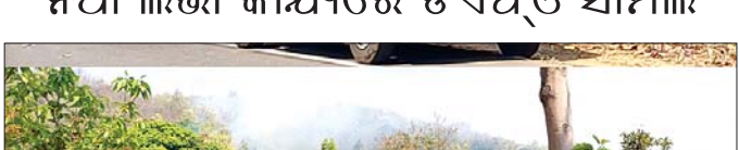
ନିଆଁ ଲିଭାଇ କାର୍ଯ୍ୟରେ ଡିଏଫଓ ସାମିଲ