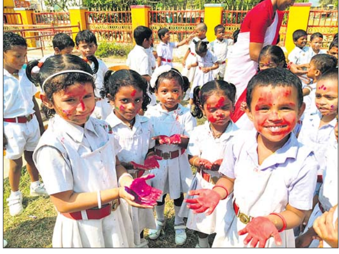
ବିଦ୍ୟାଳୟରେ ହୋଇ ଉତ୍ସବ ପାଳିଥିବା ଛାତ୍ରାଛାତ୍ରୀମାନେ।

ପାରଳାଖେମୁଣ୍ଡି, ୧୩୩(ଗିରିଧାରୀ ପରିଚ୍ଛା) ପାରଳାଖେମୁଣ୍ଡି ଶିଶୁ ବିଦ୍ୟାଳୟରେ ଗୁରୁବାର ଛାତ୍ରାଛାତ୍ରୀଙ୍କ ଦ୍ୱାରା ରଙ୍ଗର ପିଠା ବଣାଯାଇ ପ୍ରଦାନ କରାଯାଇଥିଲା। ଏହି ଅବସରରେ ଛାତ୍ରାଛାତ୍ରୀମାନେ ଗୁରୁମାଗୁରୁଙ୍କ ଓ ପରମ୍ପରାକୁ ରଙ୍ଗ