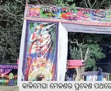
କାଳିମେଘା ମେଳଣର ପ୍ରବେଶ ପଥରେ ଆକର୍ଷଣୀୟ ତୋରଣ।

ଶ୍ରୀ ଗୋପାଳୀୟ ଜୀଉ ସାଗତ କରିଥା'ନ୍ତି। ଚୋପ ଶବ୍ଦରେ ପ୍ରଥମେ ଗୁଡ଼ୁପାଳ ଗ୍ରାମର ଶ୍ରୀ ରାଧାବଲ୍ଲଭ ଜୀଉ ଶୋଭାଯାତ୍ରାରେ ମେଳଣ ପଡ଼ିଥା। ଆଡ଼କୁ ଅଗ୍ରସର ହୋଇଥା'ନ୍ତି। ପରେ ପରେ ଅନ୍ୟ ଜାଉମାନେ କ୍ରମାନ୍ୱୟରେ ମେଳଣ ପଡ଼ିଥାକୁ ଶୋଭାଯାତ୍ରାରେ ଯାଇଥା'ନ୍ତି। ତେବେ ଶ୍ରୀଜୀଉମାନେ ଗ୍ରାମରେ ଥିବା ବସୁଦାମନ