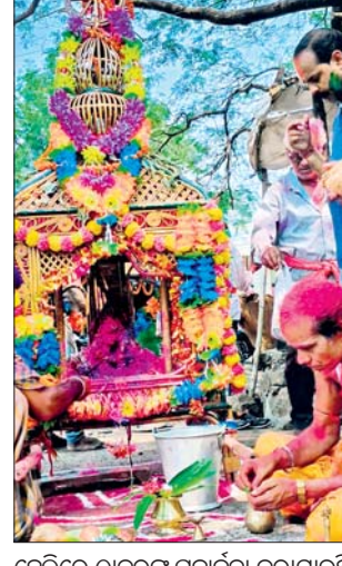
ହୋଲିରେ ଠାକୁରଙ୍କୁ ପୂଜାର୍ଚ୍ଚନା କରାଯାଉଛି ।

ବାଲିମେଳା ସହର ସମେତ କୋରୁକୋଣ୍ଡା ବ୍ଲକ୍ ବିଭିନ୍ନ ଅଞ୍ଚଳରେ ଶୁକ୍ରବାର ଓ ଶନିବାର ବୁଲ ଦିନଧରି ଦୋଳ ପୂର୍ଣ୍ଣିମା ଓ ହୋଲି ଉତ୍ସବ ପାଳିତ ହୋଇଯାଇଛି।