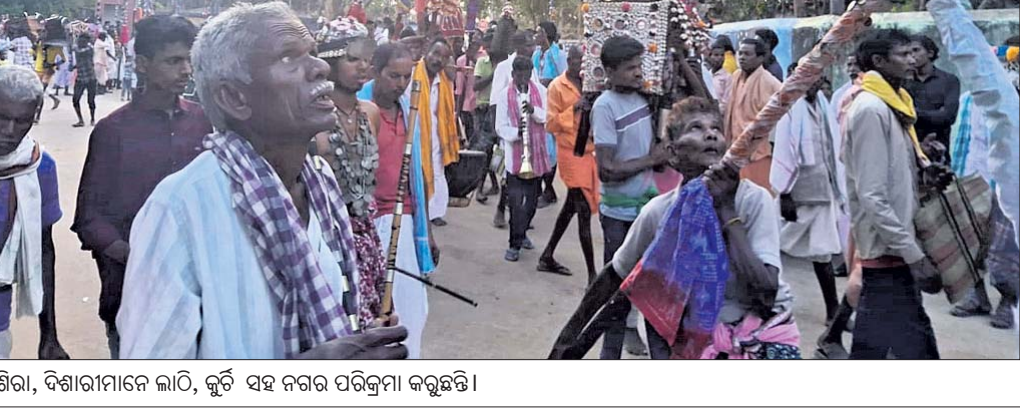
ଶିରା, ଦିଶାରୀମାନେ ଲାଠି, କୁର୍ଚି ସହ ନଗର ପରିକ୍ରମା କରୁଛନ୍ତି।

ମନ୍ଦିରରେ ପୂଜାର୍ଚ୍ଚନ ହୋଇଥିଲା । ସନ୍ଧ୍ୟାରେ ସମସ୍ତ ଲାଠି, କୁର୍ଚି ନଗର ପରିକ୍ରମା କରିଥିଲେ। ପୂଜାରୀ, ଶିରା ଓ ଦିଶାରୀମାନେ ସାକସଜା ହୋଇ ଖଣ୍ଡା ଧରି ଗର୍ଦନଭଜାଠାରେ ବାଦ୍ୟର ତାଳେ