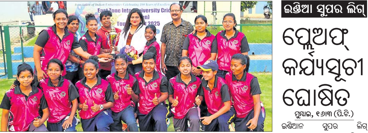
କିର୍ ମହିଳା କ୍ରିକେଟ ଦଳର ଖେଳାଳିମାନେ ଅତିଥିକ ଗହଣରେ।

ଭୁବନେଶ୍ୱର, ୧୬ମାର୍ଚ୍ଚ (ତପନ ସାଲ୍) ପୂର୍ବୀକ୍ଷଣ ଆରମ୍ଭ ବିଶ୍ୱବିଦ୍ୟାଳୟ ମହିଳା କ୍ରିକେଟ ପ୍ରତିଯୋଗିତା କିର୍ କ୍ରିକେଟ କ୍ଷୁଭିତମରେ ଅନୁଷ୍ଠିତ ହୋଇଯାଇଛି। ଏଥିରେ ବୀର ବାହାଦୁର ସିଂ ଚାମ୍ପିୟନ ହୋଇଥିବା ବେଳେ କିର୍ ରନରଥପ ଗ୍ରାଣ୍ଡ ହାସଲ କରିଛି। ଲଳିତ ନାରାୟଣ ମିଥ୍ଲା ଅଲିମ୍ପିଆନ୍ ଅନୁରାଧା ବିଶ୍ୱାଳ ଓ ସିନିୟର ଏନ୍‌ଆଇଏସ୍ କ୍ରିକେଟ କୋର୍ ଅଜିତ ମିଶ୍ର ଅତିଥିକାରେ ଯୋଗଦେଇ ପୁରସ୍କାର ପ୍ରଦାନ କରିଥିଲେ। ପ୍ରକାଶଯୋଗ୍ୟ ଯେ, ପ୍ରତିଯୋଗିତାରେ ପ୍ରଭାବା ପ୍ରଦର୍ଶନ କରି କିର୍ ବିଶ୍ୱବିଦ୍ୟାଳୟ ସର୍ବଭାରତୀୟ ଯୋଗ୍ୟତା ହାସଲ କରିଛି।