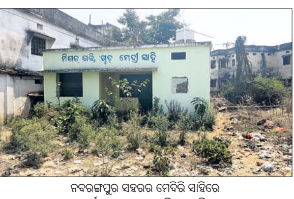
ନବରଙ୍ଗପୁର ସହରର ମେଦିନି ସାହିରେ ଜରାଜୀର୍ଣ୍ଣ ଅବସ୍ଥାରେ ଥିବା ମିଶନ ଶକ୍ତି ଗୃହ ।

ମିଶନଶକ୍ତିମାଧ୍ୟମରେ ଏକପକ୍ଷୀୟ ମହିଳାମାନେ ସଂଗଠିତ ହେବେ । କିଛି ଆତ୍ମନିର୍ଭର ଶାଳ ହେବେ ଓ ସେମାନେ ଏକାଠି ବସି ଚିଠିକ କରନ୍ତୁ ।