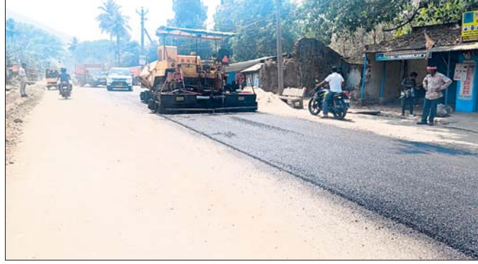
ରାସ୍ତା କାମ କରାଯାଉଛି ।

ମାଲକାନଗିରି ଜିଲ୍ଲା ବାଲିମେଳା ମୁଖ୍ୟ ରାସ୍ତା ମରଣାପତା ପାଇଁ ଥିଲା । ବିଭାଗୀୟ କର୍ତ୍ତୃପକ୍ଷ ଏଥିପ୍ରତି ଦୃଷ୍ଟି ଦେଇ ନ ଥିଲେ । ଏ ନେଇ ଧରିତ୍ରୀରେ ବାରମ୍ବାର ଖବର ପ୍ରକାଶ ପାଇବା ପରେ ଗତ ତିନିସପ୍ତାହରେ ବିଭାଗ ପକ୍ଷରୁ ସହରର ପ୍ରବେଶ ପଥଠାରୁ ପାଖାପାଖି ୫ କି.ମି. ୧୦୦ ମିଟର ନିର୍ମାଣ ନିମନ୍ତେ ପ୍ରାୟ ୮୫ ଲକ୍ଷ ଟଙ୍କାରେ ଚେଣ୍ଡର କରାଯାଇଥିଲା ।