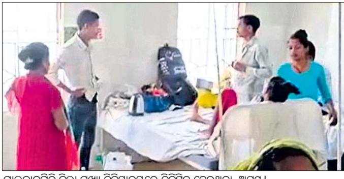
ମାଲକାନଗିରି ଜିଲ୍ଲା ପୁଖ୍ୟ ଚିକିତ୍ସାଳୟରେ ଚିକିତ୍ସିତ ହେଉଥିବା ଅସୁସ୍ଥ।

ମାଲକାନଗିରି ଜିଲ୍ଲା ଜୟପୁରିଆଗୁଡ଼ାରେ ପନିର ଓ ଛତୁ ଖାଇ ୨୨ ଜଣ ଅସୁସ୍ଥ ହୋଇ ଜିଲ୍ଲା ପୁଖ୍ୟ ଚିକିତ୍ସାଳୟରେ ଚିକିତ୍ସିତ ହେଉଛନ୍ତି।