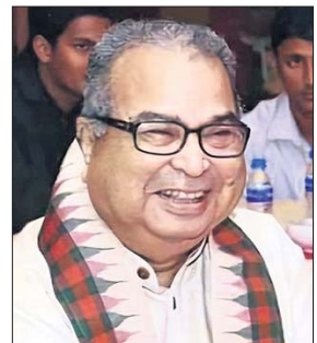
ଭୁବନେଶ୍ୱର, ୧୭୩୩(ପୁନିତ ମିଶ୍ର)

୩ ଅର ଭାଇପା ରାଜ୍ୟ ସଭାପତି, ୨ ଅର କେନ୍ଦ୍ରମନ୍ତ୍ରୀ ଥିଲେ