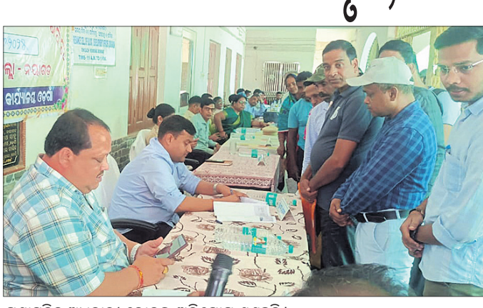
ପ୍ରଶାସନିକ ଅଧିକାରୀ ଲୋକଙ୍କ ଅଭିଯୋଗ ଶୁଣୁଛନ୍ତି।

ଓଡ଼ିଶା, ୧୭/୩ (ଆଦର୍ଶ କୁମାର ପଟ୍ଟନାୟକ) ମୁଖ୍ୟ ସମ୍ପର୍କିତ, ଅନ୍ୟ ଗୋଟିଏ ରେଡ଼କ୍ରସ ସମୟରେ ସମାଧାନ ରହିଥିଲା। ଶିବିରରେ ୨୧ଟି ଅଭିଯୋଗର ତତ୍କାଳ ସମାଧାନ ହୋଇଥିଲା। ଅବଶିଷ୍ଟ ଅଭିଯୋଗଗୁଡ଼ିକ ସମାଧାନ ନିମନ୍ତେ ସମ୍ପୃକ୍ତ ବିଭାଗଗୁଡ଼ିକକୁ ନିର୍ଦ୍ଦେଶ ଦିଆଯାଇଥିଲା। ବିଶେଷ କରି ମୁଖ୍ୟ ଉପାଧ୍ୟକ୍ଷ ଅଧିକାରୀ ତଥା ନିର୍ବାହୀ ଅଧିକାରୀ ଜିଲା ପରିଷଦ ନୟାଗଡ଼ ଲଗ୍ଗିତ ରାଜତ, ଉପଜିଲ୍ଲାପାଳ କର୍ଣ୍ଣଦେବ ସମାଧାନ, ଏସ୍ପି ଏସ୍ ସୁଶ୍ରୀ ଏବଂ ସମସ୍ତ ବିଭାଗୀୟ ଜିଲା ଅଧିକାରୀଙ୍କ ଉପସ୍ଥିତ ରହିଥିଲେ। ଅଧିକାରୀମାନେ ୭୪ ପଞ୍ଜୀକୃତ ଅଭିଯୋଗ ମଧ୍ୟରୁ ୨୭ଟି ବ୍ୟକ୍ତିଗତ ରହିଥିବାବେଳେ ୫୭ଟି ଗ୍ରାମ ସମୂହ ସମାଧାନ ଓ ଗୋଟିଏ ମୁଖ୍ୟମନ୍ତ୍ରୀ ରିଲିଫ