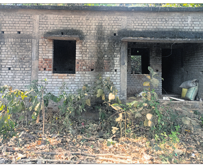
ଅଧ୍ୟାପକରିଆ ଭାବେ ପଢ଼ିଥିବା ଅଙ୍ଗନଓଡ଼ି ଗୃହ। ସକାଳୁଆ ସ୍କୁଲ ହୋଇଥିଲେ ମଧ୍ୟ ୧୦ଟି ପୁଞ୍ଜା ଜଣେ ଶିଶୁ ଓ ସହାୟିକା ଆସିଛନ୍ତି।

ନୟାଗଡ଼ ଜିଲା ନୂଆଗାଁ ବ୍ଲକ୍ ମାଲିଆଦି ପଞ୍ଚାୟତ ଜିପାମାଳ ଅଙ୍ଗନଓଡ଼ି କେନ୍ଦ୍ର ପ୍ରତି କୌଣସି ଅଧିକାରୀଙ୍କ ଦୃଷ୍ଟି ପଡ଼ୁନାହିଁ। ଫଳରେ ସେଠାରେ ନିୟୋଜିତ ଥିବା କର୍ମୀ ନିଜ ଲକ୍ଷ୍ମ ଅନୁସାରେ କେନ୍ଦ୍ର ଚଳାଉଛନ୍ତି। କେନ୍ଦ୍ରର ନିଜସ୍ୱ ଗୃହ ହୋଇ ପାରୁ ନ ଥିବା ଅଭିଯୋଗ ହେଉଛି। ମାଲିଆଦି ପଞ୍ଚାୟତ ଚଳାପଥର, ଜିପାମାଳ, ରାଜନପଲି ଗ୍ରାମର ମହଲା, କିଶୋରୀ ବାଳିକା ଓ ସର୍ବୋପରି ଶିଶୁମାନଙ୍କ ସାଥୀକୁ ଦୃଷ୍ଟିରେ ରଖି ଜିପାମାଳଠାରେ ଅଙ୍ଗନଓଡ଼ି କେନ୍ଦ୍ର ପ୍ରତିଷ୍ଠା କରାଯାଇଛି। କେନ୍ଦ୍ରର ନିଜସ୍ୱ ଗୃହ ପାଇଁ ସରକାର ଅନୁଦାନ ଦେଇଥିଲେ ମଧ୍ୟ ଅଧିକାରୀମାନଙ୍କ ଅପାରଗତା କାରଣରୁ ନିର୍ବାଣ କାର୍ଯ୍ୟ ଦୀର୍ଘବର୍ଷ ହେଲା ଅଧ୍ୟାପକରିଆ ଭାବେ ପଢ଼ି ରହିଛି। ତେବେ ସମ୍ପୃକ୍ତ କେନ୍ଦ୍ରର ନିଜସ୍ୱ ଗୃହ ନ ଥିବାରୁ ଜିପାମାଳ ସରକାରୀ ଉଚ୍ଚ ପ୍ରାଥମିକ ବିଦ୍ୟାଳୟରେ ଏହା ଚାଲିଛି।