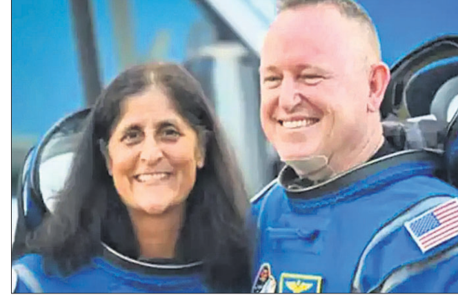
ସୁନୀତା ଫିଲିଅପ୍ସ ଓ ବୁର୍ ଫିଲିମୋର