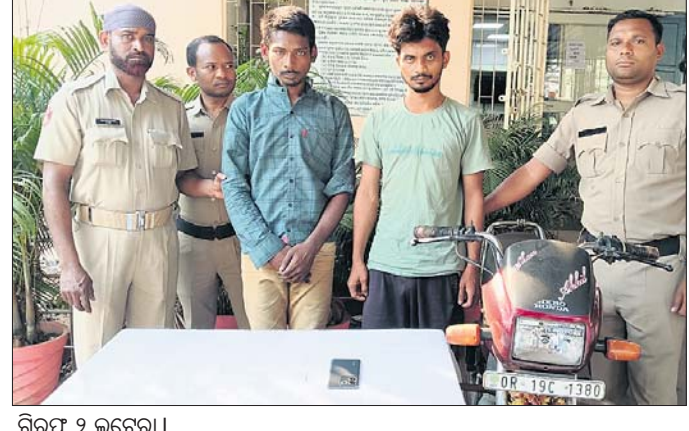
ଗିରଫ ୨ ଲୁଚେରା।

ଭୁବନେଶ୍ୱର, ୧୭ମାର୍ଚ୍ଚ (ସୂର୍ଯ୍ୟକାନ୍ତ ବେହେରା)