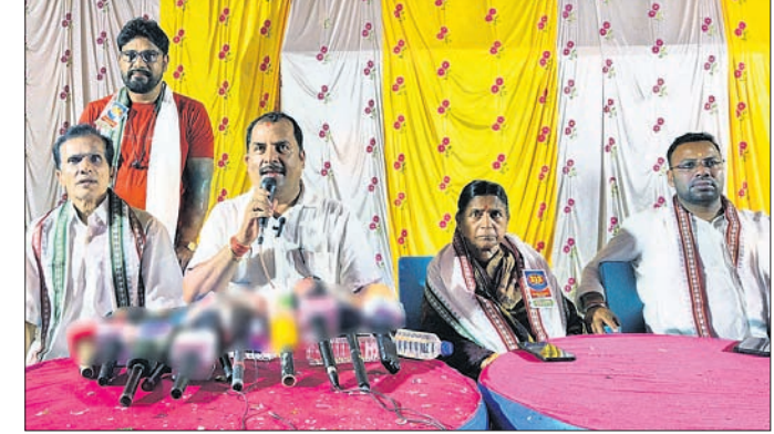
ଖବରଦାତା ସମିଳନାରେ ବିଧାୟକ ଦୁଇଜଣଙ୍କୁ ନିର୍ଦ୍ଦେଶ ଦିଆଯାଇଛି ।

ନୟାଗଡ଼ ଜିଲା କୃଷିଲୋ ଜଗନ୍ନାଥ ସଂସ୍କୃତିର ଆଦି ଦେବତା ଶ୍ରୀନୀଳମାଧବଜୀଉଙ୍କୁ ଦର୍ଶନ, ଜୀଉଙ୍କ ଆଦ୍ୟ ସେବକ ବିଶ୍ୱାସପୁ ଶବରରାଜାଙ୍କ ଜନ୍ମପୀଠ ନିକଟସ୍ଥ କାଳିଆପଲ୍ଟାକୁ ଗାଁକୁ ରାଷ୍ଟ୍ରପତି ଡ୍ରୋପଦା ମୁର୍ତ୍ତି ଆସନ୍ତା ୨୪ ତାରିଖରେ ଆସିବାର କାର୍ଯ୍ୟକ୍ରମ ସ୍ଥିର ହୋଇଛି । ଏହି ଉପଲକ୍ଷେ ନୀଳମାଧବ ପୀଠ ଚଳଚଞ୍ଚଳ ହୋଇ ଉଠିଛି । ରାଷ୍ଟ୍ରପତିଙ୍କ ଗନ୍ତବ୍ଧ କାର୍ଯ୍ୟକ୍ରମକୁ ନେଇ ଜିଲା ପ୍ରଶାସନ ସହ ବିଭିନ୍ନ ବିଭାଗର ଅଧିକାରୀମାନେ ଚର୍ଚ୍ଚା ହୋଇଉଠିଛନ୍ତି । ଏହି ପରିସ୍ଥିତିରେ ଖଣ୍ଡପଡ଼ା ନିର୍ବାଚନପ୍ରଶାସନ ସମସ୍ତ ଅଞ୍ଚଳବାସୀ ତଥା ସମସ୍ତରେ ରାଷ୍ଟ୍ରପତିଙ୍କ ଆଗମନକୁ କିତନା ଓ କ୍ୟାନସର ବିକିରଣରୁ ରକ୍ଷା ପାଇଁ ଆବଶ୍ୟକ ପଦକ୍ଷେପ ଗ୍ରହଣ କରିବାକୁ ନିର୍ଦ୍ଦେଶ ଦିଆଯାଇଛି । ଏହାଛଡ଼ା ବିଭିନ୍ନ ପ୍ରକାରର କୃଷି ଭିତ୍ତିକ ଶିଳ୍ପ ପ୍ରତିଷ୍ଠାନ ପ୍ରତିଷ୍ଠା, କ୍ଷୁଦ୍ର ଓ କୁଟୀର ପ୍ରକ୍ରିୟା କରଣ, ମାନ ନିର୍ବାହଣ ସହ ପାଇବା ସହ ସାଧାରଣରେ ଦାବି ହେଉଛି ।