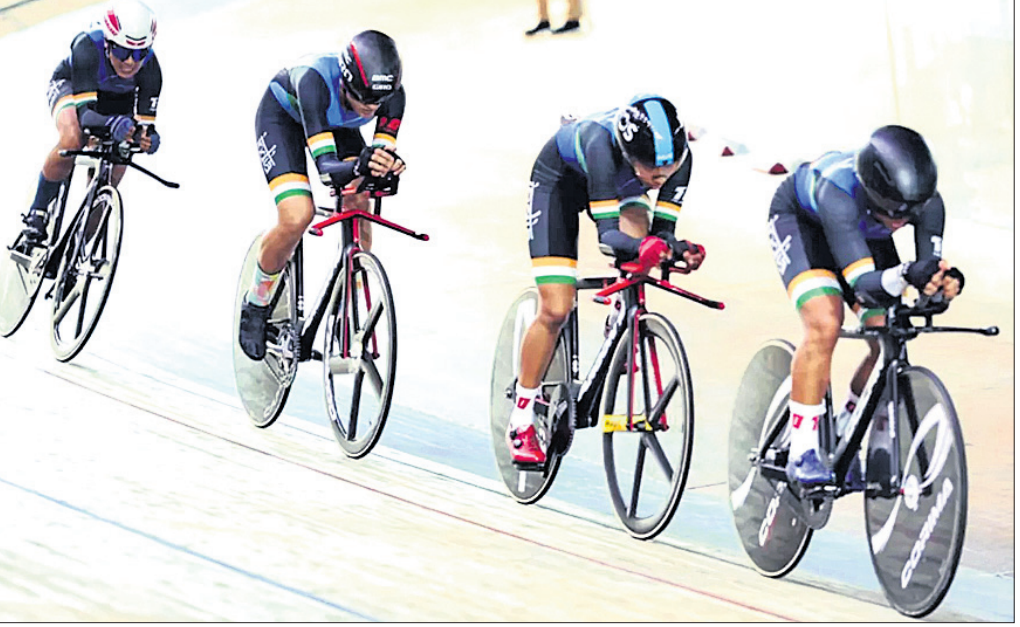
ସୁସିଆଲ ଟ୍ରାକ୍ ସାଇକ୍ଲିଂ ନେଶନ୍ସ କପ୍‌ର ପୁରୁଷ ଟିମ୍ ଟ୍ରିଫ୍ ଇଭେଣ୍ଟ ଅବସରରେ ପ୍ରତିଯୋଗୀମାନେ।