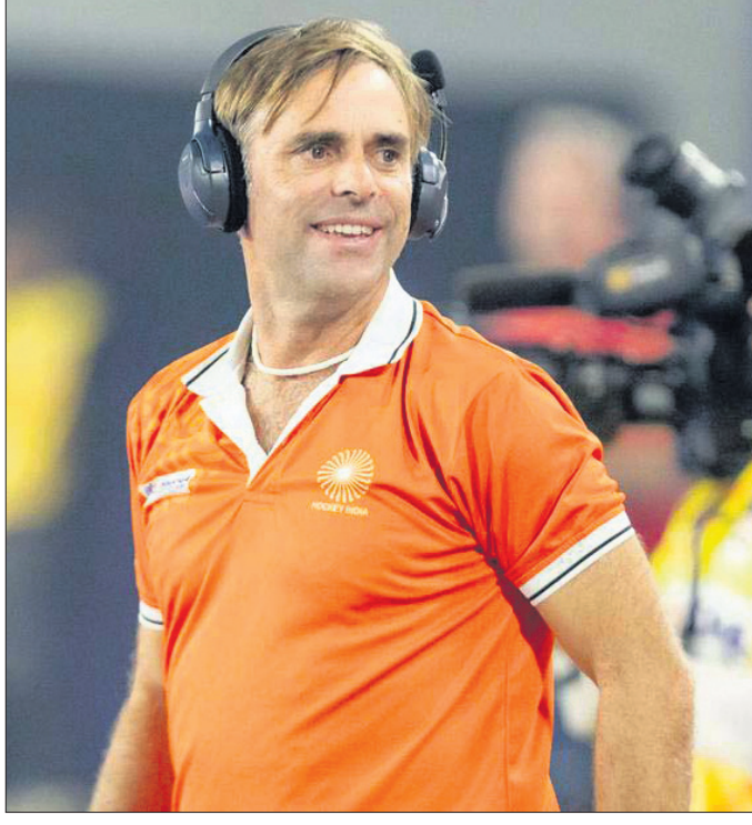
ଭାରତୀୟ ଦଳର ପୁଖ୍ୟ କୋର୍ କ୍ରେମ୍ ଫୁଲଟନ।

ଓ ଅଧିକ ରୋହିତାସୀ କିଛିଦିନ ତଳେ ଭାରତୀୟ ଦଳ ୨୦୨୪-୨୫ ଏସିଆଇଏସ୍ ହକି ପ୍ରୋ ଲିଗ୍ ବିଜେଇ ଯୋଗେ ପରିବେଶରେ ଆରମ୍ଭ କରିଥିଲା। ଏଥିରେ ଭାରତୀୟ ଦଳ ପ୍ରଭାବୀ ପ୍ରଦର୍ଶନ କରି ୮ ମ୍ୟାଚରୁ ୫ଟିରେ ବିଜୟ ହାସଲ କରିଥିଲା।