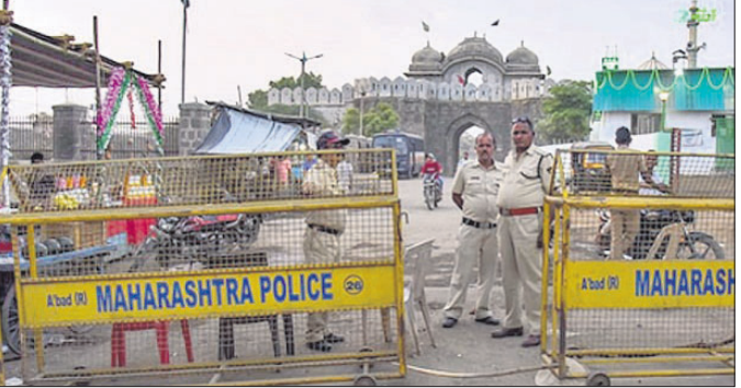
ଖୁଲବାବଦ୍ଧ ଔରଙ୍ଗଜେବଙ୍କ କବରସ୍ଥଳ ବାହାରେ ସୁରକ୍ଷା ବ୍ୟବସ୍ଥା କଡ଼ାକଡ଼ି କରାଯାଇଛି।

କବରସ୍ଥଳକୁ ହଟାଇବା ପ୍ରକ୍ରିୟାରେ ବିଳମ୍ବ ଘଟେ ତେବେ ବାବୁରା ମସଜିଦ୍ ଧ୍ୟାନ ଘଟଣା ପରି ଖୁଲବାବଦ୍ଧିତ ଔରଙ୍ଗଜେବଙ୍କ କବରସ୍ଥଳକୁ ମଧ୍ୟ ଭଙ୍ଗାଯିବ। ହିନ୍ଦୁବାଦୀ ସଙ୍ଗଠନର ତେତାବନୀ ପରେ ଔରଙ୍ଗଜେବଙ୍କ କବରସ୍ଥଳର ସୁରକ୍ଷା ବ୍ୟବସ୍ଥାକୁ କଡ଼ାକଡ଼ି କରାଯାଇଛି। ଘଟଣାସ୍ଥଳରେ ବହୁ ସଂଖ୍ୟାରେ ଷ୍ଟେଟ୍ ରିଜର୍ଭ୍ ପୋଲିସ୍ ଡାକ୍ତରୀ ସୁରକ୍ଷା ଦେବାପାଇଁ ତେତାବନୀ ଦେଇଛନ୍ତି। ଏହି ତେତାବନୀରେ କୁହାଯାଇଛି, ଯଦି ଔରଙ୍ଗଜେବଙ୍କ କବରସ୍ଥଳକୁ ହଟାଇବା ପ୍ରକ୍ରିୟାରେ ବିଳମ୍ବ ଘଟେ ତେବେ ବାବୁରା ମସଜିଦ୍ ଧ୍ୟାନ ଘଟଣା ପରି ଖୁଲବାବଦ୍ଧିତ ଔରଙ୍ଗଜେବଙ୍କ କବରସ୍ଥଳକୁ ମଧ୍ୟ ଭଙ୍ଗାଯିବ। ହିନ୍ଦୁବାଦୀ ସଙ୍ଗଠନର ତେତାବନୀ ପରେ ଔରଙ୍ଗଜେବଙ୍କ କବରସ୍ଥଳର ସୁରକ୍ଷା ବ୍ୟବସ୍ଥାକୁ କଡ଼ାକଡ଼ି କରାଯାଇଛି। ଘଟଣାସ୍ଥଳରେ ବହୁ ସଂଖ୍ୟାରେ ଷ୍ଟେଟ୍ ରିଜର୍ଭ୍ ପୋଲିସ୍ ଡାକ୍ତରୀ ସୁରକ୍ଷା ଦେବାପାଇଁ ତେତାବନୀ ଦେଇଛନ୍ତି। ଏହି ତେତାବନୀରେ କୁହାଯାଇଛି, ଯଦି ଔରଙ୍ଗଜେବଙ୍କ କବରସ୍ଥଳକୁ ହଟାଇବା ପ୍ରକ୍ରିୟାରେ ବିଳମ୍ବ ଘଟେ ତେବେ ବାବୁରା ମସଜିଦ୍ ଧ୍ୟାନ ଘଟଣା ପରି ଖୁଲବାବଦ୍ଧିତ ଔରଙ୍ଗଜେବଙ୍କ କବରସ୍ଥଳକୁ ମଧ୍ୟ ଭଙ୍ଗାଯିବ।