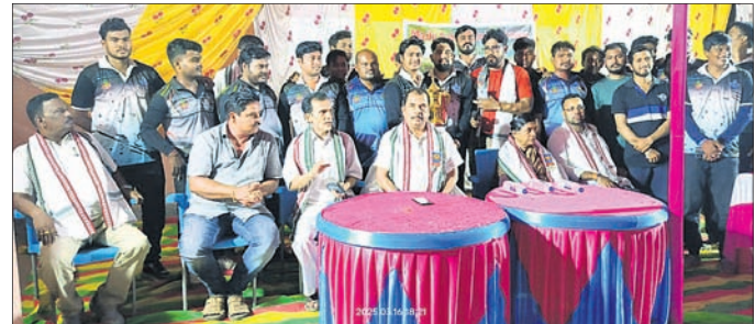
ଅତିଥିମାନେ ଚାମ୍ପିୟନ ଦଳକୁ ତ୍ରୁଟି ପ୍ରଦାନ କରୁଛନ୍ତି।