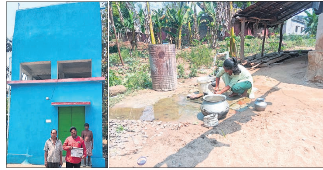
ଗ୍ରାମବାସୀ ନିର୍ମାଣ କରିଥିବା ପାନୀୟ ଜଳ ପ୍ରକଳ୍ପ । ଲୋକଙ୍କ ପାନୀୟ ଜଳ ସମସ୍ୟା ଦୂର ହେବା ପରେ ବ୍ୟବହାର କରାଯାଇଛି ।