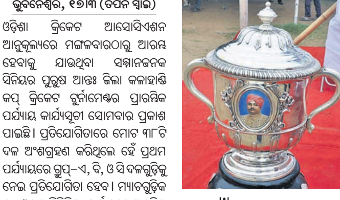
କେଉଁ ଗ୍ରୁପ୍‌ରେ କିଏ

ଓଡ଼ିଶା କ୍ରିକେଟ ଆସୋସିଏସନ୍ ଆନୁକୁଲ୍ୟରେ ମଙ୍ଗଳବାରଠାରୁ ଆରମ୍ଭ ହେବାକୁ ଯାଉଥିବା କଳାହାଣ୍ଡି କପ୍ କ୍ରିକେଟ ପ୍ରଥମ ପର୍ଯ୍ୟାୟରେ ଏ, ବି, ଓ ଗ୍ରୁପ୍ ମ୍ୟାଚ ଖେଳାଯିବ।