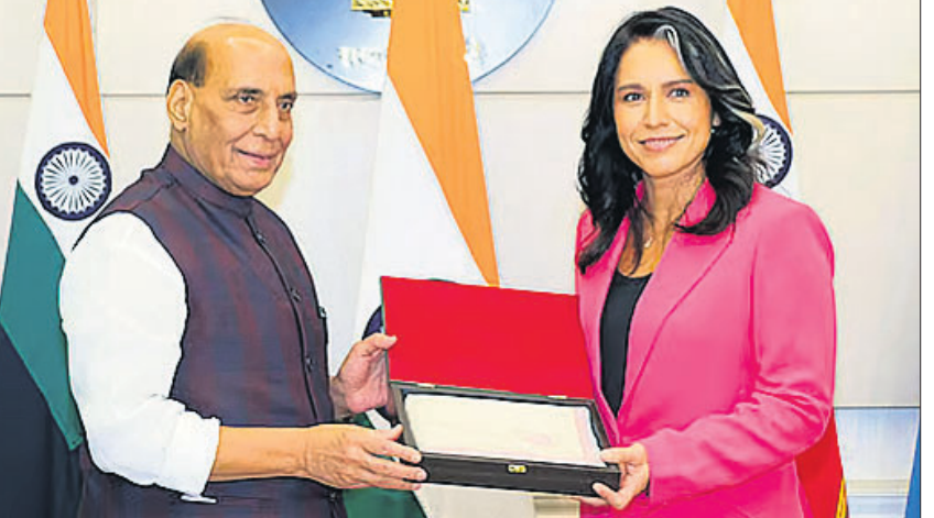
ପ୍ରତିରକ୍ଷା ମନ୍ତ୍ରୀ ରାଜନାଥ ସିଂହ ଆମେରିକା ଗୋଇୟା ମୁଖ୍ୟ ଭୂଲ୍‌ସୀ ଗାବାର୍ଡ଼ ଭେଟୁଛନ୍ତି।

ଆମେରିକା ମାଟିରେ ଖଲିସ୍ତାନୀ ଉଗ୍ରପନ୍ଥୀମାନେ ଭାରତ ବିରୋଧୀ କାର୍ଯ୍ୟରେ ସମ୍ପୂର୍ଣ୍ଣ ଥିବା ନେଇ ପ୍ରତିରକ୍ଷା ମନ୍ତ୍ରୀ ରାଜନାଥ ସିଂ ଆମେରିକା ଗୋଇୟା ମୁଖ୍ୟ ଭୂଲ୍‌ସୀ ଗାବାର୍ଡ଼ଙ୍କୁ ଜଣାଇଛନ୍ତି। ଯୋଗଦାନ ଗାବାର୍ଡ଼ଙ୍କ ସହ ବୈଠକରେ ରାଜନାଥ କହିଛନ୍ତି, ଖଲିସ୍ତାନୀ ସଂଗଠନ ଶିଖ୍ ଫର୍ କଷ୍ଟ୍‌ସ୍ (ଏସ୍‌ଏସ୍‌ଏସ୍) ଭାରତ ବିରୋଧୀ କାର୍ଯ୍ୟରେ ଲିପ୍ତ ରହିଛି। ଜାତୀୟ ସୁରକ୍ଷା ବିରୋଧରେ କାର୍ଯ୍ୟ କରୁଥିବା ଏହି ସଂଗଠନକୁ ଭାରତରେ ବେଆଇନ ଘୋଷଣା କରାଯାଇଛି। ଏକ ବିଶେଷ ଆଇନ ସଂଗଠନ ବିରୋଧରେ ଆମେରିକା ପ୍ରଶାସନ କଠୋର କାର୍ଯ୍ୟାନୁଷ୍ଠାନ ଗ୍ରହଣ କରୁ। ଆମେରିକା ଜାତୀୟ ଗୋଇୟା ନିର୍ଦ୍ଦେଶକ ଭୂଲ୍‌ସୀ ଗାବାର୍ଡ଼ ଏବଂ ରାଜନାଥଙ୍କ ମଧ୍ୟରେ ଦ୍ୱିପକ୍ଷିକ ଆଲୋଚନାରେ ପ୍ରତିରକ୍ଷା ସମ୍ପର୍କ ବଢ଼ାଇବା ଉପରେ ଗୁରୁତ୍ୱ ଦିଆଯାଇଛି। ଭାରତ-ଆମେରିକା ସହଭାଗିତାକୁ ଆହୁରି ନିବିଡ଼ କରାଇବା ପାଇଁ ବିଭିନ୍ନ ପ୍ରସଙ୍ଗରେ ଆଲୋଚନା ହୋଇଥିଲା।