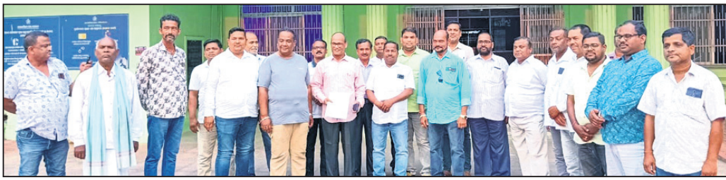
ଜିଲାପାଳଙ୍କୁ ଅଭିଯୋଗ କରିବାକୁ ଆସିଥିବା ପାଳ୍ଟର ସମ୍ପାଦକମାନେ ।