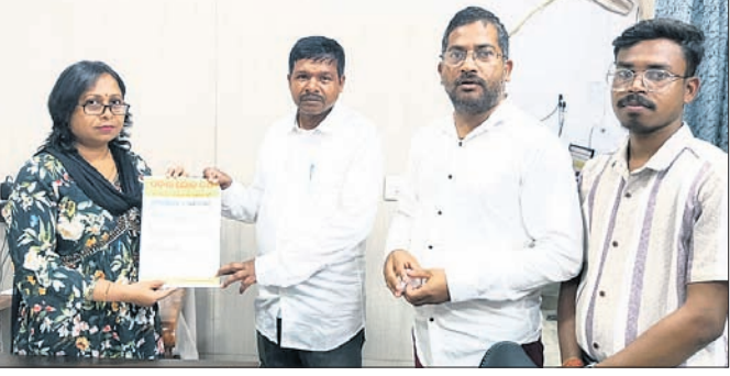
ଓଡ଼ିଶା ଲୋକ ଦଳର ପଦଯାତ୍ରା ପକ୍ଷରୁ ଏଡିଏଏସ୍ ସମ୍ମାନ ପ୍ରଦାନ ହେଉଛି ।