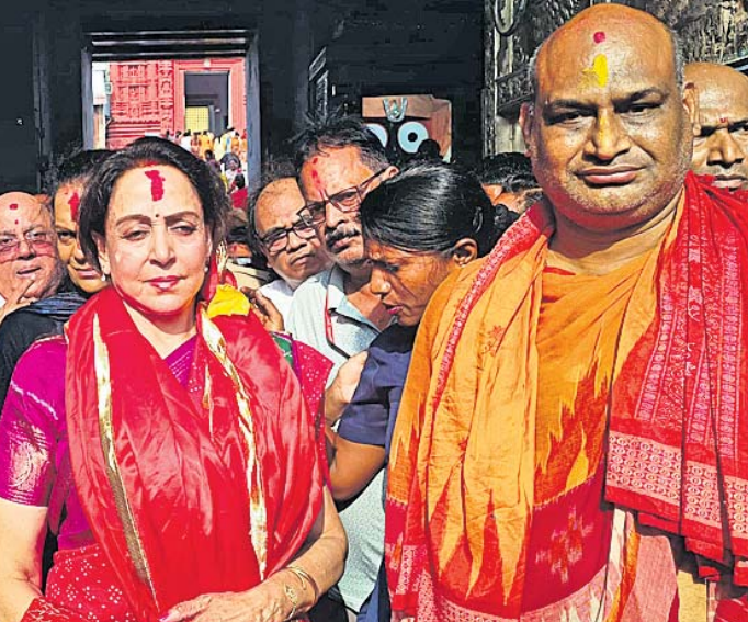
ଶ୍ରୀମନ୍ଦିରରେ ଦାରୁଦିଅଁଙ୍କ ଦର୍ଶନ କରିଥିବା ବଲିଉଡ଼ ଅଭିନେତ୍ରୀ ହେମାମାଳିନୀ।

ବିଶିଷ୍ଟ ସିନେମା ଅଭିନେତ୍ରୀ ତଥା ଉତ୍ତରପ୍ରଦେଶ ମଥୁରାର ଭାଇପା ଏମ୍ପି ହେମାମାଳିନୀ ଶନିବାର ପୁରୀ ଶ୍ରୀମନ୍ଦିରରେ ପ୍ରବେଶ କରି ଦାରୁଦିଅଁଙ୍କୁ ଦର୍ଶନ କରିବା ନେଇ ବିବାଦ ସୃଷ୍ଟି ହୋଇଛି। ହେମାମାଳିନୀ ପ୍ରସିଦ୍ଧ ଅଭିନେତ୍ରୀ ଧର୍ମେନ୍ଦ୍ର (ଧର୍ମେନ୍ଦ୍ର କେଓଲ କ୍ରିଷ୍ଣ ଦେଓଲ)ଙ୍କୁ ବିବାହ କରିବା ପାଇଁ ୧୯୭୯ ଅଗଷ୍ଟ ୨୧ରେ ସ୍ୱଇଚ୍ଛାରେ ମୁସଲମାନ ଧର୍ମକୁ ଆପଣାଇଥିଲେ। ଧର୍ମେନ୍ଦ୍ର ମଧ୍ୟ ମୁସଲମାନ ଧର୍ମ ଗ୍ରହଣ କରିଥିଲେ। ଏହାପରେ ହେମାମାଳିନୀଙ୍କ ନାମ ଆଇଶା ବି ଆର ରଜୁବର୍ଗୀ ଏବଂ ଧର୍ମେନ୍ଦ୍ରଙ୍କ ନାମ ଦିଲାୱାର ଖାନ୍ କେଓଲ କ୍ରିଷ୍ଣ ହୋଇଥିଲା। ହେମାମାଳିନୀ ଜଣେ ମୁସଲମାନ ଭାବେ ଶ୍ରୀମନ୍ଦିରରେ ପ୍ରବେଶ କରିବା ବେଆଇନ ବୋଲି ଦର୍ଶାଇ ଶ୍ରୀଜଗନ୍ନାଥ ସେନା ପକ୍ଷରୁ ସୋମବାର ପୁରୀ ସିଂହଦ୍ୱାର ଆନାରେ ଏତଲା ଦିଆଯାଇ କାର୍ଯ୍ୟାନୁଷ୍ଠାନ ଦାବି କରାଯାଇଛି। ଏନେଇ ବିଭିନ୍ନ ମହଲରୁ ପ୍ରତିକ୍ରିୟା ପ୍ରକାଶ ପାଇଛି। ଜଣେ ସୋସିଆଲ ମିଡ଼ିଆରେ ମତ ଦେଇଛନ୍ତି ଯେ, ଇନ୍ଦିରା ଗାନ୍ଧୀ ପିରୋକ କାହାଙ୍ଗାର ଘାଣ୍ଟା (ଗାନ୍ଧୀ ଭାବେ ଜଣାଶୁଣା)ଙ୍କୁ ବିବାହ କରିଥିଲେ। ପିରୋକ କଣ୍ଠେ ପାର୍ସି ଥିଲେ। ଇନ୍ଦିରା ଗାନ୍ଧୀ କିନ୍ତୁ ପାର୍ସି ଧର୍ମ ଗ୍ରହଣ କରି ନ ଥିଲେ କିମ୍ବା ନିଜ ନାମ ମଧ୍ୟ ପରିବର୍ତ୍ତନ କରି ନ ଥିଲେ। ଇନ୍ଦିରା ଗାନ୍ଧୀ ପ୍ରଧାନମନ୍ତ୍ରୀ ଥିବା ସମ୍ବେଦରେ ଶ୍ରୀମନ୍ଦିରକୁ ପ୍ରବେଶ କରି ନ ଥିଲେ। ଏବେ ହେମାମାଳିନୀଙ୍କୁ ଶ୍ରୀମନ୍ଦିରରେ ପ୍ରବେଶ ପାଇଁ ଅନୁମତି ଦିଆଯିବା ଅନ୍ୟାୟ ବୋଲି ସେ ଦର୍ଶାଇଛନ୍ତି। ଏଥିପାଇଁ ଜଗନ୍ନାଥ ସେନା ପକ୍ଷରୁ ମଧ୍ୟ ଜିଲା ପ୍ରଶାସନକୁ ଦାୟା କରାଯାଇଛି।