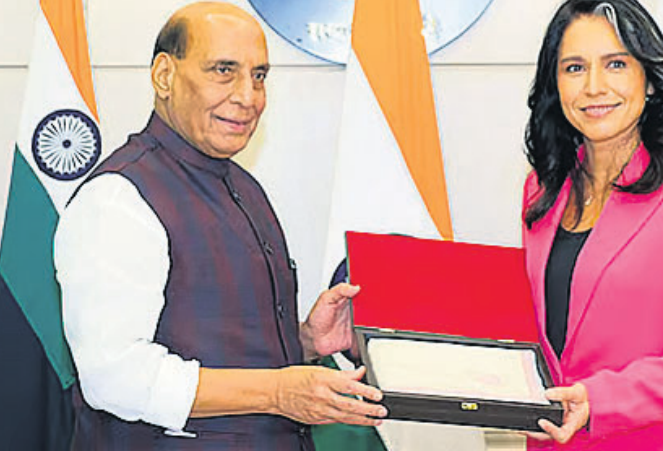
ପ୍ରତିରକ୍ଷା ମନ୍ତ୍ରୀ ରାଜନାଥ ସିଂହ ଆମେରିକା ଗୋଇୟା ମୁଖ୍ୟ ଭୂଲକ୍ଷ୍ୟା ଗାବର୍ଡ଼ଙ୍କୁ ଭେଟୁଛନ୍ତି।

ଆମେରିକା ମାଟିରେ ଖଲିସ୍ତାନୀ ଉଗ୍ରପନ୍ଥୀମାନେ ଭାରତ ବିରୋଧୀ କାର୍ଯ୍ୟରେ ସମ୍ପୂର୍ଣ୍ଣ ଥିବା ନେଇ ପ୍ରତିରକ୍ଷା ମନ୍ତ୍ରୀ ରାଜନାଥ ସିଂ ଆମେରିକା ଗୋଇୟା ମୁଖ୍ୟ ଭୂଲକ୍ଷ୍ୟା ଗାବର୍ଡ଼ଙ୍କୁ ଜଣାଇଛନ୍ତି। ଯୋଗଦାନ ଗାବର୍ଡ଼ଙ୍କ ସହ ଭେଟିଠିରେ ରାଜନାଥ କହିଛନ୍ତି, ଖଲିସ୍ତାନୀ ସଂଗଠନ ଶିଖ୍ ଫର୍ କଷ୍ଟିସ୍ (ଏସ୍‌ଏସ୍‌ଏଫ୍) ଭାରତ ବିରୋଧୀ କାର୍ଯ୍ୟରେ ଲିପ୍ତ ରହିଛି। ଜାତୀୟ ସୁରକ୍ଷା ବିରୋଧରେ କାର୍ଯ୍ୟ କରୁଥିବା ଏହି ସଂଗଠନକୁ ଭାରତରେ ବେଆଇନ ଘୋଷଣା କରାଯାଇଛି। ଏକ ବିଶେଷ ଆକ୍ରମଣ ସଂଗଠନ ବିରୋଧରେ ଆମେରିକା ପ୍ରଶାସନ କଠୋର କାର୍ଯ୍ୟାନୁଷ୍ଠାନ ଗ୍ରହଣ କରୁ। ଆମେରିକା ଜାତୀୟ ଗୋଇୟା ନିର୍ଦ୍ଦେଶକ ଭୂଲକ୍ଷ୍ୟା ଗାବର୍ଡ଼ ଏବଂ ରାଜନାଥଙ୍କ ମଧ୍ୟରେ ଦ୍ୱିପକ୍ଷୀୟ ଆଲୋଚନାରେ ପ୍ରତିରକ୍ଷା ସମ୍ପର୍କ ବଢ଼ାଇବା ଉପରେ ଗୁରୁତ୍ୱ ଦିଆଯାଇଛି। ଭାରତ-ଆମେରିକା ସହଭାଗିତାକୁ ଆହୁରି ନିବିଡ଼ କରାଇବା ପାଇଁ ବିଭିନ୍ନ ପ୍ରସଙ୍ଗରେ ଆଲୋଚନା ହୋଇଥିଲା।