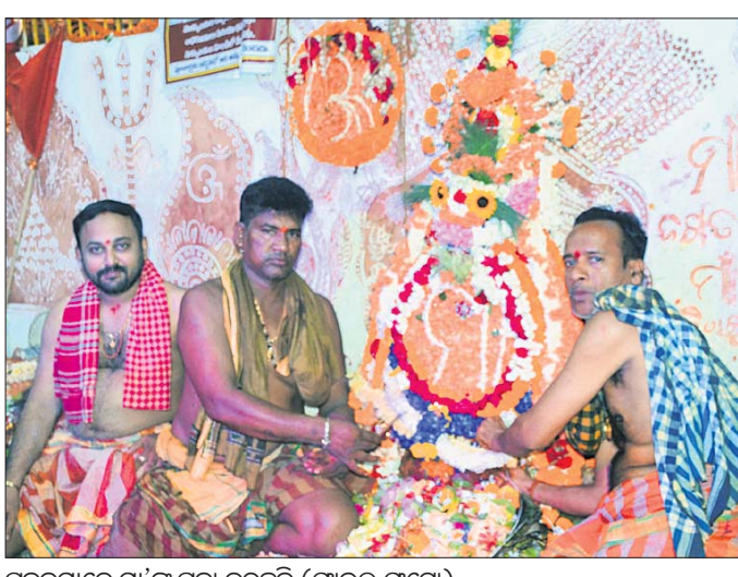
ପୂଜକମାନେ ନାଁ ଲୁ ପୂଜା କରୁଛନ୍ତି (ଫାଇଲ ଫଟୋ) ଚାଳୁଡ଼ାଟିଏ ଧରି ଗାଁ ମୁଣ୍ଡରେ ରହିଥିବା ମନ୍ଦିରକୁ ଯାଇ ପୂଜାକର୍ତ୍ତା କରୁଥିଲେ । ଏଭଳି ଭାବେ ଚୈତ୍ର ମାସ ମଙ୍ଗଳବାର ରାତ୍ରି ସମୟରେ ଦେହେରା ନିଜ ଘର ବାରଣ୍ଡାରେ ଶୋଇଥିବା ବେଳେ ଦେହେରା ଉପାଧିରେ ଭୂଷିତ କରିଥିଲେ । ଡାକର ବଂଶଧର ଆଜି ଦେଶୀ ଦେହେରା ନାମରେ ପରିଚିତ । ସେ ବଡ଼ ଠାକୁରାଣୀଙ୍କ ପରମଭକ୍ତ ଓ ପ୍ରତିଦିନ ସକାଳେ ଫୁଲ