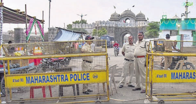
ଖୁଲବାବଦ୍ଧ ଔରଙ୍ଗଜେବଙ୍କ କବରସ୍ଥଳ ବାହାରେ ସୁରକ୍ଷା ବ୍ୟବସ୍ଥା କଡ଼ାକଡ଼ି କରାଯାଇଛି।

ଭାରତର ପ୍ରଧାନ ବିଚାରପତି ସଞ୍ଜୟ ଖାକା ଯୋଗଦାନ କଲେବାର ହାରକୋର୍ଟର ସିନିୟର ଜଜ୍ କର୍ମପାଳୀୟା ବାବୁରାଜୁ ସୁପ୍ରିମକୋର୍ଟର ବିଚାରପତି ଭାବେ ଶପଥ ଯାଠି କରାଉଛନ୍ତି। ଜଷ୍ଟିସ୍ ବାବୁରାଜୁ ଶପଥ ଯାଠି ପରେ ଏବେ ସୁପ୍ରିମକୋର୍ଟର ବିଚାରପତିଙ୍କ ସଂଖ୍ୟା ଚାରି ଗୁଣାରେ ବୃଦ୍ଧିପାଇଛି। ପ୍ରକାଶ ଯେ, ସର୍ବୋଚ୍ଚ ଅଧିକାରରେ ସର୍ବାଧିକ ଗୃହ ଜଣ ବିଚାରପତି ରହିପାରିବେ।