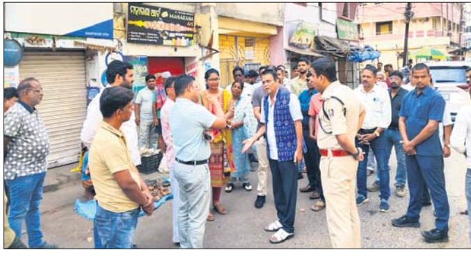
ବିଧାୟକ ଓ ପ୍ରଶାସନିକ ଅଧିକାରୀ ଛୁଟି ଅନୁଧ୍ୟାନ କରୁଛନ୍ତି ।