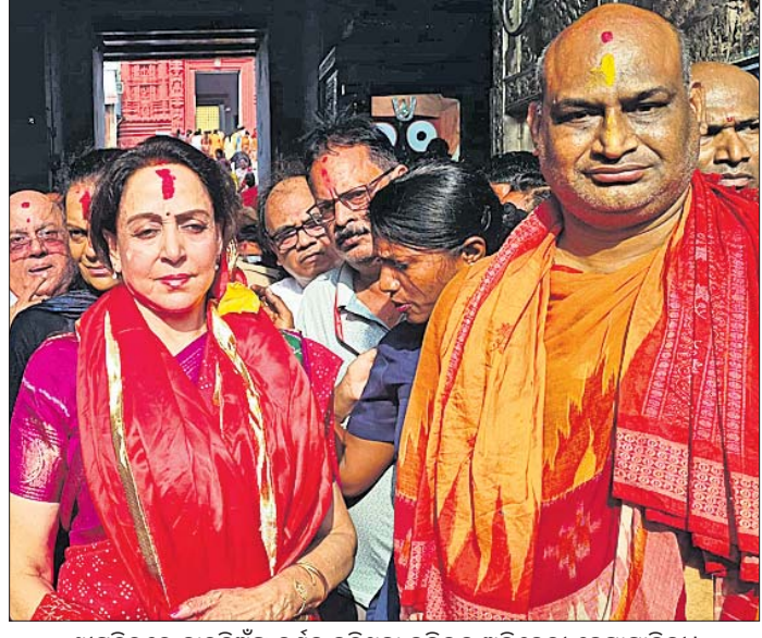
ଶ୍ରୀମନ୍ଦିରରେ ଦାରୁଦିଅଁଙ୍କ ଦର୍ଶନ କରିଥିବା ବଲିଉଡ଼ ଅଭିନେତ୍ରୀ ହେମାମାଳିନୀ।

ବିଶିଷ୍ଟ ସିନେମା ଅଭିନେତ୍ରୀ ତଥା ଉତ୍ତରପ୍ରଦେଶ ମଥୁରାର ଭାଇପା ଏମ୍ପି ହେମାମାଳିନୀ ଶନିବାର ପୁରୀ ଶ୍ରୀମନ୍ଦିରରେ ପ୍ରବେଶ କରି ଦାରୁଦିଅଁଙ୍କୁ ଦର୍ଶନ କରିବା ନେଇ ବିବାଦ ସୃଷ୍ଟି ହୋଇଛି। ହେମାମାଳିନୀ ପ୍ରସିଦ୍ଧ ଅଭିନେତ୍ରୀ ଧର୍ମେନ୍ଦ୍ର (ଧର୍ମେନ୍ଦ୍ର କେଓଲ କ୍ରିଷ୍ଣ ଦେଓଲ)ଙ୍କୁ ବିବାହ କରିବା ପାଇଁ ୧୯୭୯ ଅଗଷ୍ଟ ୨୧ରେ ସ୍ୱଇଚ୍ଛାରେ ମୁସଲମାନ ଧର୍ମକୁ ଆପଣାଇଥିଲେ। ଧର୍ମେନ୍ଦ୍ର ମଧ୍ୟ ମୁସଲମାନ ଧର୍ମ ଗ୍ରହଣ କରିଥିଲେ। ଏହାପରେ ହେମାମାଳିନୀଙ୍କ ନାମ ଆଇଶା ବି ଆର ଚକ୍ରବର୍ତ୍ତୀ ଏବଂ ଧର୍ମେନ୍ଦ୍ରଙ୍କ ନାମ ଦିଲ୍ଲୀଓର ଖାନ୍ କେଓଲ କ୍ରିଷ୍ଣ ହୋଇଥିଲା। ହେମାମାଳିନୀ ଜଣେ ମୁସଲମାନ ଭାବେ ଶ୍ରୀମନ୍ଦିରରେ ପ୍ରବେଶ କରିବା ବେଆଇନ ବୋଲି ଦର୍ଶାଇ ଶ୍ରୀଜଗନ୍ନାଥ ସେନା ପକ୍ଷରୁ ସୋମବାର ପୁରୀ ସିଂହଦ୍ୱାର ଆନରେ ଏତଲା ଦିଆଯାଇ କାର୍ଯ୍ୟାନୁଷ୍ଠାନ ଦାବି କରାଯାଇଛି। ଏନେଇ ବିଭିନ୍ନ ମହଲରୁ ପ୍ରତିକ୍ରିୟା ପ୍ରକାଶ ପାଇଛି। ଜଣେ ସୋସିଆଲ ମିଡ଼ିଆରେ ମତ ଦେଇଛନ୍ତି ଯେ, ଇନ୍ଦିରା ଗାନ୍ଧୀ ପିରୋକ କାହାଙ୍ଗାର ଘାଣ୍ଟା (ଗାନ୍ଧୀ ଭାବେ ଜଣାଶୁଣା)ଙ୍କୁ ବିବାହ କରିଥିଲେ। ପିରୋକ ଜଣେ ପାର୍ସି ଥିଲେ। ଇନ୍ଦିରା ଗାନ୍ଧୀ କିନ୍ତୁ ପାର୍ସି ଧର୍ମ ଗ୍ରହଣ କରି ନ ଥିଲେ କିମ୍ବା ନିଜ ନାମ ମଧ୍ୟ ପରିବର୍ତ୍ତନ କରି ନ ଥିଲେ। ଇନ୍ଦିରା ଗାନ୍ଧୀ ପ୍ରଧାନମନ୍ତ୍ରୀ ଥିବା ସତ୍ତ୍ୱେ ସ୍ୱଇଚ୍ଛାରେ ଶ୍ରୀମନ୍ଦିରକୁ ପ୍ରବେଶ କରି ନ ଥିଲେ। ଏବେ ହେମାମାଳିନୀଙ୍କୁ ଶ୍ରୀମନ୍ଦିରରେ ପ୍ରବେଶ ପାଇଁ ଅନୁମତି ଦିଆଯିବା ଅନ୍ୟାୟ ବୋଲି ସେ ଦର୍ଶାଇଛନ୍ତି। ଏଥିପାଇଁ ଜଗନ୍ନାଥ ସେନା ପକ୍ଷରୁ ମଧ୍ୟ ଜିଲା ପ୍ରଶାସନକୁ ଦାୟା କରାଯାଇଛି।