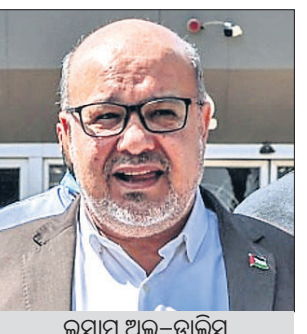
ଇସାମ୍ ଅଲ-ତାଲିସ୍ ସଦସ୍ୟମାନଙ୍କ ମୃତ୍ୟୁ ଘଟିଥିବା ହମାସ୍ ପକ୍ଷରୁ ଏକ ବିବୃତିରେ କୁହାଯାଇଛି।

ଗାଜାରେ ୨ ମାସର ଯୁଦ୍ଧବିରତି ପରେ ମଙ୍ଗଳଦିନ ଇସ୍ରାଏଲ୍ ସମାଜର ଏୟାରଫୋର୍ସର ହମାସ୍ ବଳିଷ୍ଠ ଅଧିକାରୀଙ୍କ ସମେତ ୪୧୩ ଜଣଙ୍କ ମୃତ୍ୟୁ ଘଟିଛି। ହମାସ୍ ଶୀର୍ଷ ନେତାଙ୍କ ମଧ୍ୟରେ ଗାଜାରେ ଏହାର ସରକାରୀ ମୁଖ୍ୟ ଇସାମ୍ ଅଲ-ତାଲିସ୍ ନିହତ ହୋଇଛନ୍ତି।