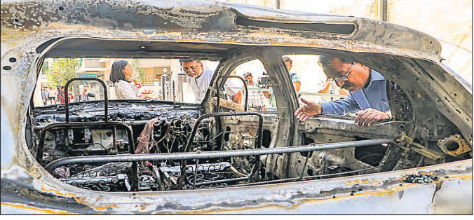
ଦଙ୍ଗାକାରୀମାନେ ସୋମବାର ପୋଡ଼ି ଦେଇଥିବା ଏକ କାରକୁ ଲୋକେ ଦେଖୁଛନ୍ତି।