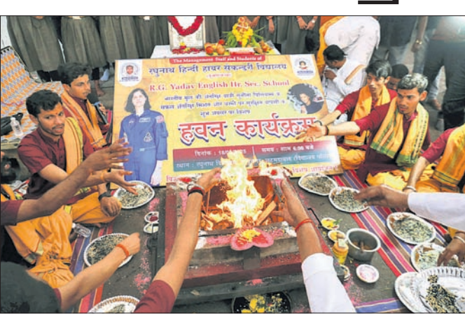
ଅନ୍ତର୍ଜାତୀୟ ମହାକାଶ କେନ୍ଦ୍ରରୁ ମହାକାଶଗଡ଼ାର ସୁନା ଫୁଲିୟୁକ୍ ନିରାପଦ ପ୍ରତ୍ୟାବର୍ତ୍ତନ କାମନା କରି ଅହମଦାବାଦର ଏକ ସ୍କୁଲରେ ମଙ୍ଗଳଦିନ ପୂଜା, ଶିଖର ଓ ଛାତ୍ରାଛାତ୍ରୀଙ୍କ ସମ୍ମାନ କରୁଛନ୍ତି।

ଫଡ଼ନବିସ୍ କହିଛନ୍ତି, ଔରଙ୍ଗଜେବ୍ କବର ହତାହତା ଦାବିରେ ବିରୋଧ ଚାଲିଥିବାବେଳେ ମୁସଲମାନଙ୍କ ପବିତ୍ର ଗ୍ରନ୍ଥ ପୋଡ଼ି ଚୁକ୍ତବରୁ ହିଂସାକାଣ୍ଡ ଘଟିଥିଲା। ଏହା ଏକ ଯୋଜନାବଦ୍ଧ ହିଂସାକାଣ୍ଡ ଭଳି ଜଣାପଡ଼ିଛି।