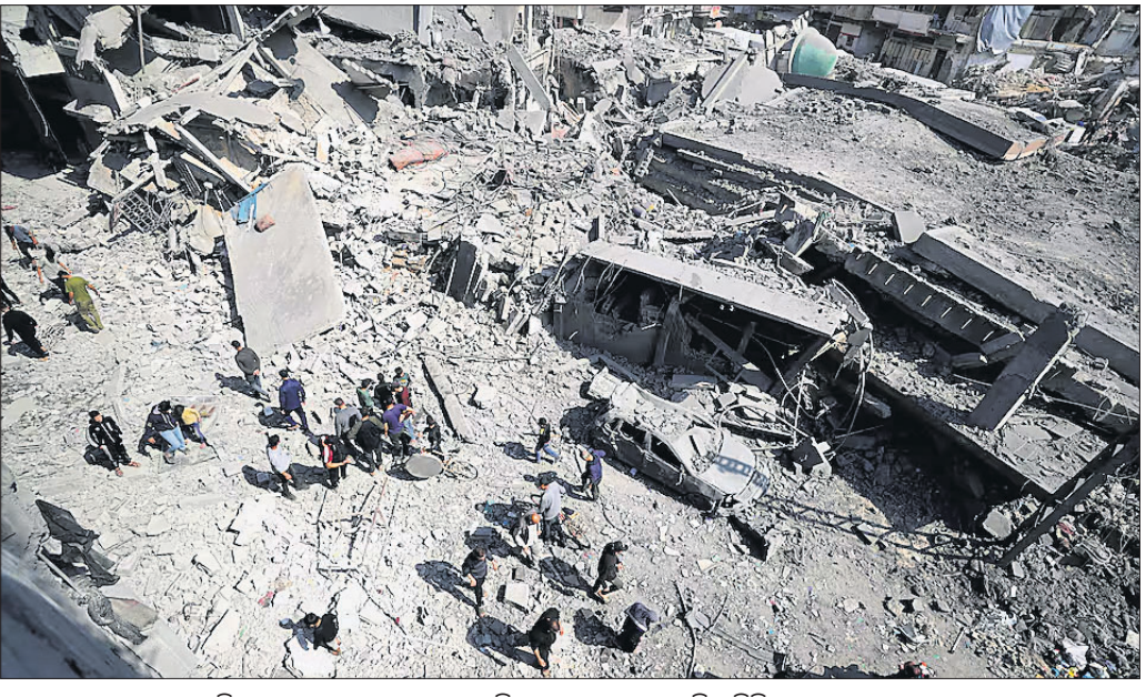
ଗାଜା ଷ୍ଟ୍ରିଟ୍ ଉତ୍ତର ଭାଗରେ ଥିବା ଜବାଲିଆଠାରେ ଏକ ଆବାସିକ ବିକ୍ରି ମଙ୍ଗଳଦିନ ଇସ୍ରାଏଲୀ ସମ୍ବରଣକର୍ତ୍ତାଙ୍କର ଧ୍ୱଂସ ହୋଇଯାଇଛି। ପାଲେଷ୍ଟିନୀୟମାନେ ଉକ୍ତ ଧ୍ୱଂସର ଫଳାଫଳ ସ୍ୱୀକାର କରିଛନ୍ତି।

ରୁପ୍ୟଣ, ଡେଣ୍ଟସ୍, ପ୍ରସାରଣକାରୀ ସଂସ୍ଥା ଉପରେ ସିସିଆଇ ଚଢ଼ାଉ