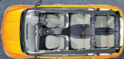
5 ଓ 7 ସିଟ୍