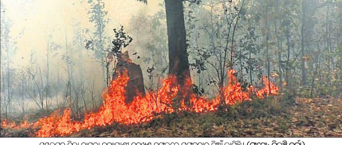
ସମୟାନୁସାରେ ଜିଲ୍ଲା ବାମନା ବନ୍ୟପ୍ରାଣୀ ବନଖଣ୍ଡ ଜଙ୍ଗଲରେ ମଙ୍ଗଳବାର ନିଆଁ ଲାଗିଛି।

ବାହିନୀ ଏବଂ ଇକୋ-ଡେଭଲପମେଣ୍ଟ କମିଟି ମାଧ୍ୟମରେ ଏହାର ସୁରକ୍ଷା ଦିଗରେ ପଦକ୍ଷେପ ନିଆଯାଉଛି। ଶିକାର ଖବର ପ୍ରାପ୍ତ ପାଇଁ ଅଧିକାରୀମାନଙ୍କୁ ସ୍ୱତନ୍ତ୍ର ଗାଡ଼ି ଏବଂ ତଥ୍ୟ ସରବରାହ ପାଇଁ ଗ୍ଲୋବାଲ ସେଟାଲ କେଣ୍ଟ୍ରାଲ ଗ୍ରାହ୍ୟକରାଯାଇଛି। ନିଷ୍ପେଷାବେଶ ବନ୍ୟଜନ୍ତୁ ପ୍ରବନ୍ଧକୁ ନେଇ ଗୋଟାଏ କାର୍ଯ୍ୟକ୍ରମ ଉପରେ ତଥ୍ୟ ସଂଗ୍ରହ କରିବା ପାଇଁ ସ୍ୱତନ୍ତ୍ର ଭାବେ ଏସ୍-ଓଡି (ଶିମିଳିପାଳ ଓଡିଆ ଲାଇଫ୍ ଇଣ୍ଟେଲିଜେନ୍ସ ନେଟୱାର୍କ) ଗଠନ କରାଯାଇଛି। ନିଆଁ ଦାଉରୁ ସୁରକ୍ଷା ପାଇଁ ଗ୍ରାହ୍ୟକରୁଥିବା ଅଗ୍ନିଶମକାରୀ ସୃଷ୍ଟି କରିବା ସହ ସ୍ୱତନ୍ତ୍ର ଅଗ୍ନି ନିର୍ବାପକ ସ୍ୱାତ୍ୱ ସୃଷ୍ଟି କରାଯାଇଛି। ଶିମିଳିପାଳରେ ବ୍ୟାଘ୍ର ସଂରକ୍ଷଣ ବୃଦ୍ଧି ଓ ସେମାନଙ୍କ ଜିନିଷ ଉନ୍ନତପାଇଁ ବାହାର ରାଜ୍ୟରୁ ବ୍ୟାଘ୍ର ସୁରକ୍ଷା ଯୋଜନା କାର୍ଯ୍ୟକାରୀ କରାଯାଇଛି ବୋଲି ଉଲ୍ଲେଖ କରାଯାଇଛି।