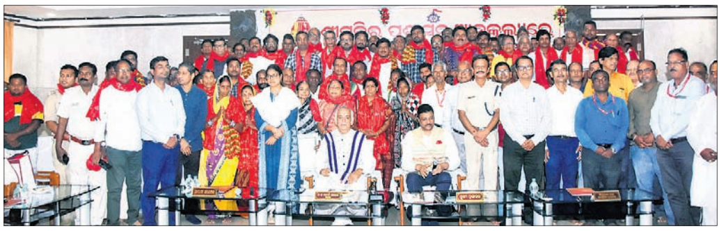
ସମ୍ବର୍ଦ୍ଧିତ ଫାସିକାଠଦାତାଙ୍କ ସହ ପୁରୀ ରାଜା ବିଦ୍ୟସିଂହ ଦେବ, ମୁଖ୍ୟ ପ୍ରଶାସକ ଡ. ଅରବିନ୍ଦ ପାଠୀ ଏବଂ ଅନ୍ୟମାନେ।

ମହାପ୍ରଭୁଙ୍କ ୧୫ ନିର୍ମାଣ ପାଇଁ ବିରଳ ଫାସିକାଠଦାତାମାନଙ୍କୁ ଶ୍ରୀମନ୍ଦିର ପ୍ରଶାସନ ପକ୍ଷରୁ ମଙ୍ଗଳବାର ସମ୍ବର୍ଦ୍ଧିତ କରାଯାଇଛି। ବଡ଼ବାଣ୍ଟସ୍ଥିତ ନାଳାଦି ଭକ୍ତନିବାସ ସମ୍ମିଳନୀ କକ୍ଷରେ ଆୟୋଜିତ ସମ୍ବର୍ଦ୍ଧନା କାର୍ଯ୍ୟକ୍ରମ ମଙ୍ଗଳବାର ଗଳ୍ପପତି ମହାରାଜ ଦିବ୍ୟସିଂହ ଦେବଙ୍କ ଅଧ୍ୟକ୍ଷତାରେ ଅନୁଷ୍ଠିତ ହୋଇଯାଇଛି। ୨୦୨୩ ଓ ୨୦୨୪ ବର୍ଷର ୮୬ ଜଣ କାଠଦାତାଙ୍କୁ ଗଳ୍ପପତି ମହାରାଜା ଏବଂ ଶ୍ରୀମନ୍ଦିର ମୁଖ୍ୟ ପ୍ରଶାସକ ଡ. ଅରବିନ୍ଦ ପାଠୀ ସମ୍ବର୍ଦ୍ଧିତ କରିଛନ୍ତି। ସମସ୍ତ ଦାତାଙ୍କୁ ମହାପ୍ରଭୁଙ୍କ ଶ୍ରୀଅଙ୍ଗଲୀଗି ଖଣ୍ଡୁଆ, ସାମପତ୍ର ଏବଂ ମହାପ୍ରଭୁଙ୍କ ସ୍ମାରକ ଆଦି ପ୍ରଦାନ କରାଯାଇଛି। ଚତୁର୍ଦ୍ଧାବିଗ୍ରହଙ୍କ ରଥ ନିର୍ମାଣରେ ବିଭିନ୍ନ କାଠର ବ୍ୟବହାର କରାଯାଇଥାଏ। ମହାପ୍ରଭୁଙ୍କ କାର୍ଯ୍ୟ ନିମନ୍ତେ ବନ ବିଭାଗ ସହ ରାଜ୍ୟର ବିଭିନ୍ନ ଅଞ୍ଚଳର ଅଧିବାସୀମାନେ ଫାସିକାଠ ଶ୍ରୀମନ୍ଦିର