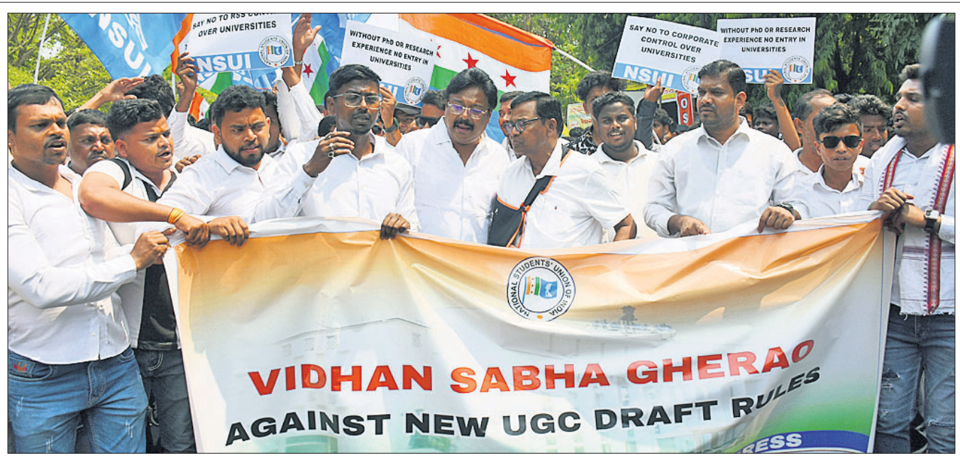
ନୂତନ ଯୁବି ଚିଠା ନିମନ୍ତକୁ ବିରୋଧ କରି ଛାତ୍ର କଂଗ୍ରେସ ପକ୍ଷରୁ ମଙ୍ଗଳବାର ଭୁବନେଶ୍ୱର ଲୋକସଭା ପିଏମ୍‌ଜିଠାରେ ବିରୋଧ।