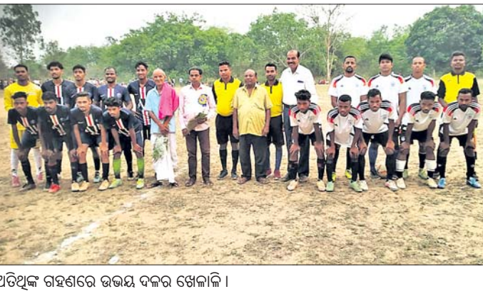
ଅଭିଯୁକ୍ତ ରଞ୍ଜଣରେ ଉଭୟ ଦଳର ଖେଳାଳି।