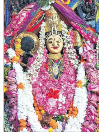
ନେତ୍ରୋତ୍ସବରେ ମା' ଶାରଳା ପାଠକୁ ଆସିଥିବା ପାଠ୍ୟାମାନେ ପ୍ରାର୍ଥନାକୁ ପାଣିତୋଳି ମା'ଙ୍କ ସମ୍ମୁଖରେ ଘଣ୍ଟ ପାଠୁଆ ନୃତ୍ୟ କରି ମାସତମାମ ମା'ଙ୍କ ମହିମା ପ୍ରଚାର କରି ବିଭିନ୍ନ ଗାଁ ପରିକ୍ରମା

ଚନ୍ଦନ ଲାଗି ହୋଇଥିଲା। ପୂର୍ଣ୍ଣପୂଜା, ବଲ୍ଲଭ ଧୂପ, ସକାଳ ଧୂପ ପରେ ସକାଳ ୫ଟା ୩୦ ମିନିଟ୍ରେ ସାହାଣମେଲା ଓ ସର୍ବସାଧାରଣ ଦର୍ଶନ ଅନୁଷ୍ଠିତ ହୋଇଥିଲା। ମଧ୍ୟାହ୍ନ ସମୟରେ ପାଳିଆ ପୂଜାପଞ୍ଚା ଏକ ପିତ୍ତଳ ଥାଳିରେ ନୂତନ ନେତ ଓ ଚକ୍ର ମାଳତୀ ସାମଗ୍ରୀ ଧରି ମନ୍ଦିରରେ ୩ ଥର ବେଦା ପଢ଼ିବା କରାଯାଇଛି। ଏହି ସମୟରେ ଘଣ୍ଟ, କାହାଳୀ, ମୁଦଙ୍ଗ ସାଙ୍ଗକୁ ଯାବଦକ ଲାଢ଼ି ଖେଳ, କାଳିଶିଳ ନୃତ୍ୟ ଓ ବିଭିନ୍ନ ରଙ୍ଗର ଅବିରରେ ମନ୍ଦିର ପରିସର ରଙ୍ଗିତ ହୋଇଥିଲା। ପୂଜାପଞ୍ଚା ବେଦା ପଢ଼ିବା କରାଯାଇ ସେବାୟତଙ୍କ ସହଯୋଗ ନେତକୁ ଦେଇଥିଲେ। ସେବାୟତମାନେ ମନ୍ଦିର ଉପରେ ଚଢ଼ି ପ୍ରଥମେ ଚୁଆ, ହଳଦିଆ ଆଦିରେ ଚକ୍ରକୁ ମାଳତୀ କରିବା ପରେ ନୂତନ ନେତ ବାହାରିଥିଲେ। ଏହାପରେ ମା'ଙ୍କ