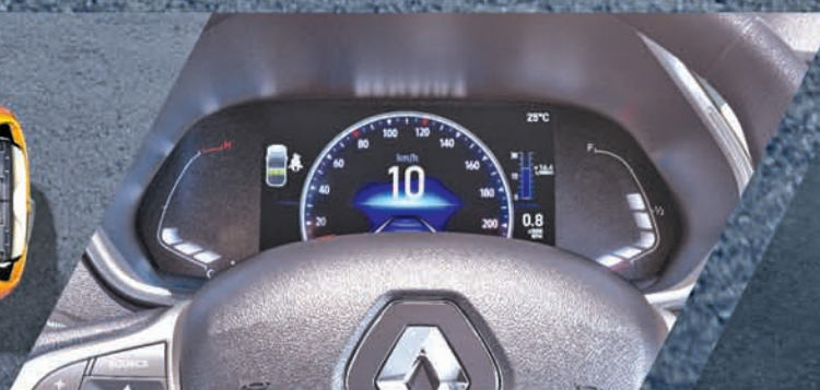
17.78 cm TFT ଇନଷ୍ଟ୍ରୁମେଣ୍ଟ କ୍ଲଷ୍ଟର୍

*The above-mentioned price of ₹6,09,995 is for the base variant (RXE) of the Triber and is exclusive of all local taxes. Renault vehicles now come with a standard warranty of 3 years or 100,000 kms, whichever is earlier. The price/features mentioned in this advertisement may vary depending on the model/variant and features in the car. Corporate / PSU / Defence personnel / government employee / professional benefits applicable on each model are basis eligibility of the customer and based on submission of required proof by the customer. Price valid on the date of purchase. For detailed terms and conditions, please visit www.renault.co.in