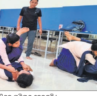
ଛାତ୍ରମାନେ ଆତ୍ମରକ୍ଷା କୌଶଳ ପ୍ରଶିକ୍ଷଣ ନେଉଛନ୍ତି ।