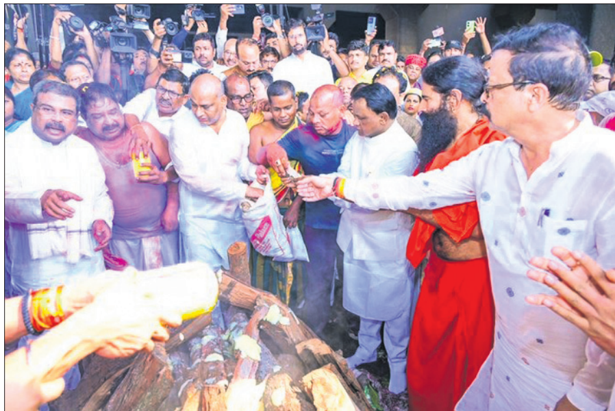
ପୁରୀ ସ୍ୱର୍ଗଦ୍ୱାରରେ ମଙ୍ଗଳବାର ପୂର୍ବତନ କେନ୍ଦ୍ରମନ୍ତ୍ରୀ ଡା. ଦେବେନ୍ଦ୍ର ପ୍ରଧାନଙ୍କୁ ଦେଖିବାକୁ ଶେଷକୃତ୍ୟ ସମ୍ପନ୍ନ ହେବା ପରେ ମର ଶରୀରକୁ ଭୁବନେଶ୍ୱର ଆଣାଯାଇଥିଲା।