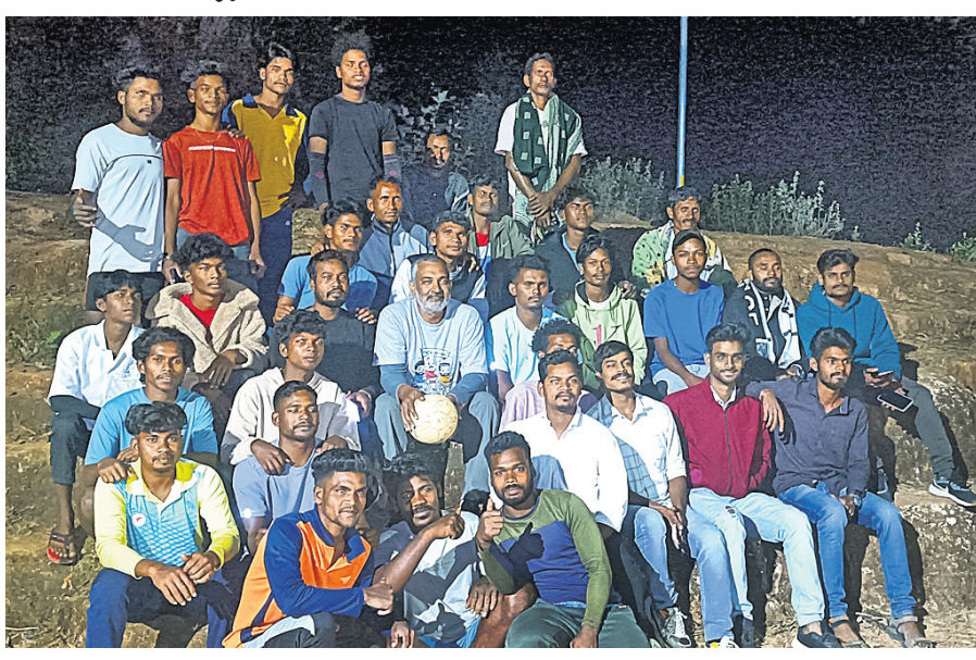
ସ୍ଥାନୀୟ ଯୁବକଙ୍କ ସହ ନିର୍ଦ୍ଦେଶକ ରାଜାମୌଳୀ।

ଭଲିବଲ ଖେଳିଥିଲେ। ଏହାର ଉଦ୍ଦେଶ୍ୟ ଥିଲା ଯୁବକମାନଙ୍କ ମଧ୍ୟରେ ଖେଳର ମନୋହାର ସୃଷ୍ଟି କରିବା ଏବଂ ସ୍ୱାସ୍ଥ୍ୟକେନ୍ଦ୍ରରେ ଖେଳର ମନୋହାର ସୃଷ୍ଟି କରିବା। ଏହା ଓଡ଼ିଶା ସରକାରଙ୍କ ଦ୍ୱାରା ଆୟୋଜିତ ଏକ ପ୍ରତିଯୋଗିତା ପ୍ରସଙ୍ଗରେ ଥିଲା।