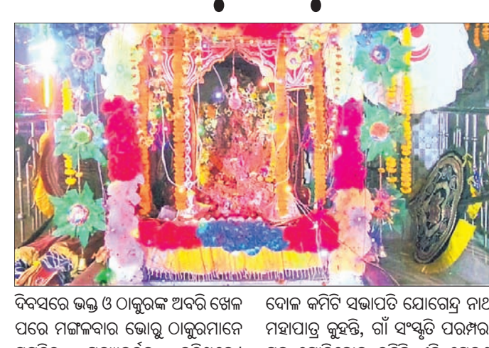
ଦିବସରେ ଭକ୍ତ ଓ ଠାକୁରଙ୍କ ଅଭିଷେକ ପରେ ମଙ୍ଗଳବାର ଭୋରୁ ଠାକୁରମାନେ ସ୍ୱମିର ପ୍ରତ୍ୟାବର୍ତ୍ତନ କରିଥିଲେ।