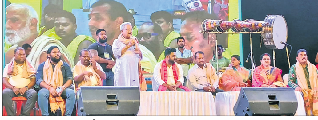
ମହୋତ୍ସବର ଉଦ୍ଘାଟନା ଉତ୍ସବରେ ପୂର୍ବତନ ବିଧାୟକ ରୁଦ୍ର ପ୍ରତାପ ମହାରଥୀଙ୍କ ସହ ଅନ୍ୟ ଅତିଥିମାନେ।