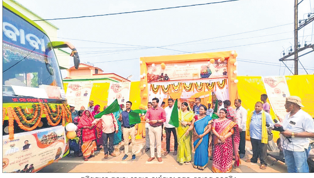
ଅଭିଯୁକ୍ତମାନେ ପତାକା ଦେଖାଇ ତୀର୍ଥଯାତ୍ରା ବସ୍ତର ଶୁଭାରମ୍ଭ କରୁଛନ୍ତି।