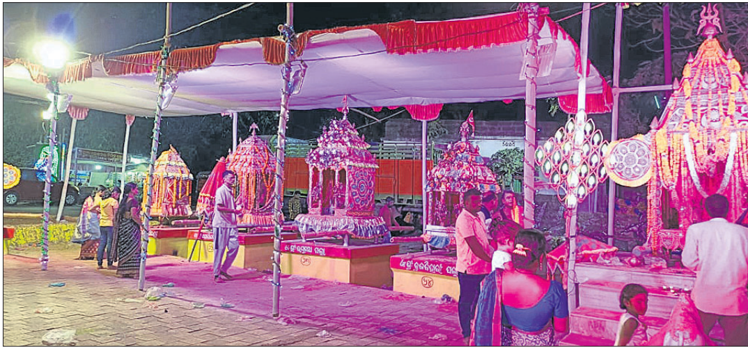
ମେଳଣ ପଡ଼ିଆରେ ଏକାଠି ହୋଇଥିବା ବିଭିନ୍ନ ଗ୍ରାମର ଠାକୁର ।

ଖୋର୍ଦ୍ଧା ଜିଲାର ସହରଠାରୁ ଗ୍ରାମାଞ୍ଚଳ ପର୍ଯ୍ୟନ୍ତ ସବୁଠି ଆନନ୍ଦ ଭରଣୀ ସହ ଆରମ୍ଭ ହୋଇଛି ଦୋଳ ମେଳଣ । ଏହି କ୍ରମରେ ଖୋର୍ଦ୍ଧା ସହରର ଶ୍ରୀଲୋକେଶ୍ୱରଙ୍କ ଦୋଳ ମେଳଣ ଆଡ଼ମ୍ବରରେ ପାଳନ ହୋଇଥାଏ । ହୋଲି ପରଦିନଠାରୁ ଗଦିନବ୍ୟାପୀ ମେଳଣ ଉତ୍ସବ ଆୟୋଜନ ହୋଇଥାଏ । ଚଳିତବର୍ଷ ୬୪ ଗ୍ରାମର ଠାକୁର ଏଠାରେ ଏକତ୍ରିତ ହୋଇଛନ୍ତି । ଦୋଳ ମେଳଣରେ ଅନ୍ୟ ଠାକୁରଙ୍କ ମଧ୍ୟରେ ଲକ୍ଷ୍ମୀ ନାରାୟଣ-ରାଧାକାନ୍ତ-ମଦନମୋହନ-ଗୋପୀନାଥ ଭାଲିଆବାତି, ବାଲୁକେଶ୍ୱର ପାନବରଜ, ଆଖଣ୍ଡଳମଣି-ଶ୍ରୀଗଣେଶ ପଲ୍ଲୀହାଟ, ମଦନମୋହନ ଲୋକେଶ୍ୱରପୁର, ବ୍ରଜସିଦ୍ଧାରା ପଲ୍ଲୀ, ଗୋପୀନାଥ ଦେବ-ମଦନମୋହନ ବଳେଇପୁର, ରାଜେଶ୍ୱର-ଗୋପୀନାଥ ଭାଲିଆବାତି, ମଦନମୋହନ ବରପାଠ, ରଘୁନାଥ ଦେବ କଟିପୁର, ରାଧାକୃଷ୍ଣ ପାଟପୁର (ଗୋପପୁରୀ), ଆଖଣ୍ଡଳେଶ୍ୱର ସିଆଲିଆପାଟଣା, ରାଧାକୃଷ୍ଣ ପାଟପୁର, ବାଲୁକେଶ୍ୱର-ଶ୍ରୀଜଗନ୍ନାଥ-ଭାଗବତ ବାସୁଦେବ ଜେମାଦେଇ, ରାଧାକୃଷ୍ଣ ବଞ୍ଚାପୁର, ପଣ୍ଡିକେଶ୍ୱର ପାଟପୁର, ମାଳକେଶ୍ୱର-ରାଧାକାନ୍ତ-ରାଧାମୋହନ ଦୁର୍ଗାପୁର, ନୀଳକଣ୍ଠେଶ୍ୱର ଛତିସପୁର, ଦକ୍ଷେଶ୍ୱର ମଙ୍ଗଳାନଗର ରାଧାଗୋବିନ୍ଦ-ପତିତପାବନ ଗୁରୁଜଙ୍ଗ (ଗଙ୍ଗାସାହି),