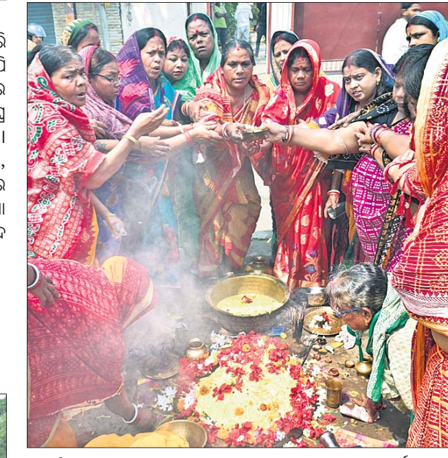
ଚିତ୍ତ ମାସ ପ୍ରଥମ ମଙ୍ଗଳଦାୟୀରେ କଟକ ଶେଷବଜାର ରାସ୍ତାପାର୍ଶ୍ଵରେ ମହିଳାମାନେ ପୂର୍ବାର୍ଚ୍ଚନା କରୁଛନ୍ତି।