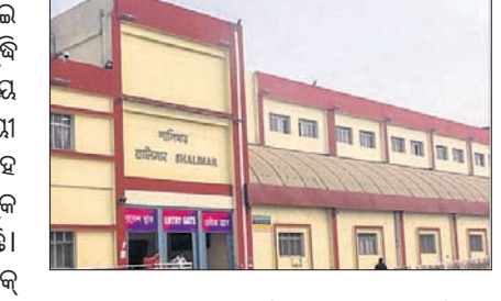
ଭୁବନେଶ୍ୱର, ୧୮ମାର୍ଚ୍ଚ (ଅଭିମତ ପାଠକ)

ଦକ୍ଷିଣ-ପୂର୍ବ ରେଳପଥ ମଧ୍ୟରେ ଶାଳିମାର ରେଳଷ୍ଟେଶନ ଏକ ପ୍ରମୁଖ ଷ୍ଟେଶନ ହୋଇଥିବା ବେଳେ ଦୂରଗାମୀ ଟ୍ରେନ୍‌ର ଏହା ଏକ ଗୁରୁତ୍ୱପୂର୍ଣ୍ଣ ହବ୍ । ଏହି ଷ୍ଟେଶନ ବିଶେଷକରି କୋଲକାତାରୁ ଦେଶର ଅନ୍ୟାନ୍ୟ ଗୁରୁତ୍ୱପୂର୍ଣ୍ଣ ଅଞ୍ଚଳକୁ ସଂଯୋଗ କରୁଛି । ଉକ୍ତ ଷ୍ଟେଶନ ପୂର୍ବରୁ ଗୁଡ଼ିଏ ଚର୍ମିନାଲ ଭାବେ ନିର୍ମାଣ ହୋଇଥିବାବେଳେ ପରବର୍ତ୍ତୀ