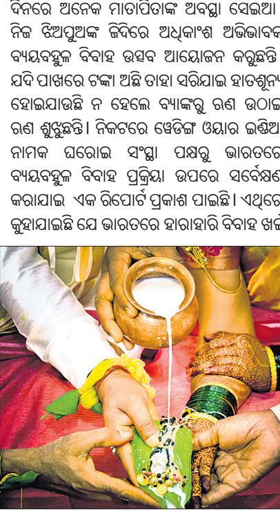
ବିଗତ ତିନି ଦଶନ୍ଧିରେ ଦଶ ଖର୍ଚ୍ଚ ବଢ଼ିଛି। ସେହି ଅନୁପାତରେ ଅନ୍ୟାନ୍ୟ ଖର୍ଚ୍ଚ ବଢ଼ିଛି। ସମାଜରେ ଲୋକଙ୍କ ଖୁସି ବା ମର୍ଯ୍ୟାଦା ବଢ଼ିଲା। ପଦ ମର୍ଯ୍ୟାଦା, ଧନ, କ୍ଷମତା ଓ ନିଜର ସର୍ବାଙ୍ଗୀନ ପ୍ରଗତି ପ୍ରଦର୍ଶନ ପାଇଁ ବିବାହ ଉତ୍ସବ କ୍ରମେ ଶ୍ରେଷ୍ଠ ମାଧ୍ୟମ ହେଲା। ସମ୍ପ୍ରତି ବିବାହ ଉତ୍ସବ ଆୟୋଜନ ପାଇଁ ଲୋକଙ୍କ ଉପରେ ସାଂସ୍କୃତିକ ଚାପ ବୃଦ୍ଧି ହେଉଛି। ଏହି ଚାପକୁ ମୁଣ୍ଡିବା ପାଇଁ ସେମାନେ ବ୍ୟୟବହୁଳ ଉତ୍ସବ ଆୟୋଜନ କରିବାକୁ ବାଧ୍ୟ ହେଉଛନ୍ତି। ଏହି ଚାପ ବୃଦ୍ଧି ହେଉଛି ସିନେମା, ଟିଭି ସିରିଏଲ ଓ ଇନ୍‌ଷ୍ଟାଗ୍ରାମ୍ ଭଳି କିଛି ସାଂସ୍କୃତିକ ମିଡ଼ିଆ ଅନୁସରଣ ଯୋଗୁଁ ବିବାହ ଉତ୍ସବକୁ କିପରି ଅଧିକ ବ୍ୟୟ ବହୁଳ କରାଯିବ, ସେସବୁର ଉପାୟ ଆମର ସିନେମା, ଟିଭି ସିରିଏଲ ଓ ଇନ୍‌ଷ୍ଟାଗ୍ରାମ୍ ଆଦିରେ ଉପଲବ୍ଧ। ଆମ ମୁଁ ବୋଧେ ଏହା ଦ୍ୱାରା ଅଧିକ ପ୍ରଭାବିତ ଓ ସେହିମାନଙ୍କ ଚାପ ଆଗରେ ଅଭିଭାବକମାନେ ବାକ ଶୁଣିବ। ଜୀବନରେ ବିବାହ ଥରେ କରାଯିବ। ତେଣୁ ତାହାକୁ ସ୍ମରଣୀୟ କରିବା ପାଇଁ ପର୍ଯ୍ୟାୟ ଅର୍ଥ ବ୍ୟୟ କରାଯିବାକୁ ପ୍ରୟାସ ହେଉଛି। ଭାରତୀୟ ବିବାହ ସଂସ୍କୃତି ପରମ୍ପରାରେ ବିଦେଶୀ ସଂସ୍କୃତି ଧସିଲେ ପଶିଗଲାଣି ଯାହାପାଇଁ ଖର୍ଚ୍ଚ ବୃଦ୍ଧି। ସିନେମା ବା ଟିଭି ସିରିଏଲ ଆଧାରରେ ତିନି ସେମିନିଠାକୁ ରିସେପ୍‌ସନ ପର୍ଯ୍ୟନ୍ତ ସବୁ କିଛି ସାଧ୍ୟତା ପାଇଁ ଇଭେଣ୍ଟ ମ୍ୟାନେଜମେଣ୍ଟବାଲା