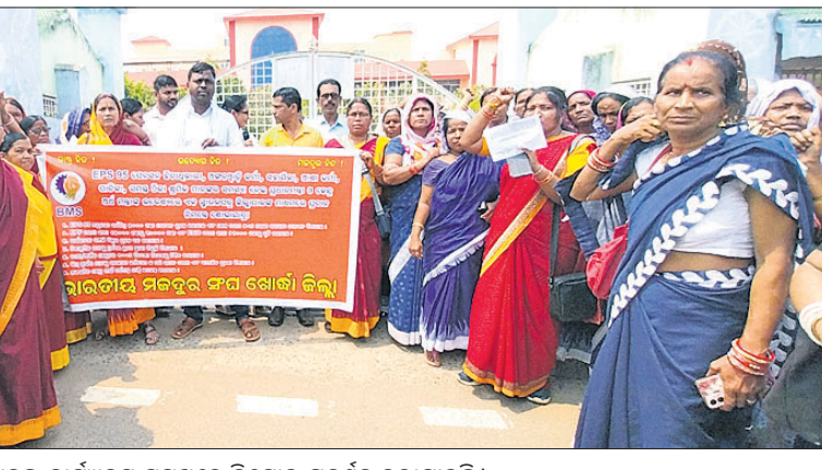
ଜିଲାପାଳଙ୍କ କାର୍ଯ୍ୟାଳୟ ସମ୍ମୁଖରେ ବିରୋଧ ପ୍ରଦର୍ଶନ କରାଯାଇଛି ।

ଖୋର୍ଦ୍ଧା, ୧୮ମାର୍ଚ୍ଚ (ପ୍ରଭାତ ପାଣିଗ୍ରାହୀ) ଭାରତୀୟ ମଜଦୁର ସଂଘ (ବିଏମ୍‌ଏସ୍) ଖୋର୍ଦ୍ଧା ଜିଲା ଆନୁକୂଲ୍ୟରେ ମଙ୍ଗଳବାର ଶତାଧିକ ଅଜ୍ଞାନତ୍ରୀ କର୍ମୀ ଏବଂ ସାହାଯିକା ୭ଦର୍ପା ଦାବିରେ ଜିଲାପାଳଙ୍କ କାର୍ଯ୍ୟାଳୟ ଘେରାଉ କରିଥିଲେ । କେନ୍ଦ୍ର ଅର୍ଥମନ୍ତ୍ରୀଙ୍କ ଉଦ୍ଦେଶ୍ୟରେ ଜିଲାପାଳଙ୍କୁ ଦାବିପତ୍ର ପ୍ରଦାନ କରିଛନ୍ତି । ଦୁଆ ବସ୍ତାଖଣ୍ଡଠାରୁ ଏକ ଶୋଭାଯାତ୍ରାରେ ବାହାରି ଜିଲାପାଳଙ୍କ କାର୍ଯ୍ୟାଳୟ ଆଗରେ ପହଞ୍ଚି ବିରୋଧ କରିଥିଲେ । ଇତିସବୁ ୯୫ ଅନୁଯାୟୀ