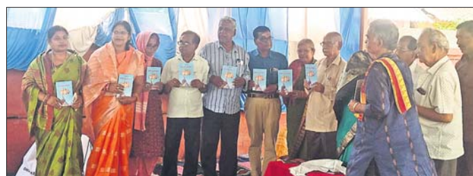
ଅତିଥିମାନେ ପୁସ୍ତକା ଉନ୍ମୋଚନ କରୁଛନ୍ତି ।