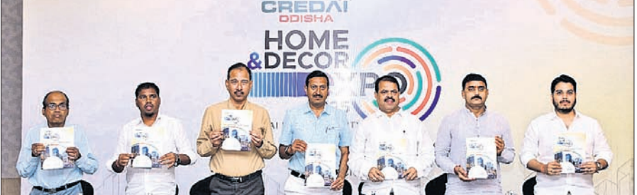
'ହୋମ୍ ଆଣ୍ଡ ଡେକୋର ଏକ୍ସପୋ'ର ପୋଷ୍ଟରକୁ କ୍ରେଡାଲ ଓଡ଼ିଶାର କର୍ମଚାରୀମାନେ ଉନ୍ମୋଚନ କରୁଛନ୍ତି।

କ୍ରେଡାଲ ଓଡ଼ିଶା ପକ୍ଷରୁ ୧୦ ଦିନିଆ ପ୍ରଦର୍ଶନୀ