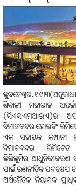
ଭୁବନେଶ୍ୱର, ୧୯୩ (ଅନୁରାଧା ମହାରଣା): ଛତ୍ରପତି ଶିବାଜୀ ମହାରାଜ ଅନ୍ତର୍ଜାତୀୟ ବିମାନବନ୍ଦର (ସିଏସ୍‌ଏମ୍‌ଆଇଏ)ର ଅପରେଟର, ଆଦାନା ବିମାନବନ୍ଦର ହୋଇଥିବା ଲିମିଟେଡ୍ (ଏଏସ୍‌ଏଲ୍)ର ଏକ ସହାୟକ କମ୍ପାନୀ ମୁମ୍ବାଇ ଅନ୍ତର୍ଜାତୀୟ ବିମାନବନ୍ଦର ଲିମିଟେଡ୍ (ଏଏଆଇଏଏଲ୍) ଭିଭିଭୁମି ଆଧୁନିକୀକରଣ ତଥା ଯାତ୍ରାକ ସୁବିଧା ପାଇଁ ରଣନୀତିକ ପଦକ୍ଷେପ ନେଉଛି। ବିମାନ ବନ୍ଦର ଅର୍ଥନୈତିକ ନିୟାମକ ପ୍ରାଧିକରଣ (ଏଇଆରଏ)

ସମ୍ପୂର୍ଣ୍ଣରେ ଦିଆଯାଇଥିବା ପ୍ରସ୍ତାବରେ ଏମ୍‌ଆଇଏଏଲ୍ ଘରୋଇ ଯାତ୍ରାକ ପାଇଁ ୩୨୫ ଟଙ୍କା ଏବଂ ଅନ୍ତର୍ଜାତୀୟ ଯାତ୍ରାକ ପାଇଁ ୬୫୦ ଟଙ୍କା ମୂଲ୍ୟର ଯୁକ୍ତ ବିଭାଜନ ପ୍ରଦାନ କରିବେ। ଏହାଛଡା ଏମ୍‌ଆଇଏଏଲ୍ ମୁମ୍ବାଇ ବିମାନବନ୍ଦରରେ ଭିଭିଭୁମି ବିକାଶ ପ୍ରକଳ୍ପର ଉନ୍ନତ ପ୍ରକଳ୍ପ ଗ୍ରହଣ କରିପାରିବ। ଏମ୍‌ଆଇଏଏଲ୍ ପ୍ରସ୍ତାବ ୨୫ ପରିବର୍ଦ୍ଧନ ପାଇଁ କ୍ଷତିପୂରଣ ଦେବାକୁ ଚେଷ୍ଟା କରେ ଏବଂ ଯାତ୍ରୀମାନଙ୍କ ଉପରେ ଏହାର ପ୍ରଭାବକୁ କମ କରିଥାଏ। ଏଇଆରଏରେ ଦାଖଲ ହୋଇଥିବା ପ୍ରସ୍ତାବଟି ଖୁବ୍‌ଶୀଘ୍ର ପ୍ରାୟ ୩୩୨ ଟଙ୍କାକୁ ସଂଶୋଧନ କରିବାକୁ ଲକ୍ଷ୍ୟ ରଖି, ଯାହା ୧୮% ବୃଦ୍ଧିକୁ ଦର୍ଶାଉଛି, ଯାହା ମାର୍ଚ୍ଚ ୧୦ରେ ଏଇଆରଏ ଦ୍ୱାରା ଭାବି କରାଯାଇଥିବା ମାର୍ଗଦର୍ଶନୀ ଅନୁଯାୟୀ ଅଟେ।