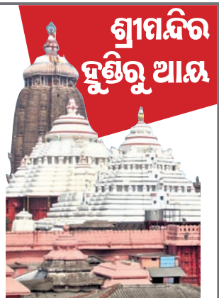
ଶ୍ରୀମନ୍ଦିର ସ୍ୱର୍ଣ୍ଣ ଆୟ ୧୯୩୩୨୦୨୪ ୪,୭୭,୯୩୪ ଟଙ୍କା ସୁନା ମିଳନାହିଁ ରୁପା ୪୨ ଗ୍ରାମ୍

ପୁରୀ, ୧୯୩୩(ଅଜିତ କୁମାର ମହାନ୍ତି) ଗତବର୍ଷ ନବେନ୍ଦ୍ର ପୁଷ୍ପାରେ ମହାପ୍ରଭୁଙ୍କ ଭଜନ ସମୟରେ ବାଣ ବିଫଳତା ଘଟି ୧୭କୋଟି ଟଙ୍କା ନଷ୍ଟ ହୋଇଥିଲା । ଏହି ଘଟଣା ରାଜ୍ୟରେ ଆଲୋଚନା ସୃଷ୍ଟି କରିଥିଲା । ପୁରୀବାସୀଙ୍କ ମନକୁ ଏହି ଘଟଣା ଲିଭି ନ ଥିବାବେଳେ ଚଳିତମାସ ୧୫ ତାରିଖ ହୋଇ ଅବସରରେ ନବେନ୍ଦ୍ର ପୁଷ୍ପାରେ ପରିସରରେ ମହାପ୍ରଭୁଙ୍କ ନୀତି ଅବସରରେ ପୁଣି ବାଣ ଫୁଟାଇଲେ । ତେବେ କିଏ ବାଣ ଫୁଟାଇଲେ ଏବଂ ଏଥିପାଇଁ ପ୍ରଶ୍ନାସନର ଅନୁମତି ମିଳିଥିଲା କି ନାହିଁ ସେ ନେଇ ପ୍ରଶ୍ନାସନ ପାଖରେ ସୂଚନା ନାହିଁ । ପୂର୍ବରୁ ଅଧିକାରୀ ସହ ଜନସାଧାରଣ ଚେତି ନ ଥିବାବେଳେ ପ୍ରଶ୍ନାସନ ସଜାଜ ନ ରହିବା ନେଇ ସାଧାରଣରେ ଅସନ୍ତୋଷ ପ୍ରକାଶ ପାଇଛି । ପ୍ରଶ୍ନାସନର ଦାୟିତ୍ୱାନ୍ୱୟତା ଯୋଗୁ ଏଭଳି ଘଟଣା ପୁନର୍ବାର ଘଟିଥିବା ଅଭିଯୋଗ ହେଉଛି ।