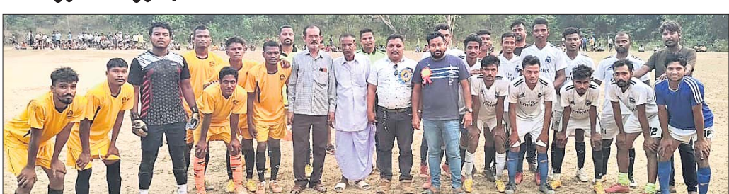
ଅତିଥିକ ଗହଣରେ ଉଭୟ ଦଳର ଖେଳାଳି ।

ବାପୁଜୀ ପୁସ୍ତକ ଆସୋସିଏସନ, ଶଙ୍ଖାମେରୀ ଆନୁକୁଲ୍ୟରେ ସ୍ଥାନୀୟ ଖେଳ ପଡିଆରେ ଚାଲିଥିବା ରାଜ୍ୟସ୍ତରୀୟ ବାପୁଜୀ କପ୍ ପୁସ୍ତକ ରୁଧିରା ଦଳରୁ ବିଦ୍ୟ ଖେଳ ହୋଇଥିଲା ।