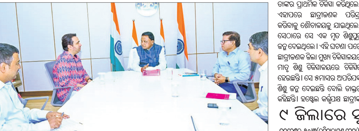
ଲୋକସେବା ଭବନଠାରେ ଗୁରୁବାର ମୁଖ୍ୟମନ୍ତ୍ରୀ ମୋହନ ଚରଣ ମାଝୀଙ୍କୁ କେନ୍ଦ୍ର ଦକ୍ଷତା ବିକାଶ ଓ ଔଦ୍ୟୋଗିକତା ତଥା ଶିକ୍ଷା ରାଷ୍ଟ୍ରମନ୍ତ୍ରୀ ଜୟନ୍ତ ଚୌଧୁରୀ ଆଦିଙ୍କ ସମେତ ଉପସ୍ଥିତରେ ଏହି ଅବସରରେ ଆଲୋଚନା କରିଥିଲେ।