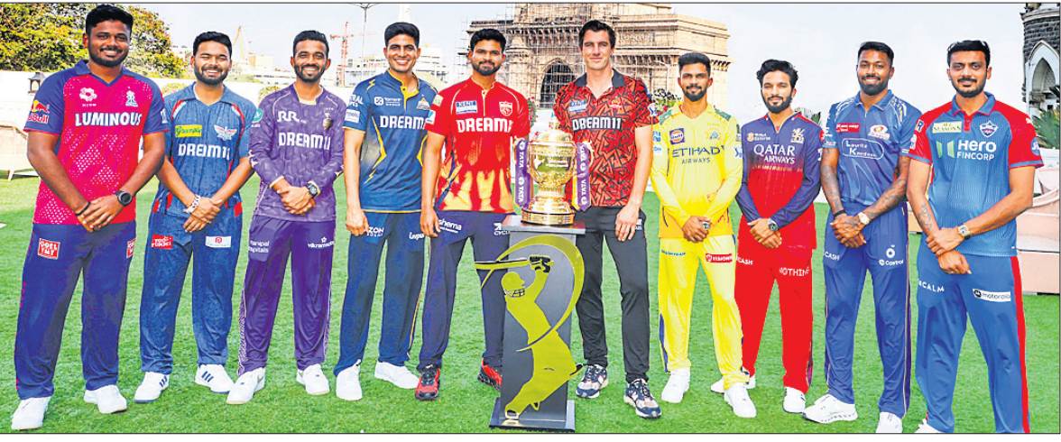
ଆଇପିଏଲ୍ କ୍ୟାପ୍ଟେନ୍ ମିଚ୍ ଅବସରରେ ଟ୍ରଫି ସହ ସମସ୍ତ ଦଳର ଅଧିନାୟକ ।

ନୂଆଦିଲ୍ଲୀ, ୨୦୩୩(ପି.ଟି.): ଆସନ୍ତା ୨୨ ତାରିଖରୁ ଆରମ୍ଭ ହେବାକୁ ଯାଉଥିବା ଆଇପିଏଲ୍‌ରେ ଖେଳାଳିମାନେ ବଲ୍‌ରେ ଛେପ ପ୍ରୟୋଗ କରିପାରିବେ । ଭାରତୀୟ କ୍ରିକେଟ କଣ୍ଟ୍ରୋଲ ବୋର୍ଡ (ବିସିଆଇ) ଗୁରୁବାର ବଲ୍‌ରେ ଛେପ ବ୍ୟବହାର କରିବା ଉପରେ ଲାଗିଥିବା ପ୍ରତିବନ୍ଧକକୁ ହଟାଇ ଦେଇଛି । ମୁମ୍ବାଇରେ ଆଜି ଅନୁଷ୍ଠିତ କ୍ୟାପ୍ଟେନ୍ ମିଚ୍‌ରେ ପ୍ରାୟତଃ ଦଳର ଅଧିନାୟକ ଏକମତ ହେବା ପରେ ଏହି ନିଷ୍ପତ୍ତି ନିଆଯାଇଛି । ଦୀର୍ଘ ବର୍ଷ ଧରି ଚାଲିଆସୁଥିବା ବଲ୍‌ରେ ଛେପ ପ୍ରୟୋଗ କରିବାର ଅଭ୍ୟାସ ଉପରେ ଅନ୍ତର୍ଜାତୀୟ କ୍ରିକେଟ ପରିଷଦ (ଆଇସିସି) କୋଭିଡ୍-୧୯ ମହାମାରୀ ବେଳେ ସତର୍କତାମୂଳକ ପଦକ୍ଷେପ ଗ୍ରହଣ କରିଥିଲା । ୨୦୨୨ରେ ଆଇସିସି ଏହି ପ୍ରତିବନ୍ଧକକୁ ଚିରସ୍ଥାୟୀ କରିଥିଲା । ପରେ ଆଇସିସିର ଏହି ପ୍ରତିବନ୍ଧକକୁ ଆଇପିଏଲ୍‌ରେ ଦେଇ କଣ୍ଠସନରେ ସାମିଲ କରାଯାଇଥିଲା ।