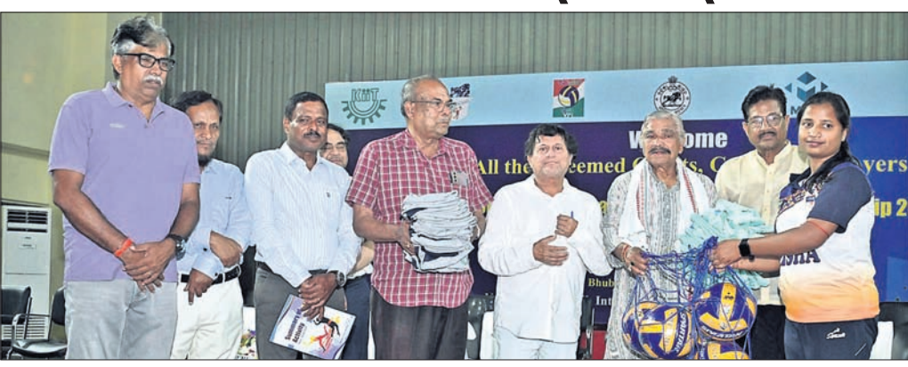
ଉଦ୍‌ଘାଟନା ଅବସରରେ ଉପସ୍ଥିତ ଅତିଥିଗଣ।

ଓଡ଼ିଶା ଭଲିବଲ ଆସୋସିଏସନ (ଓଭିଏ) ଓ କିର୍ ବିଶ୍ୱବିଦ୍ୟାଳୟର ମିଳିତ ଆୟତ୍ତରେ ରାଜ୍ୟ ଭଲିବଲ ଚାମ୍ପିୟନଶିପ୍ ଗୁରୁବାର ବିଜୁ ପଟ୍ଟନାୟକ ଇନ୍‌ଡୋର ସ୍ଥାପନାରେ ଉଦ୍‌ଘାଟିତ ହୋଇଛି।