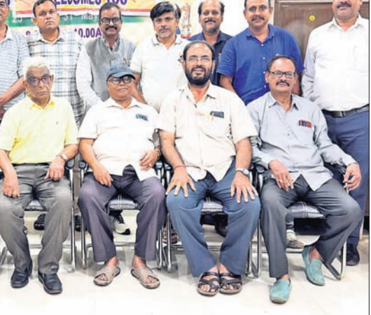
କଟକ ଜିଲା ଚେଷ୍ଟ ସଂଘ ନିର୍ବାଚନ କଟକ ଜିଲା ଚେଷ୍ଟ ଆସୋସିଏସନର ନବ ନିର୍ବାଚିତ କର୍ମକର୍ତ୍ତା।

କଟକ ଜିଲା ଚେଷ୍ଟ ଆସୋସିଏସନର ନୂତନ କର୍ମକର୍ତ୍ତା ନିର୍ବାଚନ ବାରବାଟୀ ସ୍ଥାପନାସମିତି କାର୍ଯ୍ୟାଳୟରେ ଅନୁଷ୍ଠିତ ହୋଇଥିଲା।