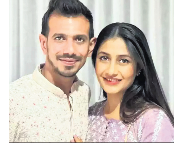
୨୦୨୨ ଜୁନଠାରୁ ଅଲଗା ରହୁଛନ୍ତି। ଚଳିତବର୍ଷ ଫେବୃଆରୀ ୫ ତାରିଖରେ ସେମାନେ ବିବାହ ବିଚ୍ଛେଦ କରିଥିଲେ।