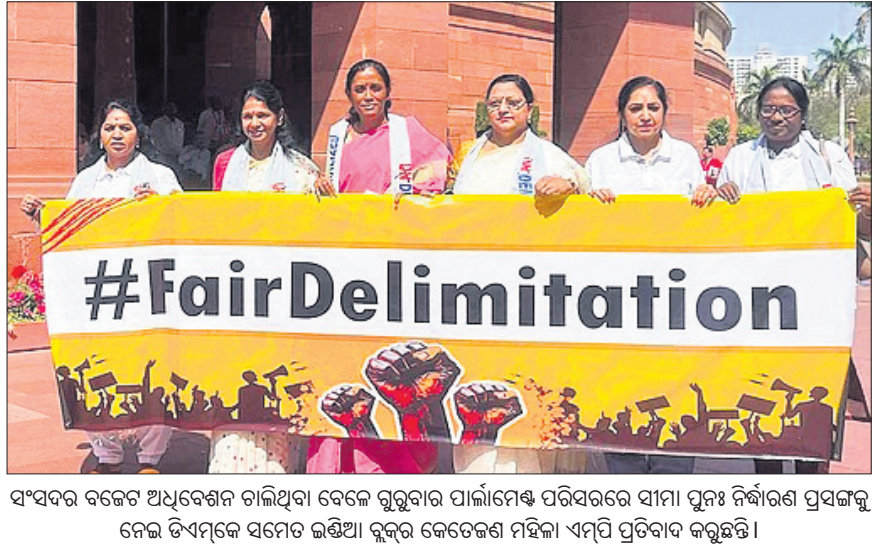
ସଂସଦ ବଚେତ ଅଧିବେଶନ ଚାଲିଥିବା ବେଳେ ଗୁରୁବାର ପାଇଁ ମେଣ୍ଟ ପରିସରରେ ସାମା ସୁନଃ ନିର୍ଦ୍ଧାରଣ ପ୍ରସଙ୍ଗକୁ ନେଇ ଡିଏମ୍‌ଏକ୍ ସମେତ ଲକ୍ଷ୍ମଣା ବୁଦ୍ଧର କେତେକ ମହିଳା ଏମ୍ପି ପ୍ରତିବାଦ କରୁଛନ୍ତି।