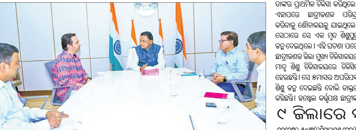
ଲୋକସେବା ଭବନଠାରେ ଗୁରୁବାର ମୁଖ୍ୟମନ୍ତ୍ରୀ ମୋହନ ଚରଣ ମାଝୀଙ୍କୁ କେନ୍ଦ୍ର ଦକ୍ଷତା ବିକାଶ ଓ ଔଦ୍ୟୋଗିକତା ତଥା ଶିକ୍ଷା ରାଷ୍ଟ୍ରମନ୍ତ୍ରୀ ଜୟନ୍ତ ଚୌଧୁରୀ ଆଦିଙ୍କ ସମେତ ଉପସ୍ଥିତରେ ଏହି ଅବସରରେ ଆଲୋଚନା କରିଥିଲେ।