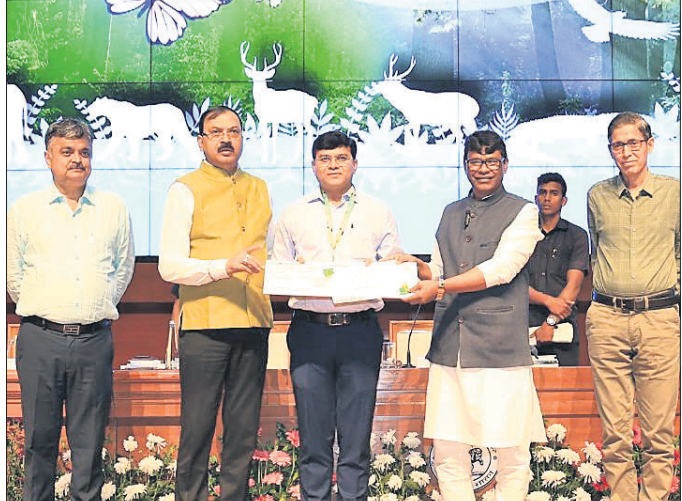
ରାଉରକେଲା ବନଖଣ୍ଡ ଅଧିକାରୀଙ୍କୁ ସମର୍ପିତ କରାଯାଇଛି ।

ରାଉରକେଲା, ୨୧ମାର୍ଚ୍ଚ (ବିପ୍ଳବ ରଞ୍ଜନ ଦାଶ/ଦିନେଶ ମିଶ୍ର) ବିଶ୍ୱ ବନ ଦିବସ ପାଳନ ଅବସରରେ ପ୍ରଦାନ କରିବା, ବନଖଣ୍ଡ ପୁରସ୍କୃତ ପ୍ରଦାନ କରାଯାଇଛି ।