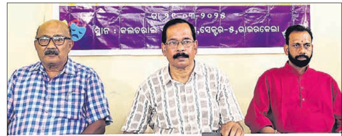
ଖବରଦାତା ସମ୍ମାନରେ ସୂଚନା ପ୍ରଦାନ କରାଯାଇଛି ।

ରାଉରକେଲା, ୨୧ମାର୍ଚ୍ଚ (ସଙ୍ଗୀତା ଜେନା) ବିଶ୍ୱନାଟ୍ୟ ଦିବସ ପର୍ବଦିନରେ ୧୭ତମ ଜାତୀୟ ନାଟକ ମହୋତ୍ସବ-୨୦୨୪ ମାର୍ଚ୍ଚ ୨୩ରୁ ସେକ୍ଟର-୧୯ ବିଭିନ୍ନ ସେକ୍ଟରରେ ଆୟୋଜନ ହେବ ।