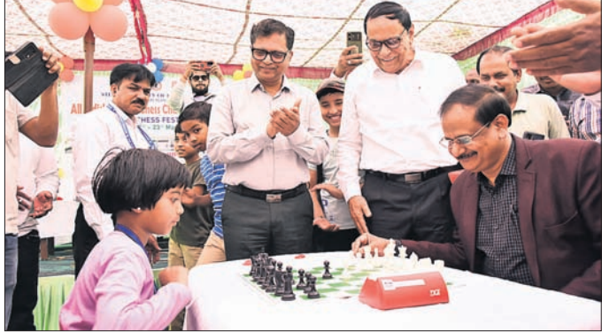
ଆରମ୍ଭ ହୋଇଥିବା ଚେସ୍ ଚାମ୍ପିୟନଶିପ୍ ଦୃଶ୍ୟ ।

ରାଉରକେଲା, ୨୧ମାର୍ଚ୍ଚ (ବିପ୍ଳବ ରଞ୍ଜନ ଦାଶ) ଅଲ୍ ଓଡ଼ିଶା ଚେସ୍ ଆୟୋଜିତ ଚେସ୍ ଚାମ୍ପିୟନଶିପ୍ ଆରମ୍ଭ ହେବା ପାଇଁ ରାଉରକେଲା ଓପନ ଏବଂ କ୍ଲବ୍ ଲେଭେଲ୍ ଉପରେ ପ୍ରତିଯୋଗିତା ଆରମ୍ଭ ହେବ ।