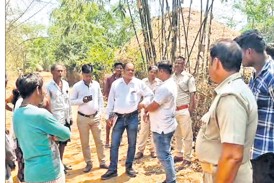
ସୀମାନ୍ତ ଗାଁ ଶରଣାସାହିରେ ଓଡ଼ିଶା ରାଜସ୍ୱ ବିଭାଗ ପକ୍ଷରୁ କାର୍ଯ୍ୟ ବନ୍ଦ କରାଯାଇଛି।

ଭୋଗରାଇ, ୨୧ମାର୍ଚ୍ଚ (ପ୍ରଦୀପ ଦାସ) ପୁଣି ସୀମା ଲଂଘିଲା ପଶୁମବଳୀ ବାଲେଶ୍ୱର ଜିଲ୍ଲା ଭୋଗରାଇ ବ୍ଲକ୍ କମିଟି ଥାନା ଅଧୀନ ସୀମାନ୍ତ ଗାଁ ଶରଣାସାହି ଶାନ୍ତ ନିକଟ କଂକ୍ରିଟ୍ ରାସ୍ତାକୁ ଗୁରୁବାର ଜବରଦସ୍ତ ପଶୁମବଳୀ ରାଜସ୍ୱ ବିଭାଗ ଭାଙ୍ଗି ନିଜ ଅଧୀନକୁ ନେବାକୁ ଉଦ୍ୟମ କରିଛି। ଏଭଳି ଘଟଣାରେ ସୀମାନ୍ତ ସହର ପଶୁମବଳୀ ରାଜସ୍ୱ ବିଭାଗକୁ କାର୍ଯ୍ୟବନ୍ଧ ପାଇଁ ନିର୍ଦ୍ଦେଶ ଦେଇଛନ୍ତି। ଭୋଗରାଇ ବିଧାନସଭା ବିଧାନସଭା ସଭାରେ ସହବାକିପୁର ଗ୍ରାମକୁ ପଶୁମବଳୀ କୌଶଳ ଭାବେ ଅକ୍ତିଆର ପାଇଁ ଉଦ୍ୟମ କରୁଥିବା ବେଳେ ସୀମାନ୍ତରାଜ୍ୟ ଗର୍ଜନ ପରେ ପଶୁମବଳୀ ପ୍ରଶାସନ ଛତ୍ରଭଙ୍ଗ ଦେଇଥିଲେ। ସୀମାନ୍ତରେ ଅବ୍ୟାଧିକାରୀ ସୀମା ସମସ୍ୟାର ସମାଧାନ ନ ହେବାକୁ ଓଡ଼ିଶା କେଡିଆ ଭଳି ଏବେ ସୀମା ସମସ୍ୟା ଜଟିଳ ହେବାକୁ ଲାଗିଛି। ପଶୁମବଳୀର ଦାବୀଗିରିକୁ ପ୍ରତିହତ କରି ଭୋଗରାଇ ବିଧାନସଭା ସୀମାନ୍ତ ବାସୀଙ୍କୁ କାଗ୍ରତ ରହିବାକୁ ଆହ୍ୱାନ ଦେଇଛନ୍ତି।