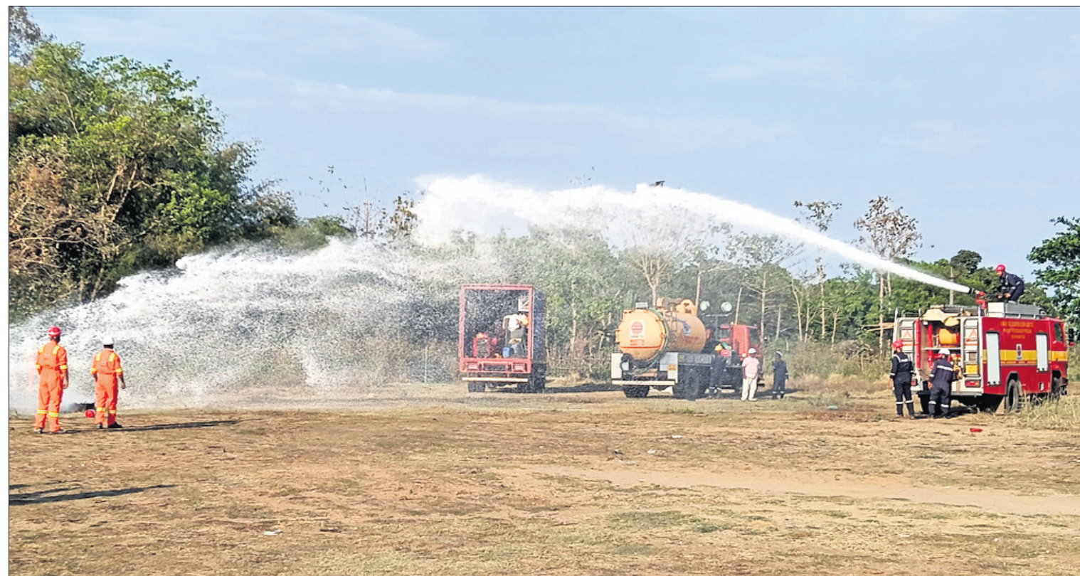
ନୟାଗଡ଼ ଜିଲ୍ଲା ଓଡ଼ିଶା ବୃକ୍ଷ ଶରଣାପୁର ପଞ୍ଚାୟତ ଆମରାପୁର ଖେଳପଡ଼ିଆରେ ଶୁକ୍ରବାର ଲକ୍ଷ୍ମୀ ଆନନ୍ଦ କର୍ପୋରେଶନ ଲିମିଟେଡ (ଆଇଓସିଏଲ) ବ୍ରହ୍ମପୁର ଦକ୍ଷିଣ-ପୂର୍ବ କ୍ଷେତ୍ରୀୟ ଭୂମି ପାଇଁ ଲାଜପତ ନିରାପତ୍ତା ଏବଂ ସୁରକ୍ଷା ସମ୍ପନ୍ନ ଗ୍ରାମ୍ୟ ସଚେତନତା କାର୍ଯ୍ୟକ୍ରମ।