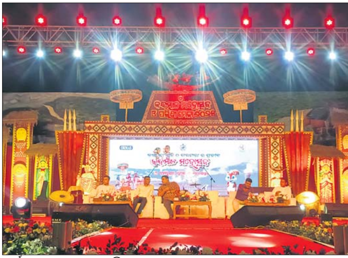
କର୍ମମାଳା ମହୋତ୍ସବରେ ପଞ୍ଚାୟାଥୀ ଅତିଥି

କର୍ମମାଳ ଷ୍ଟାଡ଼ିୟମରେ କର୍ମମାଳ ମହୋତ୍ସବ ଓ ପଲ୍ଲିଶ୍ରୀ ମେଳା ଶୁକ୍ରବାର ଉଦ୍‌ଘାଟିତ ହୋଇଯାଇଛି । ଏଥିରେ