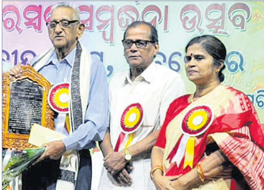
ଓଡ଼ିଶା ସାହିତ୍ୟ ଏକାଡେମୀର ସର୍ବୋଚ୍ଚ ସମ୍ମାନ ଅତିବଡ଼ି ଜଗନ୍ନାଥ ଦାସ ପୁରସ୍କାର ଗ୍ରହଣ।