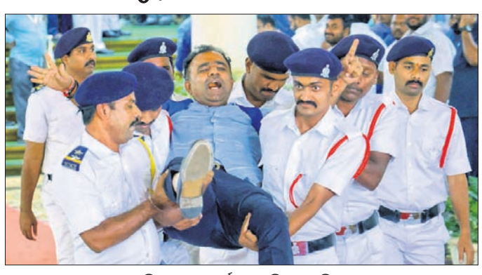
ବିଧାୟକଙ୍କୁ ମାର୍ଗାଳ ଚେକିନେଇଛନ୍ତି।

ବେଙ୍ଗାଳୁରୁ, ୨୧ମାର୍ଚ୍ଚ କର୍ମାଟକ ବିଧାନସଭାରେ ଶୁକ୍ରବାର ଗୃହ କାର୍ଯ୍ୟରେ ବିଶ୍ୱଜ୍ଞାଣୀ ସୃଷ୍ଟି କରିବା ଅଭିଯୋଗରେ ୧୮ ଜଣ ଭାଜପା ବିଧାୟକଙ୍କୁ ବାହାର କରାଗଲା।