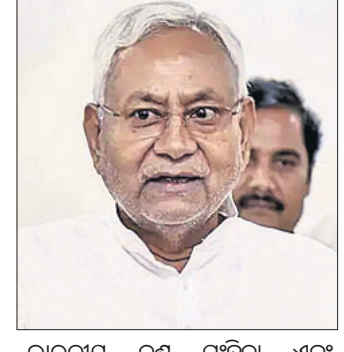
ଭାରତୀୟ ଦଣ୍ଡ ସଂହିତା ଏବଂ ଜାତୀୟ ସମ୍ମାନକୁ ଅପମାନ ପ୍ରତିକାର ଆଇନର ଧାରା ଅନୁଯାୟୀ ପୋଲିସ୍ ମୁଖ୍ୟ ବିଚାରବିଭାଗୀୟ ମାଜିଷ୍ଟ୍ରେଟ୍ (ଫ୍ରେଣ୍ଡ୍)ଙ୍କ ଅଦାଲତରେ ଦାଏର ପିଟିଶନରେ ମୁଖ୍ୟମନ୍ତ୍ରୀଙ୍କ ବିରୋଧରେ

ପାଟଣାରେ ଅନୁଷ୍ଠିତ ଏକ ସରକାରୀ କାର୍ଯ୍ୟକ୍ରମରେ ଜାତୀୟ ସଙ୍ଗୀତକୁ ଅସମ୍ମାନ କରାଯିବା ଅଭିଯୋଗରେ ବିହାର ମୁଖ୍ୟମନ୍ତ୍ରୀ ନୀତୀଶ କୁମାରଙ୍କ ବିରୋଧରେ ଶୁକ୍ରବାର ଅଦାଲତରେ ପିଟିଶନ ଦାଏର ହୋଇଛି।