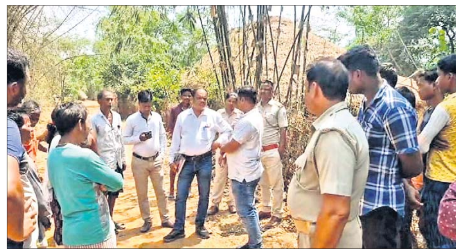
ସୀମା ଗାଁ ଶଗଡ଼ାସାହିରେ ଓଡ଼ିଶା ରାଜ୍ୟ ବିଭାଗ ପକ୍ଷରୁ କାର୍ଯ୍ୟ ବନ୍ଦ କରାଯାଇଛି।

ଓଡ଼ିଶା ରାସ୍ତାକୁ ଭାଙ୍ଗିଲା, ସୀମାରେ ଉତ୍ତେଜନା