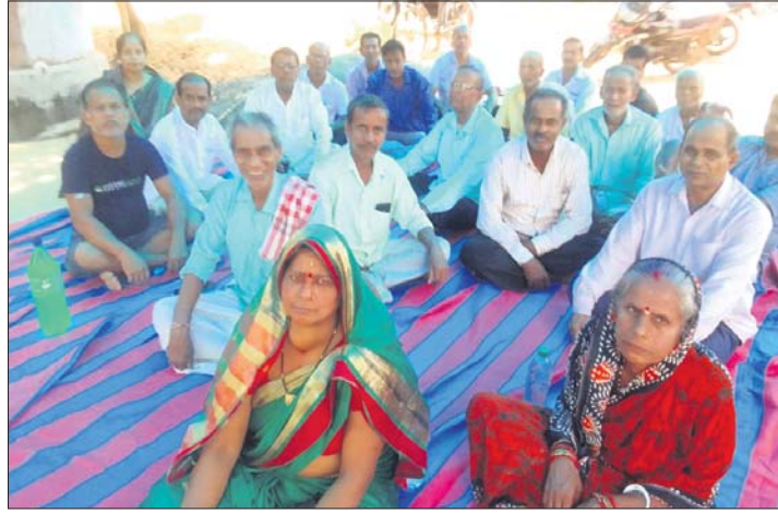
ଗୋବିନ୍ଦପୁର ସେବା ସମିତି ସମ୍ମୁଖରେ ଚାଷୀମାନଙ୍କର ଧାରଣା।

୧୧୭୭ଜଣଙ୍କର ଧାନ କିଣା ହୋଇଛି । ଆହୁରି ୨୪୧ଜଣ ଚାଷୀ ଧାନ ବିକ୍ରୟକୁ ଚାହୁଁ ରହିଛନ୍ତି । ଯୋଗାଣ ବିଭାଗ ତରଫରୁ ଗାର୍ଭେଷ୍ଟ ଆସୁ ନ ଥିବାରୁ ଚଳିଥିବା ୭୦ଟି ଚାଷୀଙ୍କ ଧାନ ଧରି ନିଆଯାଇନାହିଁ।