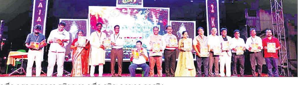
ଗଜଜ୍ୟୋତି ଉତ୍ସବ ଅବସରରେ ଅତିଥିମାନେ ବାର୍ଷିକ ପତ୍ରିକା ଉନ୍ମୋଚନ କରୁଛନ୍ତି।

ବାଲେଶ୍ୱର ଜିଲ୍ଲା ବାହାନଗା ବ୍ଲକ ଗୋପାଳପୁରଠାରେ ଥିବା ସେଷ୍ଟିଆନ ଯୁନିଭର୍ସିଟିର ଗଜଜ୍ୟୋତି-୨୦୨୪ ବାର୍ଷିକ ଉତ୍ସବ ଅନୁଷ୍ଠିତ ହୋଇଯାଇଛି।