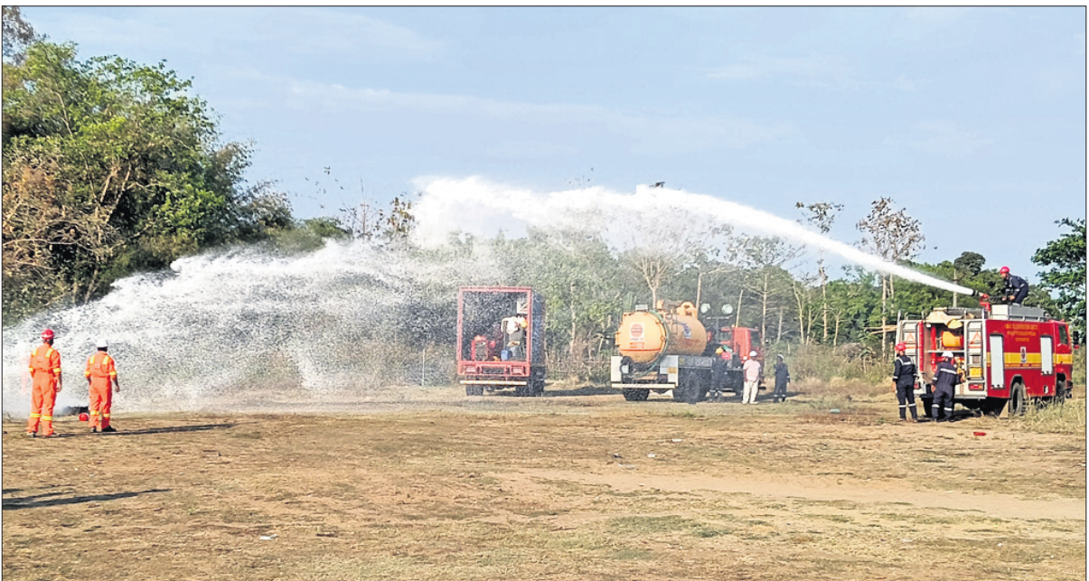
ନୟାଗଡ଼ ଜିଲ୍ଲା ଓଡ଼ିଶା ରାଜ୍ୟ ସଡ଼କ ନୀତି ଅନୁଯାୟୀ ପଞ୍ଚାୟତ ଆୟତ୍ତରେ ଖେଳପଡ଼ିଆରେ ଶୁକ୍ରବାର ଇଣ୍ଡିଆନ ଅଏଲ କର୍ପୋରେଶନ ଲିମିଟେଡ (ଆଇଓଏଏଲ) ବ୍ରହ୍ମପୁର ଦଳିଶ-ପୂର୍ବ ଖେଳପଡ଼ିଆ ଉପକ ପାଇପ ଲାଇନର ନିର୍ବାହଣ ଏବଂ ପୁରୁଣା ସମସ୍ତ ଗ୍ରାମ୍ୟ ସଡ଼କର ଉନ୍ନତି କାର୍ଯ୍ୟକ୍ରମ।