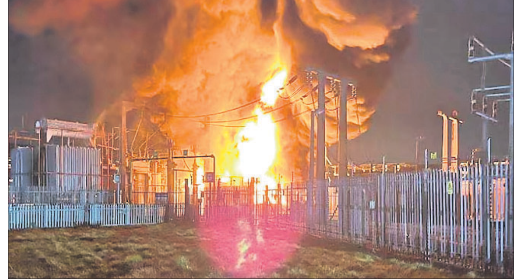
ବିମାନବନ୍ଦର ନିକଟ ବିଦ୍ୟୁତ୍ ସଂକ୍ଷେପନରେ ଲାଗିଥିବା ନିଆଁ।

ବିଶ୍ୱର ଅନ୍ୟତମ ସର୍ବାଧିକ ବ୍ୟସ୍ତବହୁଳ ବିମାନବନ୍ଦର ଭାବେ ପରିଚିତ ଲଣ୍ଡନର ହିଥୋ ଏୟାରପୋର୍ଟ ନିକଟରେ ଥିବା ଏକ ବିଦ୍ୟୁତ୍ ସଂକ୍ଷେପନରେ ବଡ଼ ଧରଣର ଅଗ୍ନିକାଣ୍ଡ ଘଟିଛି।